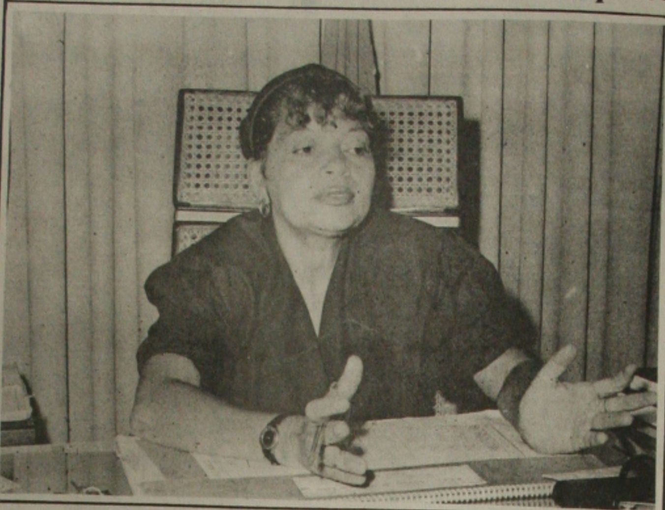
Helofsa explica atuação da Sunab contra abusos de preços.

O IPCR foi o índice que foi criado pelo Governo Federal para medir a inflação em real. Segundo alguns advogados, o IPCR deve substituir o IGP-M, apenas nos imóveis prontos para morar. No caso de imóveis em construção pode se usar qualquer índice, desde que o reajuste seja anual.