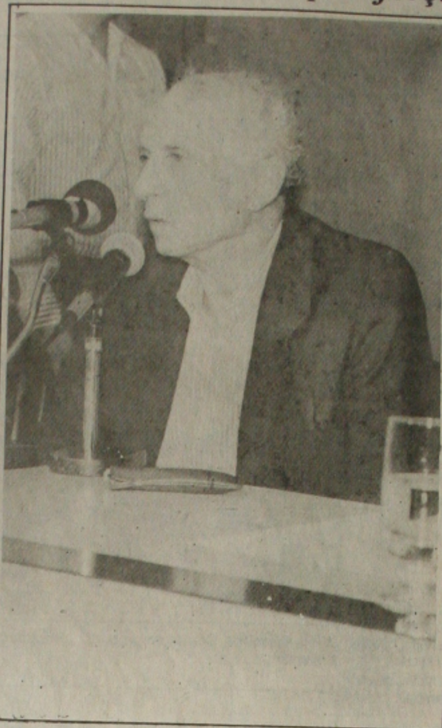
Ricupero: importação de roupas.

Este programa, que o senador denominou de "filosofia de governo", não vai propor metas numéricas. "Os números e os detalhamentos serão apresentados no meu programa de governo que lançarei mais adiante", reiterou.