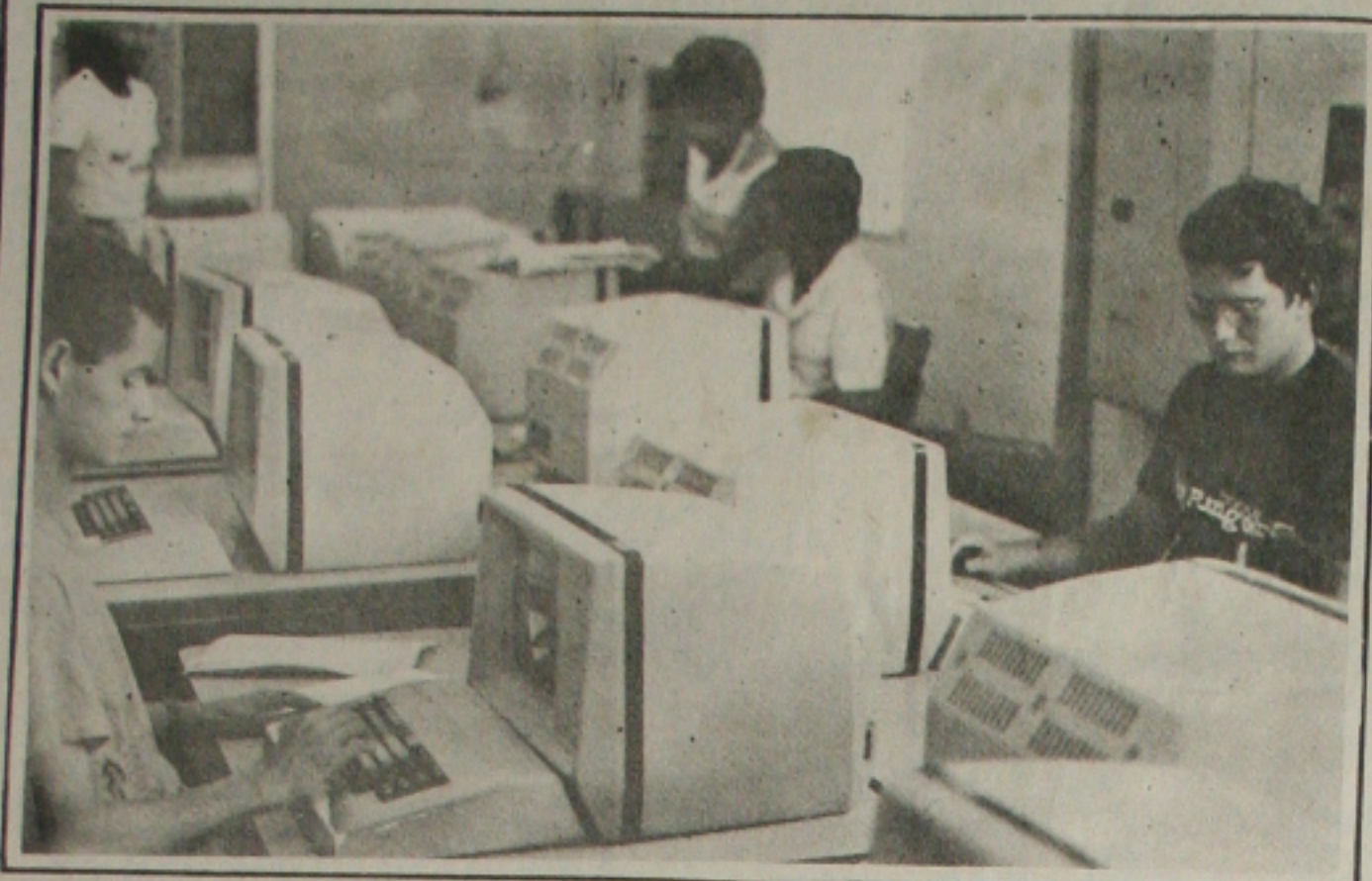
As empresas de processamentos de dados discutem a Informática durante seminário.