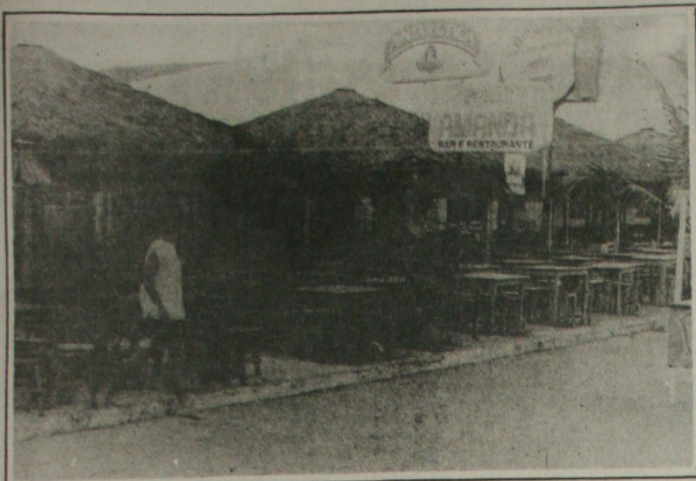
Os fiscais da Vigilância Sanitária fecharam o Restaurante Amanda...