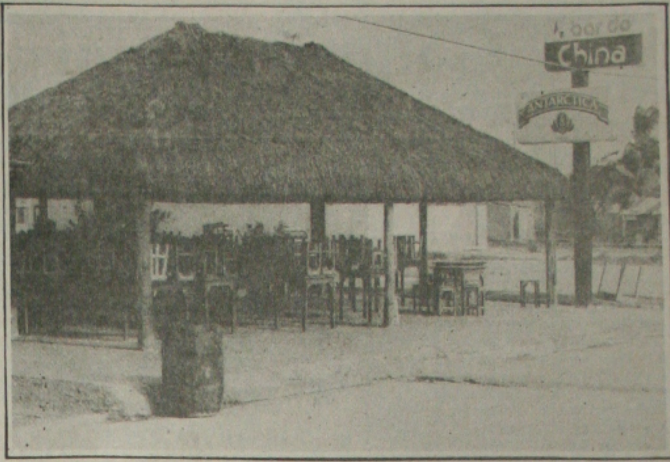
... Bar do China por estarem fora do padrão de higiene.