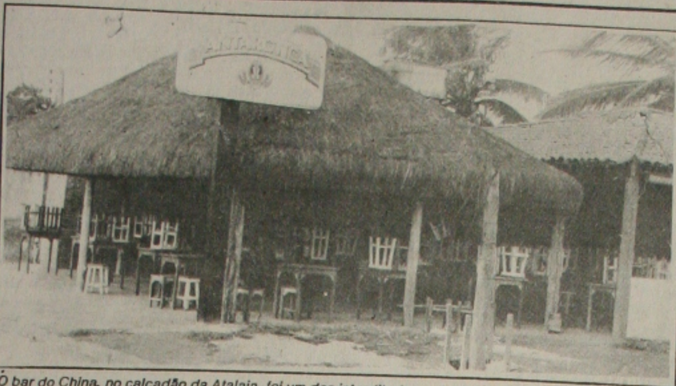
O bar do China, no calçadão da Atalaia, foi um dos interditados pela Vigilância Sanitária

O que outrora se constituía numa grande opção na hora de adquirir um carro novo ou outro bem durável, agora virou sinônimo de dor de cabeça para milhares de pessoas em todo o País, com a decisão do Banco Central fechar e intervir nos consórcios, como o Garavello. Os prejuízos em todo o País para os cerca de 60 mil consorciados lesados chega a mais de R$ 700 milhões, e muitos dos prejudicados sequer têm mais a esperança de serem ressarcidos. (Página 6A).