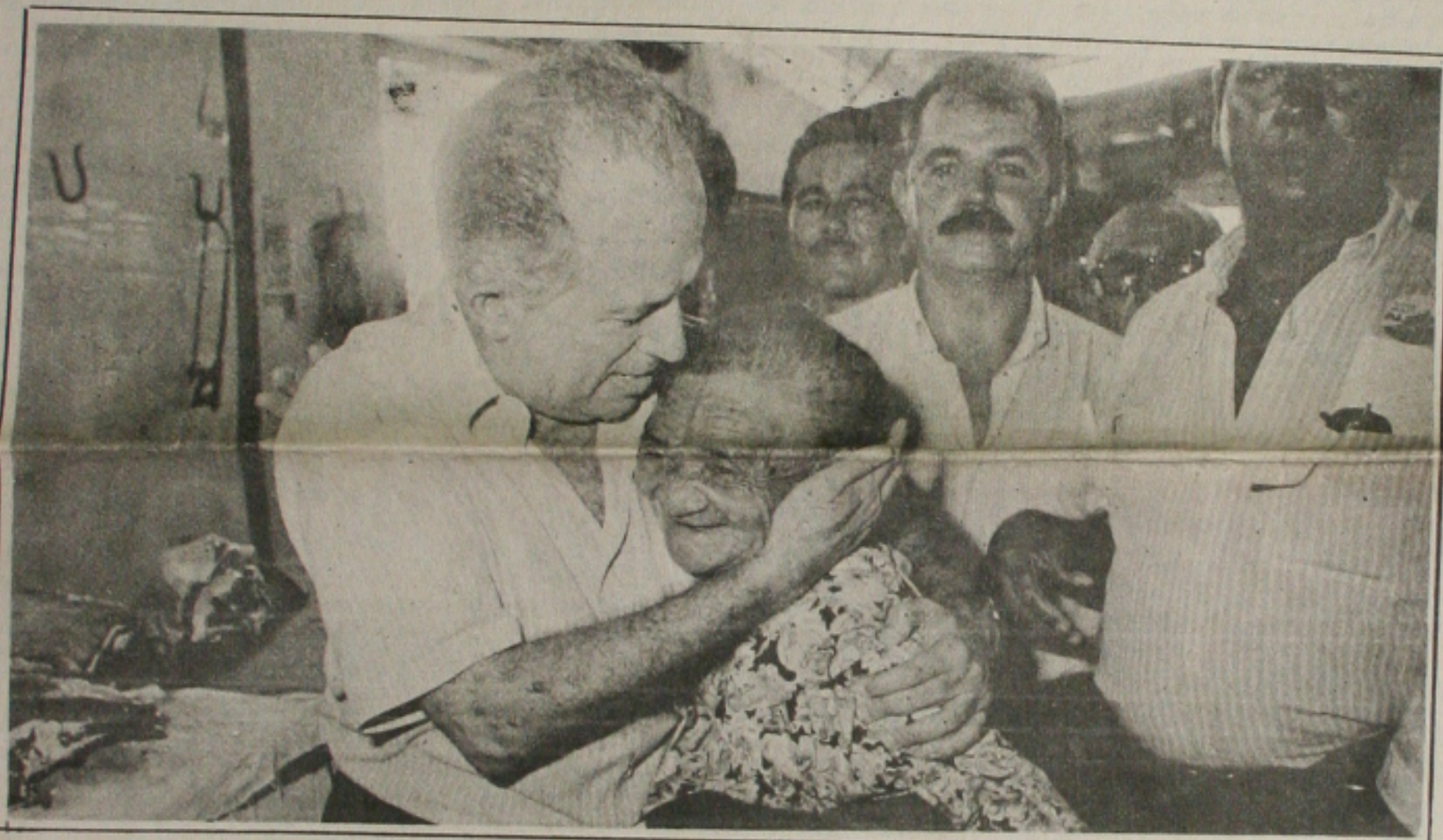
Em Areia Branca, o senador recebeu uma grande demonstração de carinho da população local

O governo poderá reduzir as alíquotas do Imposto de Importação sobre vestuário, como forma de aumentar a concorrência do setor e diminuir os preços ao consumidor. A advertência foi feita ontem pelo ministro da Fazenda, Rubens Ricupero que, durante entrevista, disse ter ficado impressionado com os preços das roupas verificadas por ele mesmo no final de semana, ao visitar um