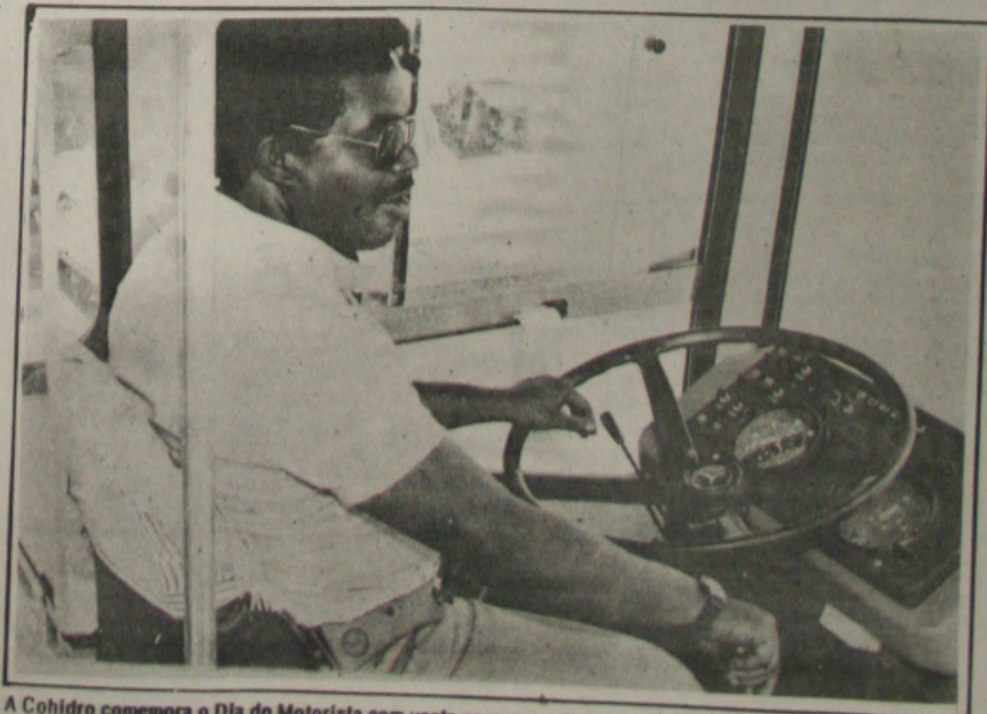
A Cohidro comemora o Dia do Motorista com vasta programação na capital.