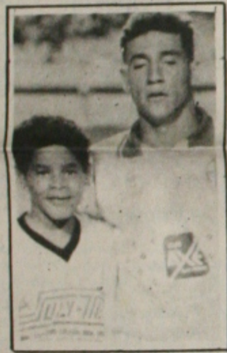
Náutico terá que indenizar o Confiança, para ter Alex.

para o jogo do próximo domingo no Batistão contra o Marinhense. É uma partida das mais difíceis para o time proletário, cujo rendimento técnico vem caindo a cada partida, criando preocupações para a comissão téc-