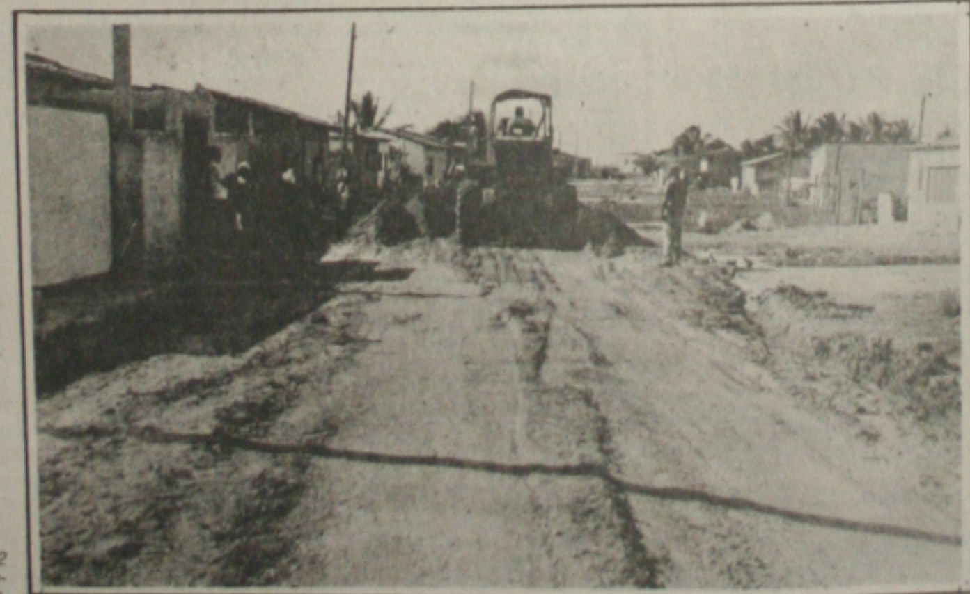
Emurb trabalha na terraplanagem de ruas na Coroa do Meio.

Ubirajara Barreto, por outro lado, previu para esta semana a conclusão das obras de recuperação do canal e da pista da Avenida Ailton Teles, no Bairro Santo Antônio, onde em dois trechos o muro de proteção desabou, em função das chuvas.