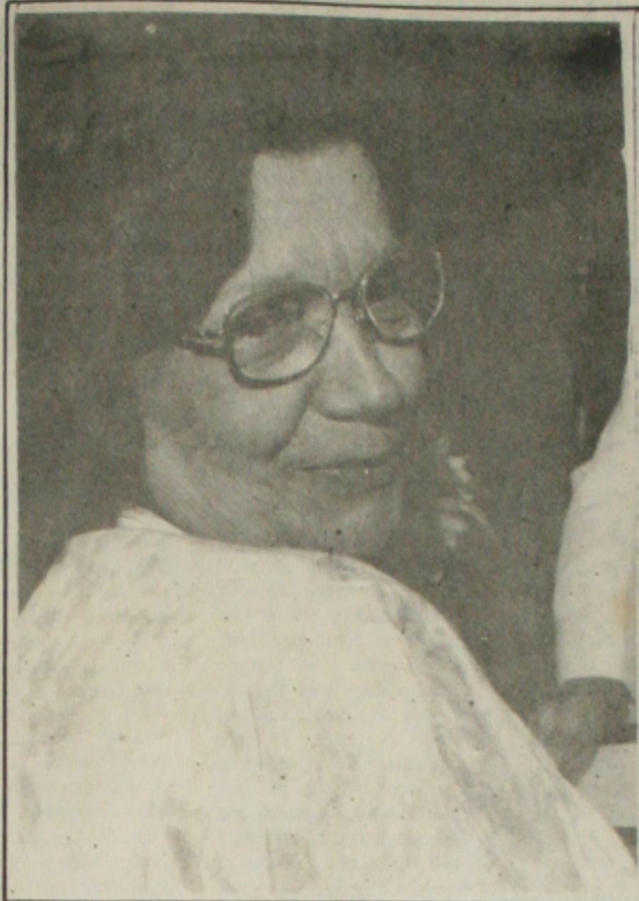
Aglaé Alencar, Secretária Especial da Cultura, vai inaugurar o novo Conservatório de Música.