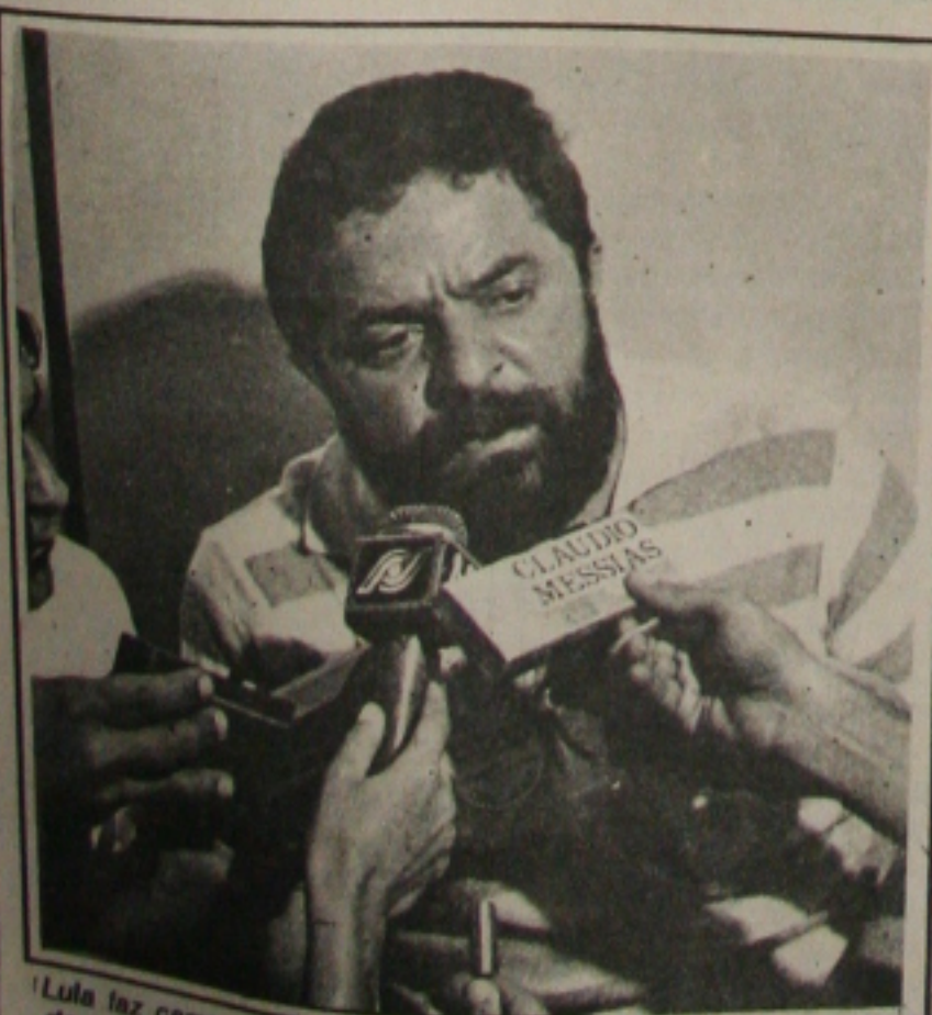
Lula faz campanha hoje em Aracaju, ao lado dos candidatos da coligação O Povo na Frente.

O custo da cesta básica de alimentos em Aracaju, no período de 5 a 28 de julho, ou seja, após a implantação do Real, registrou uma queda de 1,22% segundo levantamento da Superintendência de Estudos e Pesquisas da Secretaria Estadual de Planejamento (Sepplan). A maior variação negativa foi a do preço da banana que caiu 9,79% seguido do tomate, (-9,52%) (Página 6A).