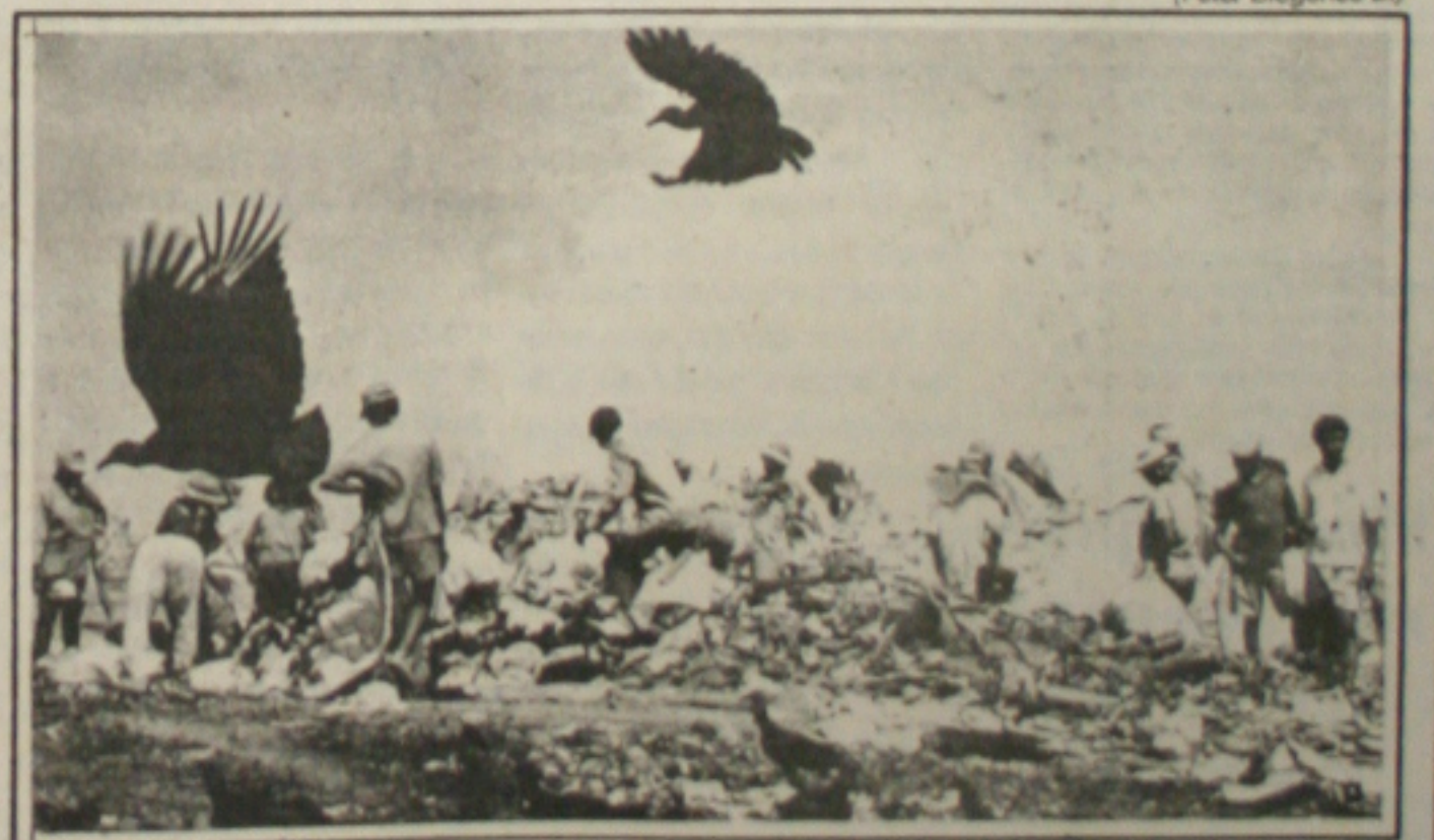
A lixeira da Terra Dura fere todos os padrões sanitários e ambientais existentes.