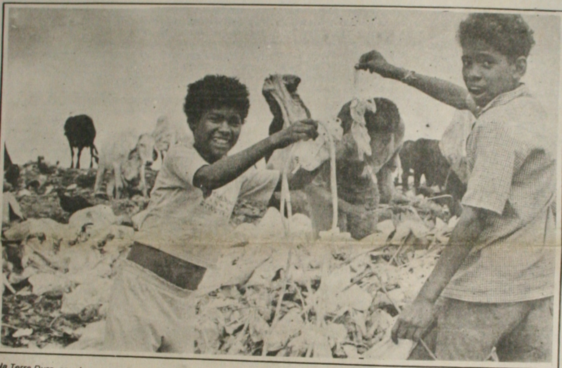
Na Terra Dura, as crianças recolhem todo tipo de lixo, inclusive o hospitalar.

O Superior Tribunal de Justiça (STJ) decide hoje se acata ou não a denúncia do Ministério Público contra o candidato do PMDB à Presidência da República, Crestes Quércio, acusado de crime de estelionato na importação de equipamentos técnico-científicos de Israel na época em que era governador de São Paulo. A tendência é a de que a denúncia seja aceita, o ministro relator do processo, Roberto Costa Leite, vai destacar a posição