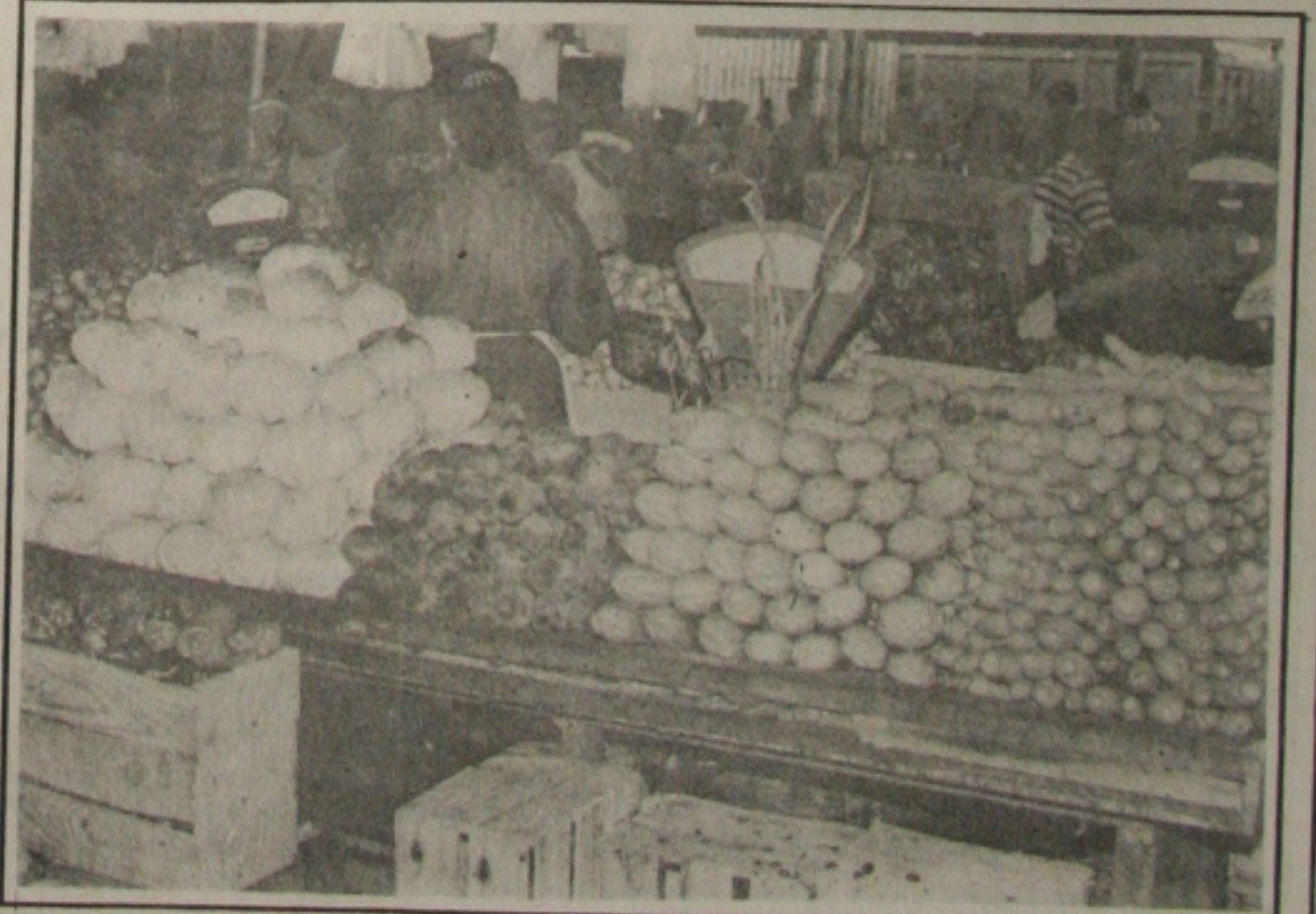
As maiores quedas de preços foram registradas entre os produtos hortifrutigranjeiros.

O candidato do PT à Presidência da República, Luís Inácio Lula da Silva, chega hoje a Sergipe, primeiro presidente a visitar o Estado em campanha, Lula desembarcará em Aracaju por volta das 14 horas, concederá entrevista coletiva à imprensa ainda no aeroporto e depois participa de uma passeata que sairá da avenida Barão de Marulim, em frente à Praça da Bandeira, percorrendo algumas ruas centrais da cidade, passando pelo calçadão da João Pessoa, até chegar à Praça Fausto Cardoso, onde acontecerá um comício organizado pela coligação "O Povo na Frente", apoiada pelo PT sergipano. (Página 3A).