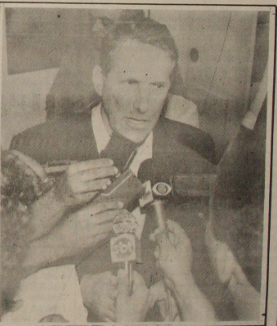
Quéricia: crime de estelionato