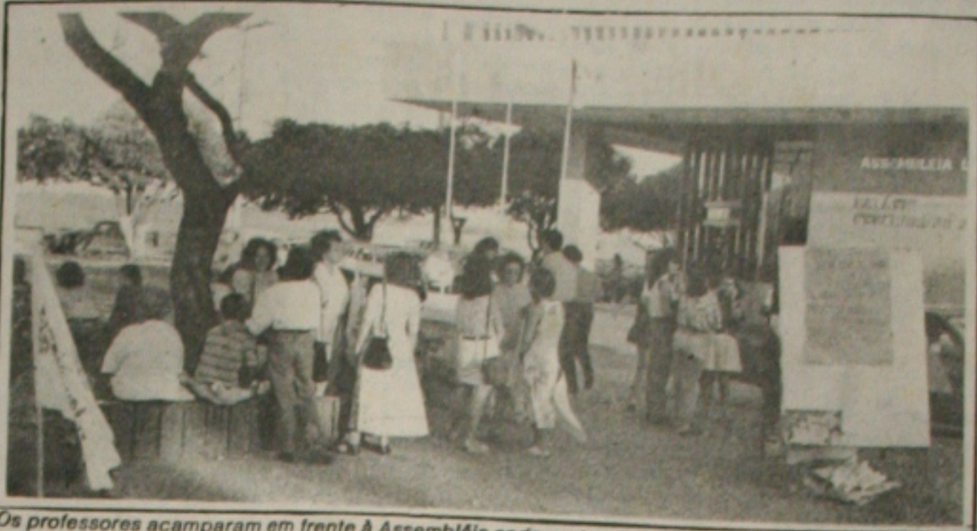
Os professores acampam em frente à Assembleia onde pretendem ficar até a próxima semana.

guirá até a próxima semana, quando os professores farão nova assembleia geral no Instituto Histórico e Geográfico de Sergipe para avaliar a greve. Ela disse que a disposição da categoria é de se manter de braços cruzados, até que o governo abra um canal de negociações para discutir as reivindicações dos trabalhadores. (Página 5A)