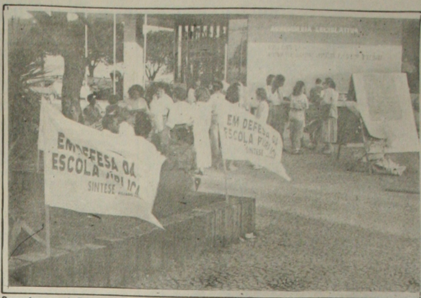
Os professores do Estado estão acampados em frente ao prédio da Assembléia Legislativa.