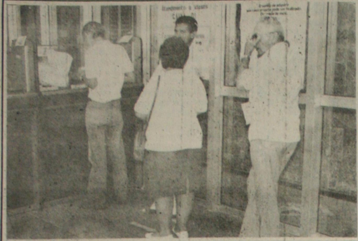
A Previdência Social paga até dia 12, mais de R$ 14 milhões aos aposentados.

Até a próxima sexta-feira o Ministério da Previdência Social (MPS) pagará R$ 14.754.286,69 em aposentadorias e pensões, em Sergipe. A informação é do próprio Ministério, acrescentando que 148.407 pessoas estarão sendo beneficiadas. Os segurados da espécie urbana (64.297) receberão créditos no montante de R$ 7.679.333,81, enquanto que aos que fazem jus à espécie rural (84.110), serão destinados R$ 7.074.954,87.