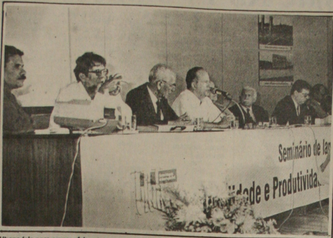
Albano fala para empresários da construção civil.

Relatando a situação financeira dos servidores públicos que estão com dificuldades para manterem suas famílias, o deputado Pedro Firmino disse que participou de uma reunião no gabinete do presidente da Assembléia deputado Reinaldo Moura juntamente com vários parlamentares e lideranças dos funcionários onde foi formada uma comissão que avaliará as reivindicações da categoria o governador.