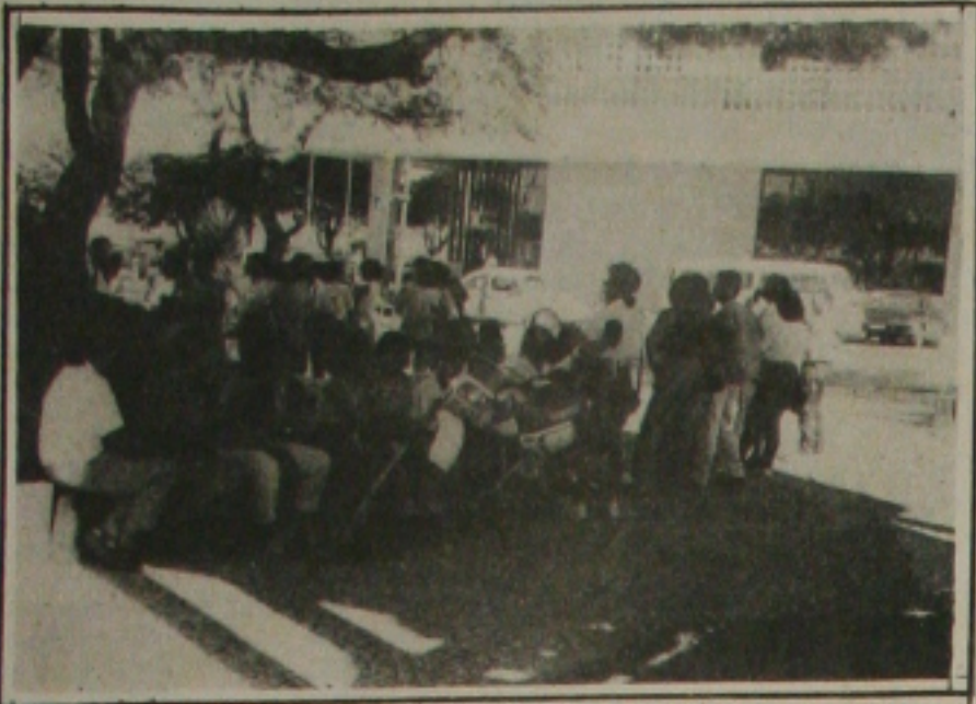
Os professores ainda ontem permaneciam em vigília em frente à Assembleia.