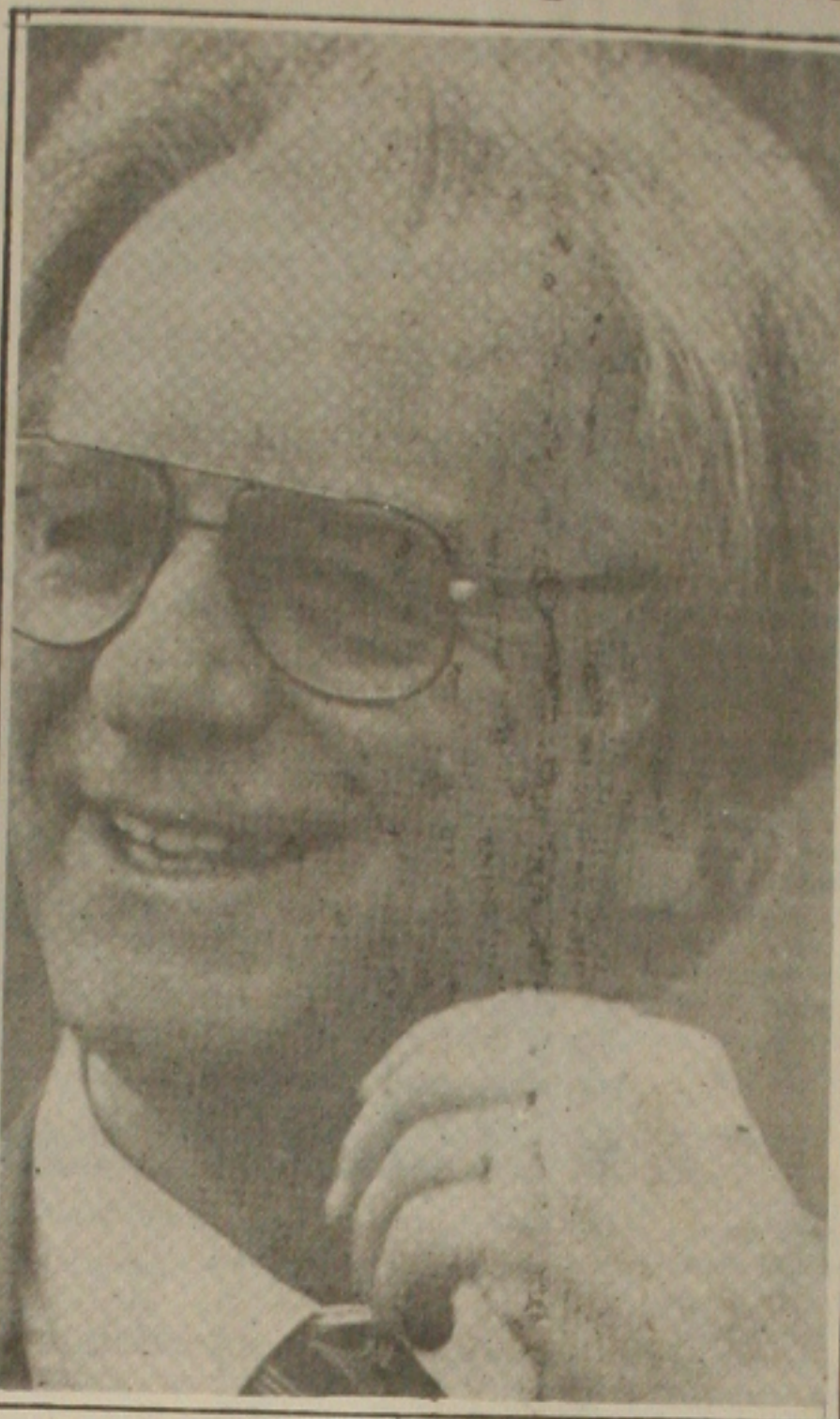
Itamar: fim da novela.

O ministro informou que dentro de poucos dias se reunirá com governadores para pedir a redução da carga tributária sobre os produtos que integram a cesta básica e dos remédios. Incentivou aposentados, donas de casa e consumidores em geral a iniciar uma campanha nacional contra os aumentos exagerados dos serviços, como tintureiro, barbeiro, lavagem de carros, entre outros.