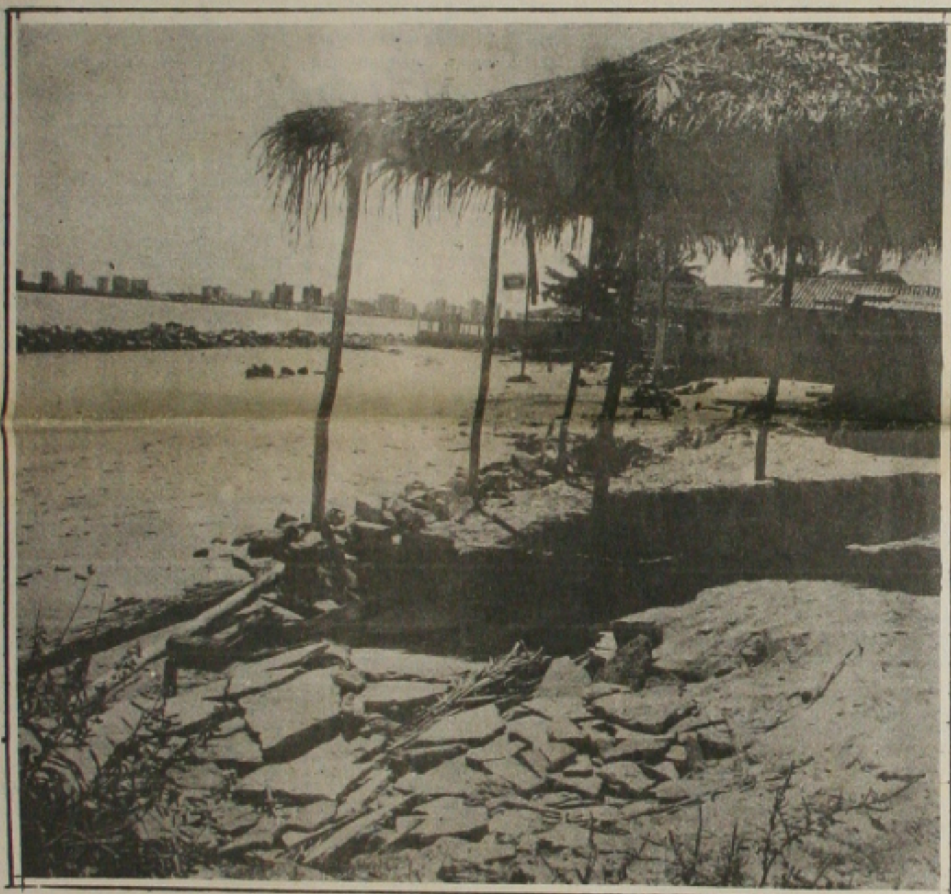
A Atalaia Nova, que antes recebia cerca de 30 mil visitantes por semana, hoje está vazia.