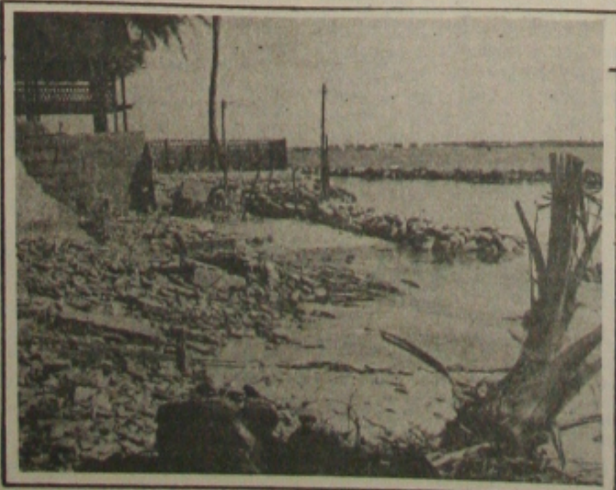
A Atalaia Nova foi entregue ao descaso do Governo.

Além do molhe, que não teve qualquer relatório do impacto ambiental - o Rima, o governador Valadares executou obras ainda hoje condenadas pela população local.