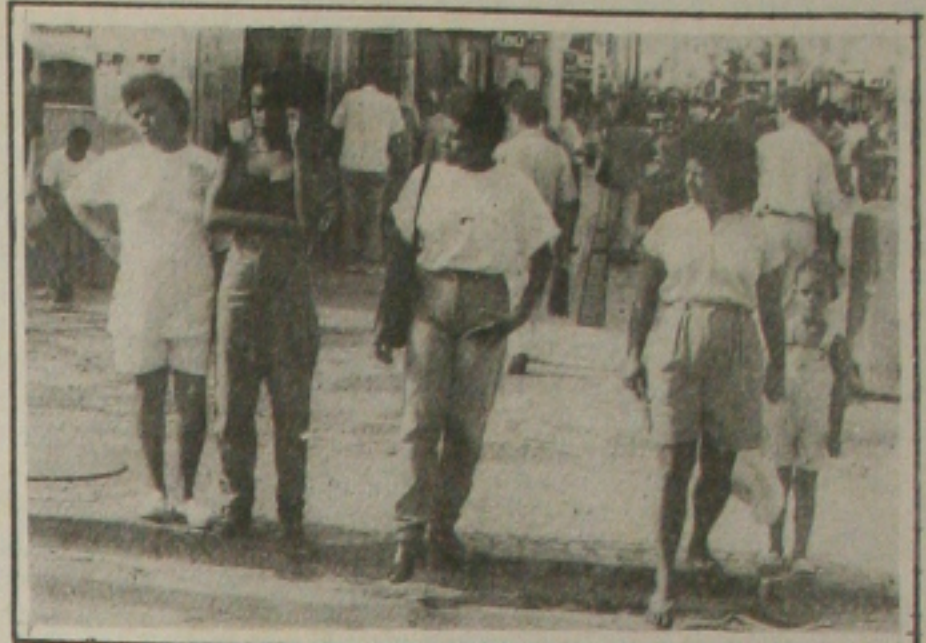
O Censo constatou que as mulheres são maioria entre a população do Estado.

As mulheres são maioria entre a população de Sergipe, representando 51% do total, de 1.491.876 habitantes que possui o Estado. É o que revela o Censo Demográfico realizado em Sergipe, em 1991, pelo Instituto Brasileiro de Geografia e Estatística (IBGE). De acordo ainda com o levantamento, 67% da população residem na zona urbana e 33% na rural. (Página 5A)