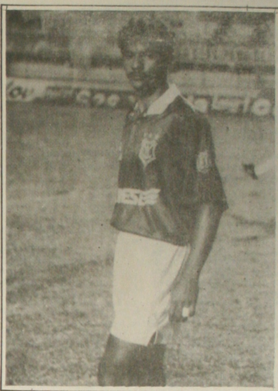
Canhoto volta ao time do Sergipe