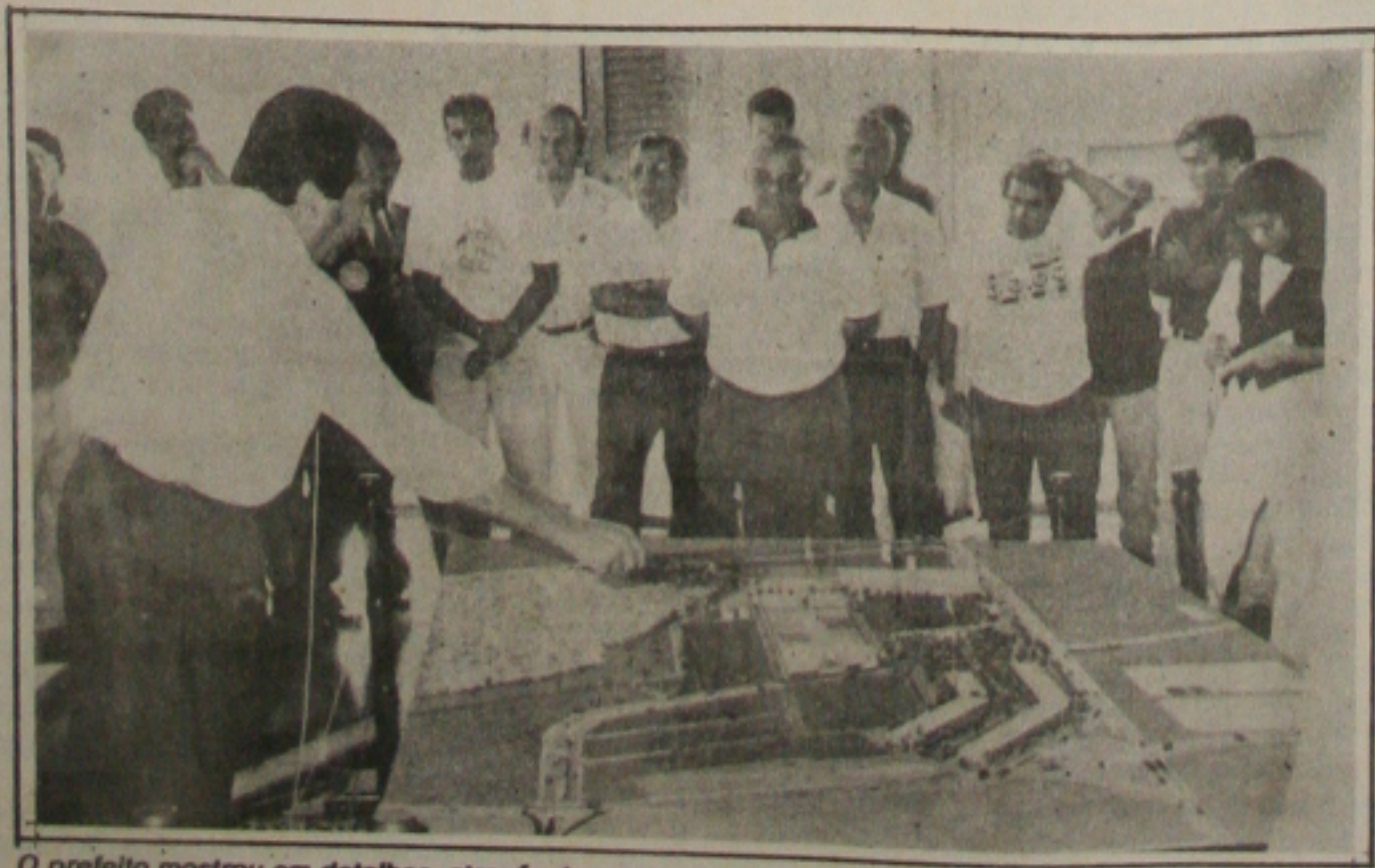
O prefeito mostrou em detalhes, através de uma maquete, como será o novo complexo de abastecimento.

mara continuam em greve, mas as sessões devem ser retomadas hoje. Para o líder do PMDB, vereador Sérgio Bezerra o caos financeiro em que se encontra a Câmara deve servir de alerta para o que pode ocorrer em todo o Estado caso Jackson Barreto seja eleito Governador. (Página 3).