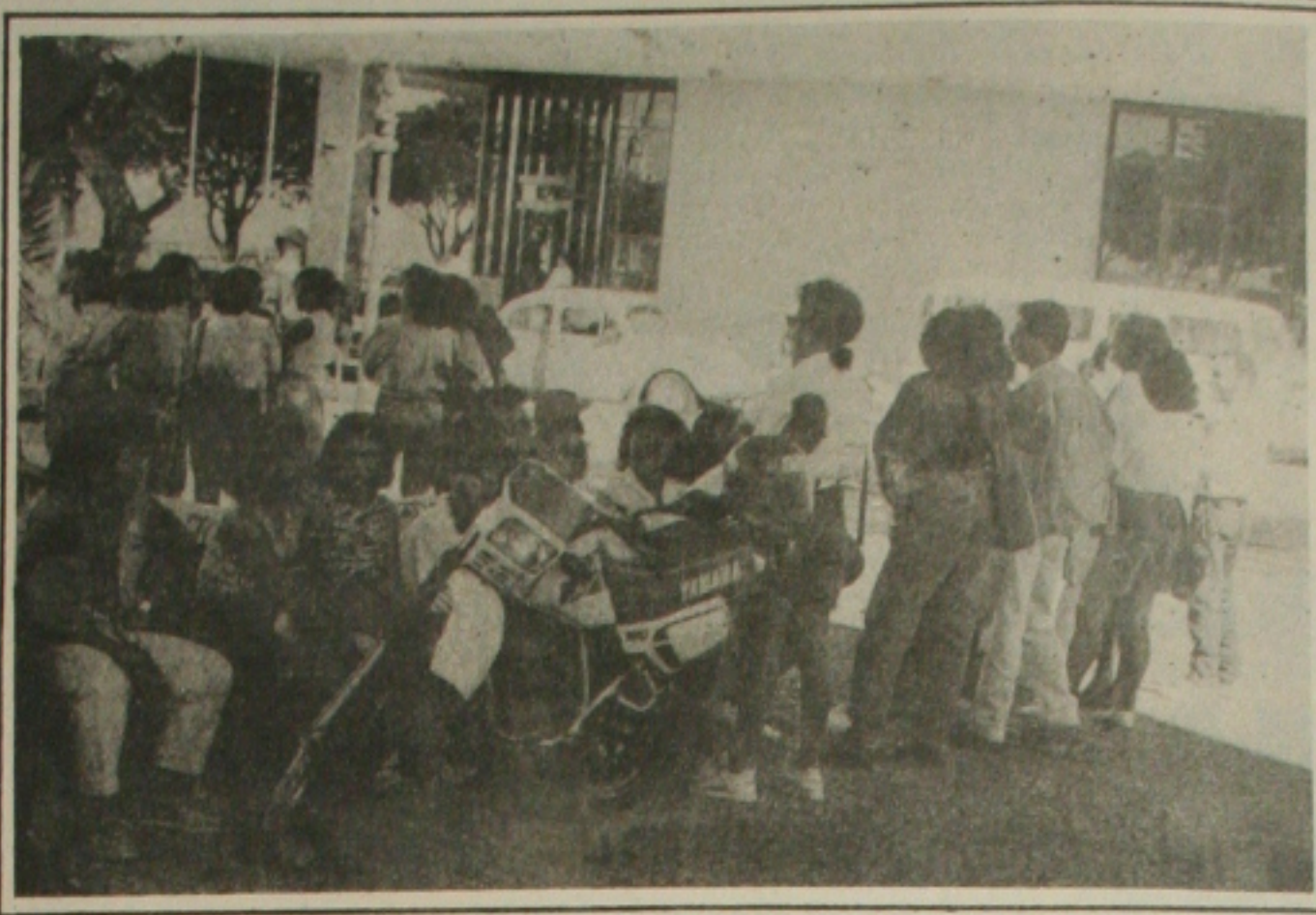
Os professores do Estado que mantêm vigília na Assembléia decidem hoje seu destino em reunião.

Com uma população de 16.731 habitantes, de acordo com o último censo do IBGE, Poço Redondo situa-se na bacia do rio São Francisco e a base de sua economia apoia-se nas culturas de algodão, feijão, milho, mandioca e arroz. Também tem peso importante a pecuária (bovinos, suínos, equinos, caprinos), embora as condições climáticas típicas do semi-árido dificultem tanto a agricultura como a pecuária em grande parte do ano. Como a escassez de chuvas é um fenômeno com o qual, no dizer do governador João Alves Filho, o sertanejo deve aprender a conviver, a safra para viabilizar a região foi a implantação de obras de infra-estrutura, a exemplo do que o governador vem fazendo desde seu primeiro mandato. Com a implantação das adutoras, o sertão sergipano é o hoje uma região privilegiada em todo o Nordeste, onde as comunidades com mais de 100 habitantes são, todas elas, dotadas de água encanada. "Tendo a água, o sertanejo tem tudo", explica o pequeno produtor Maximino de Jesus, morador de Poço Redondo.