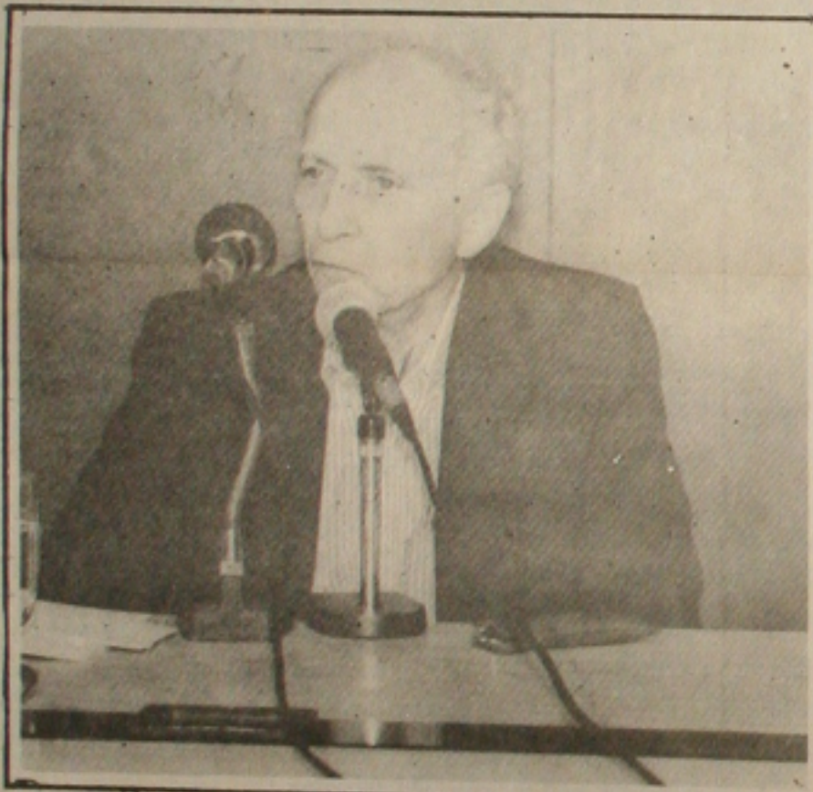
Ricupero: pedido inócuo

Segundo Lula, os programas eleitorais da Frente "estão na linha certa". Ele disse que na reunião discutiu-se o programa de governo petista, não uma nova tática de campanha diante do atual quadro eleitoral. "Nós estamos convencidos que o povo é inteligente para descobrir efetivamente as diferenças existentes entre cada candidatura", declarou o candidato. Lula avaliou que os 40 dias de campanha que ainda restam são "tempo mais do que suficiente" para uma completa reversão de expectativa. "Temos de colocar a campanha na rua,