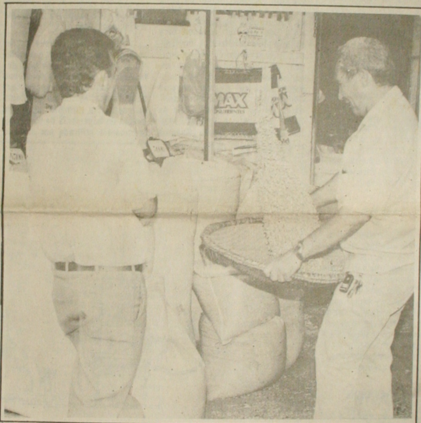
A redução do ICMS fará o feijão ficar mais barato para o consumidor.