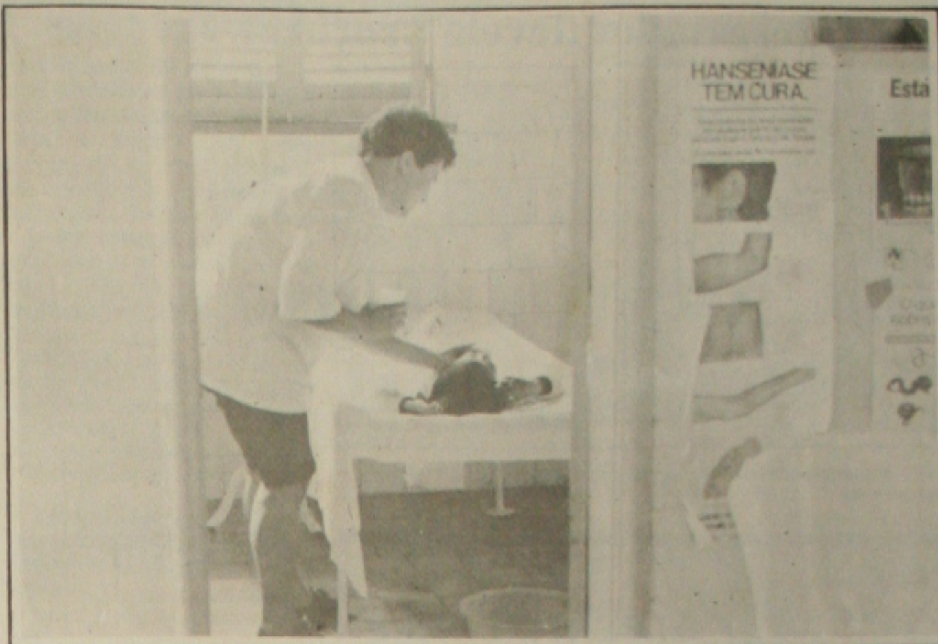
Os casos de cólera registrados no Estado já somam mais de 400, conforme a DVS.

Um televisor colorido pode ser adquirido por um preço que varia entre R$ 400,00 e R$ 600,00, assim como o vídeo-cassete. Já um som laser pode ser comprado por um preço médio de R$ 300,00; a geladeira e o freezer por um preço entre R$ 300,00 e R$ 600,00; o fogão, por um preço médio de R$ 200,00 e o ar condicionado pode ser comprado por até R$ 350,00. Esses preços sofrem uma variação de acordo com o tamanho, marca e loja em que estão sendo comercializados.