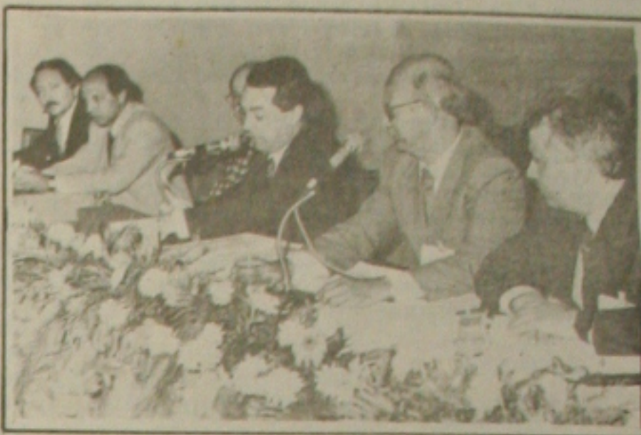
Os eventos sobre informática foram abertos ontem e prosseguirá amanhã.

Aracaju se transformou desde ontem na capital brasileira da informática com a realização dos dois maiores eventos na área, abertos durante solenidade no auditório do Conservatório de Música de Sergipe. O XXII Seminário Nacional de Informática Pública discutem as novas tecnologias do setor e a informática no serviço público. (Página 4A).