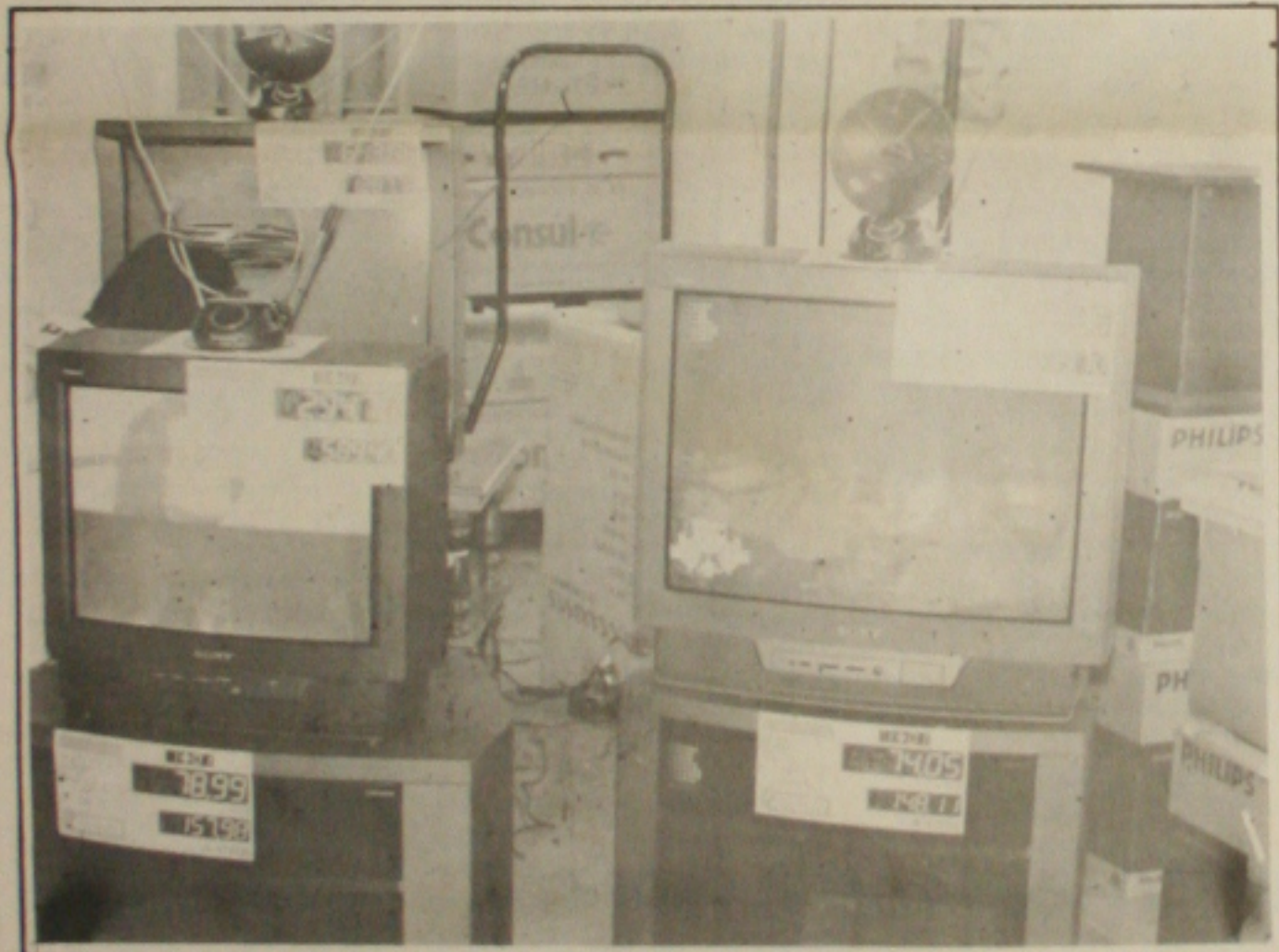
As vendas de eletrodomésticos aumentam com o sucesso do Plano Real.

A programação do Encontro de Glória é a seguinte: depois da Abertura, às 8:30 horas, logo em seguida haverá uma Análise de Conjuntura e Assistência Social, às 9:00; em seguida, a apresentação da Lei Orgânica de Assistência Social e Cidadania. Às 10:00 horas um rápido intervalo.