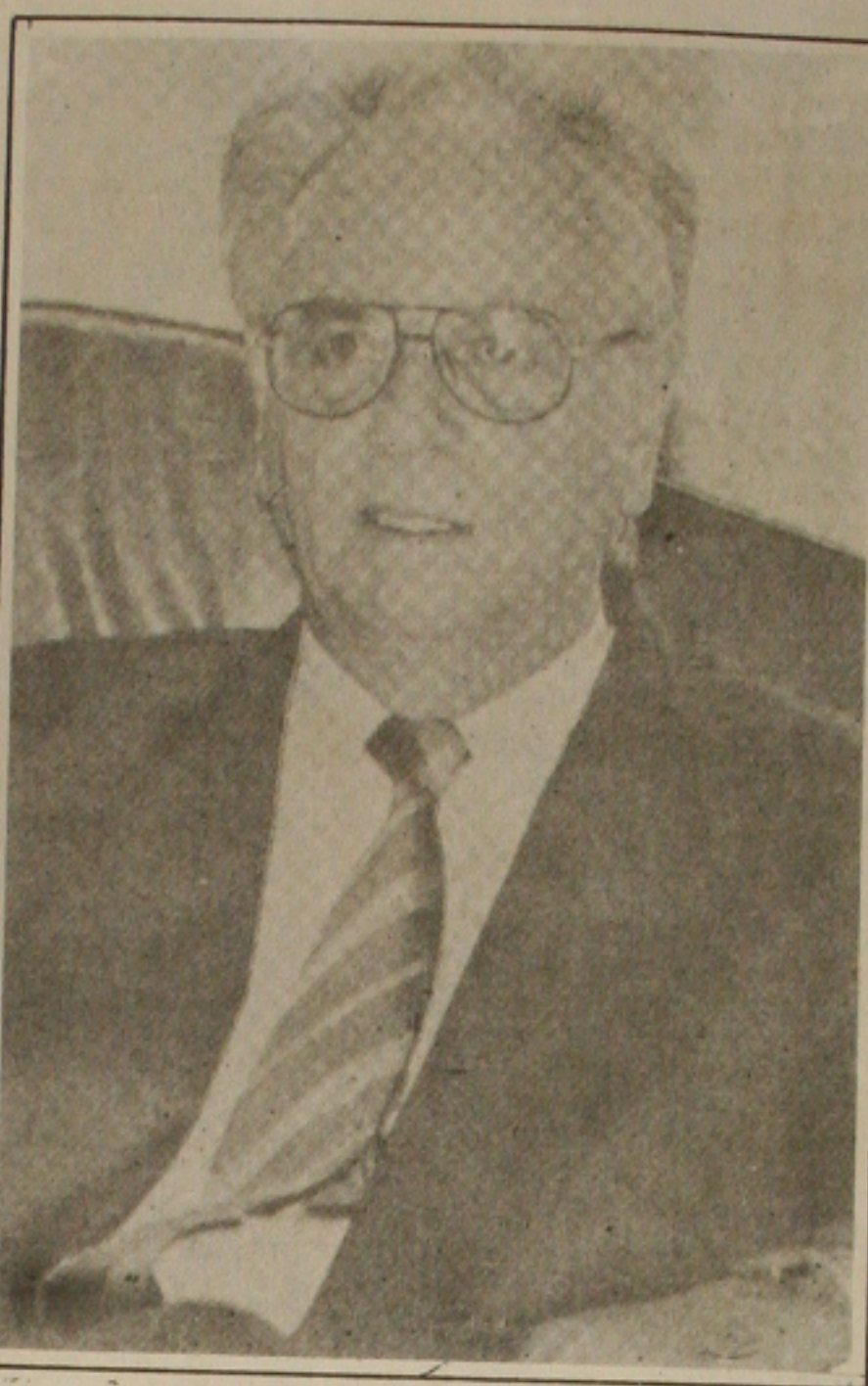
Itamar: voia, mas não apoia.

Por esse motivo, afirmou, muitas das soluções para os problemas habitacionais de desenvolvimento urbano ainda dependem da conclusão dos processos de descentralização, pois a gestão municipal, dado o seu tamanho e visibilidade junto à população, tem condições de executar melhor projetos urbanos públicos.