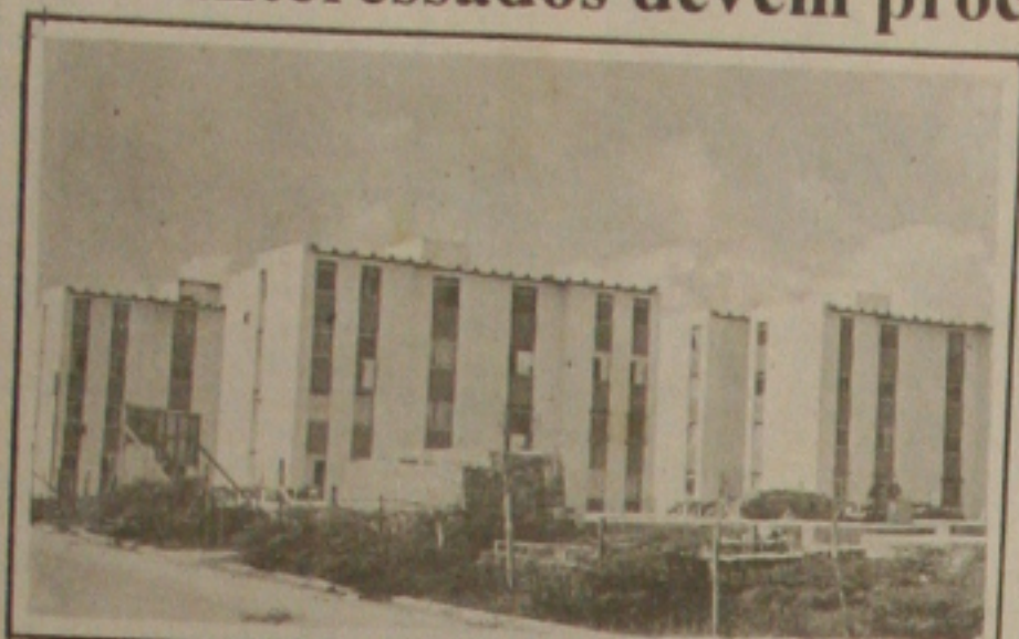
A CEF tem interesse em construir mais conjuntos e suprir déficit habitacional.

Com cem mil imóveis prontos para vender aos trabalhadores com renda mensal de até oito salários mínimos (R$ 518,32), a Caixa Econômica Federal, que financiou estas construções, quer facilitar as transações e para isso já iniciou os contatos com o Ministério da Fazenda. José Fernando de Almeida, presidente da CEF, diz que qualquer pessoa interessada deve procurar as agências da Caixa, explicando que dos 100 mil imóveis prontos, 60 mil estão com dificuldades de comercialização, porque houve paralisação nas obras de infra-estrutura, o que onerou os custos e se busca uma forma de não transferir esses custos.