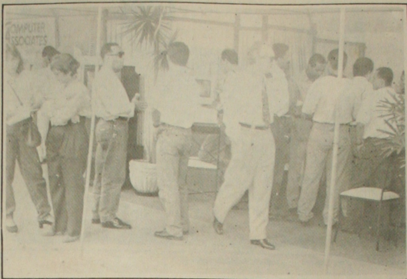
A informática pública é discutida em seminário no Conservatório de Música.

O Governo Federal, através do Ministério da Fazenda vem solicitando aos governos estaduais a redução do ICMS da cesta básica, acontece que em Sergipe, a redução foi feita antes mesmo da campanha federal. Só que desde ontem, dia 24, por determinação do governador João Alves Filho, a Secretaria de Estado da Fazenda reduziu também a pauta fiscal do feijão.