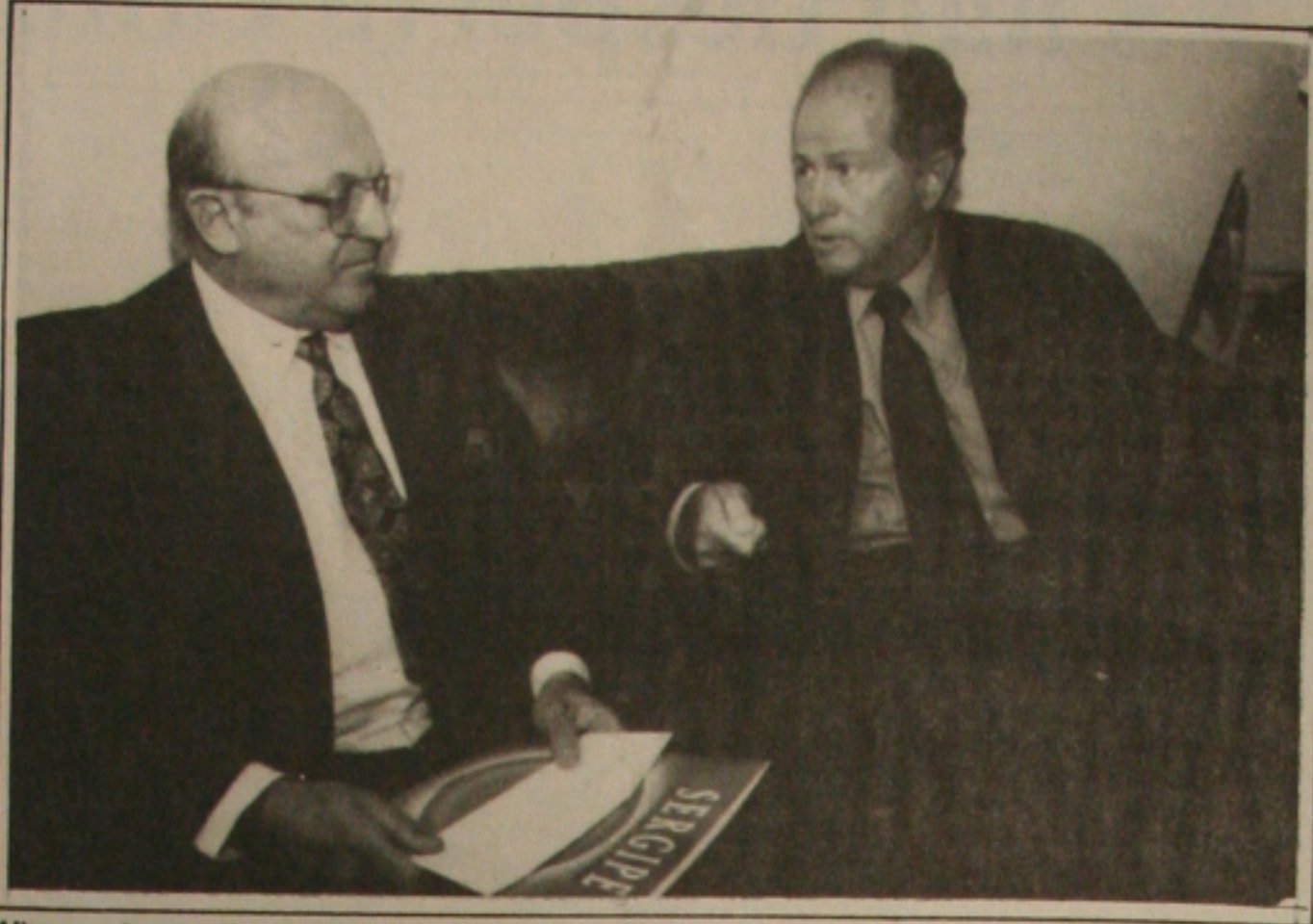
Albano entrega o documento ao presidente da GM do Brasil

Em um manifesto, que começa a ser distribuído para a população, os petistas advertem os eleitores para as manipulações que tentam derubar a candidatura Lula. Eles lembram os fatos ocorridos nas eleições presidenciais de 1989, e mostram que os atuais aliados do senador Fernando Henrique Cardoso, candidato da aliança PSDB/PFL, são os mesmos que apolaram Fernando Collor.