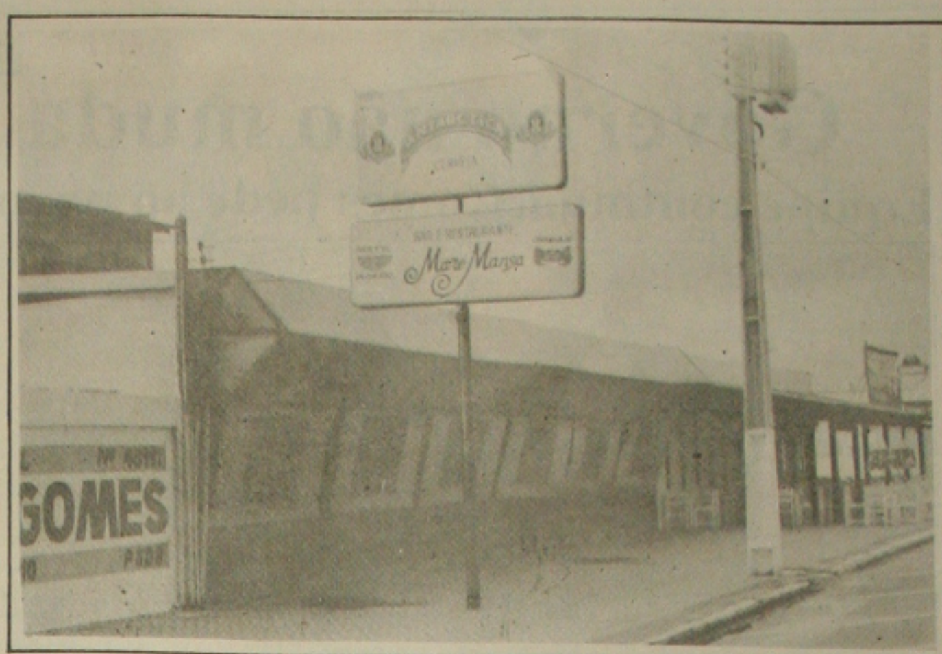
...juntamente com a Maré Mansa que apresentaram baixa qualidade no padrão de higiene.