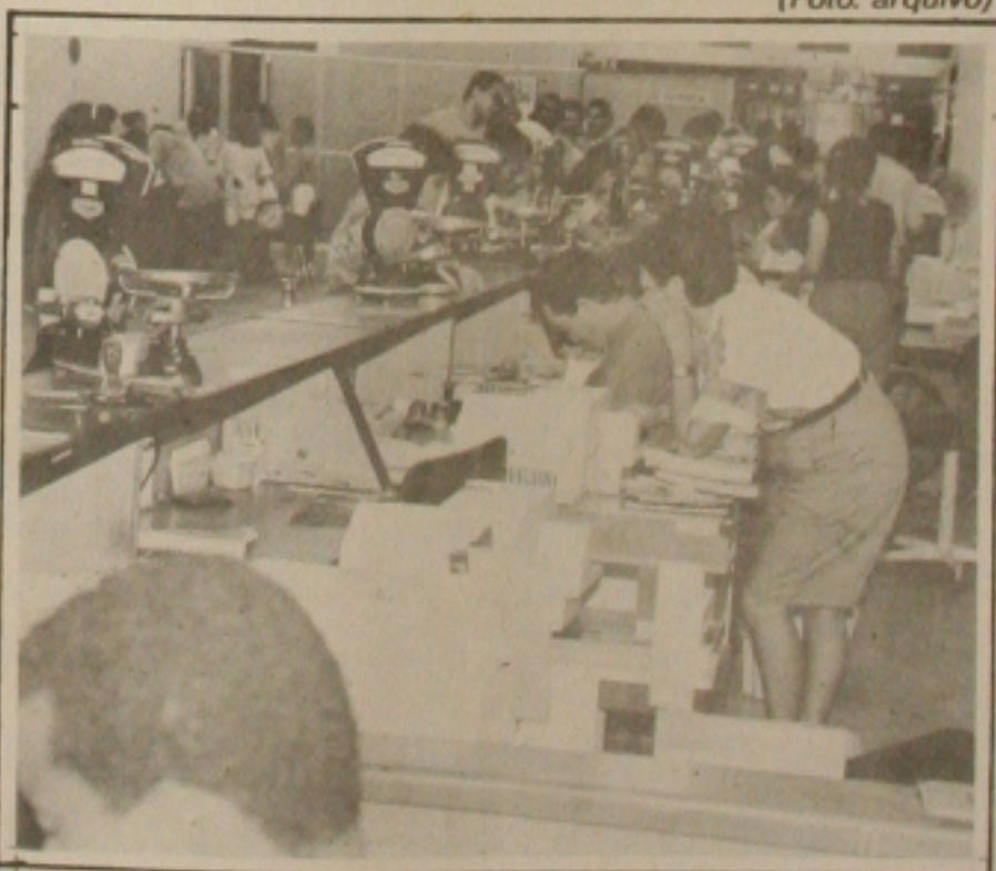
O novo CEP dá mais credibilidade aos Correios.