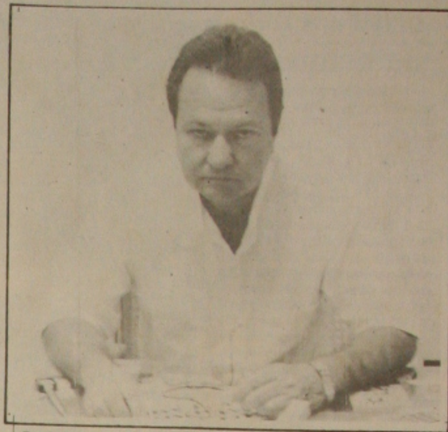
Prado tem o mesmo pensamento do colega.