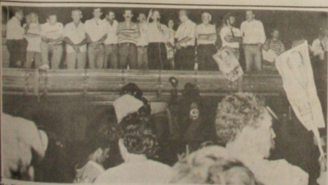
No fim de semana, o senador foi ao Povoado Mata, em Itabi, onde falou do alto de um camião