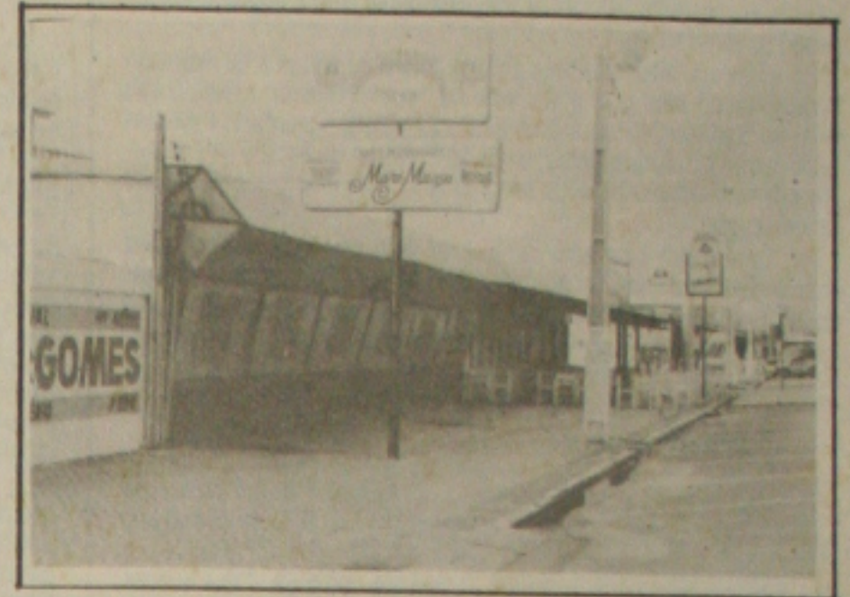
A Choparia Maré Mansa foi um dos estabelecimentos fechados pela Vigilância Sanitária

funcionando sem as mínimas condições de higiene. Cozinhas sujas, alimentos mal-acondicionados e falta de uniformes específicos para os funcionários foram algumas das irregularidades detectadas pelos agentes da Vigilância do Município. (Página 5A)