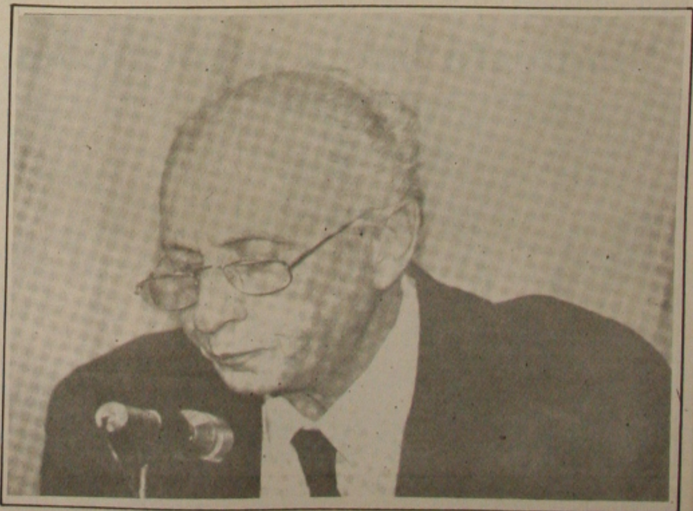
Ricupero se emociona na despedida e ontem passou as metas do Real para Ciro Gomes.

Assim como Rubens Ricupero, o ministro Ciro Gomes diz que a ordem é economizar, porque a base das riquezas das nações é a produção e a poupança, pois só se deve atender as necessidades básicas e o povo precisa economizar, para que a estabilização econômica dê certo.