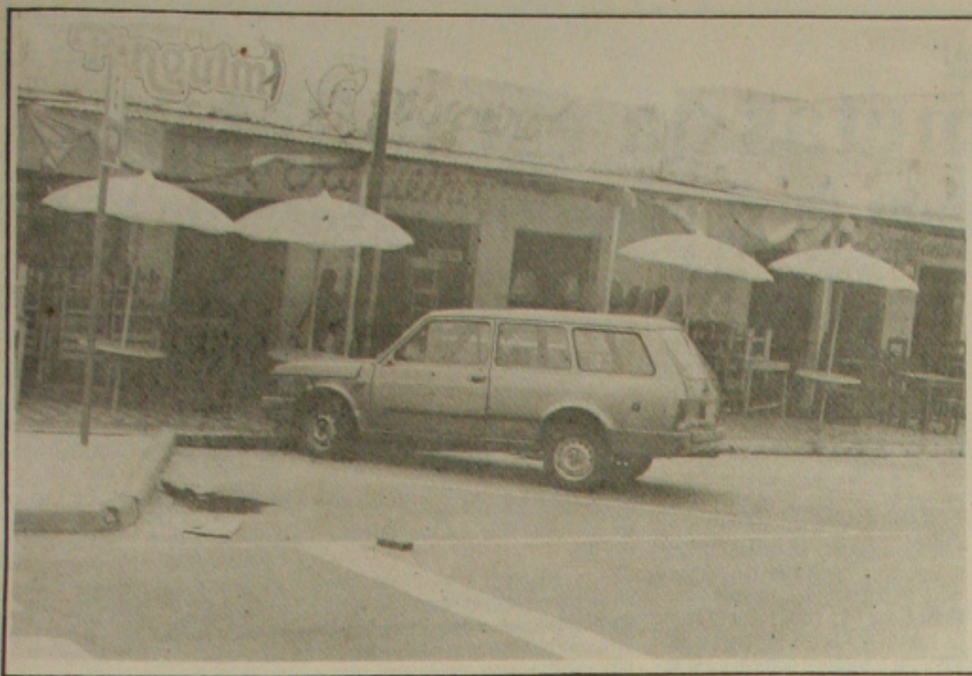
O Restaurante O Vaqueiro foi interditado pelos fiscais da DVS do Município...