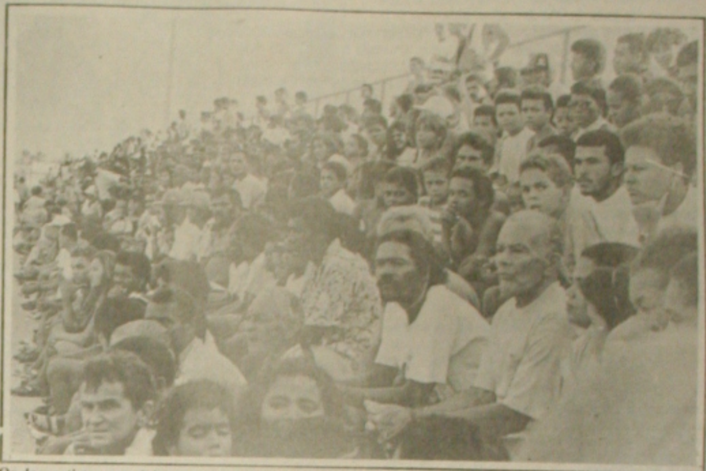
Os desportistas prestigiaram a inauguração do estádio João Cruz, na Barra