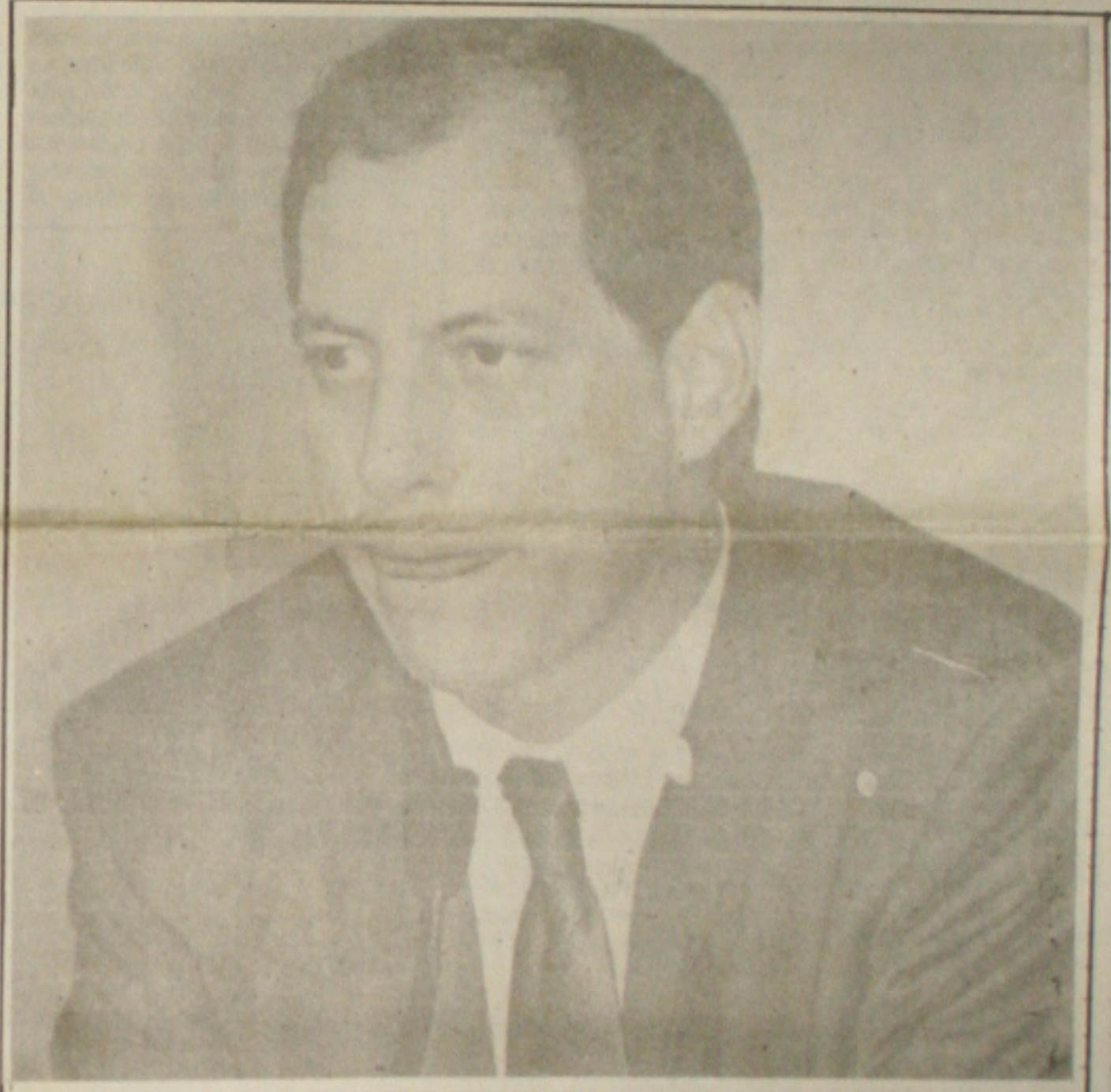
Ciro disse que quer ser avaliado por seus atos à frente do Ministério da Fazenda