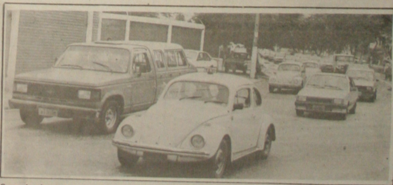
O grande número de veículos e a irresponsabilidade de muitos motoristas têm tornado o trânsito na capital muito caótico.