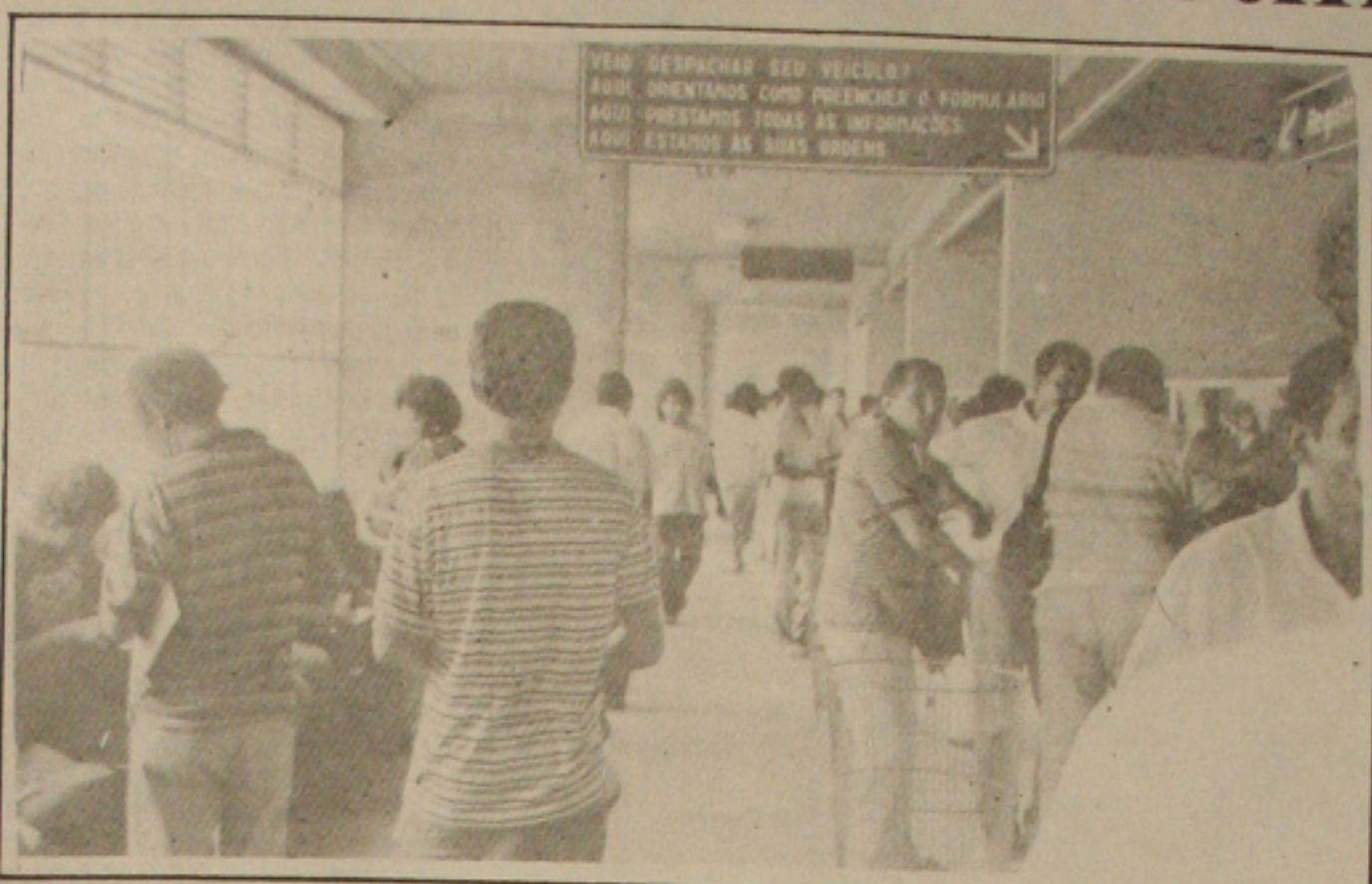
A quadrilha atuava no setor de Certificados de Registros de Veículos.