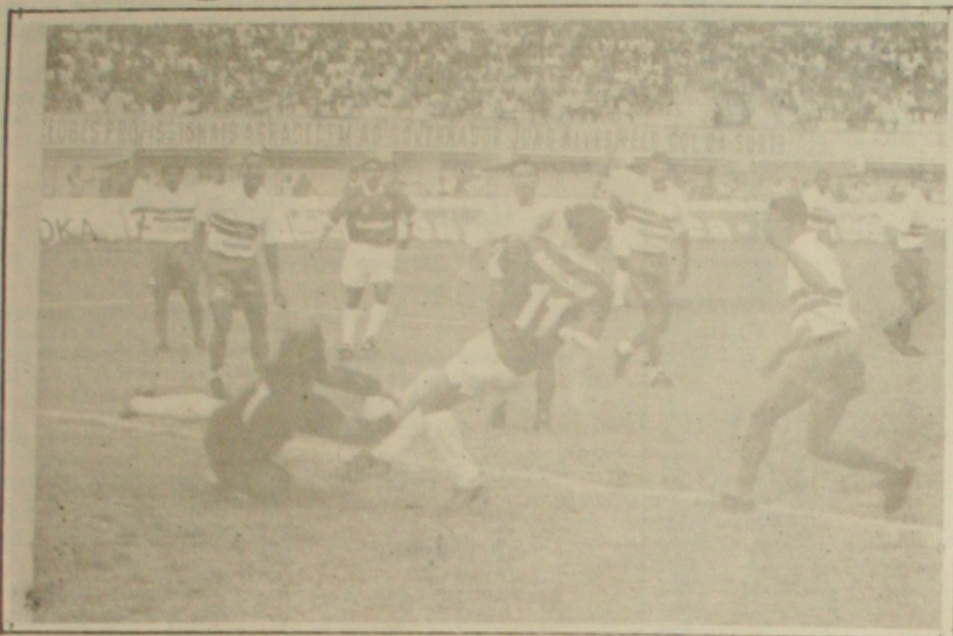
O Sergipe venceu o CRB e amanhã enfrenta o Santa Cruz, no Arruda.