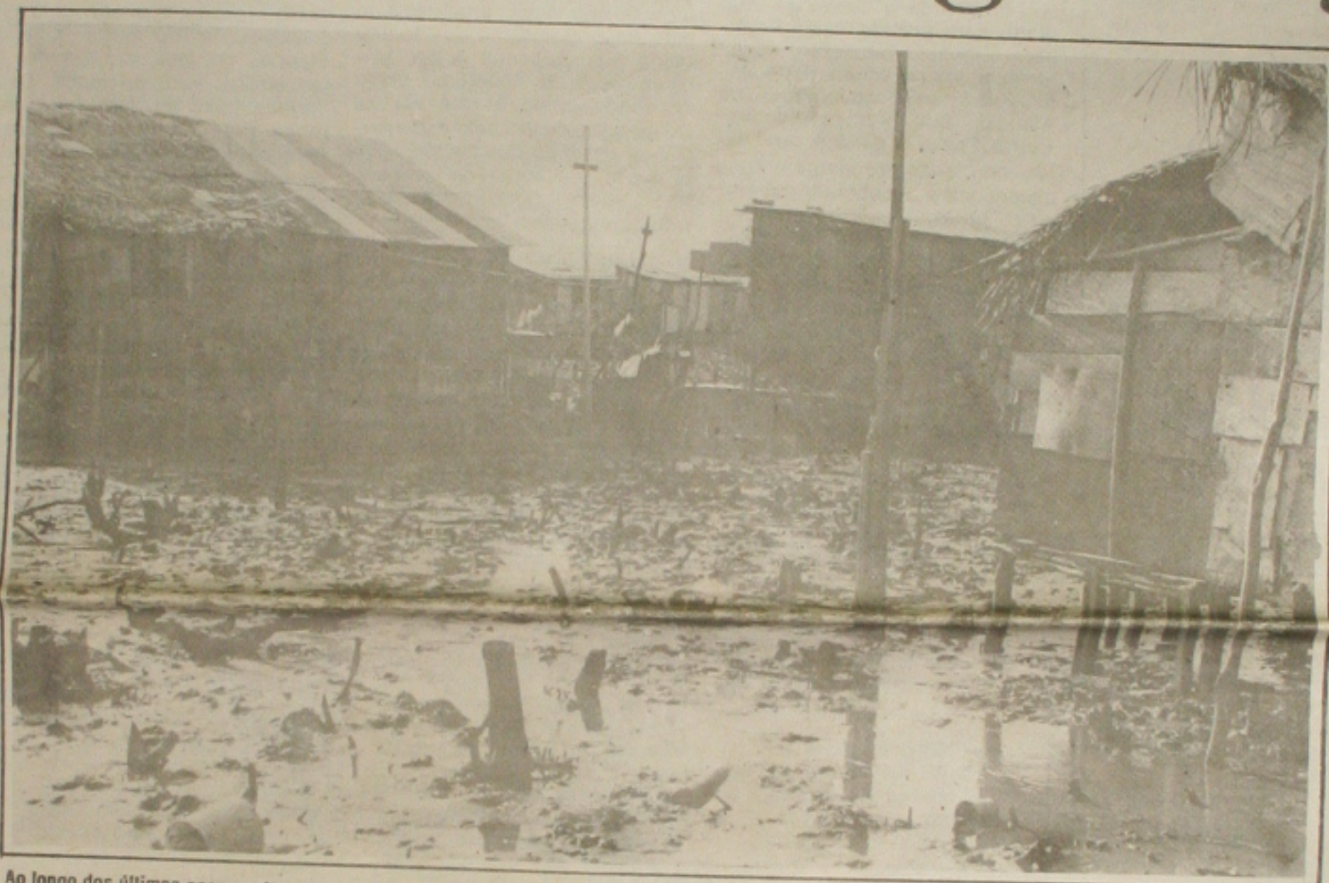
Ao longo dos últimos anos, muitos manguezais têm sido destruídos sem que o Ibama consiga impedir.

O candidato da coligação "Sergipe Tem Futuro", senador Albano Franco (PSDB) se reuniu sábado à tarde com produtores e trabalhadores da área citrícola de Sergipe. Na ocasião ele garantiu que, se eleito, vai dar uma atenção especial à citricultura do Estado, como forma de assegurar a revitalização do setor. (Página 3A).