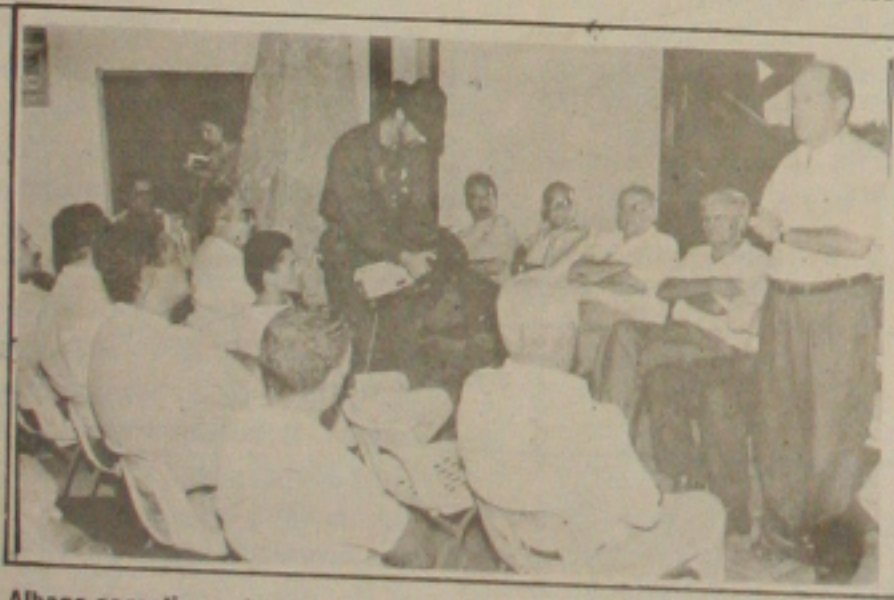
Albano garantiu um tratamento especial aos citricultores sergipanos

Reivindicando reposição salarial de 11,87% correspondentes ao IPC-R acumulado nos meses de julho e agosto, cerca de 143 mil metalúrgicos do ABC Paulista iniciaram ontem uma greve por tempo indeterminado, paralisando as principais montadoras do país. Cerca de três mil veículos deixaram de ser produzidos no primeiro dia da paralisação, a primeira do Governo Itamar Franco, acusado pelos líderes do movimento de interferir negativamente nas negociações com os empresários, interrompidas na sexta-feira. "O Governo, de maneira intrometida, impediu o fechamento do acordo", reclamava ontem o presidente do Sindicato dos Metalúrgicos do ABC, Heiguirberto Navarro, o Guiba. A resposta do Governo à greve foi dada ontem mesmo. O ministro da Fazenda, Ciro Gomes, anunciou a redução da alíquota do imposto de importação dos automóveis de 20% para 10%, "o que não se refletirá contra a parte de", segundo admitiram assessores do Ministério. A paralisação acabou, como já se esperava respingando na campanha presidencial. O candidato do PSDB, Fernando Henrique Cardoso, disse que a greve é política e criticou o presidente da CUT, Vicente Paulo da Silva, o Vicentinho. Já Luiz Inácio Lula da Silva, do PT, acusou Ciro Gomes de desmontar o acordo entre empresários e metalúrgicos e de provocar o movimento. (Página 4B).