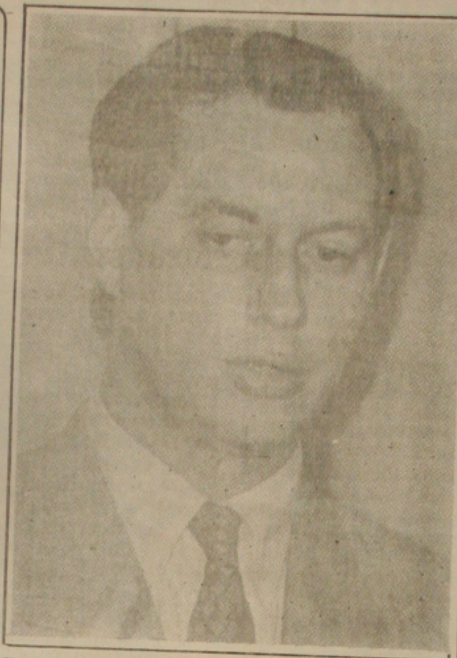
Ciro: não aos sindicalistas

O ministro disse que a situação de alguns ministérios, como o dos Transportes, é de absoluta falta de recursos. "Não existe mais dinheiro para a recuperação das estradas."