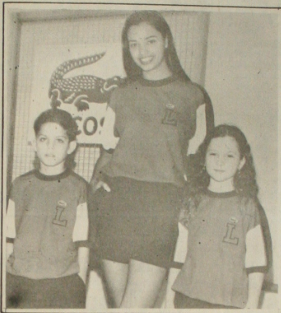
Um look na coleção Primavera/Verão da marca francesa Lacoste.