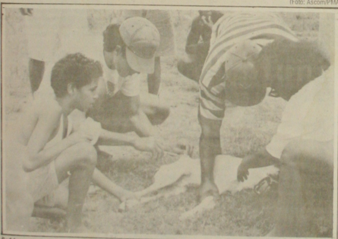
Saúde pretende vacinar 40 mil animais até amanhã somente em Aracaju