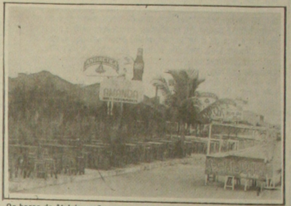
Os bares da Atalaia serão outra vez fiscalizados pela Vigilância Sanitária

Agentes da Divisão de Vigilância Sanitária da Secretaria Municipal de Saúde voltam a fiscalizar hoje e amanhã bares e restaurantes da orla marítima de Aracaju. O objetivo é checar as condições de funcionamento estabelecimentos, que devem estar cumprindo a rigor as normas de higiene, principalmente quanto à manipulação e à qualidade dos alimentos servidos à população. (Página 4A).