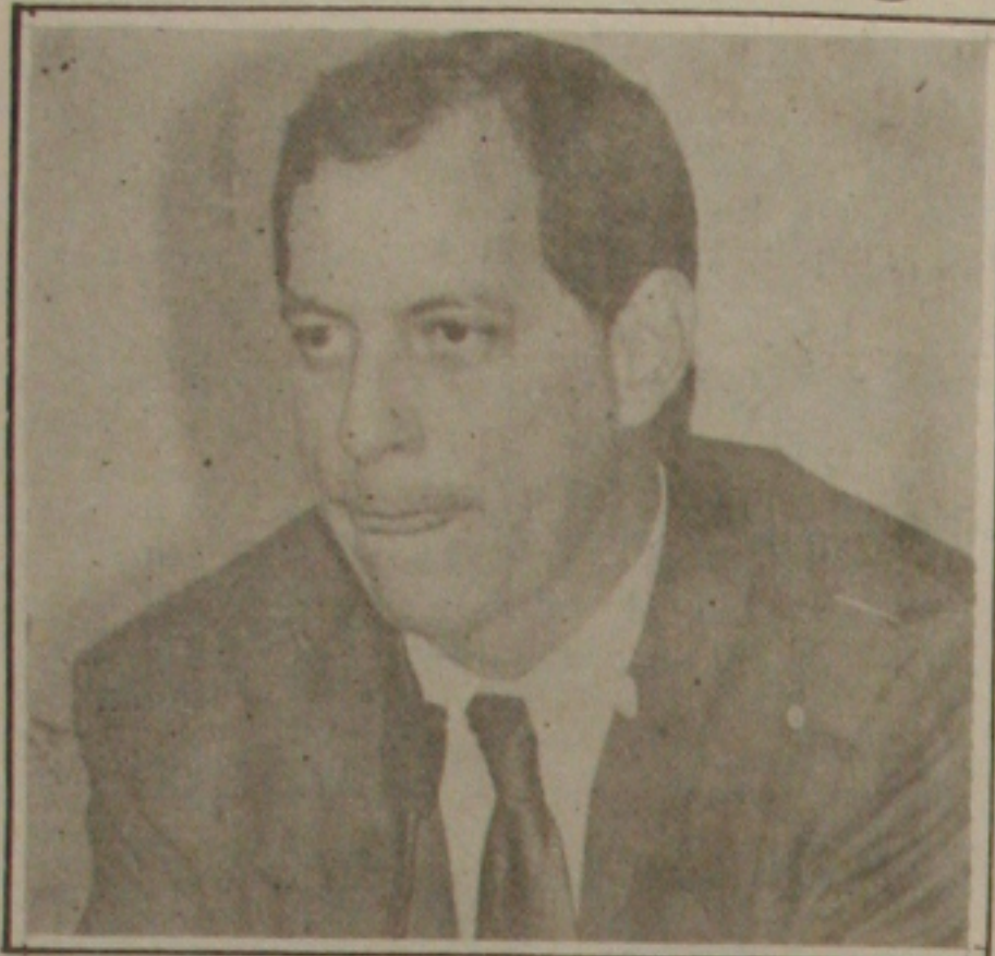
Ciro Gomes diminuiu alíquotas de importação, para garantir abastecimento.