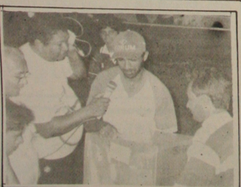
A Campanha Gol da Sorte continua incentivando o futebol sergipano e premiando aquele que comparece aos estádios de futebol. Em todos os jogos realizados na capital e no interior são efetuados sorteios nos intervalos. Na capital uma bicicleta e um televisor colorido. No interior um rádio e uma bicicleta. É forma encontrada pela Federação junto com a coordenação da campanha, para manter o futebol sergipano prestigiado e com o torcedor voltando a comparecer aos estádios e principalmente corrigindo os rumos da campanha Gol da Sorte.