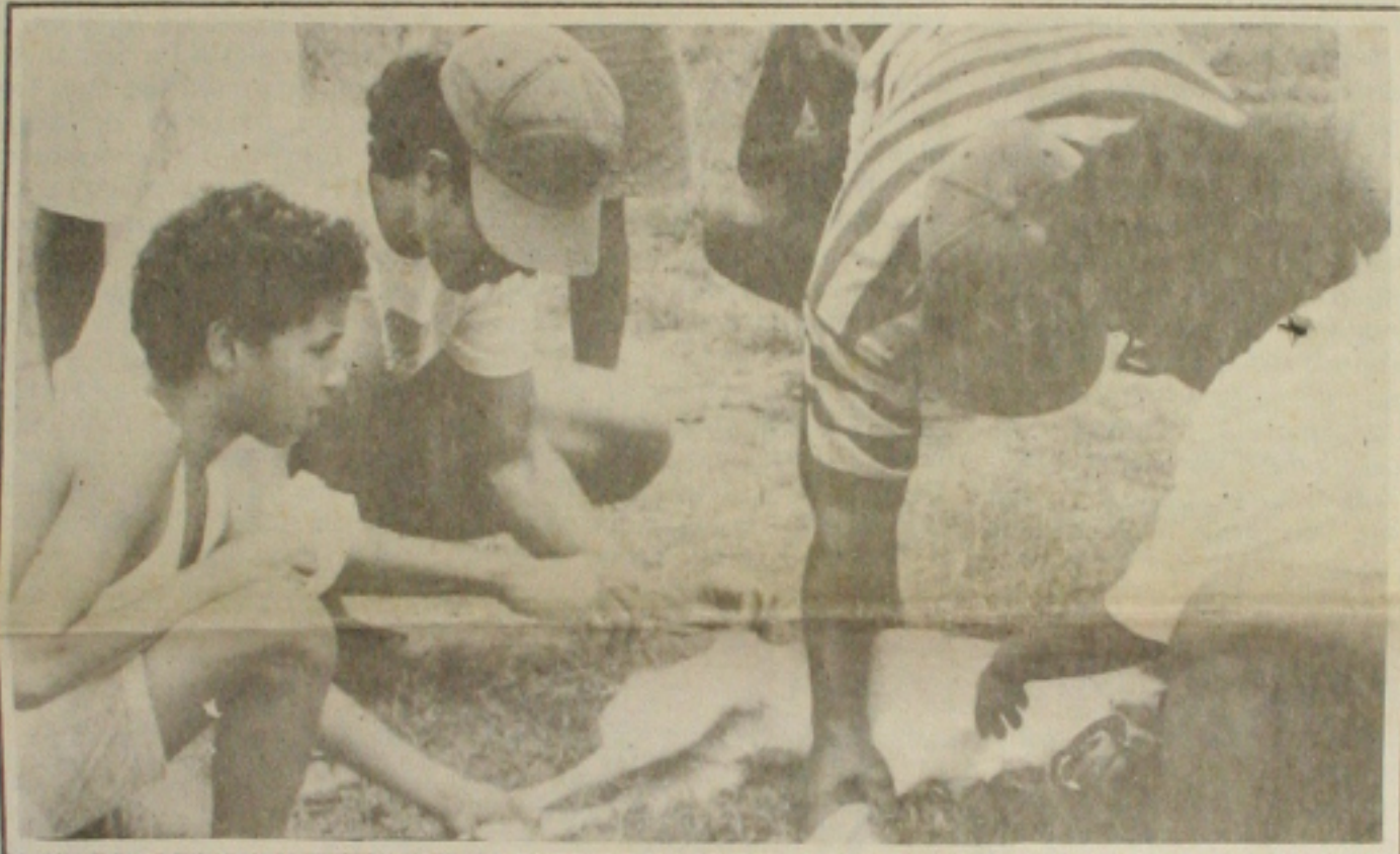
Ontem, centenas de cães foram vacinados em vários pontos da cidade. (Página 4A)