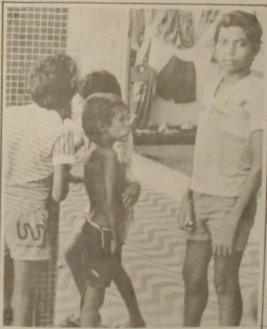
Menores vão ser úteis no campo e aprender o que é ser um cidadão.

A idéia já está passando das fronteiras sergipanas e os Estados do Rio Grande do Sul e Mato Grosso do Sul, onde a agricultura é base da economia, já fizeram contatos, para que Eduardo faça uma exposição desse projeto que vai ser pioneiro em Sergipe. É a questão social sendo tratada com seriedade, por pessoas que desejam cumprir com a sua parte na salvação de uma parte desamparada pelo processo social vigente no País.