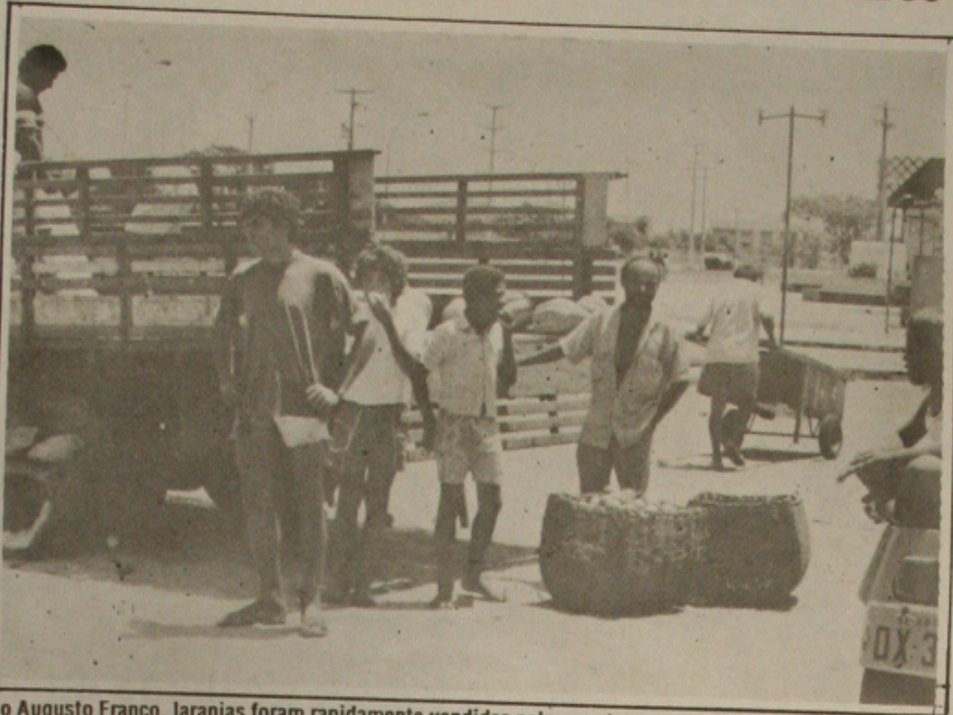
No Augusto Franco, laranjas foram rapidamente vendidas pelos produtores.

TERRENO NA PRAIA DO ABAÍS medindo 20x30m 2 , esquina com ABAÍS PRAIA CLUBE, a 5m da Rodovia Lina Verde. Tratar tel: 224-3601.