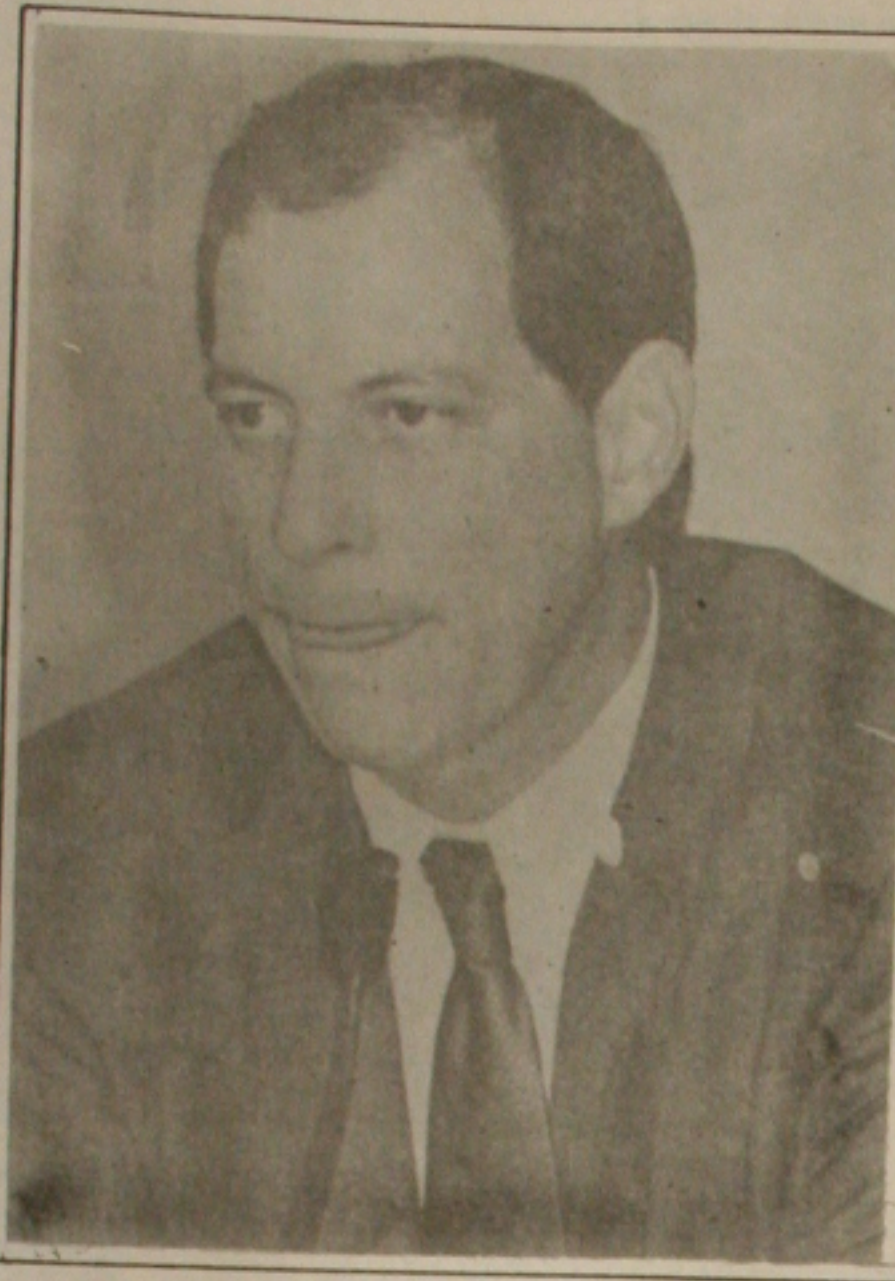
Ciro: liberação de importados

A abertura do mercado brasileiro faz parte da negociação do Mercosul, mas com uma diferença: o Brasil se antecipou ao Paraguai, Uruguai e Argentina, que cumprirão o acordo e somente praticarão a redução das alíquotas a partir de janeiro do próximo ano. O governo brasileiro, no entanto, decidiu utilizar a redução das alíquotas como instrumento político para enfrentar as pressões de aumentos de preços no mercado interno, garantindo a queda da inflação nos próximos meses. E