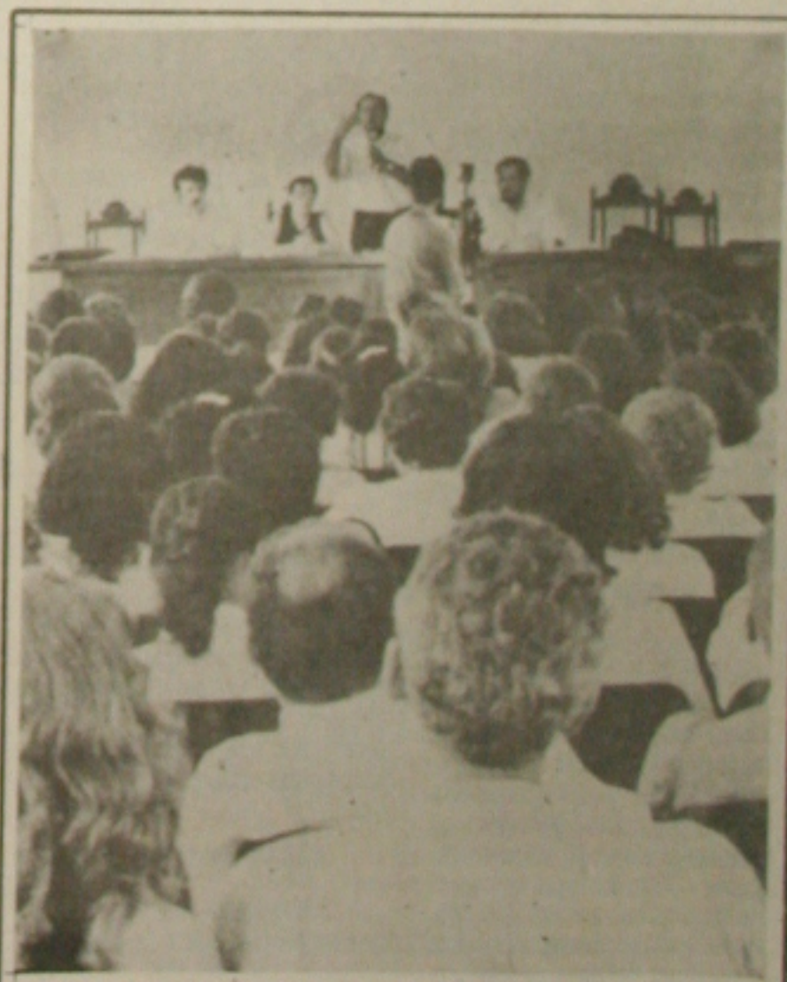
Albano expôs ontem suas propostas de Governo aos professores

O senador Albano Franco, candidato do PSDB ao Governo do Estado, comanda hoje Passeata da Vitória, que será realizada em Aracaju, com a participação de todos os candidatos e lideranças da coligação Sergipe Tem Futuro, que reúne PSDB, PFL, PMDB, PPR e outros oito pequenos partidos. A concentração será às 14 horas, na avenida Gentil Tavares, em frente ao Ceasa. Albano e seus aliados vão desfilar pelas principais ruas da cidade, passeando pela avenida Barão de Maruim, rua Itabaiana, calçada da João Pessoa até a praça Fausto Cardoso, onde haverá um rápido comício. A expectativa dos organizadores é de que será a maior passeata da história de Aracaju, e a última da campanha de Albano Franco rumo ao Palácio Olímpio Campos. Ontem o senador explicou suas propostas de Governo para os professores. (Página 3A).