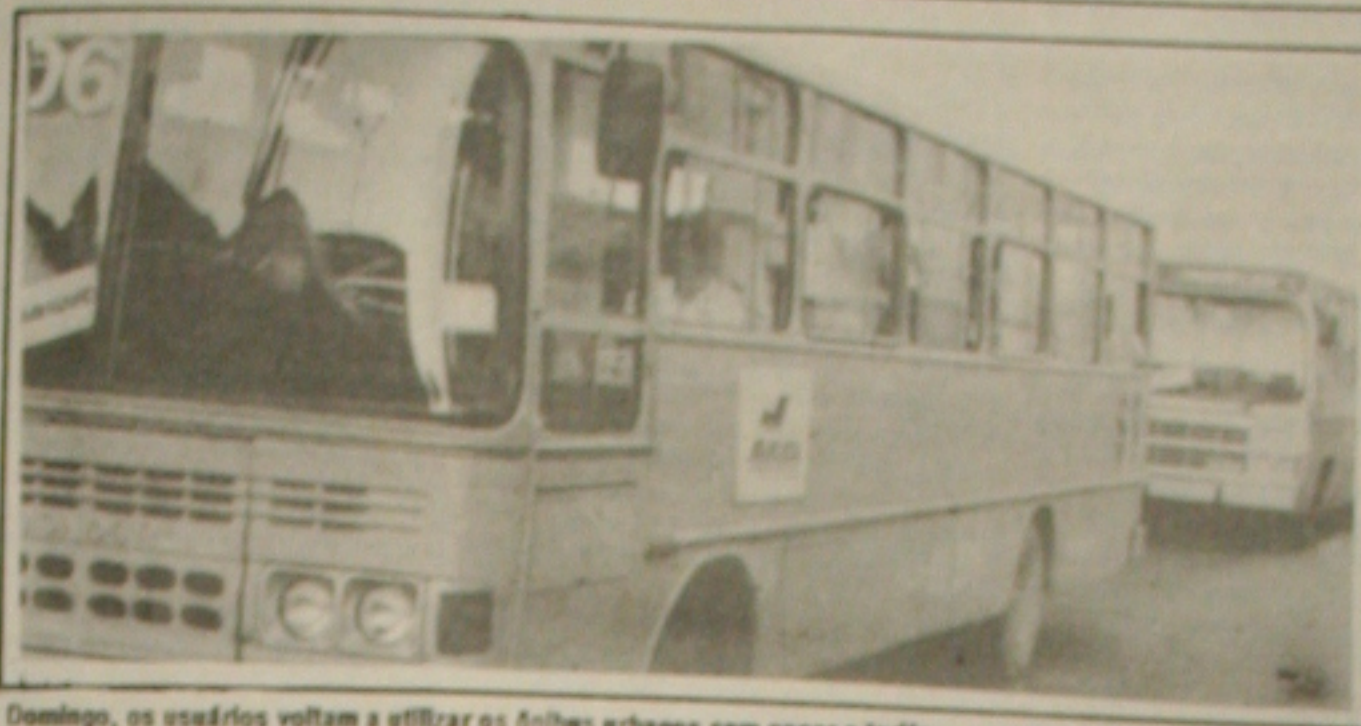
Domingo, os usuários voltam a utilizar os ônibus urbanos sem pagar a tarifa

Federal durante um ano. Ao contrário do ano passado, o Estado do Amazonas ficou de fora do decreto. (Página 4B)