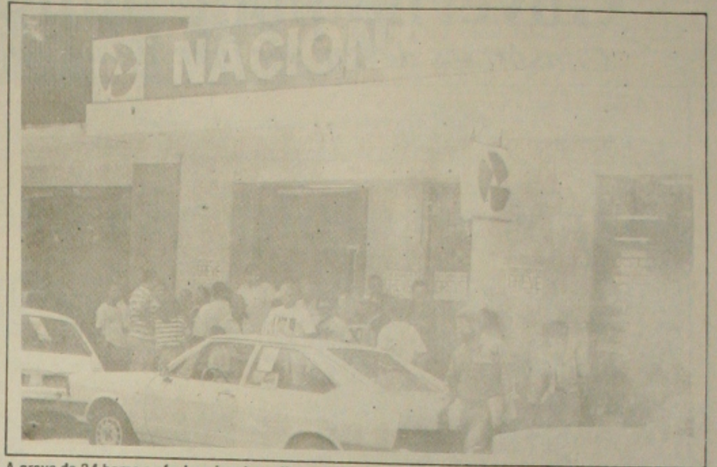
A greve de 24 horas a nível nacional paralisou alguns bancos em Aracaju.