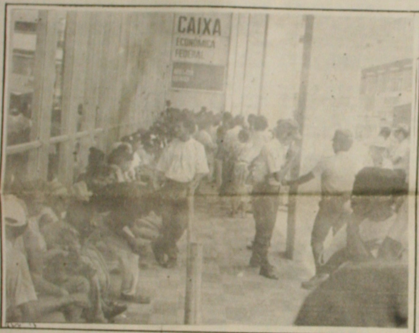
Na Caixa, a mobilização dos economistas foi suficiente para atrasar o expediente em uma hora