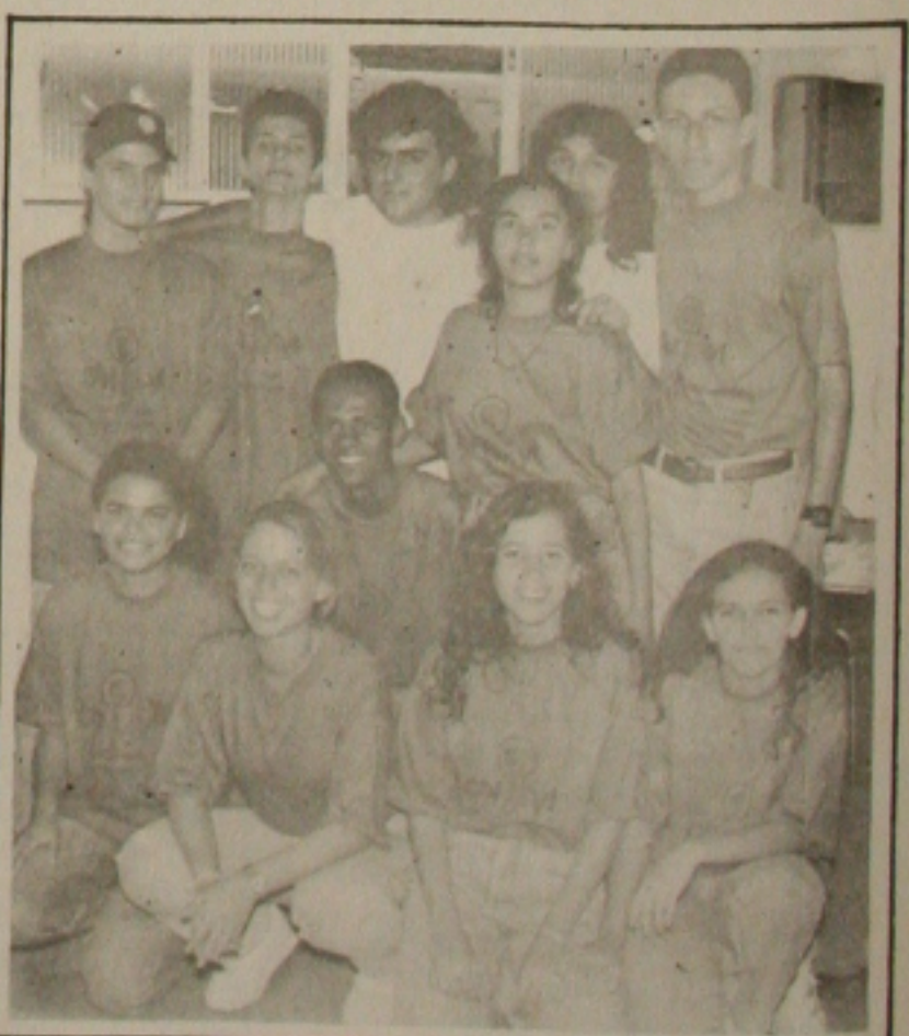
Equipe "Aluisio de Azevedo" integrante do Colégio Visão.

TERRENO NA PRAIA DO ABAIS medindo 20x30m 2 , esquina com ABAIS PRAIA CLUBE, à 5m da Rodovia Linha Verde. Tratar tel: 224-3601.