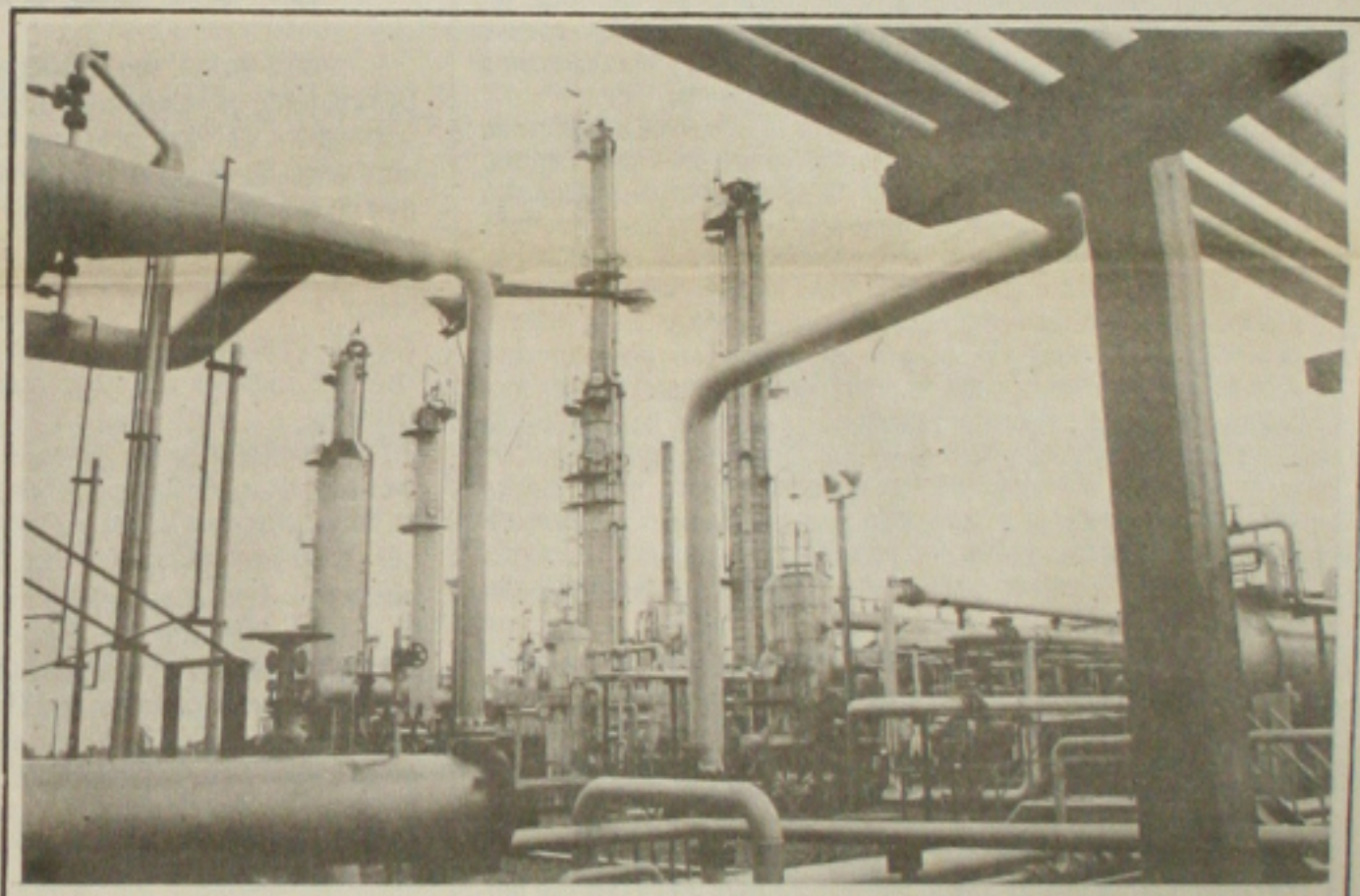
A Petrobrás garante a distribuição de gás de cozinha para os sergipanos.

A Superintendência da Região de Produção no Nordeste (RPNE) aguarda os acontecimentos de Brasília em torno das negociações que estão sendo mantidas entre a Federação Única dos Petroleiros e representantes do governo Itamar Franco. "Estamos na expectativa destas negociações. Esperamos que haja um acordo satisfatório para ambas as partes", ressaltou Seixas.