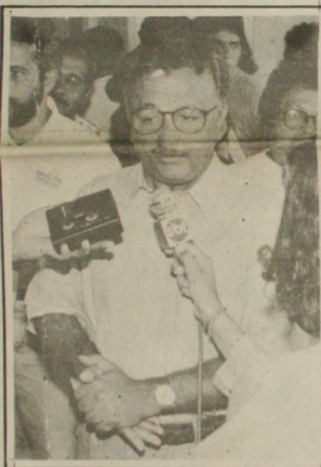
Jackson se diz cauteloso mas crê na vitória...