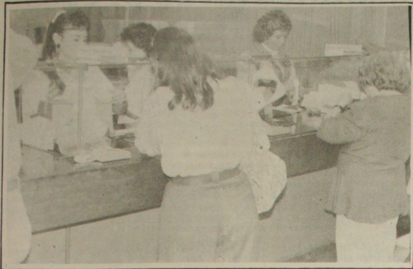
Os bancários sergipanos voltam a se reunir hoje e podem definir greve para o dia 19.