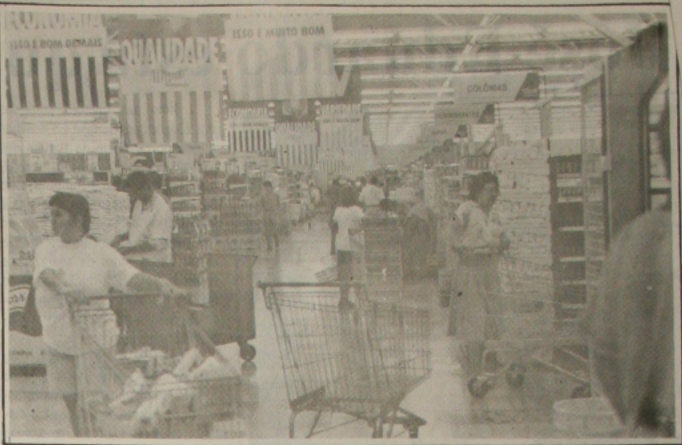
Os supermercados podem retomar as promoções ainda este mês.