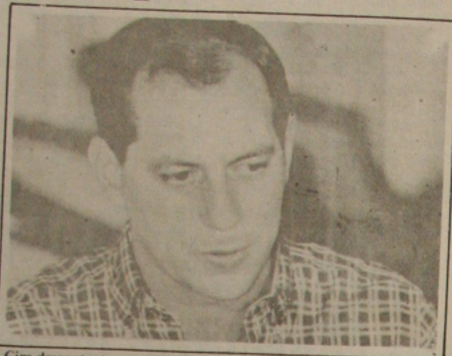
Ciro descontente com abuso dos empresários vai usar importação contra quem quiser maior lucro