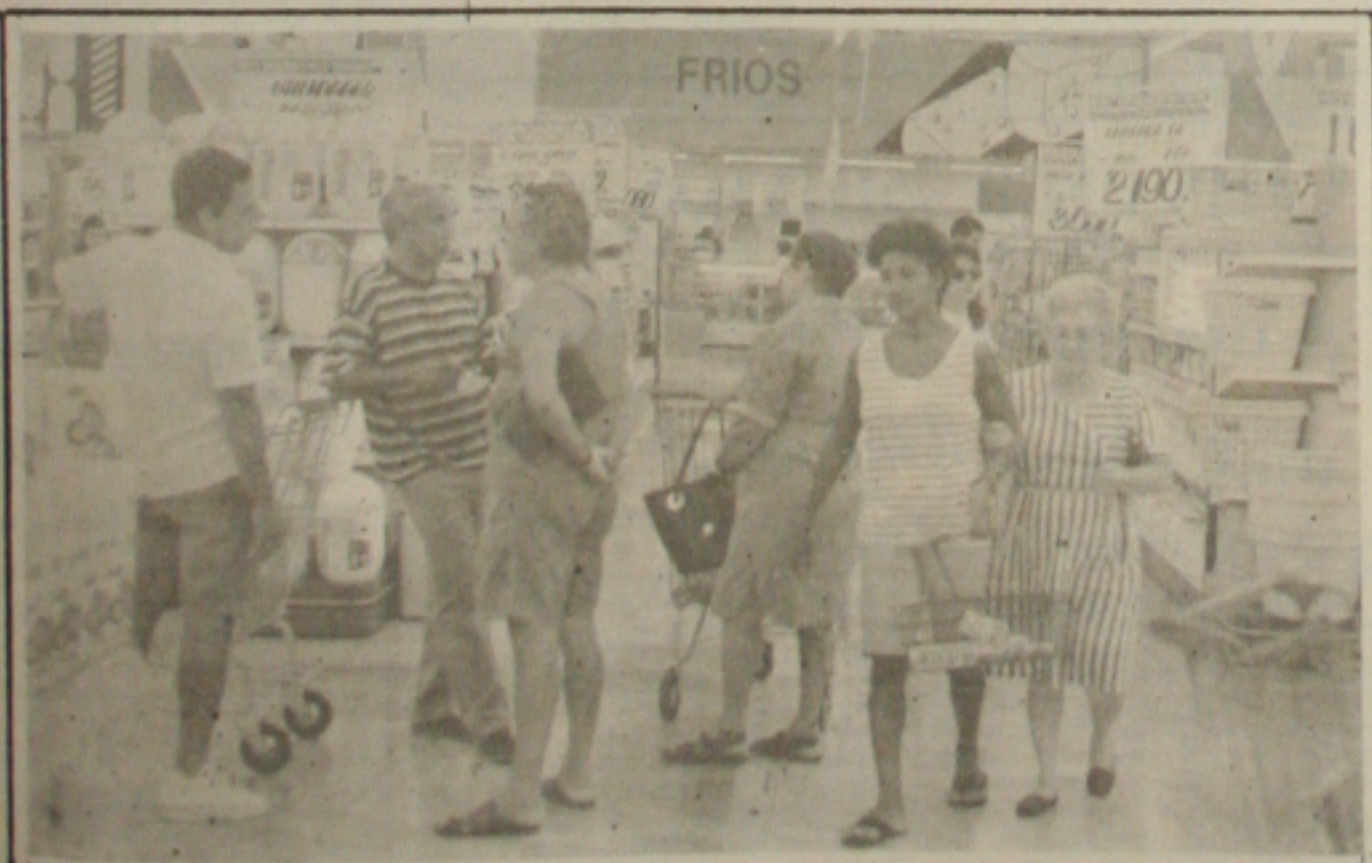
Nos supermercados, as promoções desapareceram temporariamente mas devem recomeçar nos próximos dias.

os aliados para frear as especulações. Outro compromisso do virtual presidente eleito do país hoje será sua primeira entrevista coletiva depois das eleições, marcada para as 11h30 na Sala Martins Pena do Teatro Nacional. Sérgio Motta afirmou ainda que não há uma definição sobre a participação de Fernando Henrique Cardoso na campanha dos governadores no segundo turno. Segundo ele, isso só acontecerá quando o quadro sucessório nos estados estiver completamente definido. (Pág. 4B)