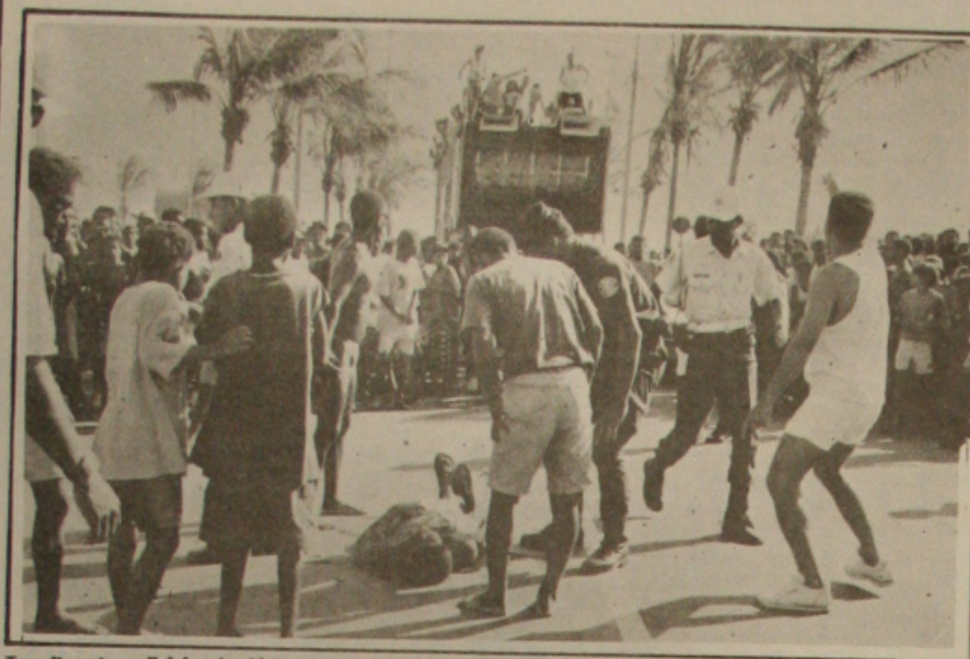
Tumulto entre policiais e banhistas depois do estudante baleado