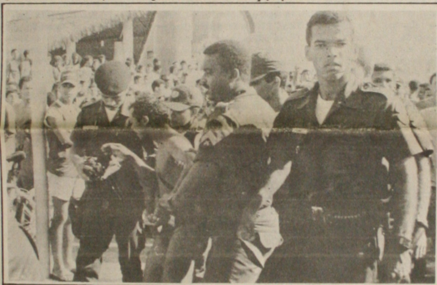
Os soldados da PM são flagrados, arbitrariamente, arrancando a força a máquina de um fotógrafo amador que registrou o crime.