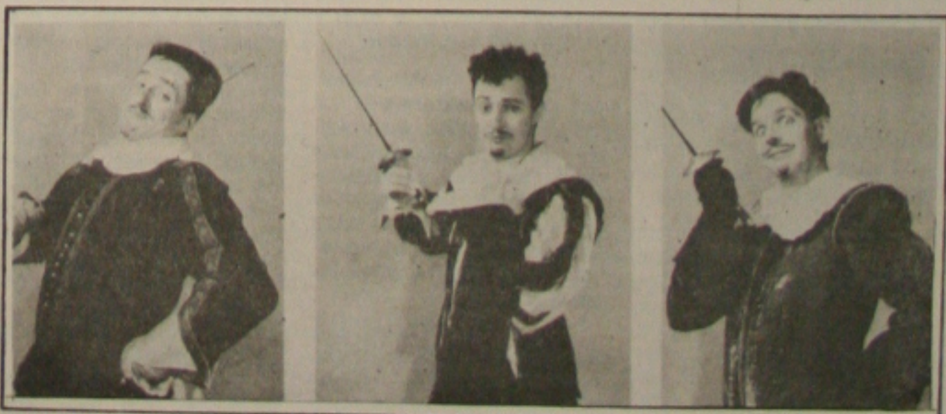
Os Três Mosqueteiros da companhia da inglesa The British Council.

Durante a greve, paralisaram 400 trabalhadores da construção civil, sendo 200 da Norcon e 200 da Cosil. No início houve uma adesão de 100%. No decorrer do movimento paralisaram 50% dos empregados da Norcon voltaram a trabalhar, furando, assim a greve.