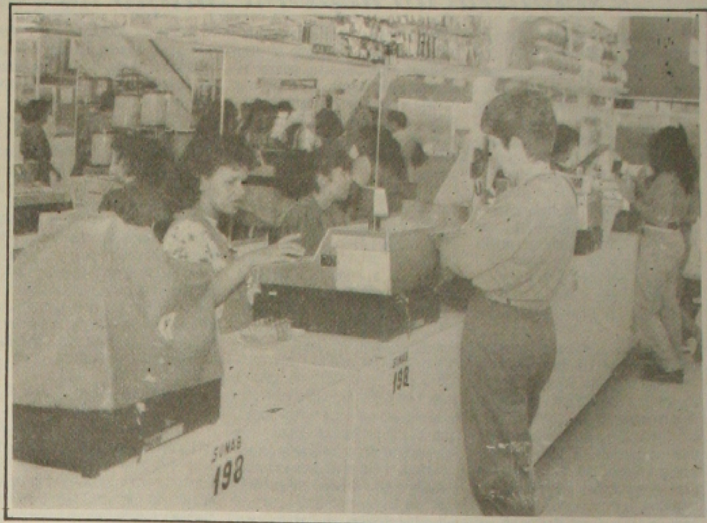
O Plano Real está provocando demissões em massa nas lojas de Aracaju.

Ronildo disse ainda que a expectativa dos comerciantes é que os lojistas se tornem mais humanos e já comecem a contratar o pessoal para o final do ano, quando é grande o movimento nas lojas do centro comercial de Aracaju e do Shopping Riomar. Concluiu dizendo que o índice de desemprego também está grande no interior do Estado.