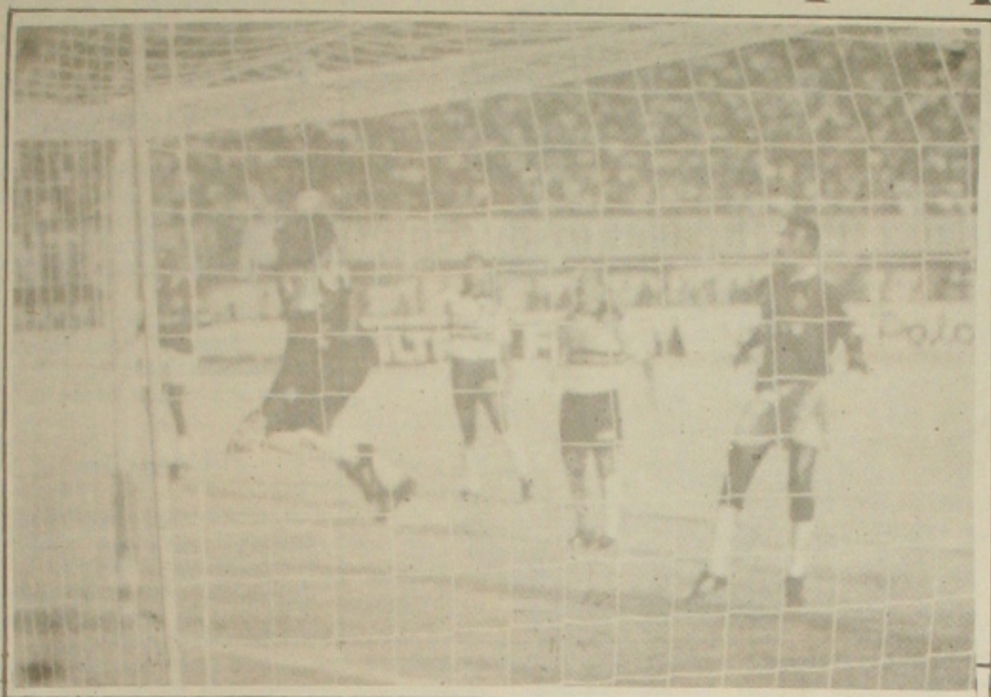
O Sergipe faz rodada dupla com o Confiância domingo