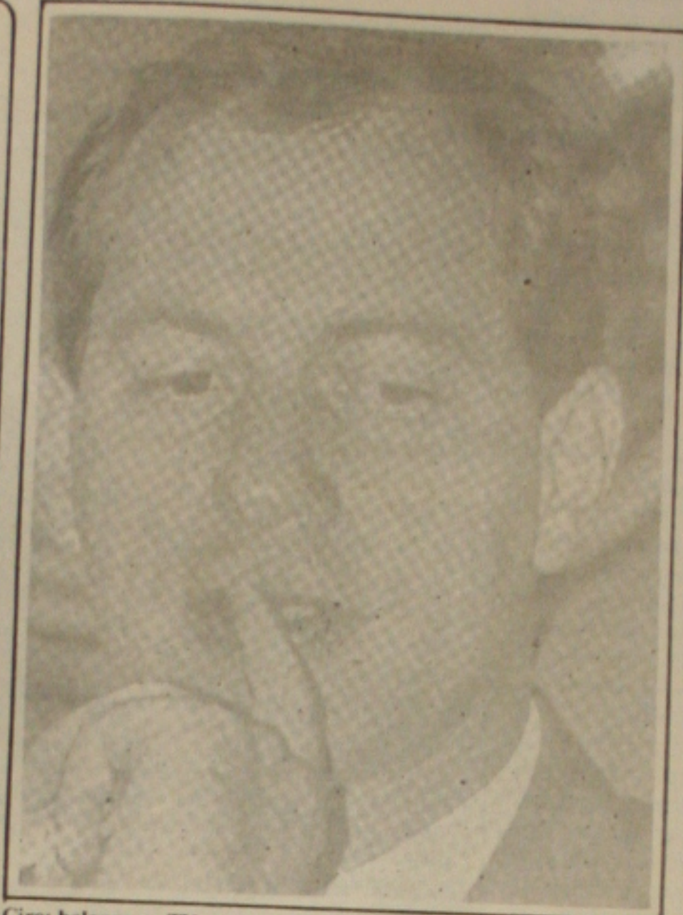
Ciro: balanço na TV

Constituição e de Justiça decidiu cassar seu registro, o que foi confirmado pelo plenário. Renunciaram ao mandato e não se candidataram à reeleição os ex-deputados Cid Carvalho (PMDB-MA), Genbaldo Correia (PMDB-BA), Manoel Morcira (PMDB-SP) e João Alves (sem partido-BA). Os deputados Ricardo Fiuza (PFL-PE), Ézio Ferreira (PFL-AM), Anibal Teixeira (PTB-MG) e Daniel Silva (PFL-MA) não concorreram à reeleição. João de Deus Antunes (PPR-RS), acusado de desviar cerca de US$ 7 mil de uma entidade filantrópica evangélica se candidatou e não foi reeleito. O senador Ronaldo Aragão (PMDB-RO), inocentado pelo plenário do Senado por falta de quórum, também desistiu de tentar a reeleição.