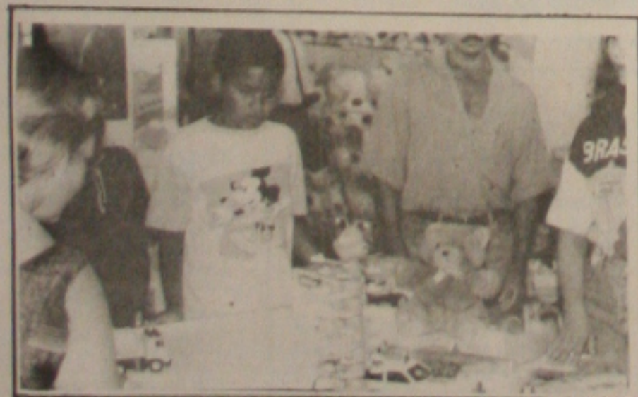
Os preços dos brinquedos, ainda considerados altos para a maioria da população, não têm estimulado os consumidores.