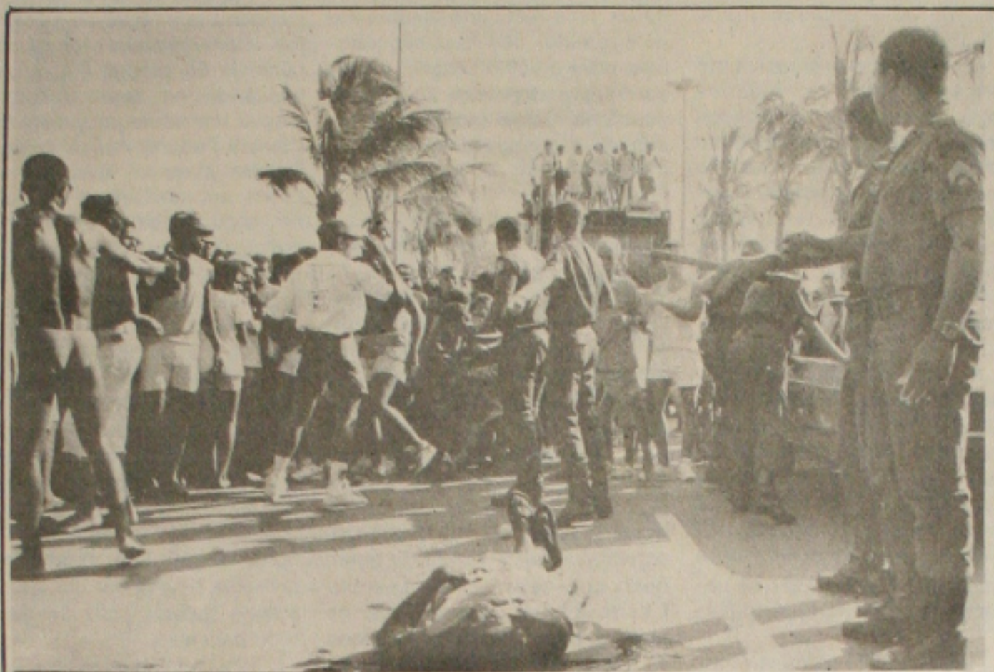
O estudante cai morto após ser atingido com um tiro na cabeça, a queima roupa.