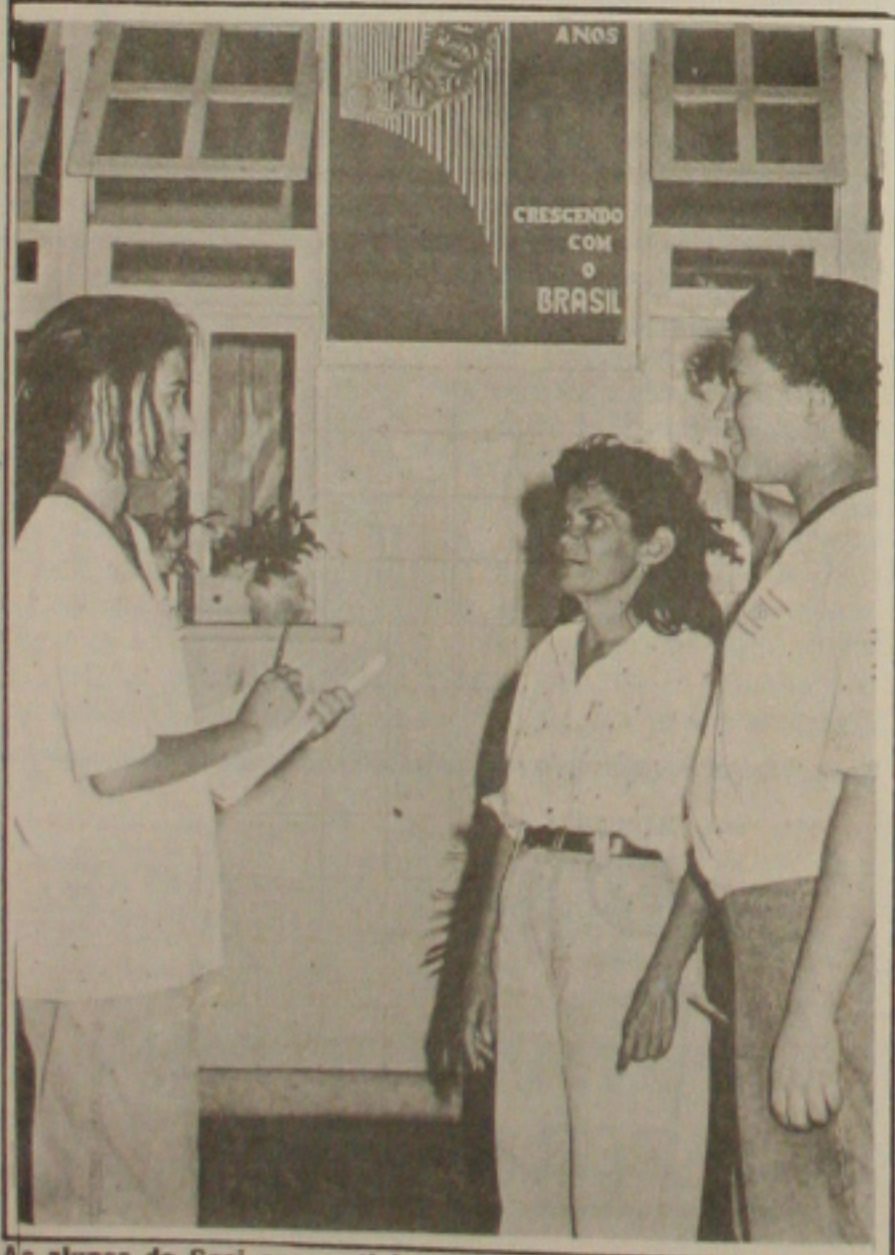
As alunas do Sesi que participaram da Ciranda da Ciência.

Depois da temporada brasileira The Mime Theatre Project of London seguirá para Santiago do Chile.