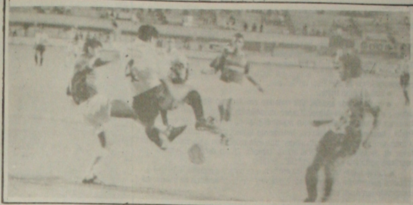
Sergipe manteve a invencibilidade no campeonato

A partida foi muito ruim tecnicamente. O Maruinense com um maior predomínio de jogo, não sabia transformar em gols as oportunidades criadas. Por outro lado, o Sergipe era uma equipe acomodada. A igualdade no marcador, dava ao Sergipe, o direito de continuar líder e o time não forçava muito as jogadas ofensivas. O time se arrastava numa