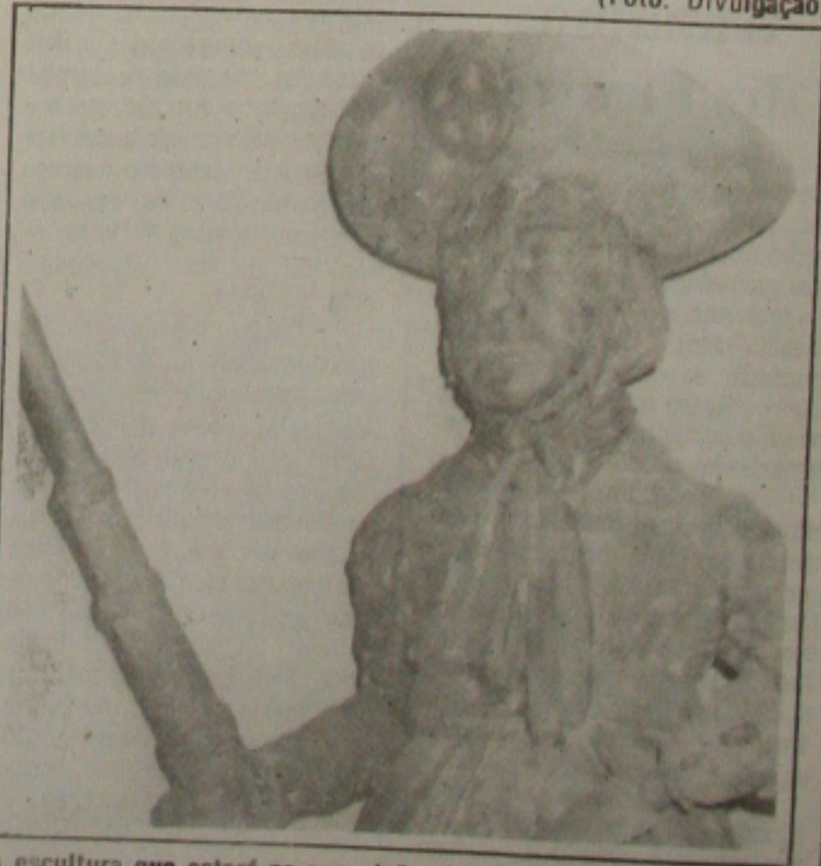
A escultura que estará na exposição do Shopping.