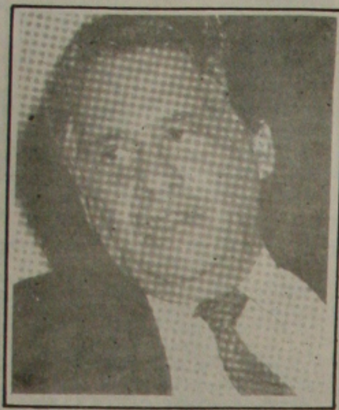
Cardoso: medidas enérgicas

Ele defende a adoção de medidas enérgicas e admitiu transferir a sede do Governo