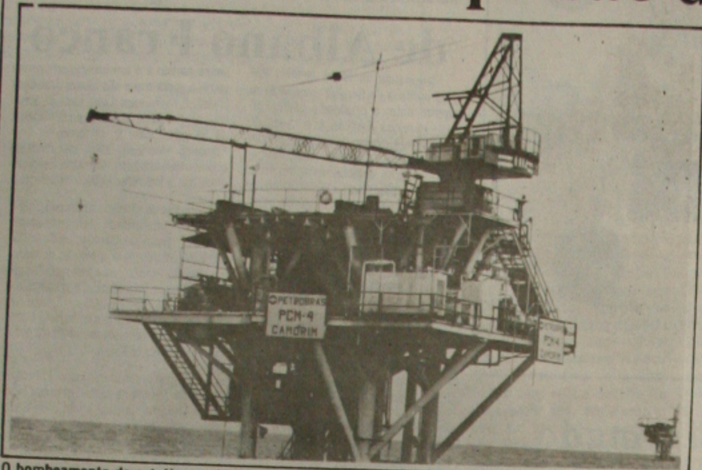
O bombeamento de petróleo será melhorado com a inauguração do sistema multifásico.