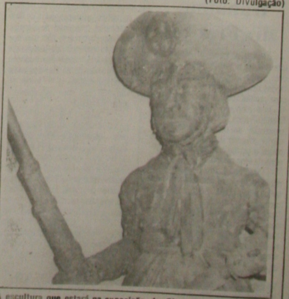
A escultura que estará na exposição do Shopping.