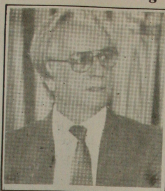
Itamar: estado de defesa