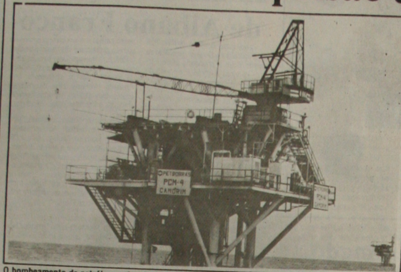
O bombeamento de petróleo será melhorado com a inauguração do sistema multifásico.