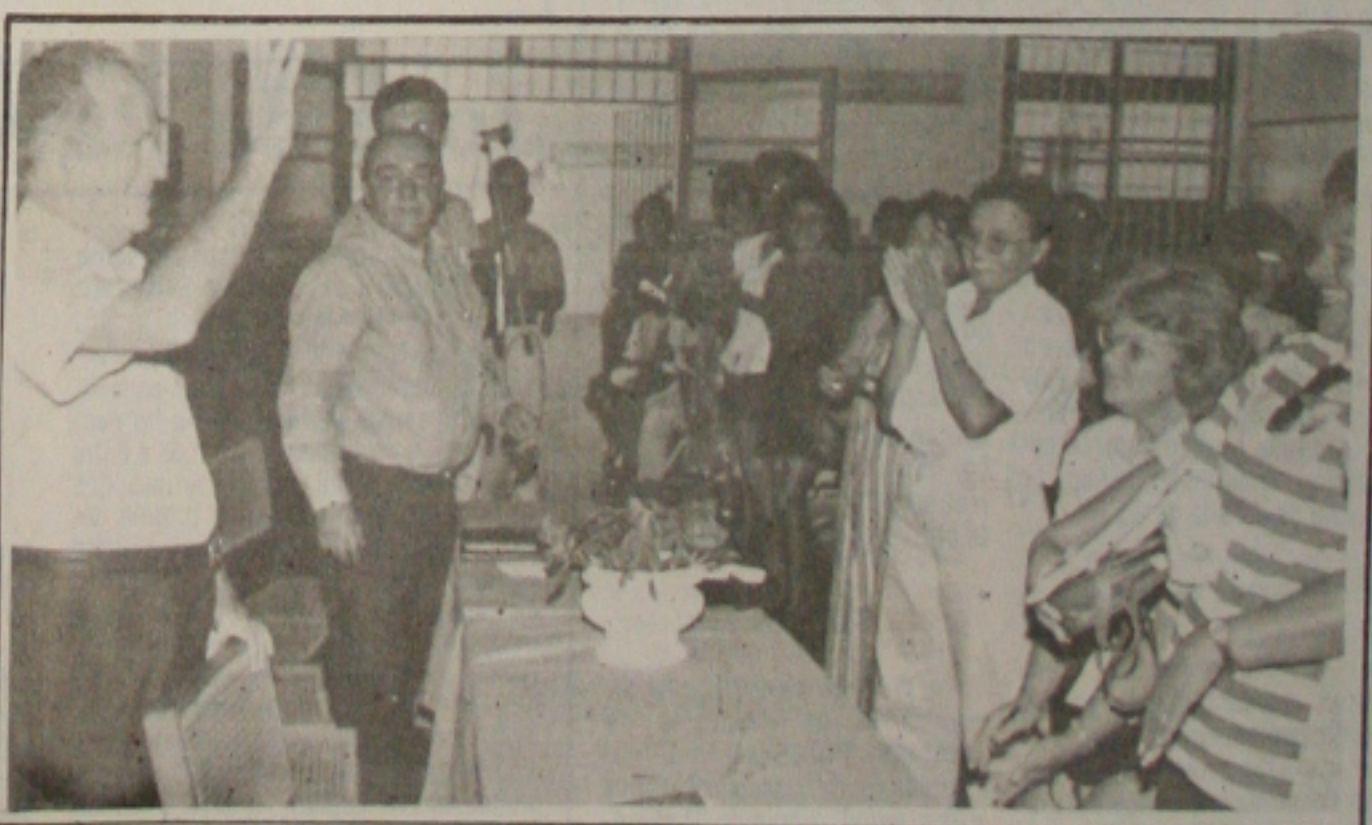
Durante a campanha, Albano tem mantido encontros com várias categorias, como os agentes de saúde.

"Sergipe precisa muito do Governo Federal e hoje contamos com um presidente que é meu amigo, cor-religionário e que muito contribuirá para o sucesso da nossa administração". Foi o que declarou ontem o candidato da coligação "Sergipe Tem Futuro", senador Albano Franco (PSDB) que na próxima segunda-feira se reunirá, em São Paulo, com o presidente eleito Fernando Henrique Cardoso. Durante o encontro, o presidente eleito reafirmará seu apoio à candidatura do senador tucano, definindo inclusive sua participação na campanha do segundo turno. (Página 3A)