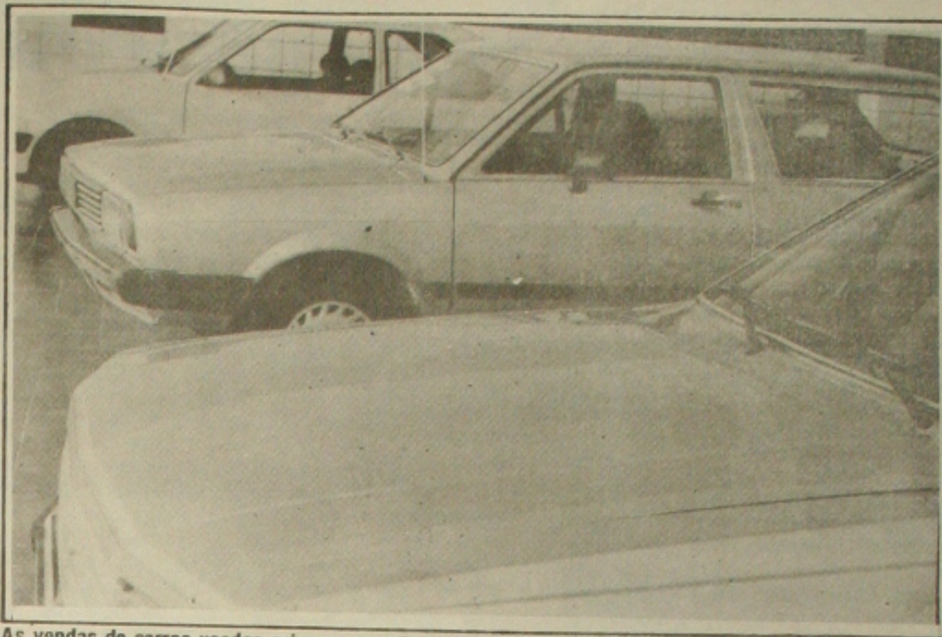
As vendas de carros usados caíram em mais de 50% nos últimos meses em Aracaju.

Apesar da retração no mercado, os comerciantes estão otimistas acreditando que as vendas vão crescer ainda este mês quando os assalariados começam a receber parte do 13º salário.