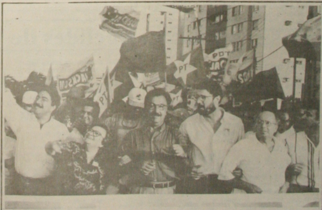
Jackson percorreu várias ruas da cidade ao lado de Erundina e Dante de Oliveira

Uma passeata, com a participação da ex-prefeita de São Paulo, Luiza Erundina (PT) e do Governador eleito do Mato Grosso, Dante de Oliveira (PDT) marcou ontem à tarde o encerramento, na capital, da campanha do candidato ao governo do Estado da coligação "O Povo na Frente". A caminhada percorreu várias ruas e avenidas até chegar à Praça Fausto Cardoso, onde foi realizado um comício para milhares de pessoas. (Página 3A)