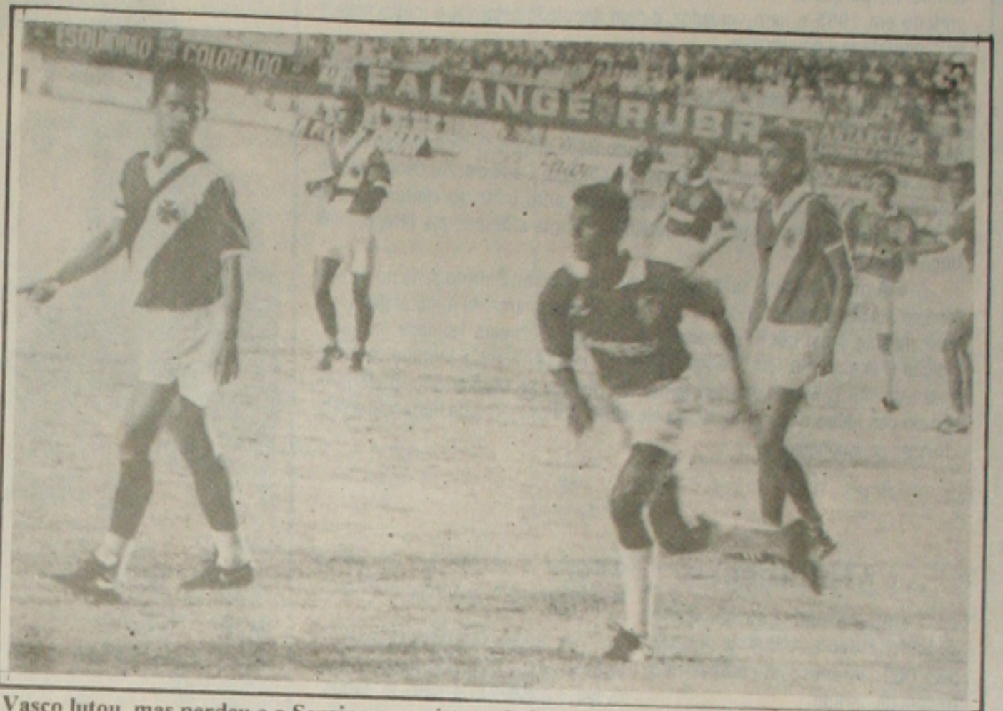
Vasco lutou, mas perdeu e o Sergipe conquista o título do segundo invicto