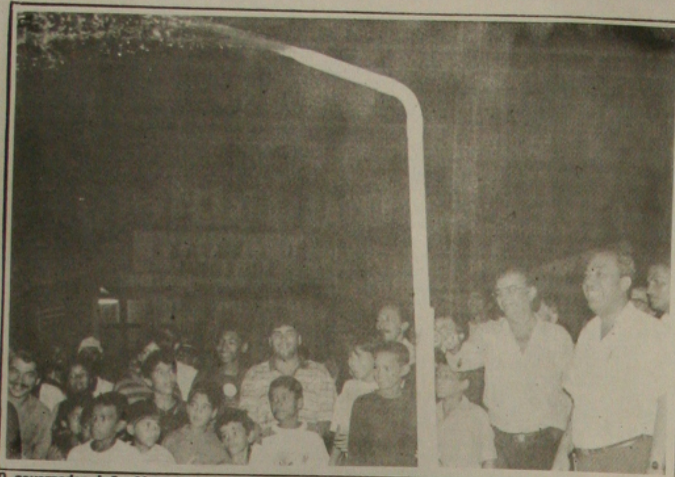
O governador João Alves leva mais água ao interior sergipano, beneficiando os pobres.

Moradores e turistas de São Cristóvão que visitam o Cristo daquela cidade estão revoltados com o abandono daquela área por parte da administração pública municipal. Eles não admitem que o maior ponto turístico do município não disponha de água em seu restaurante e esteja com o teto prestes a desabar.