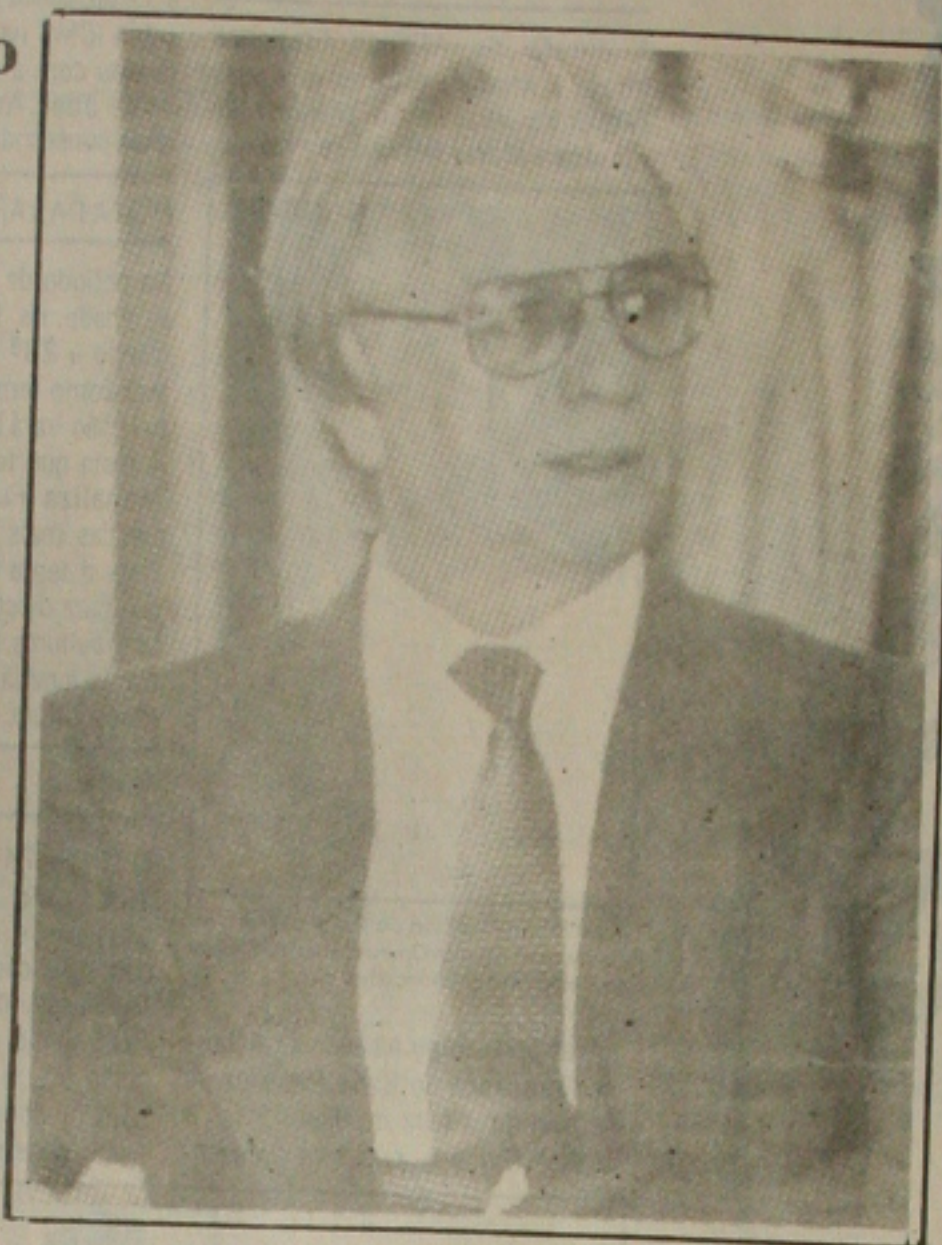
Itamar: mínimo de 100 dólares

Para o ministro da Administração Federal, o acordo com os petroleiros abre um precedente perigoso. "Realmente tem repercussões, tem consequências e é preciso discutir isso." Romildo Canhim negou a existência de funcionários fantasmas. Segundo ele, o que existe são funcionários que estão em disponibilidade, impossibilitados de serem transferidos ou removidos por ordem de própria justiça. Canhim assegurou não ter falado com Fernando Henrique sobre funcionários fantasmas ou o acordo do governo com os petroleiros.