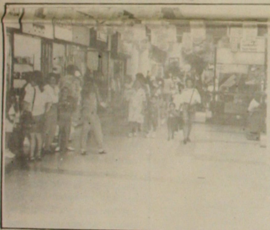
No shopping, apesar das medidas anti-consumo, as vendas não caíram muito