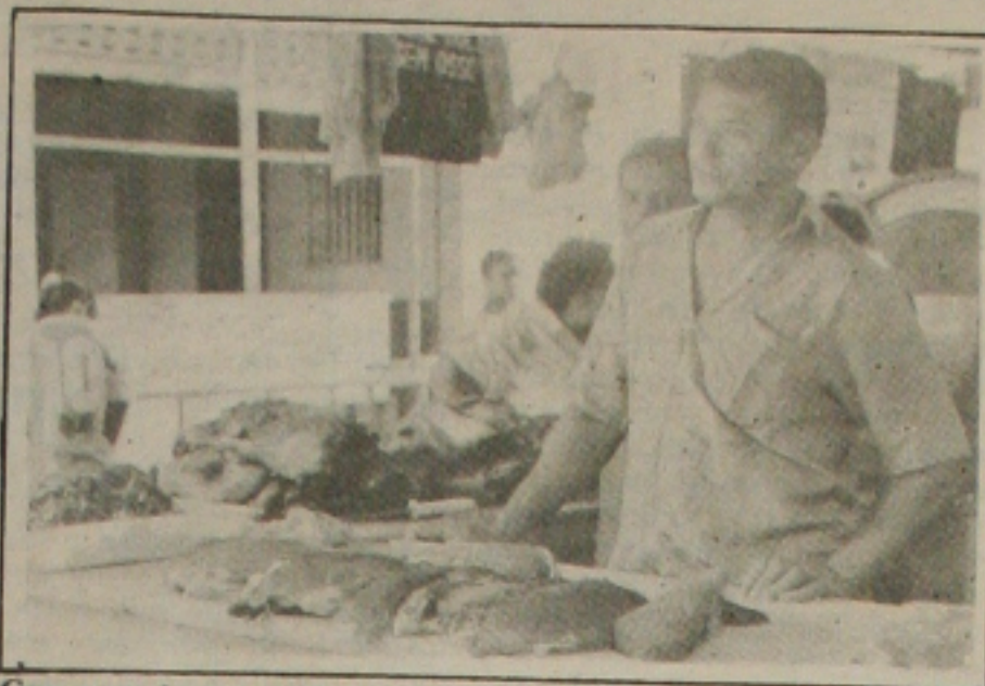
Com a queda nas vendas, a carne bovina está sobrando nas bancas do mercado

terados desde a adoção do programa econômico do Governo Federal e atribuem a retração no consumo do produto a uma possível queda no poder aquisitivo da população. Atualmente, o quilo da carne de primeira está custando em torno dos R$ 4,60. (Página 5A)