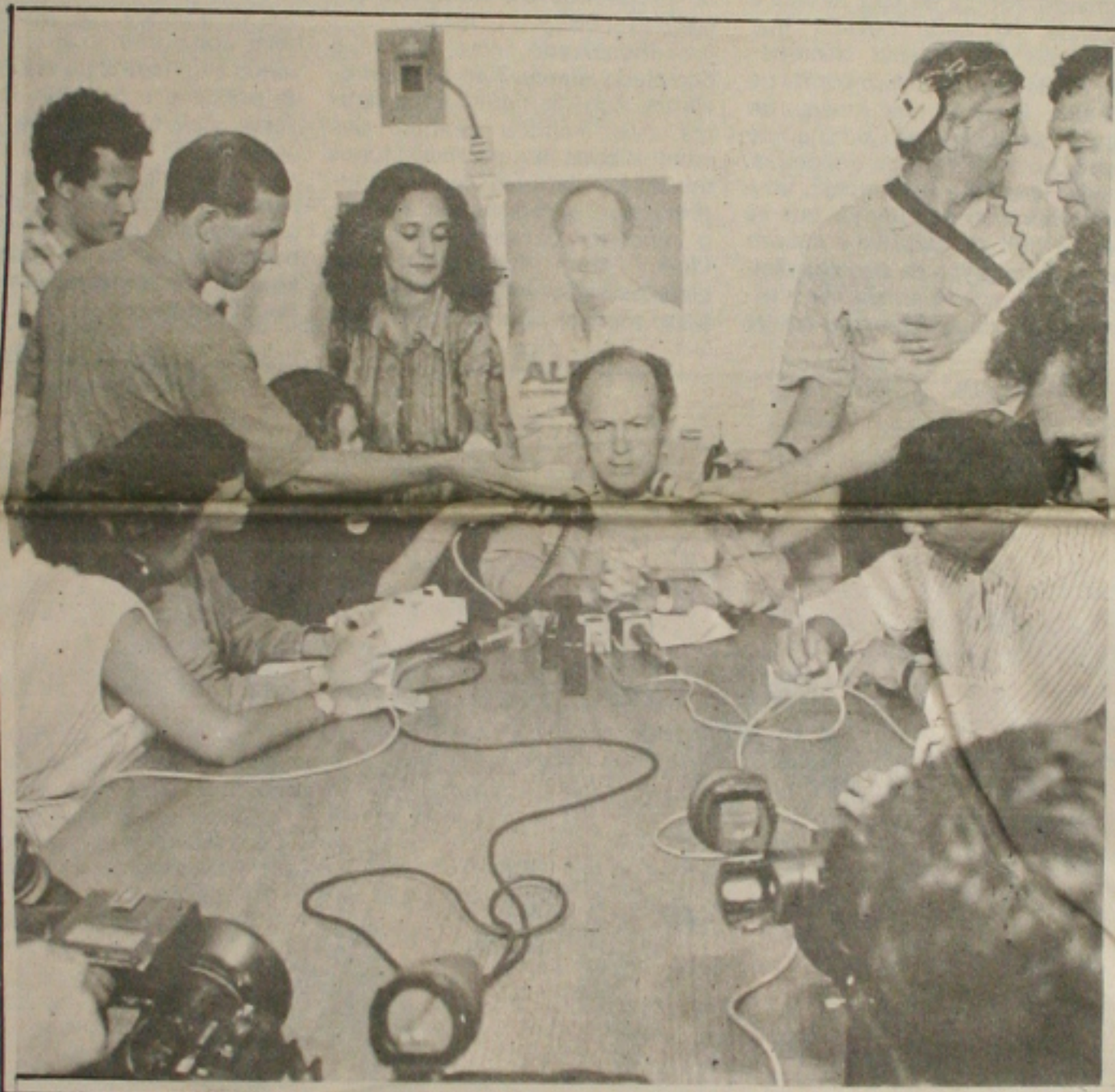
Albano prometeu racionalizar a máquina do Estado, mas sem demitir funcionários

A cidade de Boquim, distante cerca de 82 km de Aracaju, sediará a partir do próximo dia 24, a XXVIII Festa da Laranja. A programação, a ser desenvolvida até o domingo, dia 28, incluirá a realização da 21ª Exposição de Máquinas, Equipamentos e Frutas Cítricas além de atividades artístico-culturais, além da Coroação da Rainha da Laranja. (Página 5A)