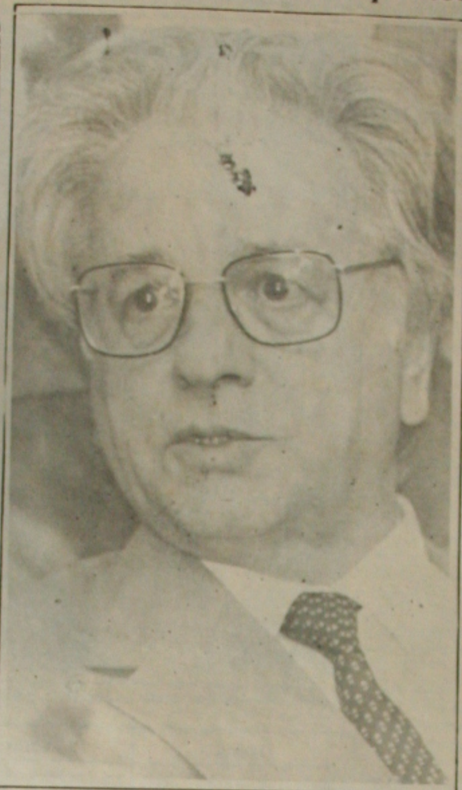
Itamar: revendo acordo