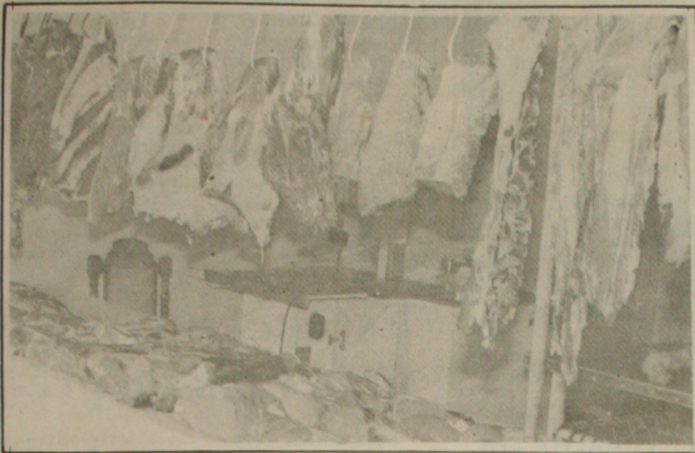
O preço da carne bovina dispara e o produto já começa a sobrar nos açougues.

Mas as ações da Chapa Ética não se limitarão ao apoio aos estagiários, simplesmente. Há uma série de outros incentivos previstos que serão executados durante a gestão desta equipe. Entre eles, destaca-se a realização do Prêmio Jurídico, uma atividade prevista no Estatuto do Advogado, nunca colocado em prática pela OAB. O prêmio será concedido ao melhor trabalho jurídico concorrente.