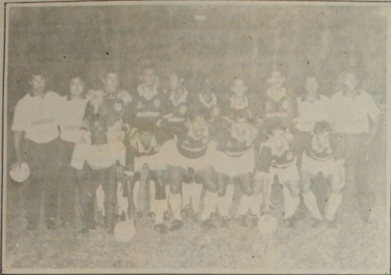
O Sergipe enfrenta o Confiança com o mesmo time que conquistou o título do segundo turno.