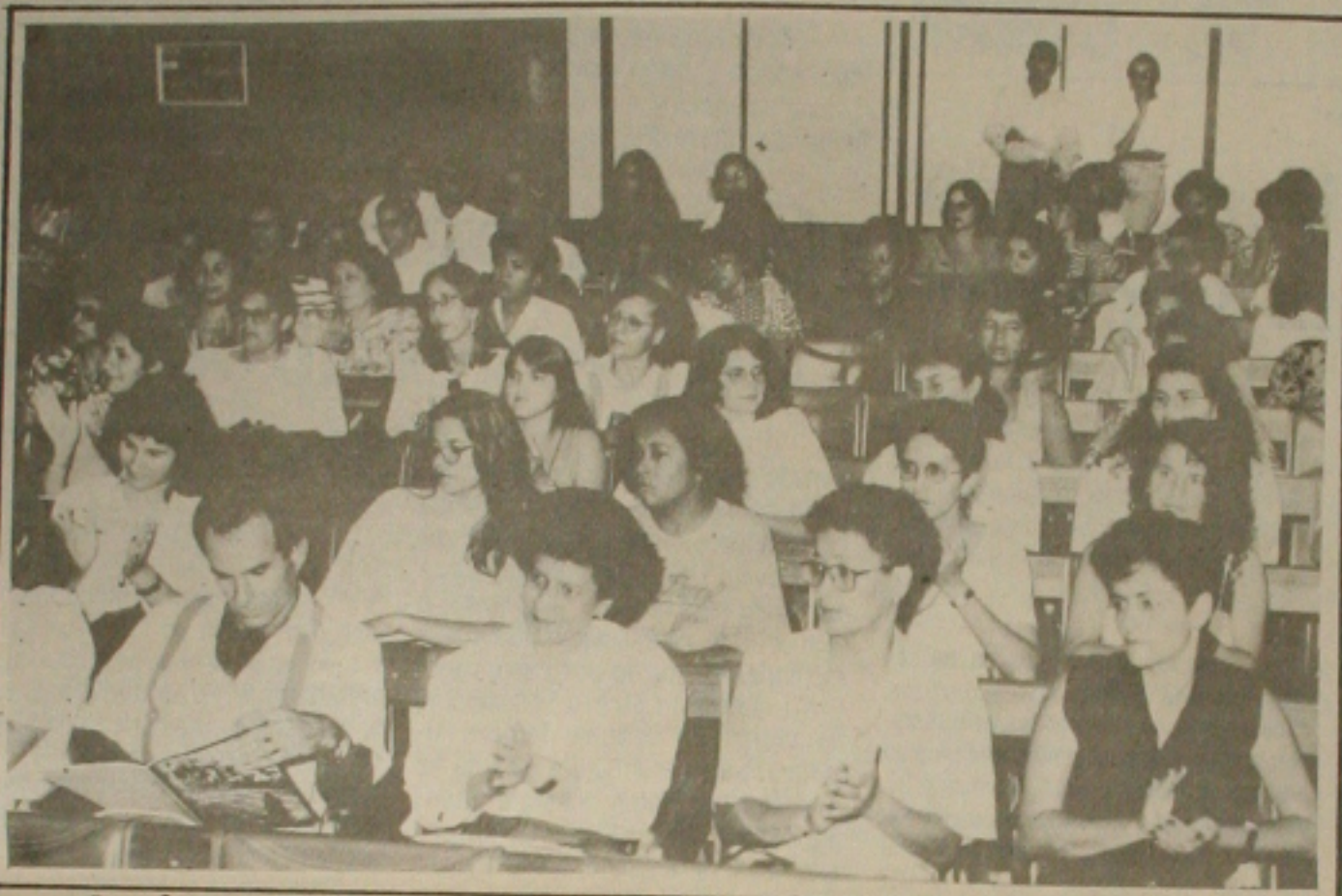
O auditório ficou lotado