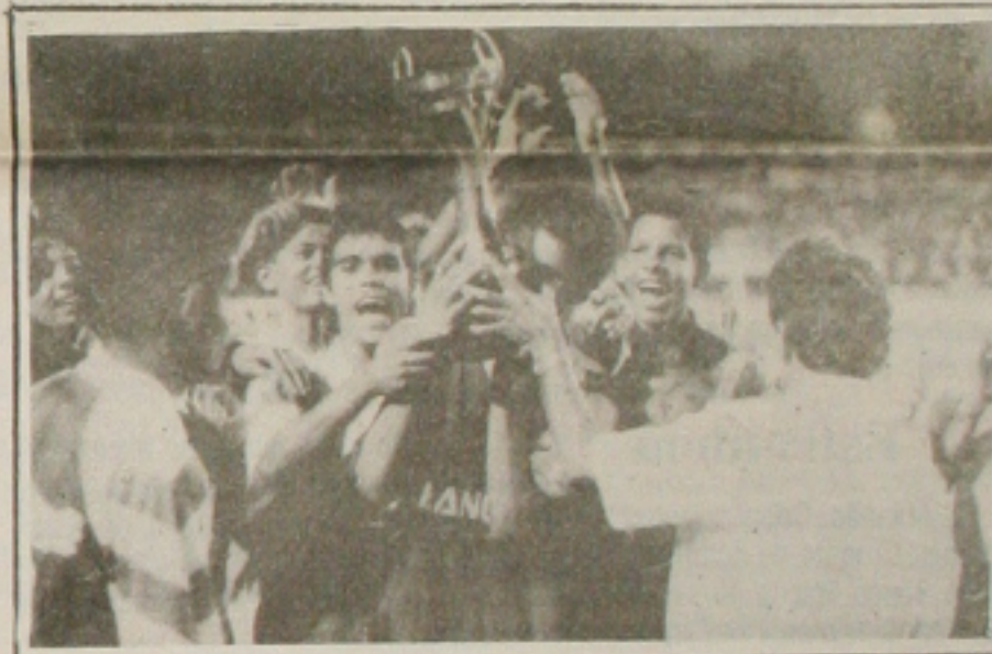
Depois da vitória dos juvenis a volta olímpica dos rubros.

em 1x1. Na prorrogação 0x0. Foi uma vitória marcante, porque o Confiança vinha invicto a mais de 40 jogos e sem receber gols há muito tempo.