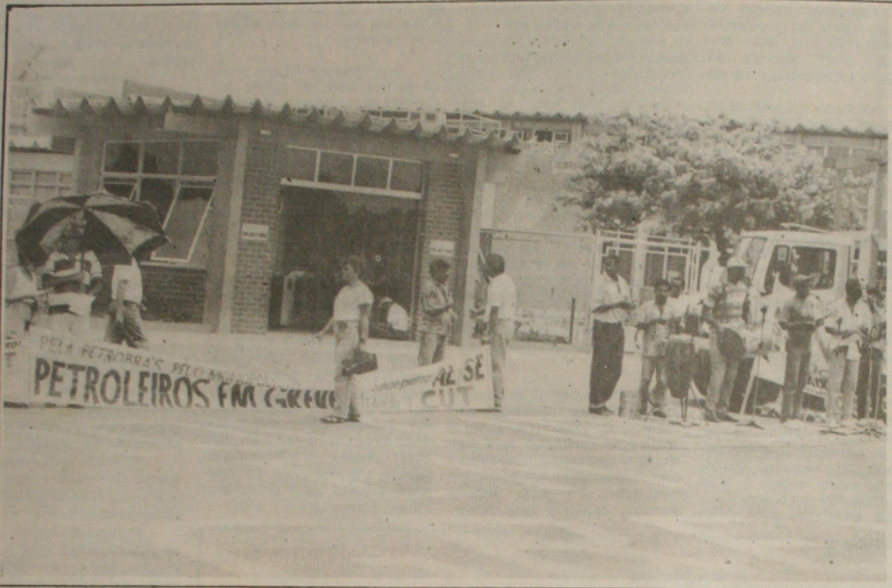
Com a decisão do governo, os petroleiros sergipanos decidiram entrar em greve, como no mês passado