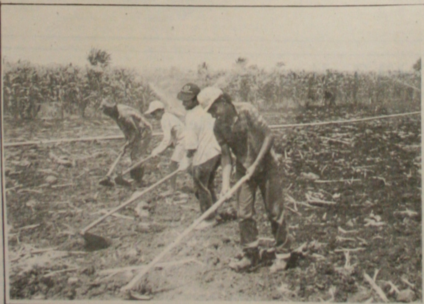
Os agricultores estão satisfeitos com o atual quadro que tem garantido oferta de trabalho no interior

A GAZETA DE SERGIPE publicará às sextas-feiras uma série de encartes com o curso "Moda, Cultura e Comunicação", promovido pelo programa Universidade Aberta. Serão 16 fascículos encartados na GAZETA, impressos em papel especial, em cores, sobre a evolução da moda em seus contextos históricos, sociais, políticos, econômicos e culturais, num total de 70 aulas ilustradas. O curso é uma promoção da Fundação Demócrito Rocha, do Ceará, em parceria com o jornal GAZETA DE SERGIPE. Os leitores poderão se inscrever na Universidade Aberta para oficializar a sua participação no curso, através dos cupons publicados a partir de hoje nas edições da GAZETA, e nos próprios fascículos do curso.