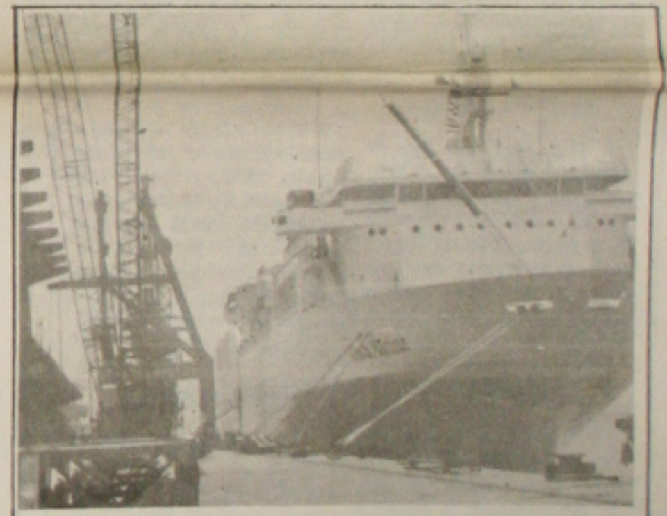
Os portuários avulsos estão sendo impedidos de trabalhar no porto de Sergipe

ferência para pagamento do piso a 12 milhões de segurados, de um conjunto de 15,3 milhões. Isto porque a elevação do mínimo de R$ 64,5 para R$ 70 já resultou, de setembro a dezembro (incluído o 13º salário), em um impacto de R$ 260 milhões sobre a folha. Se o mínimo aumentasse para US$ 100, o impacto, conforme ainda o ministro, subiria para R$ 2 bilhões. (Página 4B)