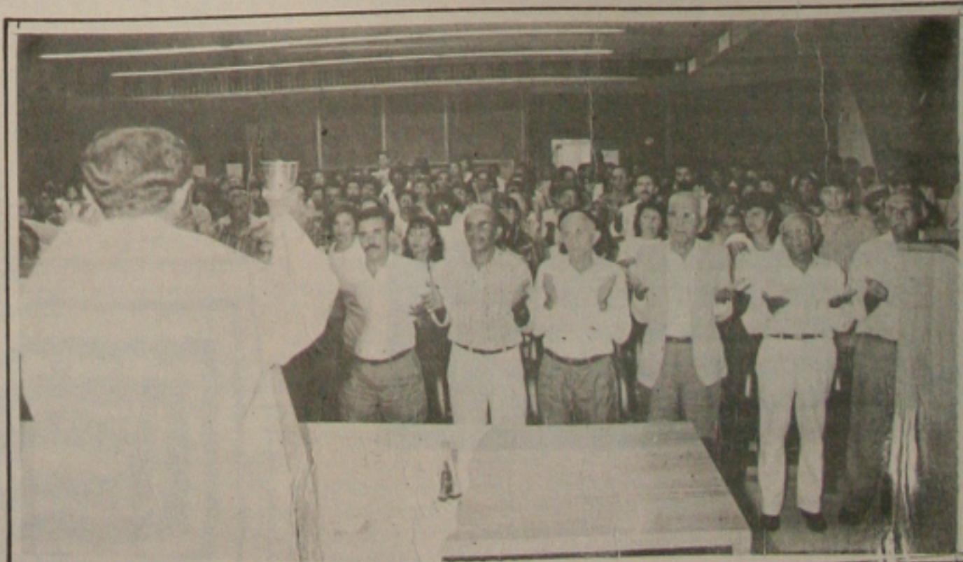
A missa em ação de graças para comemorar aniversário do presidente da Fies.