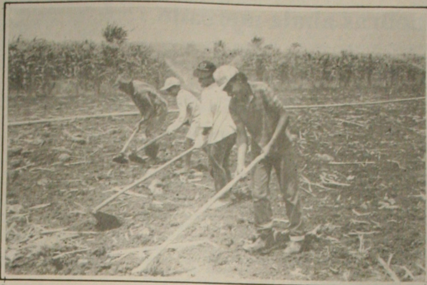
Os agricultores do alto sertão de Sergipe estão satisfeitos com a safra de grão deste ano.

Depois de aprovado pela Câmara, o projeto de lei foi sancionado pelo prefeito municipal entrando em vigor na data de sua publicação. Cópias da lei serão distribuídas com os órgãos da administração direta, indireta, autarquias e empresas privadas com subsídios do município.