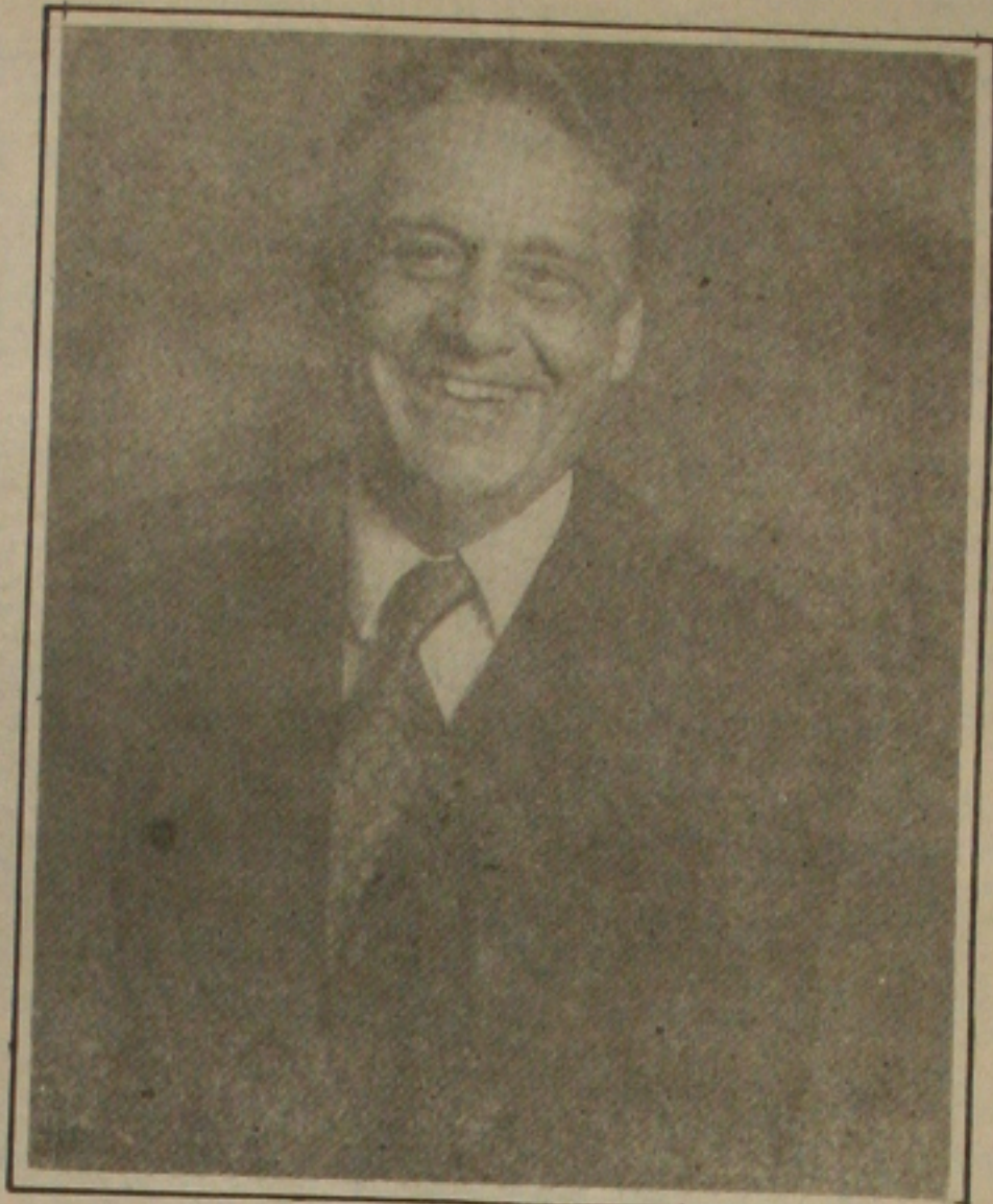
Cardoso: reformas definidas

Na ordem econômica disse ele, o objetivo é flexibilizar alguns monopólios, como os do sub-solo e das telecomunicações. O do petróleo, "até o momento não foi cogitado", disse o deputado. Nas alterações do sistema financeiro nacional, é possível que a limitação constitucional de juros anuais de 12% será eliminada. Jobim acha que durante todo o mandato de Fernando Henrique Cardoso serão feitas emendas à Constituição para possibilitar a abertura e o crescimento do País.