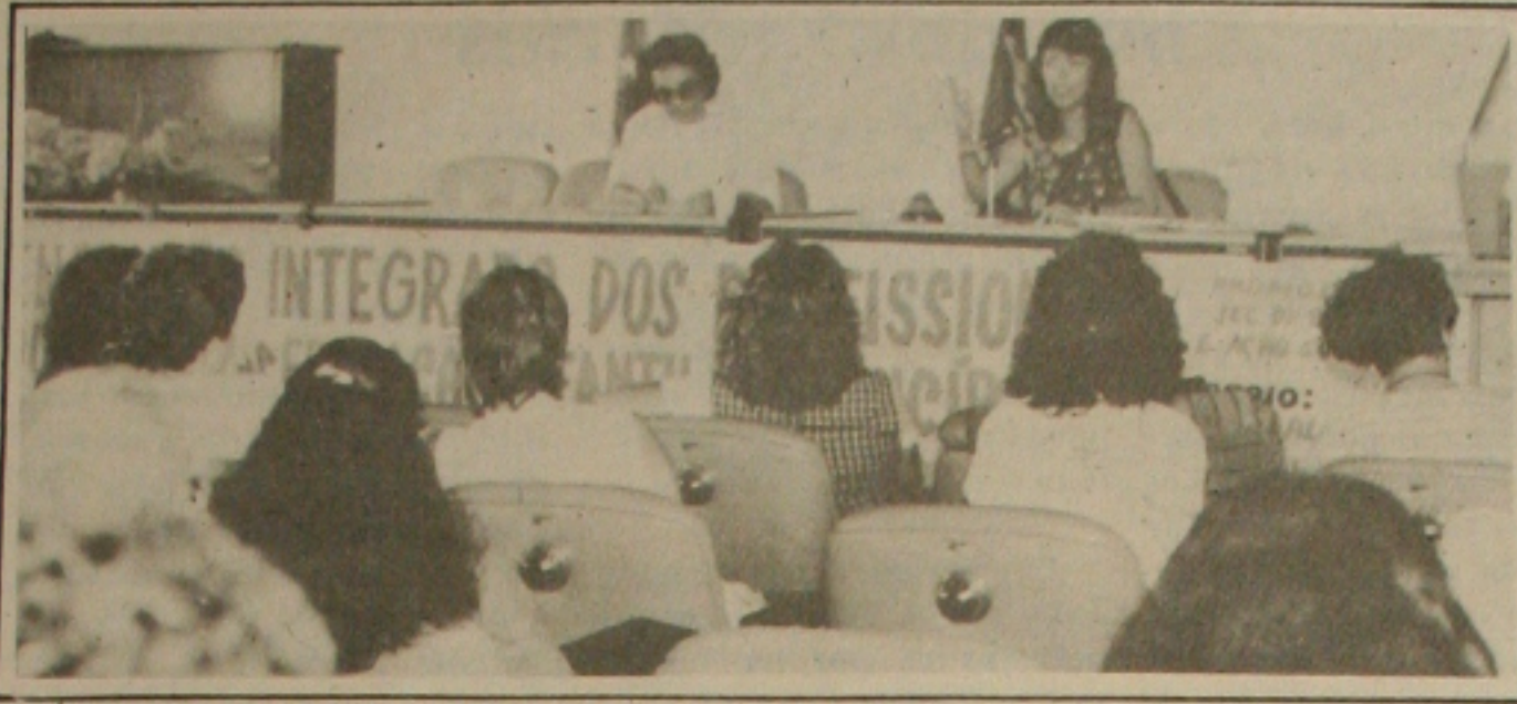
O encontro sobre educação infantil será encerrado hoje na LBA

Promover uma reflexão sobre a qualidade da educação infantil e o papel do pedagogo na escola. Estes são dois dos principais objetivos do Encontro Integrado dos Profissionais que Atuam na Educação Infantil no Município de Aracaju, aberto ontem no auditório da Legião Brasileira de Assistência (LBA), numa promoção das Secretarias Municipais de Educação e Ação Social. O evento será encerrado hoje. (Página 4A)