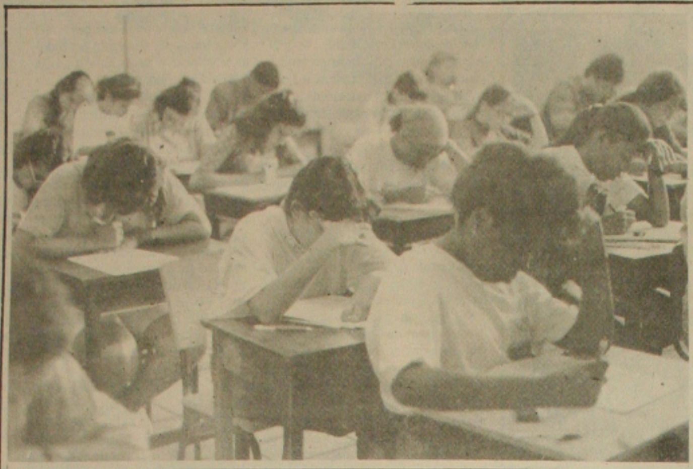
As provas do vestibular unificado 95 da Universidade Federal começarão no domingo.