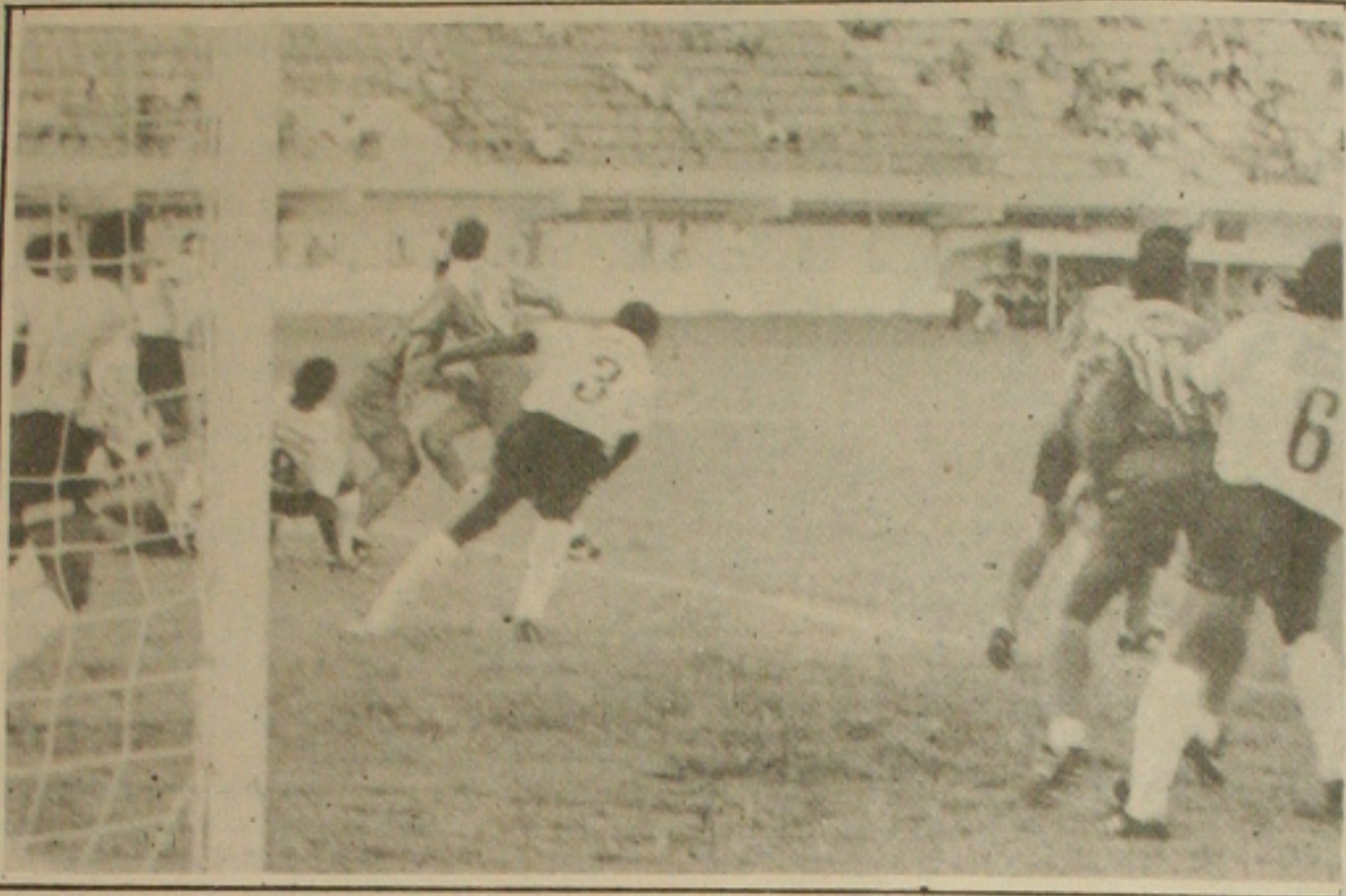
O "Fantasmilha" reforça sua defensiva para enfrentar o ataque rubro

No expediente da noite o grupo rumou com destino à cidade de Laranjeiras, onde ficarão concentrados até o momento de rumarem para o Batistão. Apesar da derrota do último domingo diante do Confiança, os alvinegros estão motivados para o jogo desta noite, mesmo sabendo das qualidades do adversário que pretende vingar a derrota do primeiro turno.