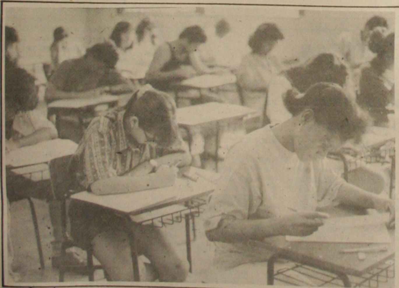
No próximo domingo, milhares de candidatos estarão se submetendo à primeira prova do Vestibular da UFS

ao Plano Real, as vendas caíram significativamente e praticamente não há compradores. Quem antes do pacote anti-consumo chegava a vender três carros por dia, atualmente tem comercializado apenas um por semana. (Página 4A)