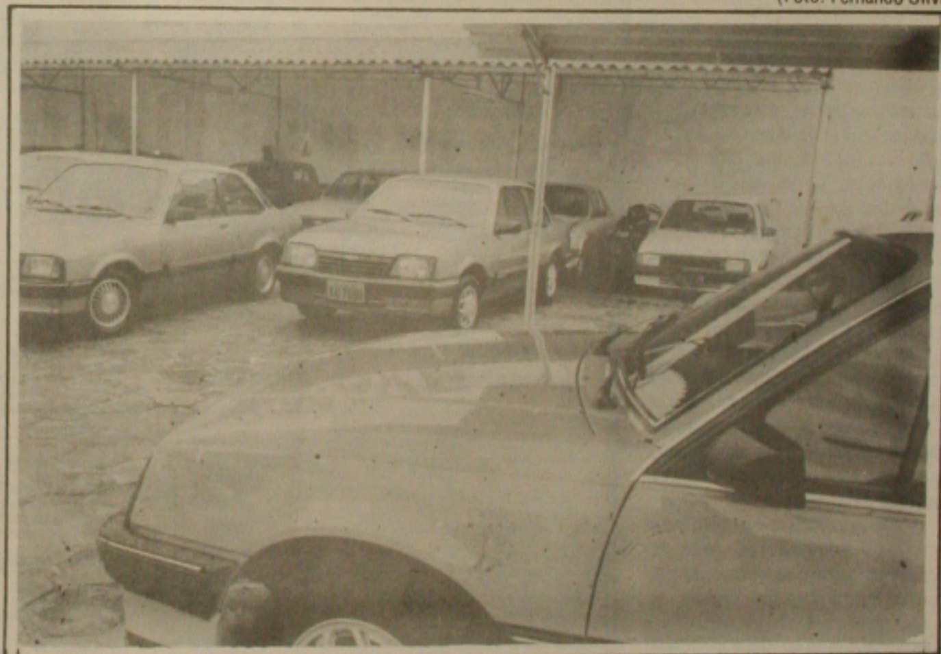
Quem apostou na especulação de carros usados está no prejuízo com o Plano Real