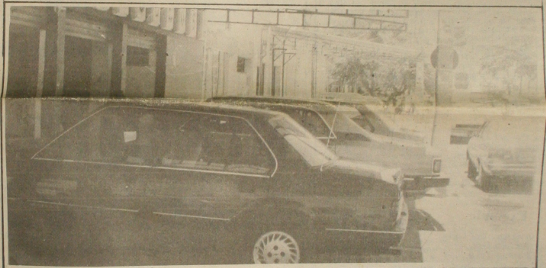
Após a adoção das medidas anti-consumo, o encalhe de carros usados nas revendedoras aumentou

educação, além da parceria com a iniciativa privada e dos financiamentos de entidades internacionais. O que o futuro governo pretende é reunir sob um comando único as verbas atualmente nos Ministérios da Saúde, Trabalho, Educação e Agricultura. (Página 4B)