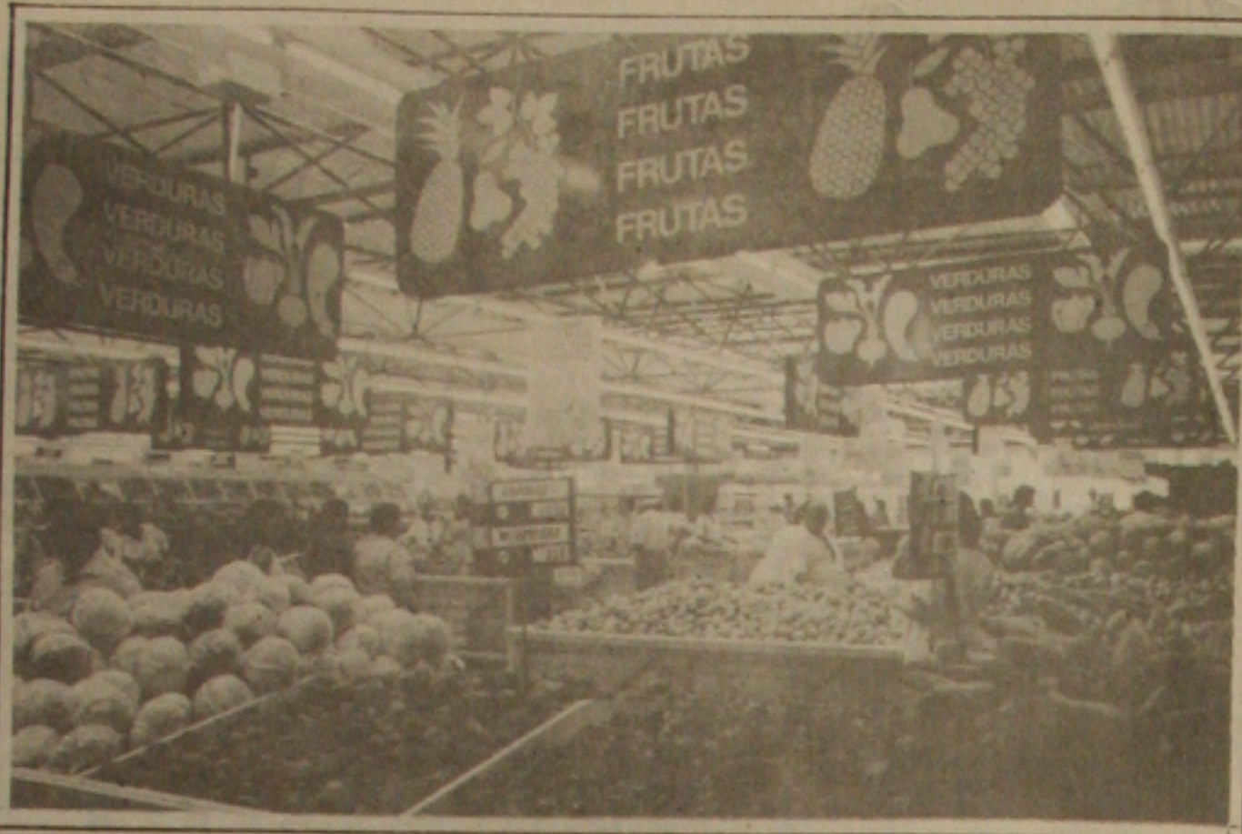
Os preços dos alimentos já começam a cair e não afetam mais o Plano Real.