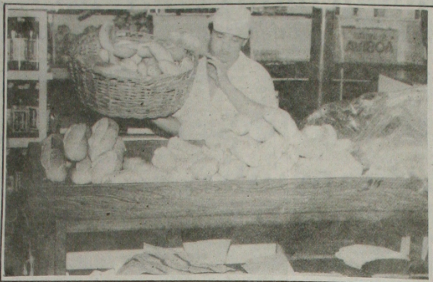
A indústria do pão está reagindo depois de enfrentar uma grave crise que fechou panificações

Ouro - como o próprio nome diz, esta maravilhosa cesta traz o vinho tinto francês Chateau Leoville-Las-Cases 85 Saint Julien, o vinho italiano Tenute Marquese Antinori Chianti Clássico 89 Antinori, grappa Tignarello Marchese Antinori, vinho do porto Taylor's, massas Barilla, geléia francesa Chamboard, chá americano Lipton, patê centolla Robinson Crusoe, pistache natural americano Planters, e outras delícias (R$ 500,00).