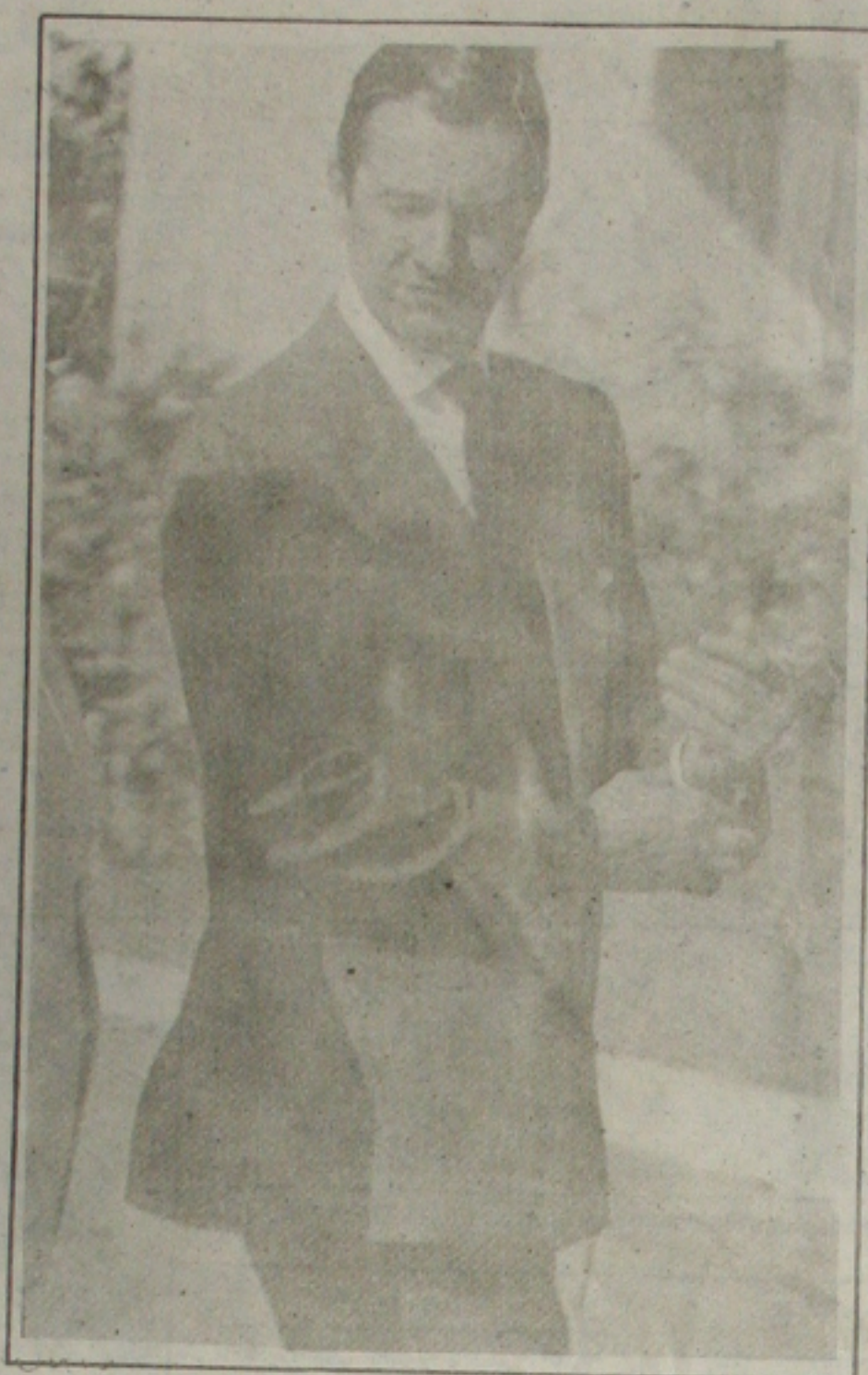
Collor: não vai comparecer

Para o presidente eleito só o diálogo e a ação sustentada dos governos federal e estaduais conseguirão ultrapassar as dificuldades que resistirão aos esforços do Pacto pela Infância.