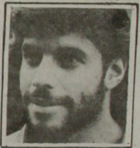
Frota chega a Aracaju