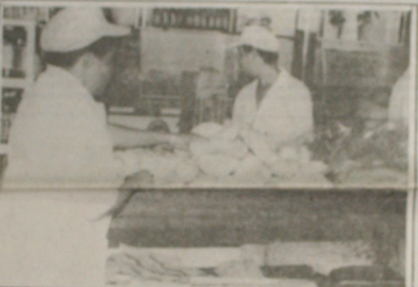
Com a estabilização dos preços das matérias-primas, o pão voltou a ser muito consumido.