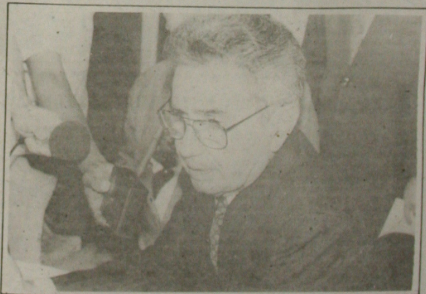
General Nilton Rodrigues defende incentivos para o Nordeste.

Por fim, disse esperar que o Seminário represente três dias de reflexão acerca de como tratar com êxito os problemas regionais, no quadro das tendências, dos referenciais e das opções da sociedade brasileira com sua inserção no ambiente mundial.