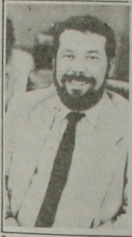
Emanuel - mais discussão