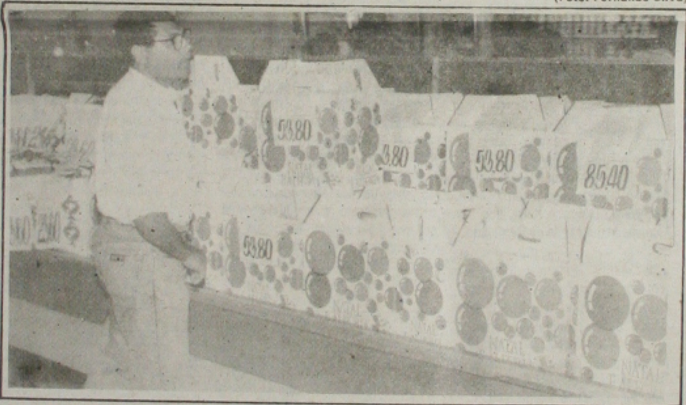
As tradicionais cestas de Natal variam de preço de acordo com o supermercado.