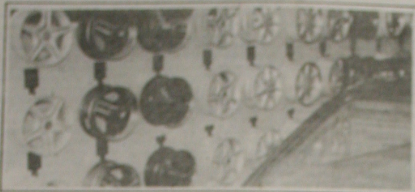
Os preços dos acessórios, como os pneus, muitas elevados também contribuem para a retração.

Quando se trata de acessórios de automóveis, a procura é pequena. Isso ocorre porque os acessórios são vendidos em lojas especializadas e não em lojas de departamentos. Além disso, a maioria dos acessórios são vendidos em lojas de bairro e não em lojas de rua.