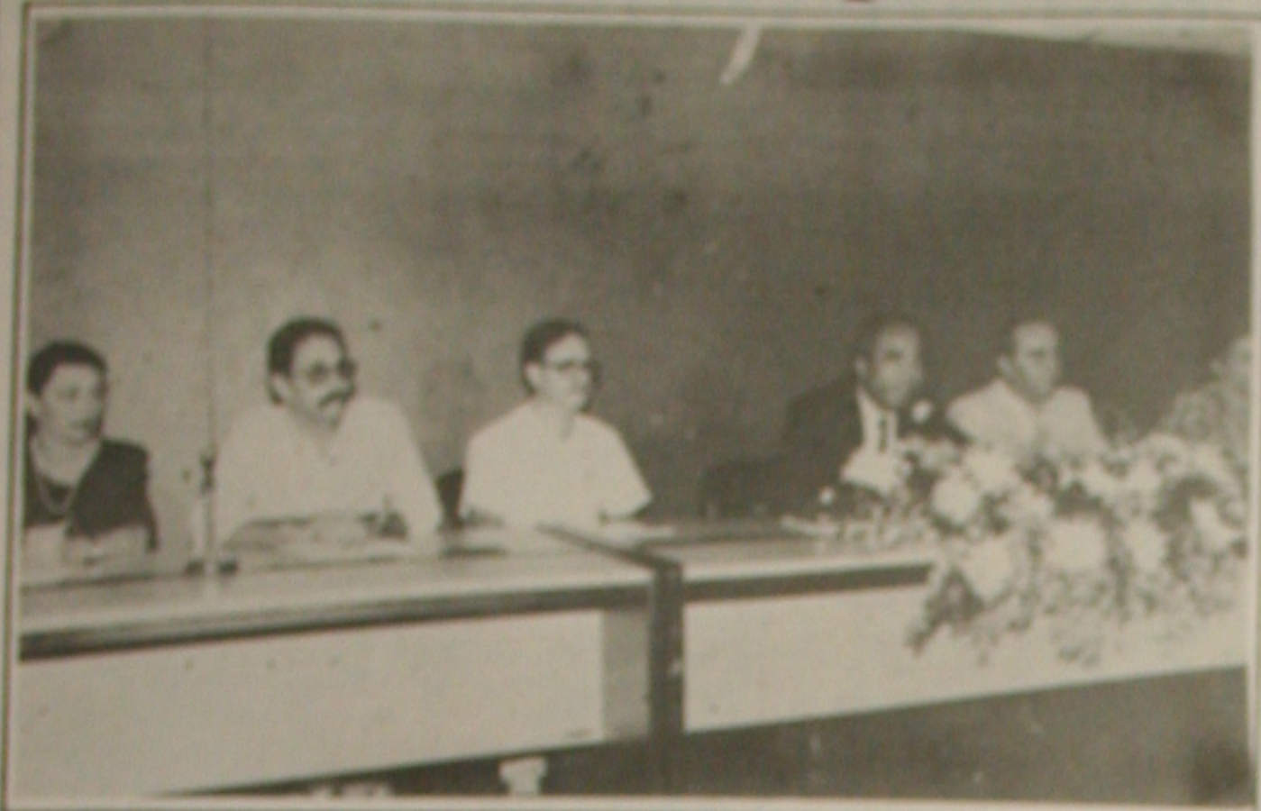
Governador preside a reunião para analisar pesquisa da Unicef