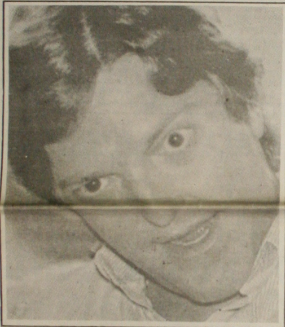
Pedro Collor será enterrado amanhã em Maceió