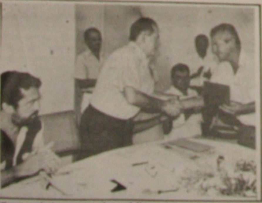
Albano recebe homenagem dos prefeitos

O governador eleito Albano Franco participou no último final de semana da reunião anual da Associação dos Prefeitos do Vale do São Francisco, onde, ao lado do Governador João Alves, recebeu uma homenagem, realizada em Centro de São João. Albano fez questão de lembrar que já participou de várias outras reuniões de prefeitos, mas que aquela tinha um sentido específico: ele estava ali exclusivamente para agradecer às lideranças políticas da região. Segundo o governador eleito, ele dá sua vitória a essas e outras lideranças que arrastaram as mangas e garantiram sua vitória em 15 de novembro. "De uma coisa estou certo: jamais deixarei de ser grato à elite que recebi desses amigos, vereadores e prefeitos que entenderam ser o meu nome o melhor para Sergipe".