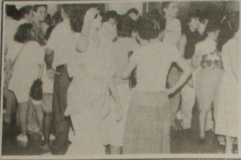
Desde ontem as filas são grandes nos bancos por causa do recadastramento

Quem deixou para fazer o recadastramento bancário na última hora está tendo que passar por muitos transtornos. O prazo para que os clientes atualizem seus dados cadastrais nos bancos termina no próximo dia 29, mas até ontem mais de 20% das pessoas que têm contas correntes ou algum tipo de aplicação financeira ainda não haviam procurado as agências, onde desde ontem têm sido grandes as filas, principalmente na Caixa Econômica Federal e no Banco do Brasil. (Página 5A)