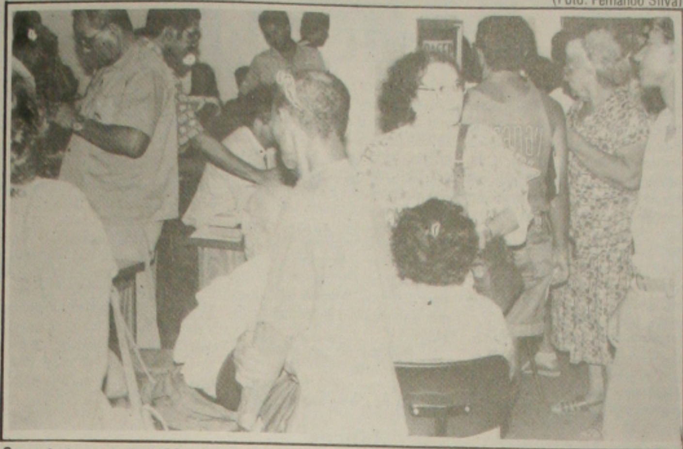
O recadastramento bancário tem provocado enormes filas nos bancos desde a semana passada.