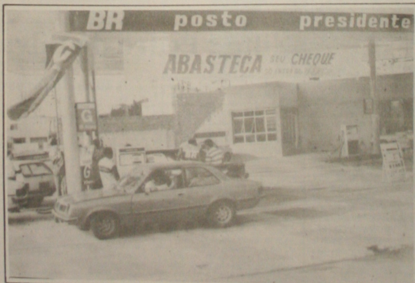
As promoções com cheques pré-datados também têm ajudado a aquecer as vendas nos postos