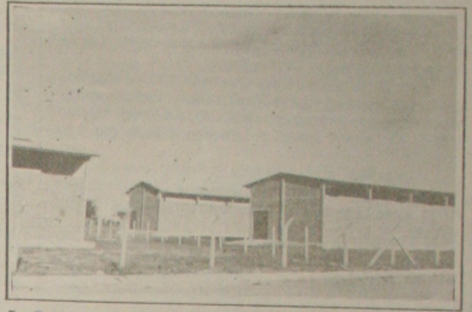
Em Tobias Barreto, os cinco primeiros galpões do distrito já foram inaugurados