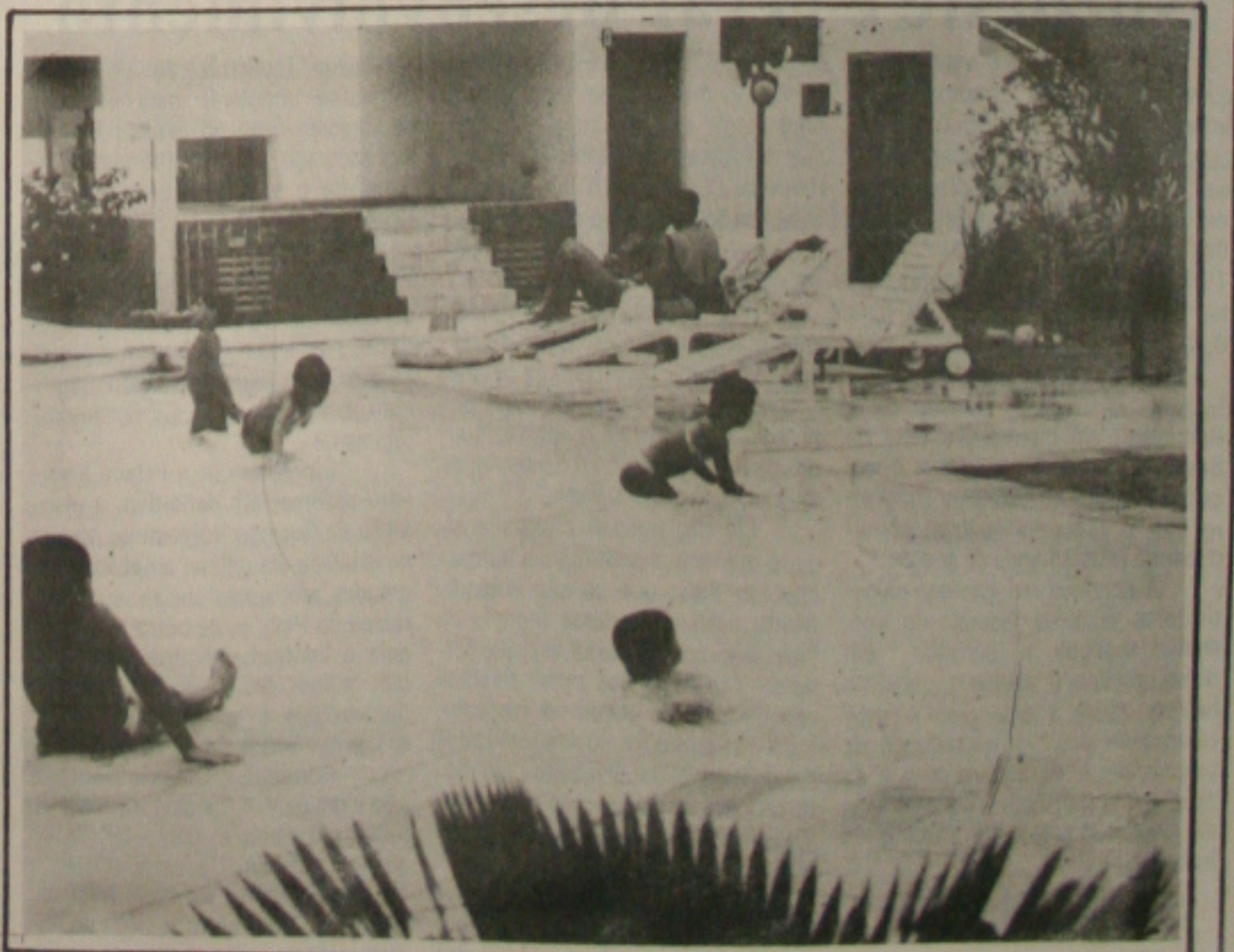
Os hotéis da orla marítima ainda está com pouca ocupação no início do verão no Estado.

Os pacotes do hotel foram divulgados em vários estados, mas a preferência maior está concentrada entre baianos e paulistas que já começaram a fazer reservas até para as férias do meio do ano. Os preços destes pacotes variaram em função dos apartamentos da preferência do cliente. Os mais simples foram vendidos por R$ 648,00 num pacote que inclui 3 dias de hospedagem e participação da festa de fim de ano. Em apartamentos especiais o pacote custa R$ 852,00 enquanto que na suíte o pacote é comercializado a R$ 1.128,00, tudo em hotel cinco estrelas instalado na orla marítima.