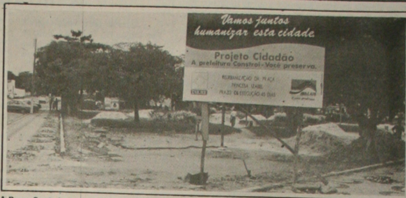
A Praça Santa Isabel, no Bairro Santo Antônio, é uma das beneficiadas pela ação da PMA.

A Prefeitura de Aracaju está executando uma série de obras com o objetivo de humanizar mais a cidade, tornando-a mais agradável não só para os aracajuanos como também para os turistas que começam a visitá-la em maior número a partir deste final de ano. Dentre essas obras incluem-se a reforma e a reurbanização de sete praças da capital que se encontravam em situação precária em função da falta de manutenção e da destruição provocada por atos de vandalismo. (Página 4A)