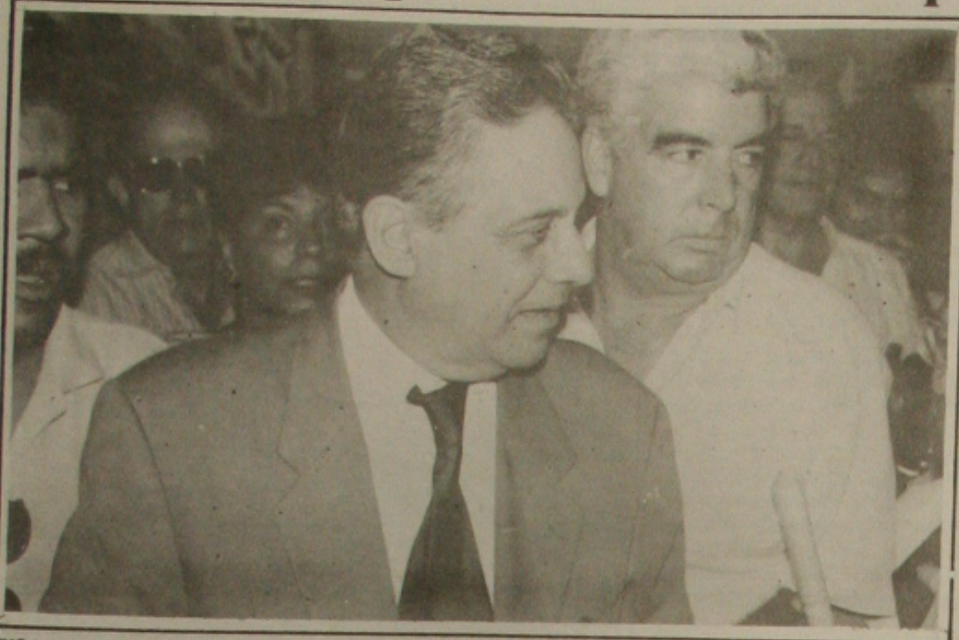
FHC tem como desafio fazer a reforma tributária, para criar empregos.

De acordo com pesquisa realizada pela Cooper & Lybrand, uma das principais empresas de auditoria e consultoria do mundo, o principal desafio do novo presidente será promover a reforma tributária. Essa foi a resposta de 67% da amostra, que engloba um universo de 140 empresas de pequeno, médio e grande porte dos setores metalúrgicos, químico e alimentício, comércio e serviços, papel e celulose, eletroeletrônico e financeiro localizadas nos Estados de São Paulo, Rio de Janeiro e Sul do País. Mais da metade da amostra apontaram o controle sobre pressões por aumentos de preços, tarifas e salários e a manutenção da estabilidade política como os outros dois problemas mais relevantes para o governo (54% e 53%, respectivamente).