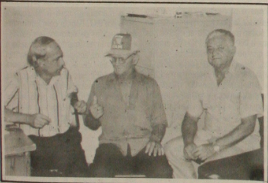
Os aposentados do Estado em sala vip.

Para que a LBV possa aumentar o seu atendimento, que não é realizado apenas nos finais de ano, mas diariamente, estão sendo realizadas campanhas de arrecadação de gêneros de primeira necessidade ou de donativos. Os interessados em colaborar com a instituição podem obter informações pelo telefone 224-6144, ou na Rua Dr. Silvério Fontes, 419, no Bairro Cirurgia.