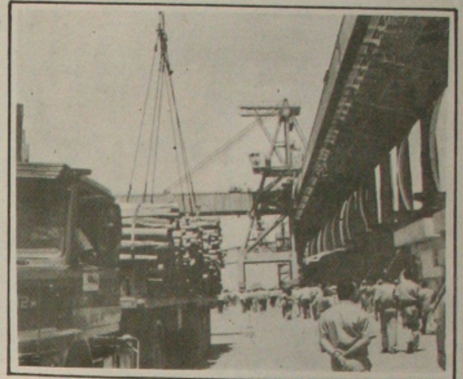
O porto é uma nova área da Aids em Sergipe.

Concluiu o médico dizendo que às pessoas têm de se conscientizar de que a aids é uma realidade, pode ser evitada com o uso da camisinha, mas se contraída leva à morte por não ter cura.