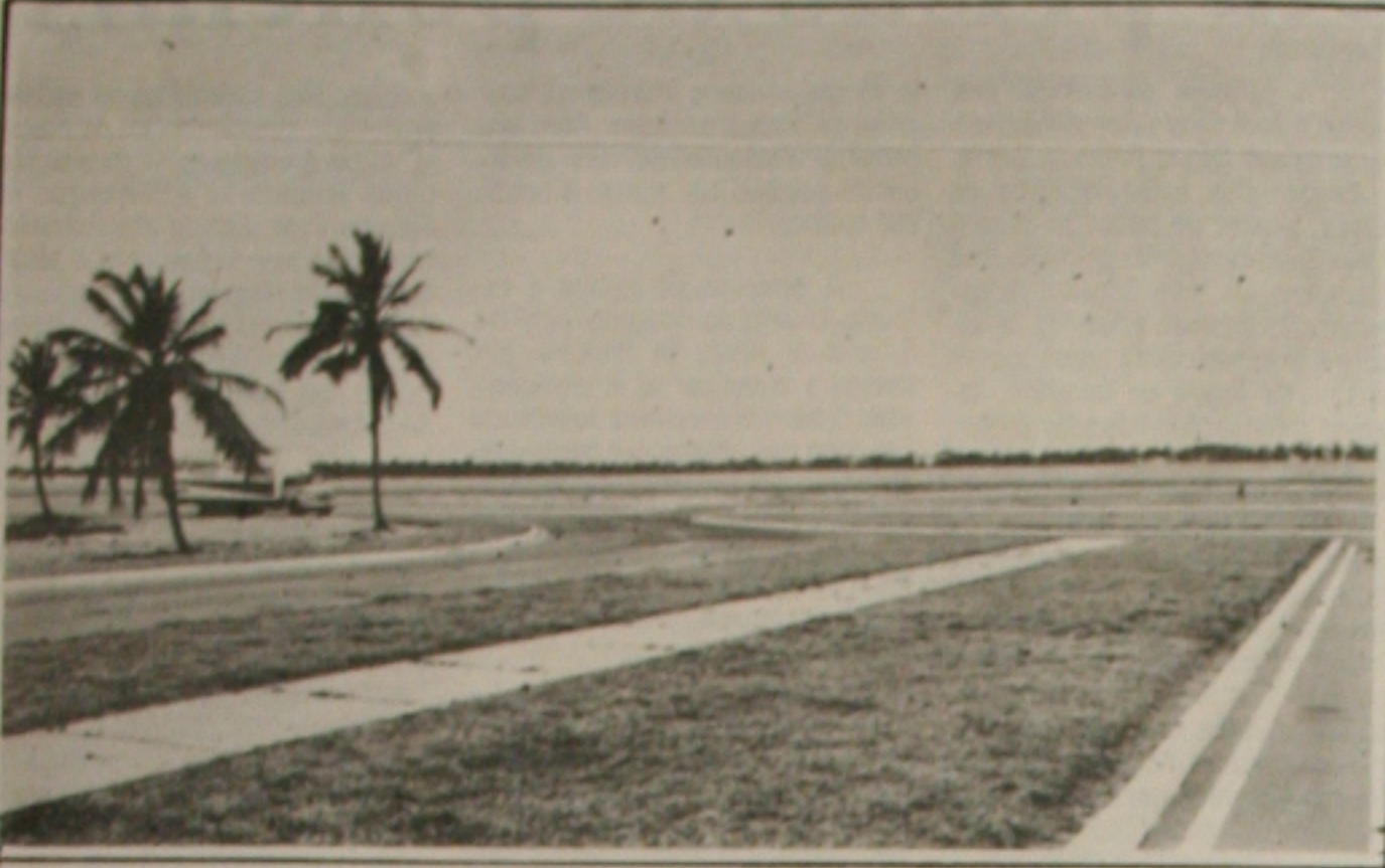
A área do Pólo Cloroquímico é dotada de toda infra-estrutura