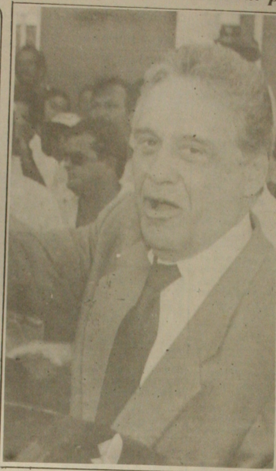
Fernando Henrique Cardoso.

BRASILIA. (AE) - O presidente eleito, Fernando Henrique Cardoso, anuncia hoje seu ministério e promete um novo estilo de governar: vai despachar pelo menos uma vez por semana com cada ministro, mantendo a equipe sob rígido controle e retomando uma tradição abandonada desde o governo Ernesto Geisel (1974/1979). Embora o anúncio esteja marcado para as 11h, parte do ministério estava indefinido no início da noite de ontem, devido a pressões de última hora ou dependendo de uma conversa final entre o presidente eleito e o atual, Itamar Franco.