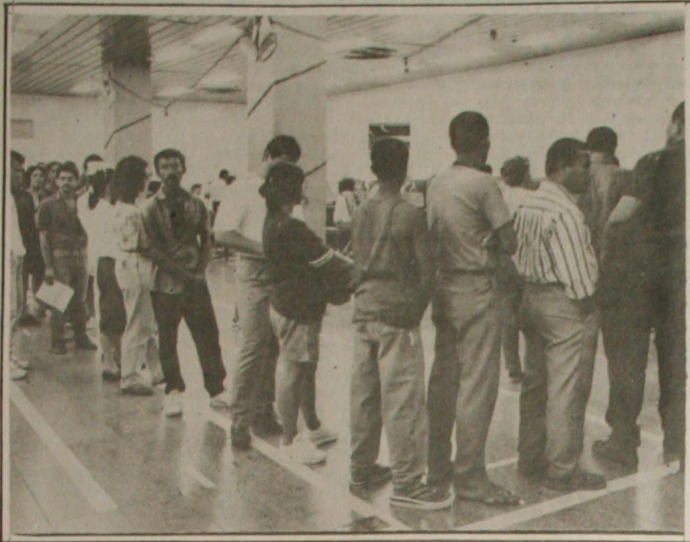
Na penúltima sexta-feira de 1994, as agências bancárias ficaram lotadas