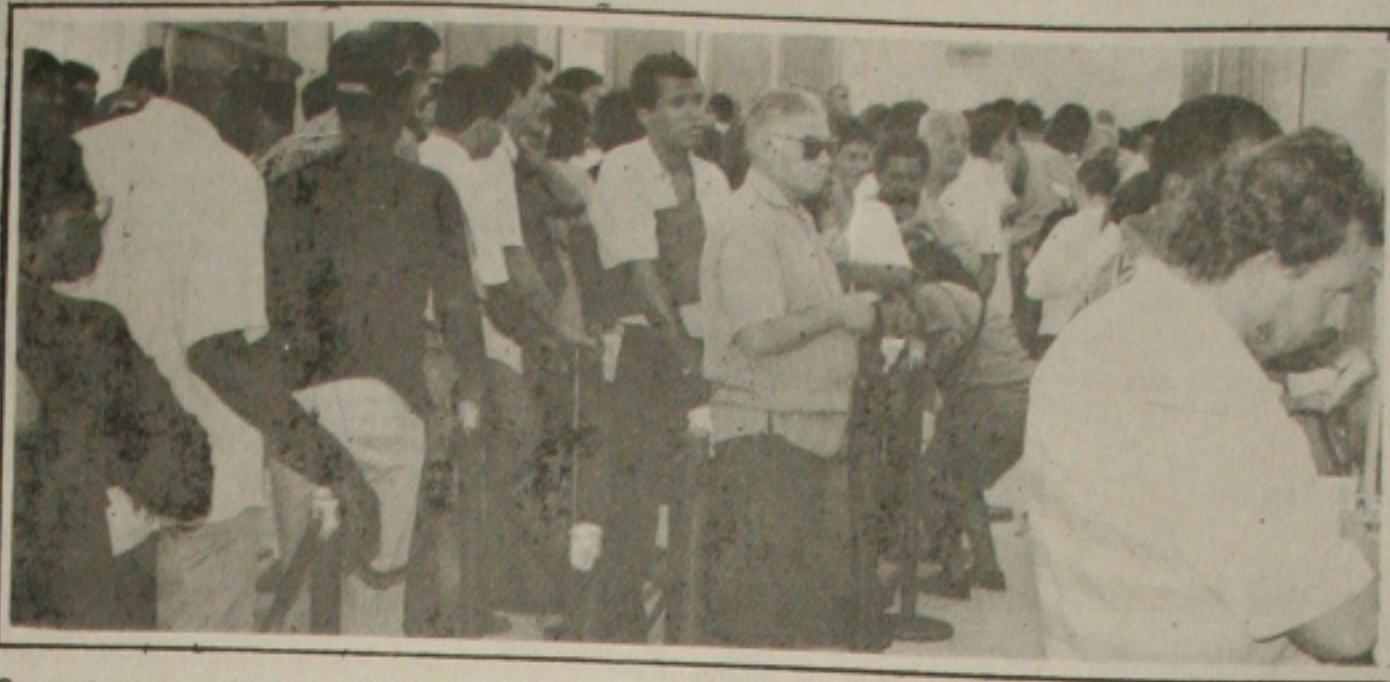
O cadastramento e o pagamento de salários levaram muita gente aos bancos ontem.