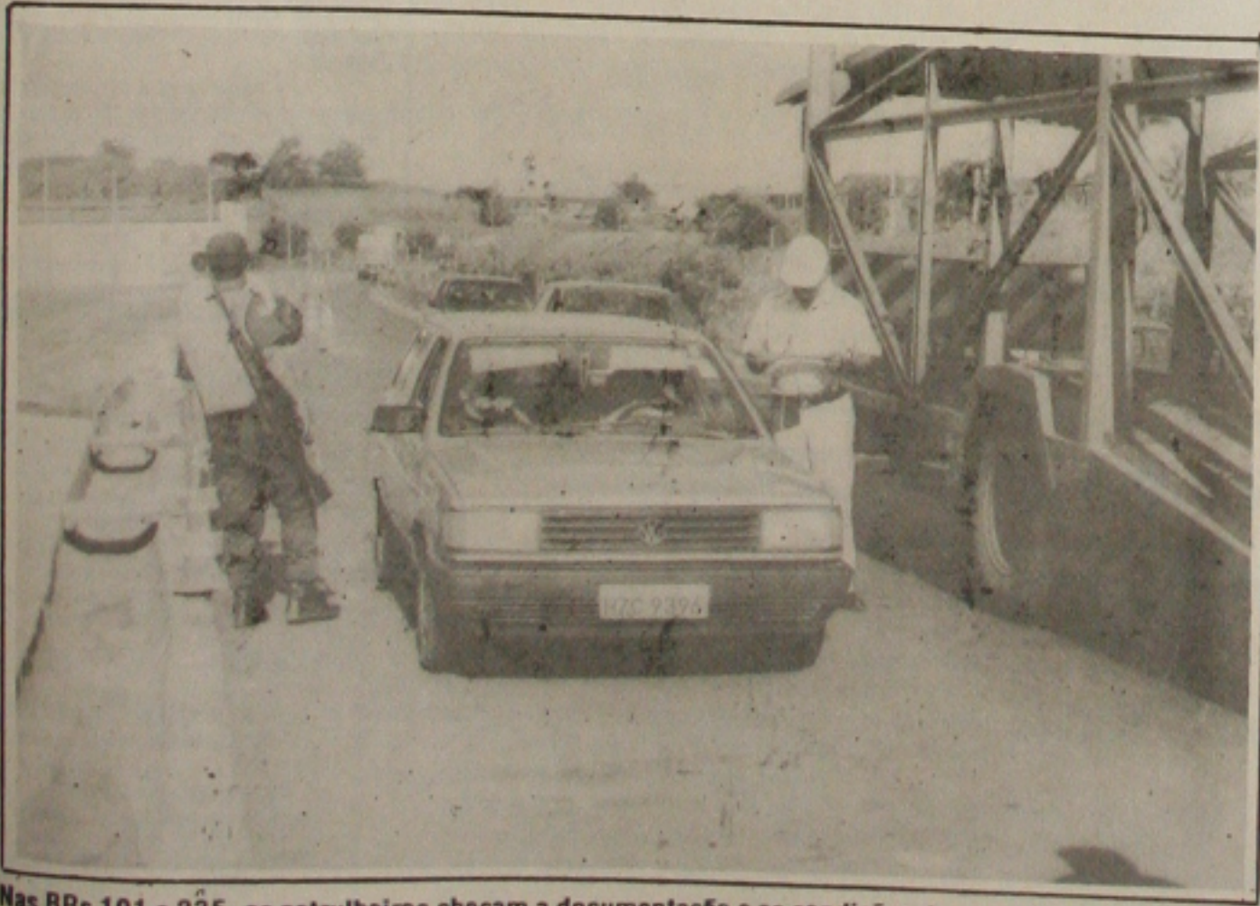
Nas BRs 101 e 235, os patrulheiros checam a documentação e as condições dos carros.