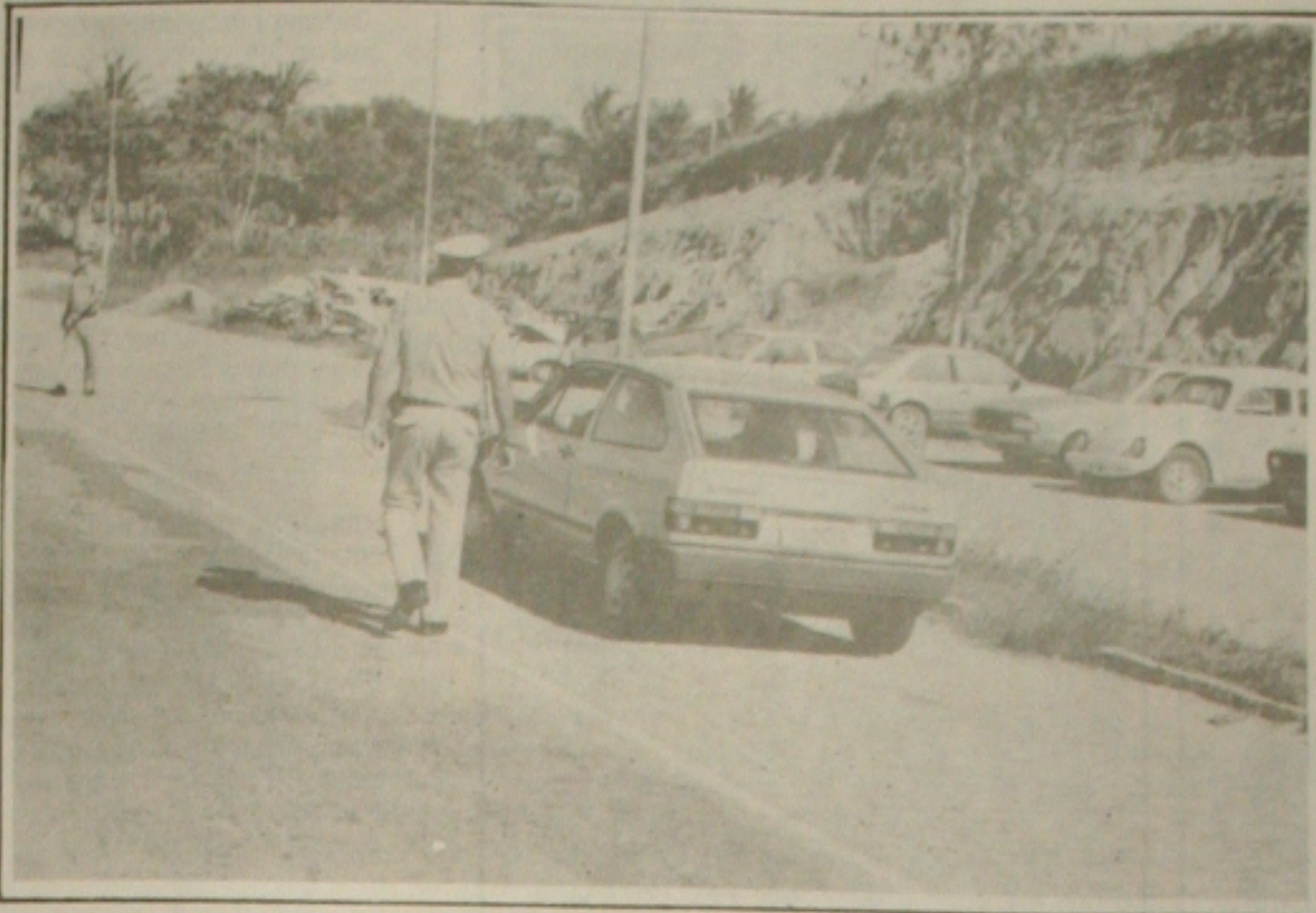
A Operação Férias de Verão está fiscalizando as duas rodovias federais em Sergipe.