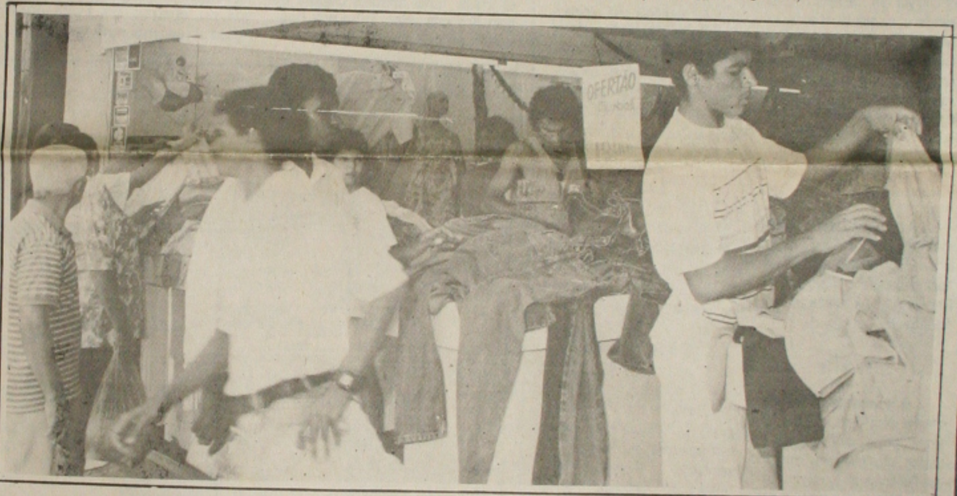
Os consumidores correram atrás das promoções nas lojas do centro comercial da cidade.