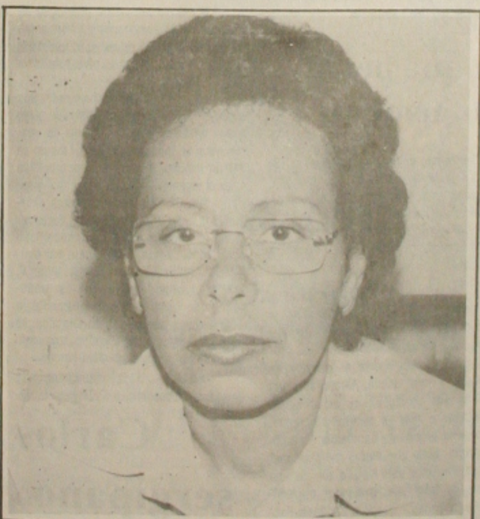
Lenalda diz que isso mostra o avanço dos ex-alunos.

A pesquisa, atesta a professora Lenalda, tomou-se a mais séria aplicação ao homem e tal fato, afirma ainda ela, nos obriga a mantermos, na qualidade de técnicos, atualizados.