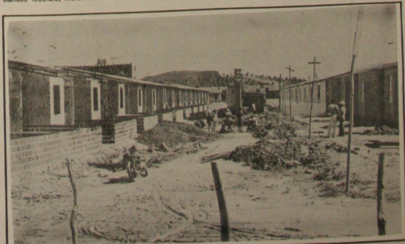
Casa popular continua sendo prioridade da Caixa.

Os dois representantes da categoria lembraram que o governador Alano Franco tem suas raízes no setor primário e certamente estará sensível ao problema.