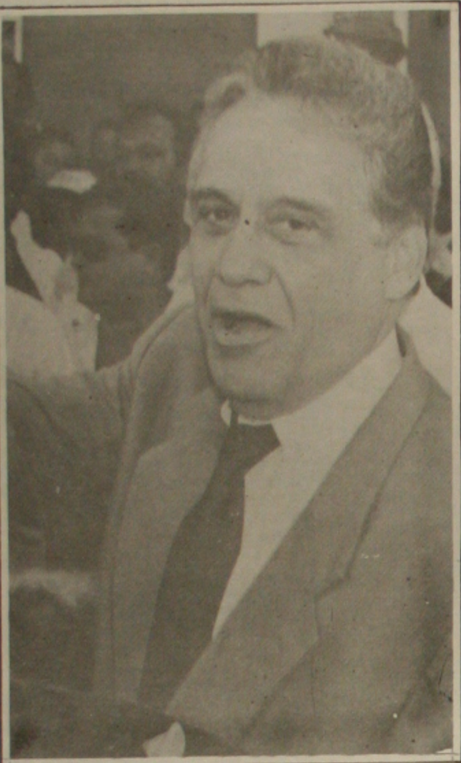
Fernando Henrique Cardoso, presidente da República