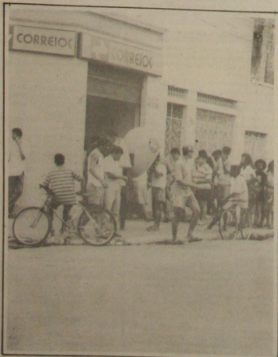
A venda de aerogramas e cartões no final de 94 superou as expectativas dos Correios.

depósitos e movimentando normalmente suas contas nas agências do Banese, como forma de evitar que o Banese passe a enfrentar problemas de caixa. Albano já decidiu inclusive que também vai procurar os prefeitos de cada município, para pedir que mantenham as contas de suas respectivas prefeituras na instituição financeira estadual. (Páginas 3A e 5A)