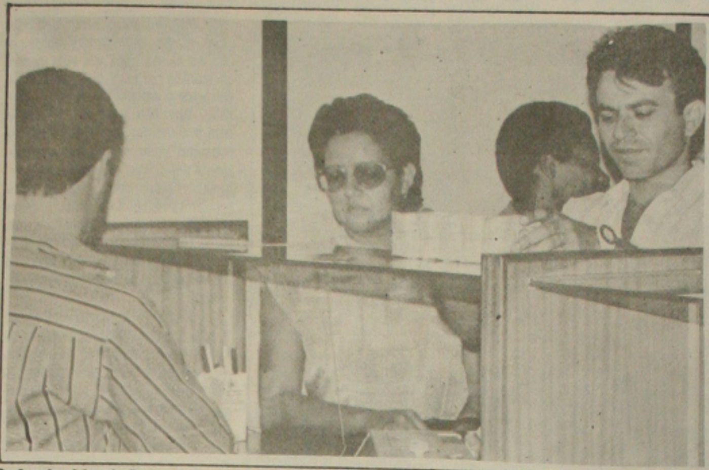
Os funcionários do Banco do Brasil estão apreensivos com a proposta de fechamento de agências

Um trailer com um freezer e o ponto, na Avenida Visconde Marcondes esquina com a Rua João Andrade, no fundo do Colégio 17 de Março. Tratar pelo telefone 222-4400.