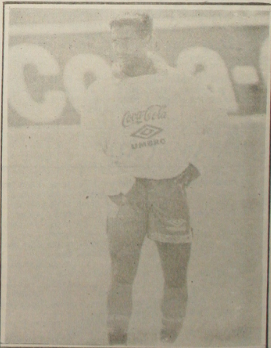
Quase definida a volta de Romário para o Brasil.