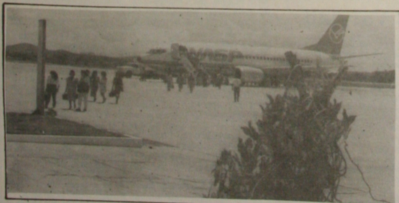
Em breve, os passageiros dos vôos passarão por uma fiscalização mais rigorosa no Aeroporto de Aracaju