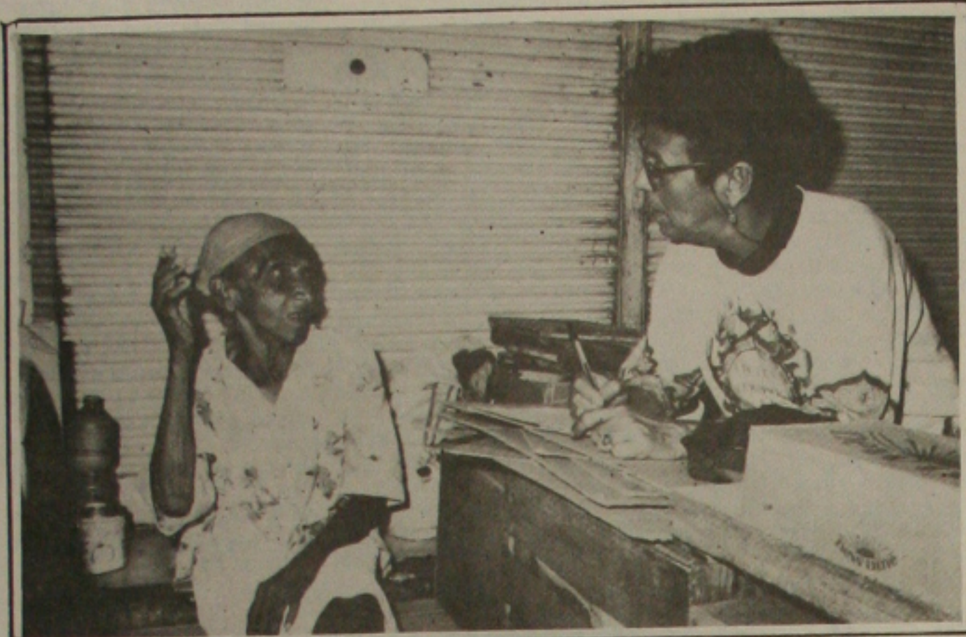
A Prefeitura de Aracaju está prestando assistência aos mendigos e desempregados.