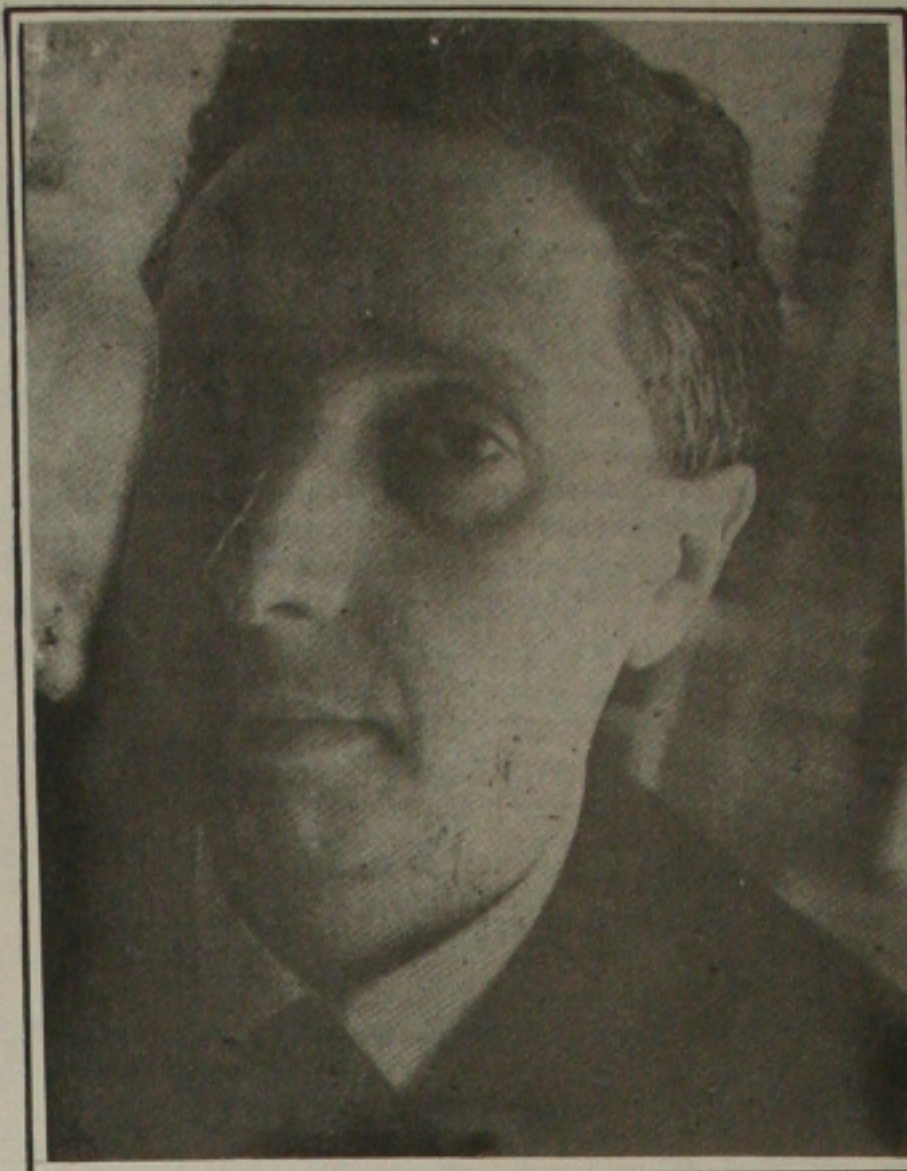
Pêrsio Arida fez críticas a José Sarney

No regime atual, "que o BC opera à moda antiga, e a capacidade de esterilização da política monetária é extremamente limitada, porque concede liquidez automática aos títulos e, assim, induz os intermediários financeiros a darem plena liquidez a seus passivos junto ao público".