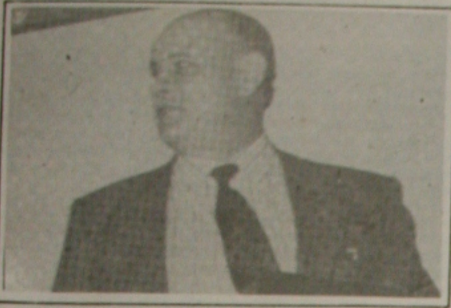
Stepanenko quer parceria com iniciativa privada