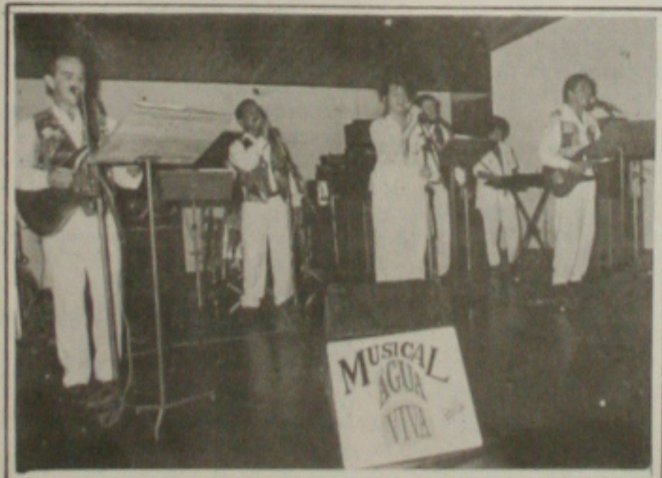
O Grupo Musical Água Viva será a atração musical de amanhã à noite no late Clube de Aracaju durante o 1º Festival de Noivas de Sergipe.