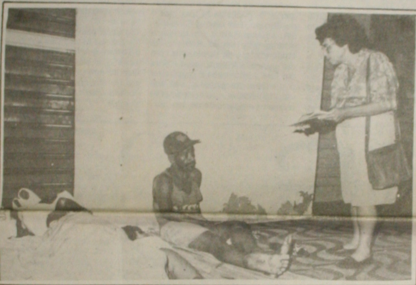
Assistente social da PMA entrevista uma das várias pessoas que atualmente dormem no centro comercial

Pelo menos 32 pessoas, a maioria vinda de outros Estados, vivem hoje em condições de extrema miséria no centro de Aracaju. Pela rua, a maior parte perambula pelas ruas da cidade, enquanto outras desenvolvem pequenas atividades como biscateiros e, à noite, dormem ao relento sob as marquises de bancos, lojas, terminais de ônibus, segundo constatou um levantamento feito esta semana por um grupo de assistentes sociais da Secretaria municipal de Ação Social com o objetivo de definir quem precisa de assistência social.