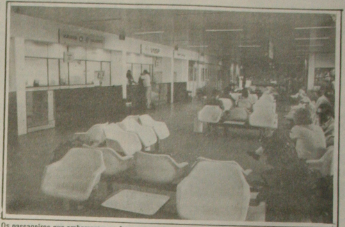
Os passageiros que embarcarem no Aeroporto de Aracaju serão fiscalizados pela Infraero.

De acordo com a portaria, está prevista a inspeção autoridades públicas e diplomatas. Para esta categoria, serão adotadas medidas especiais de segurança, contanto que o perfil de dispensa seja solicitado com antecedência.