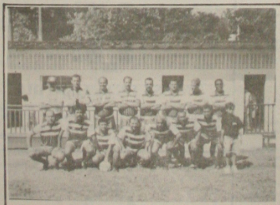
Veteranos do Bugio fazem aniversário