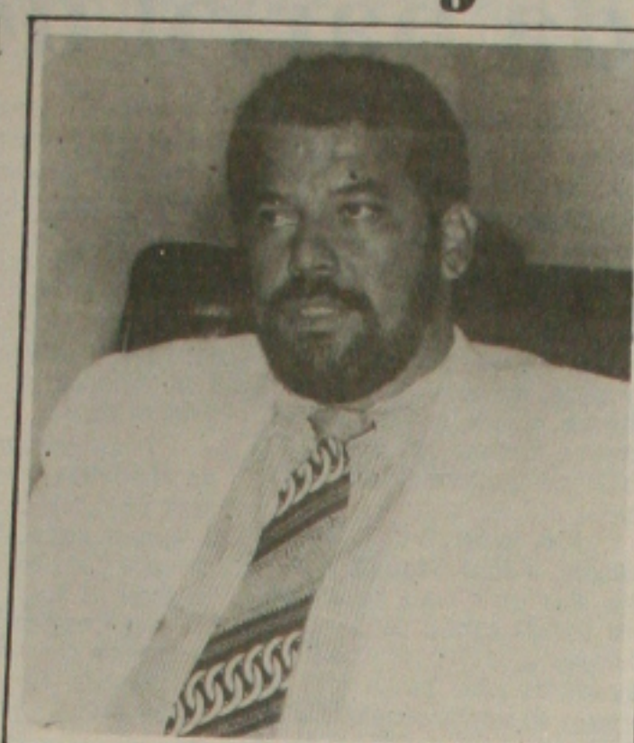
presidente Emanuel Nascimento