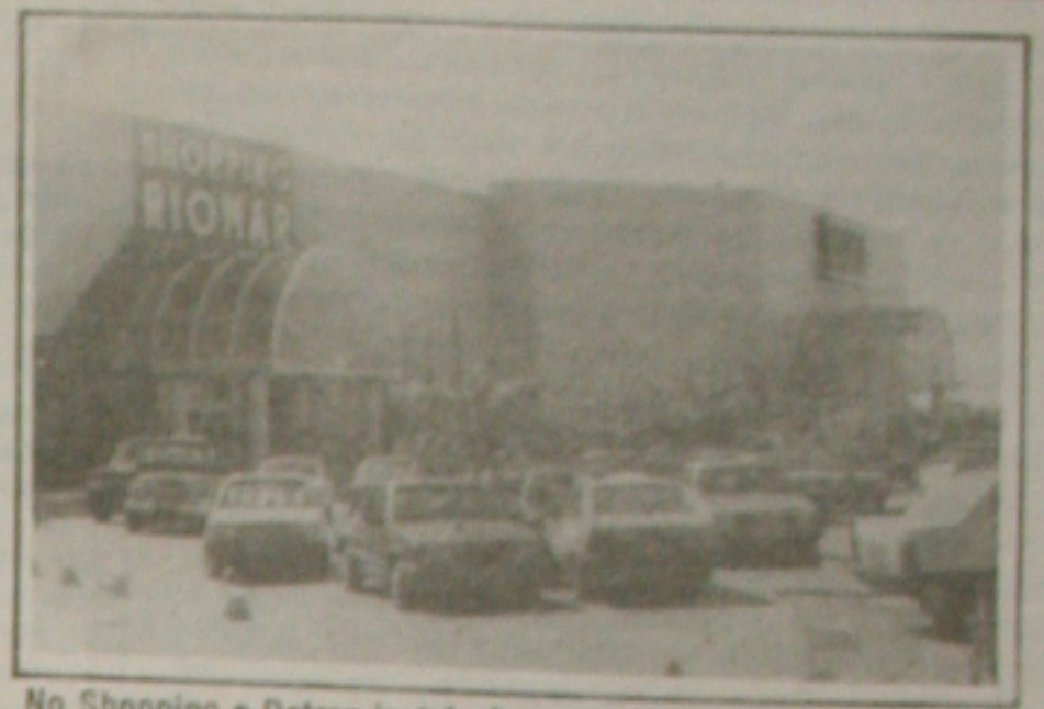
No Shopping o Detran instalará um stand para atender aos usuários do órgão

A partir da próxima semana, a população terá mais uma opção na hora de iniciar o processo de emplacamento de carros ou de expedição de carteiras de habilitação e para o pagamento de taxas cobradas pelo Detran. É que o órgão prestará esses serviços também num stand a ser instalado no shopping Riomar, na Coroa do Meio, fruto de convênio a ser assinado hoje entre a direção do Departamento Estadual de Trânsito e a administração do shopping. (Página 5A)