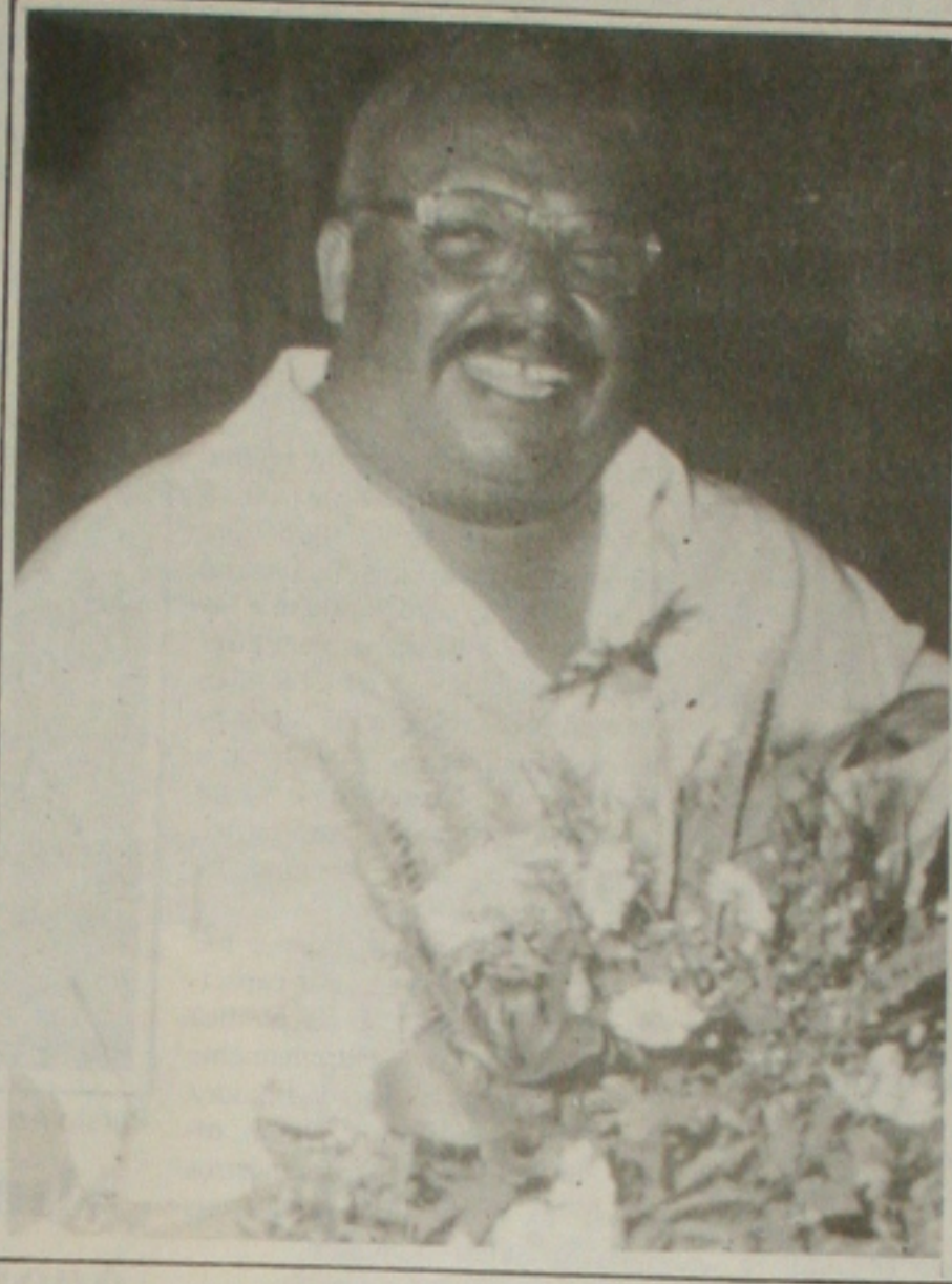
O colunista social João de Barros é o aniversariante ilustre de hoje.