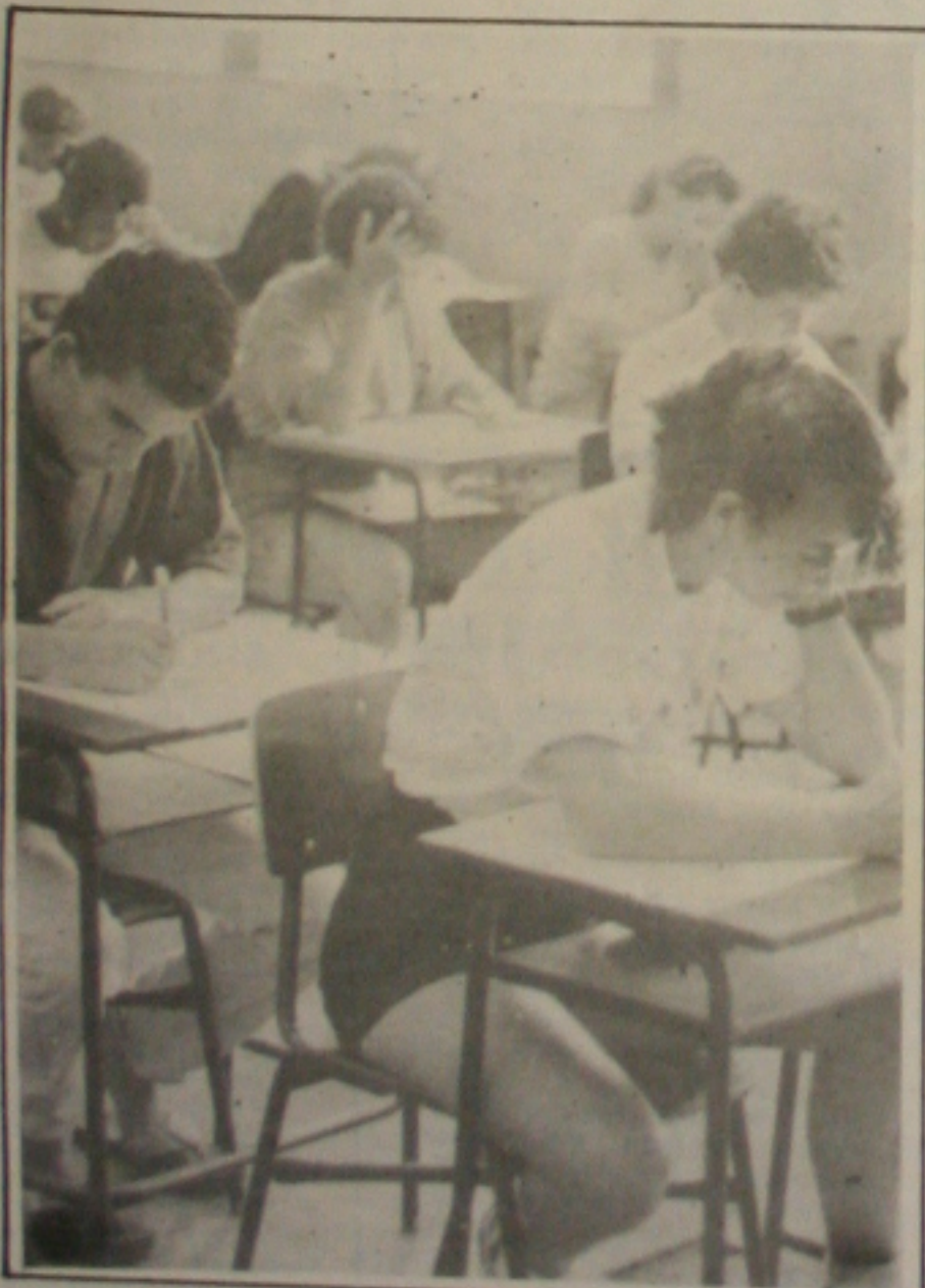
Amanhã, os vestibulandos farão as provas de Matemática e Geografia.

qualquer tentativa de reajuste de preços por parte da indústria. Isaias lembrou que com o Plano Real e, consequentemente a estabilização dos preços, houve um ganho no setor, pois os supermercados estão tendo como planejar, o que não ocorria antes quando os aumentos eram diários. (Página 6A)