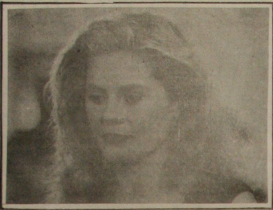
Vera Fischer deixa a novela "Pátria Minha"