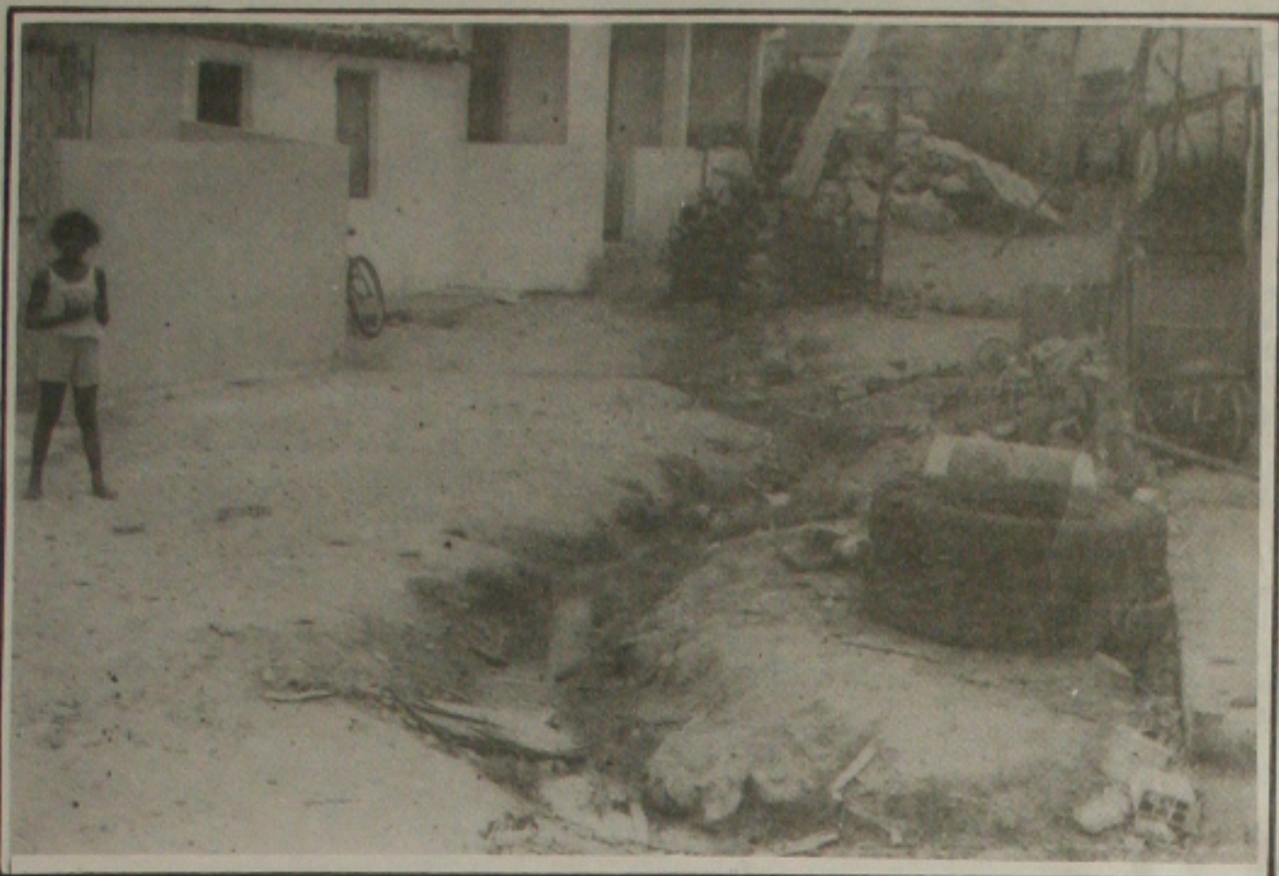
Os moradores da Ponta da Asa são obrigados a conviverem com o descaso da Prefeitura de Aracaju.