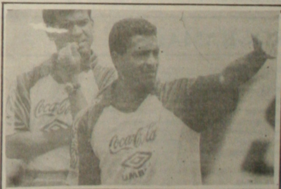
Romário desembarca hoje e visita a Gávea

"Há um valor para cada continente", disse Gaspart. "Mas o mais importante é que nenhuma negociação poderá ser concretizada sem prévia autorização do Barcelona." O vice-presidente do Barcelona afirmou que a transferência do atacante responde principalmente a questões humanas, dado o desejo de Romário de voltar para o Brasil.