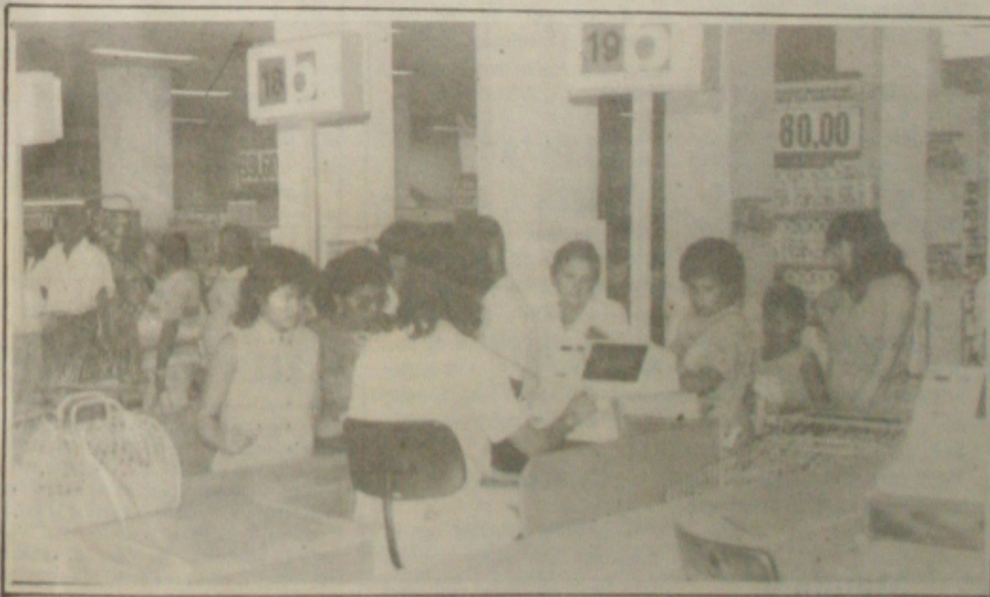
Nos supermercados, segundo o empresário, não há risco de desabastecimento.