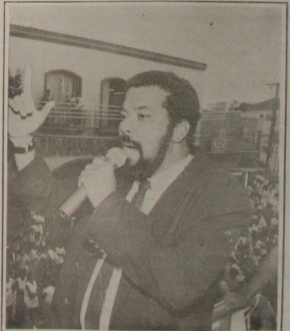
Nascimento não conseguiu colocar o projeto em pauta e denunciou a manobra de setores da oposição.