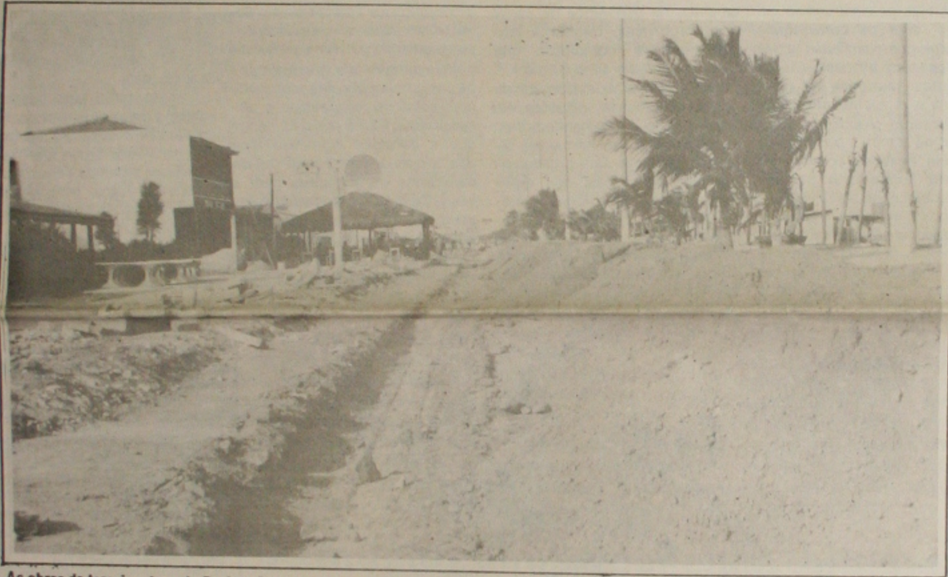
As obras da terceira etapa do Projeto Orla estão sendo aceleradas pelo governo do Estado.