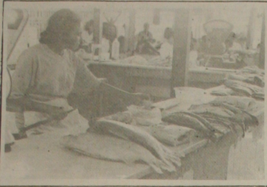
Com a poluição, a qualidade do peixe vendido ao consumidor fica ameaçada.