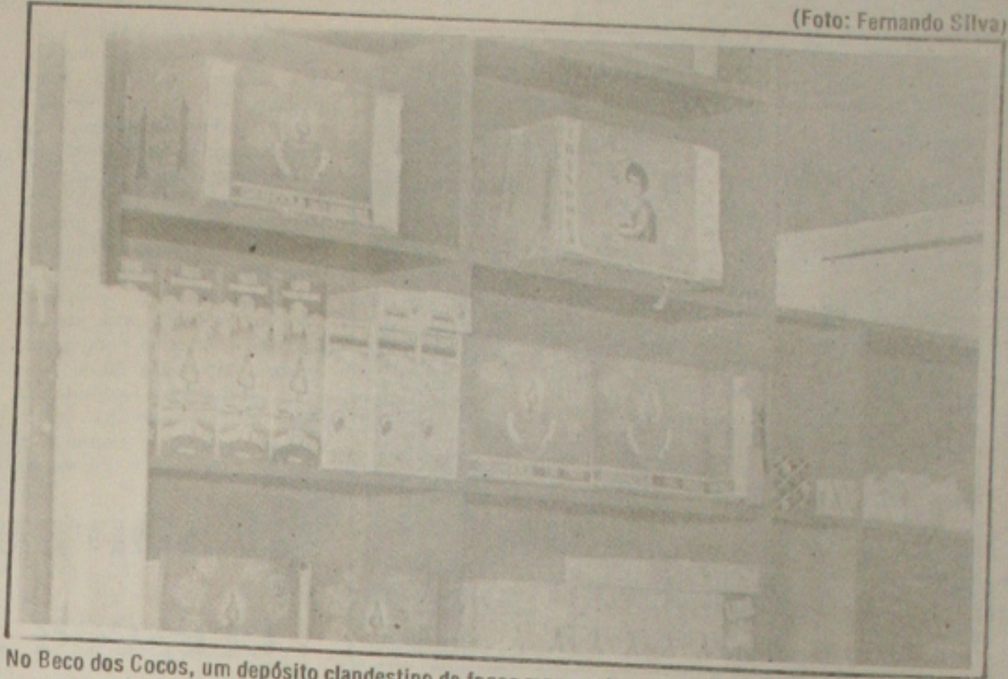
No Beco dos Cocos, um depósito clandestino de fogos representa grande perigo para o aracajuano.

A fabricação e a venda de fogos geram muito lucro. Dificilmente alguém que trabalhe nessa atividade toma prejuízos - desde que os fogos não explodam -, e muitos deles conseguiram se estabilizar. Conforme o comandante Valdir, esses fabricantes e comerciantes, conseguem obter super-lucros. "A soma dos fogos de um ano anterior, já é o lucro do ano seguinte. Para esse pessoal, não interessa se está ou não colocando em risco a vida de outras pessoas", alertou ele.