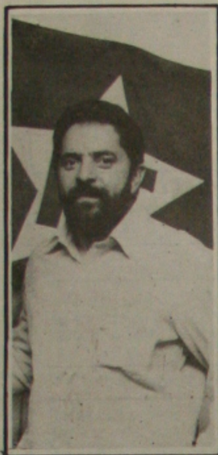
Lula desiste de ser presidente