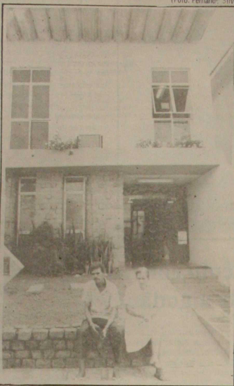
A Climedi cobra por fora dos conveniados com o SUS

Até o dia 31 do corrente, hoje os Diretores de Centro deverão entregar as Folhas de Graus e Frequência do segundo semestre letivo de 1994, estando previsto para o dia 20 de março o início do primeiro semestre letivo de 1995.