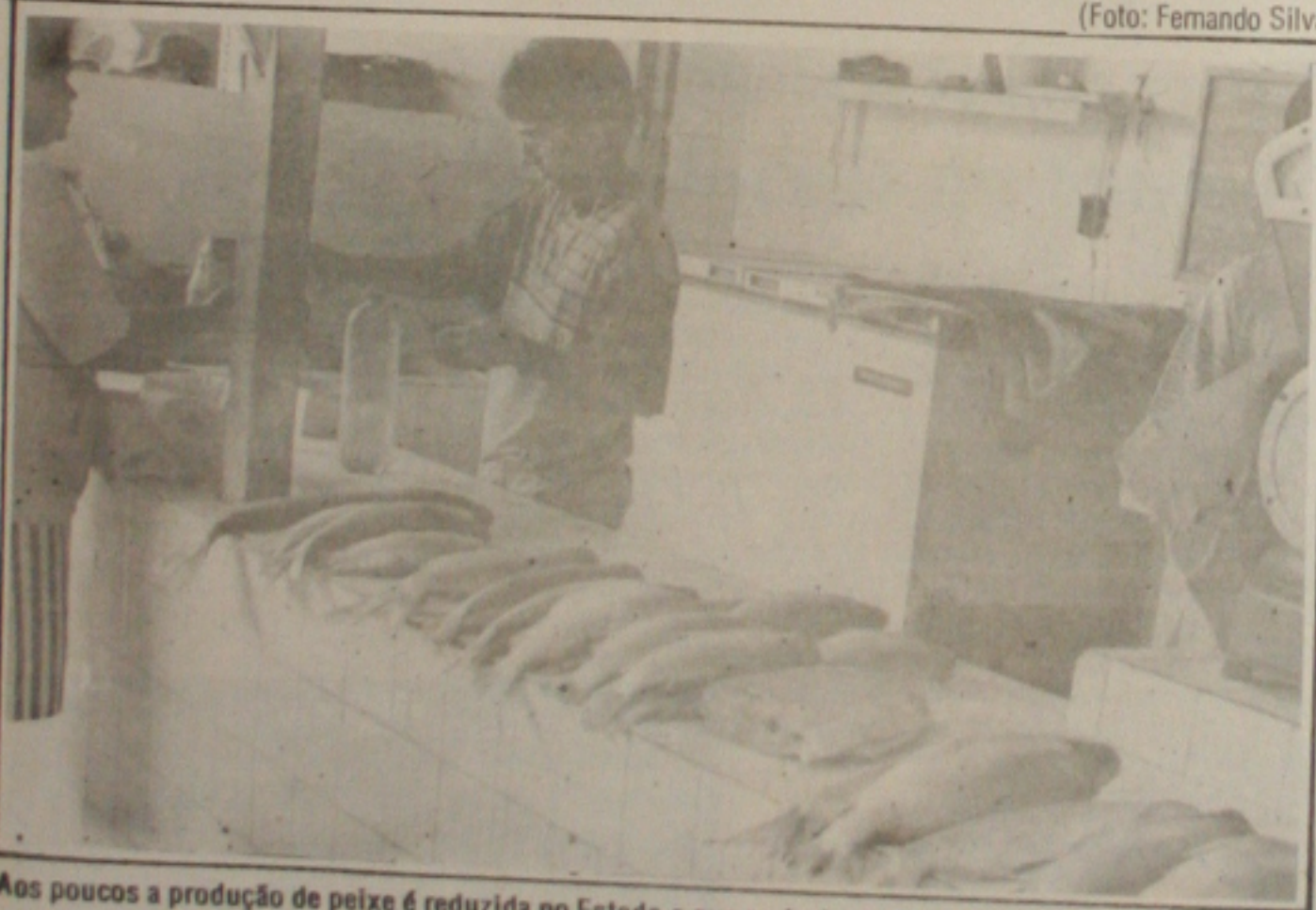
Aos poucos a produção de peixe é reduzida no Estado o que pode desempregar muita gente.