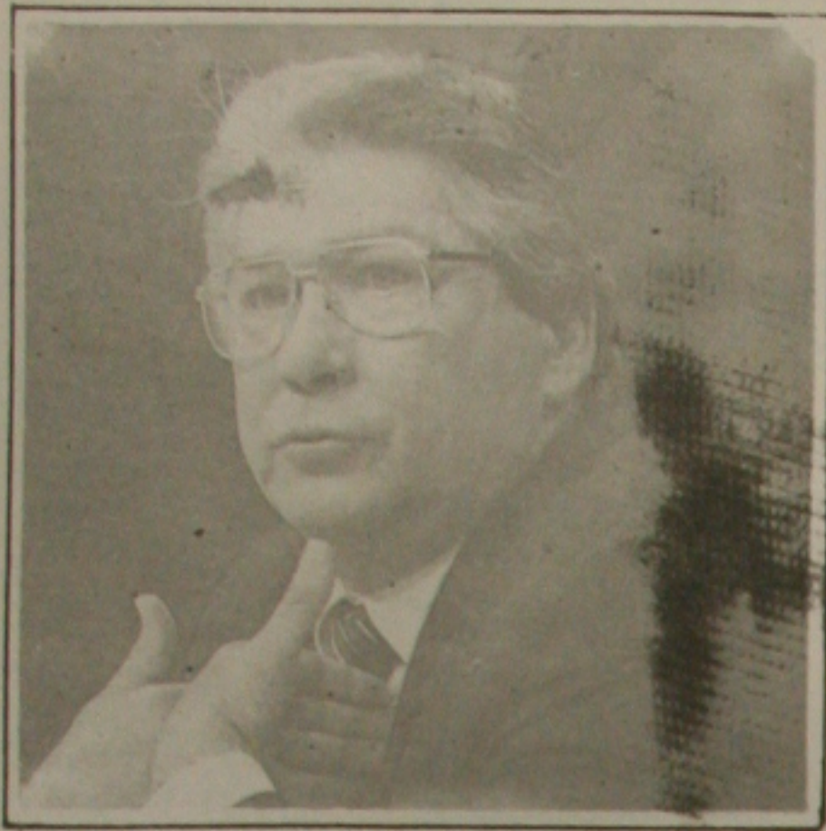
Mário Covas recusa-se a falar em privatização.