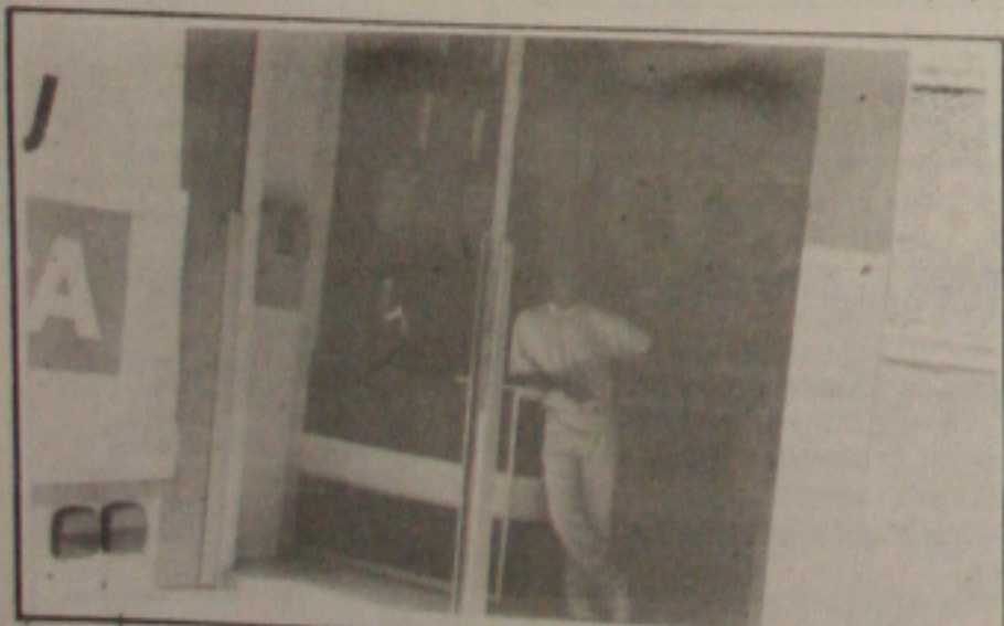
A existência de pontos clandestinos de revenda de fogos é uma ameaça para a população.

soas. "Temos o conhecimento de algumas, mas não temos o poder de fiscalizá-las sem que haja uma denúncia formalizada na Polícia", disse o coronel. Ele revelou que somente no ano passado a corporação apreendeu mais de 10 toneladas de fogos de artifício. "Mas essa apreensão só foi possível porque existiram as denúncias e, também, porque ocorreram durante o período junino". (Página 5A)