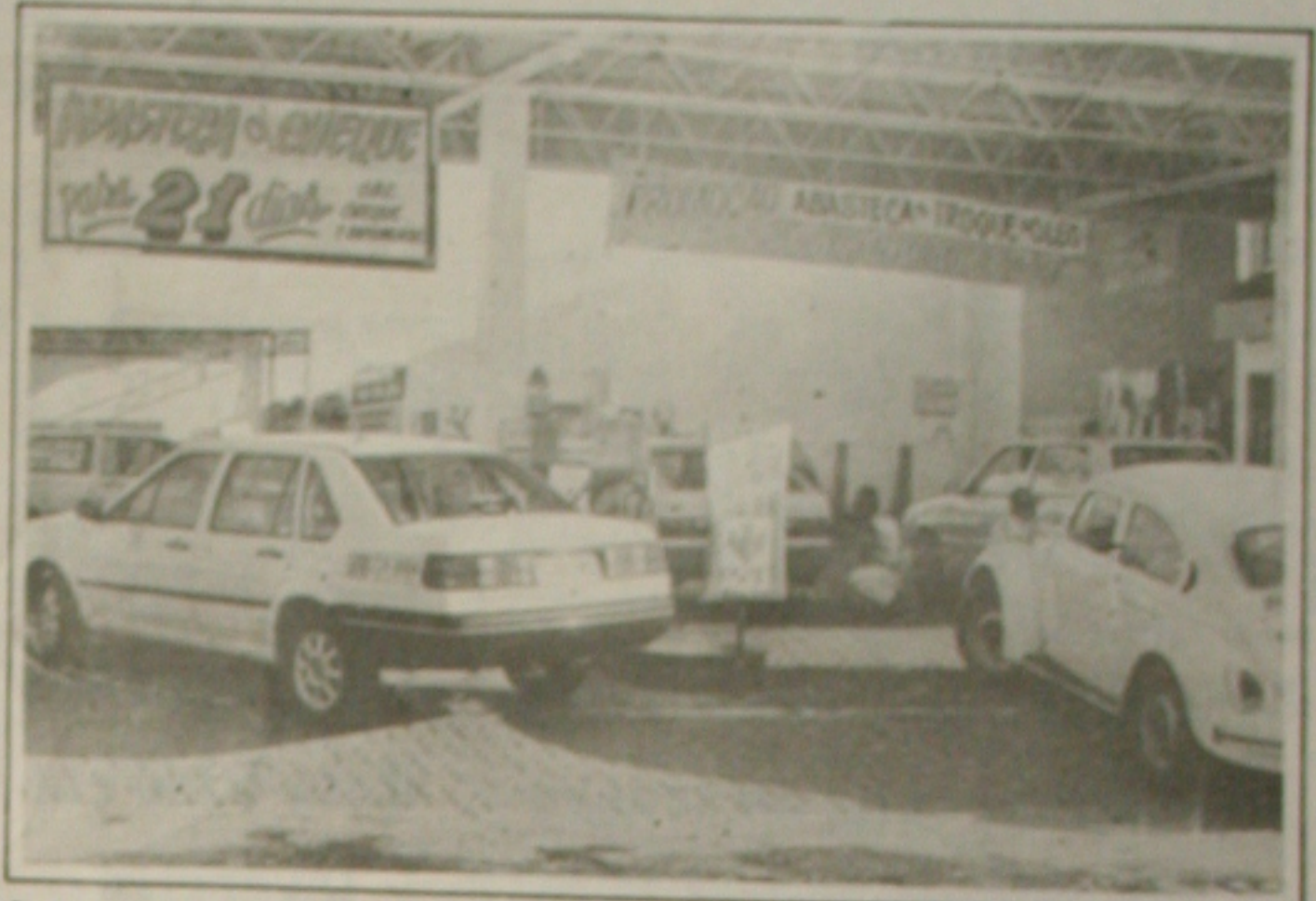
Os donos de postos de gasolina acumulam prejuízos com cheques sem fundos.