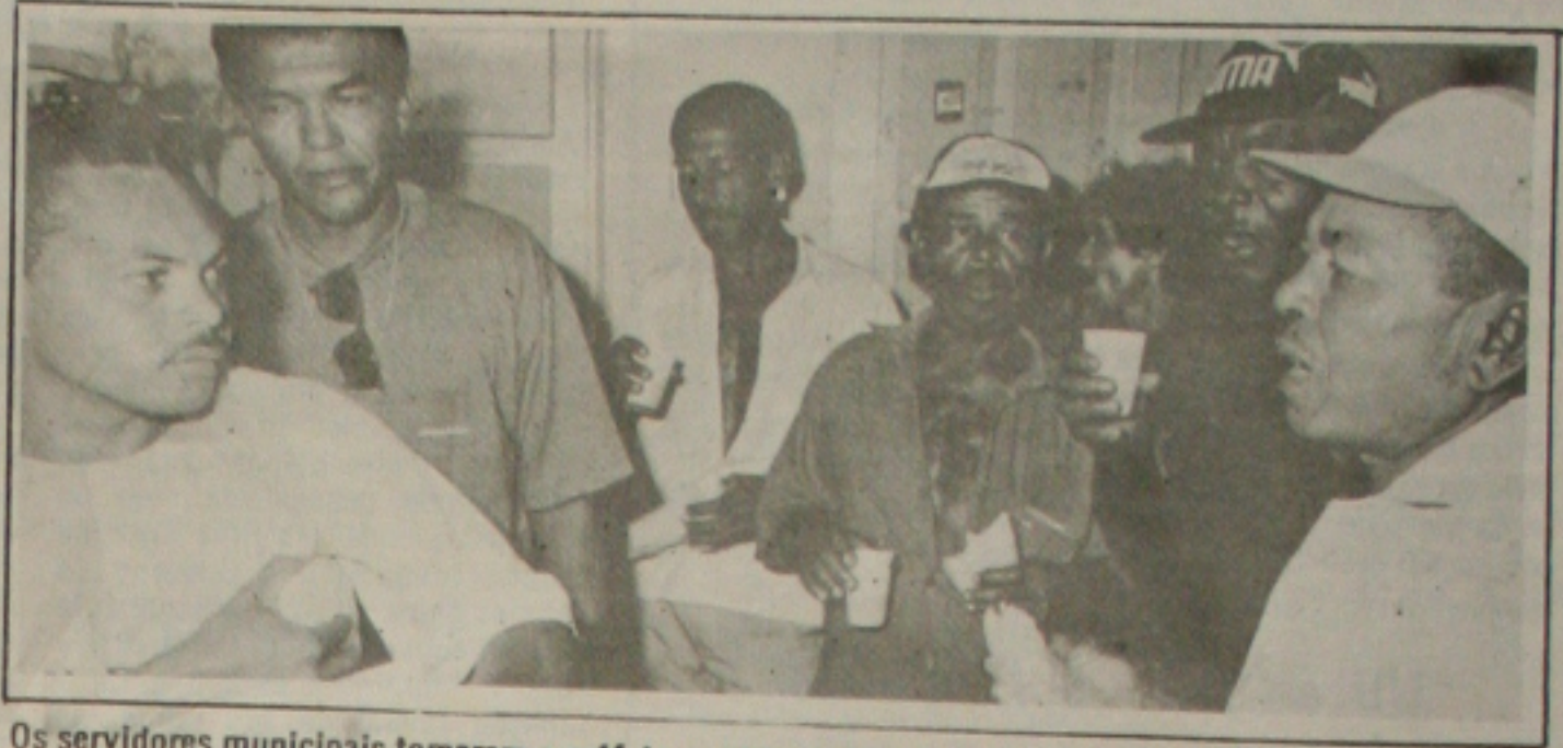
Os servidores municipais tomaram o café da manhã e discutiram as medidas judiciais