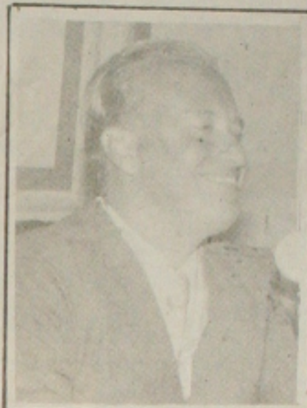
O Senador Antônio Carlos Valadares tomou posse última quarta-feira em Brasília. Nossos votos de pleno êxito.