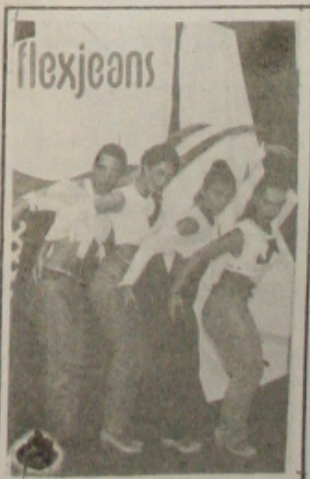
Flexjeans Com Lycra, a reinvenção do Jeans.

Em solenidade das mais concorridas foi aberto última sexta-feira, às 20h30min o I Bazar de Fundo de Quintal, a primeira edição da Feira da Atividade Informal de Sergipe. O evento contou com a presença do Governado Albano Franco e demais autoridades. A Feira prosseguirá até o próximo domingo no Centro de Convenções Ministro José Hugo Castelo Branco - DIA e conta com o apoio da Codise, Banco do Nordeste e Fabese.