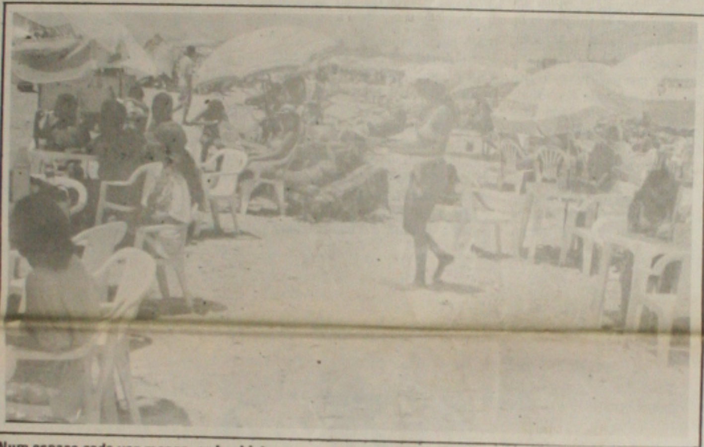
Num espaço cada vez menor, os banhistas ocupam as praias no auge do verão sergipano

A frequência na praia de Atalaia continua superando as previsões da Emsetur. Ontem, o espaço de circulação era mínimo entre banhistas e barracas. Apesar da depreciação visível de alguns equipamentos da nova orla (vários bancos já estão danificados), os turistas não param de elogiar a beleza de Atalaia. Com a maioria dos coqueiros recém-plantados secos, não sobra muito espaço na combra. A solução então é refrescar-se à base de cerveja gelada nos quiosques instalados ao longo da orla, que na opinião dos turistas uma das mais bonitas do país. (Página 5A).