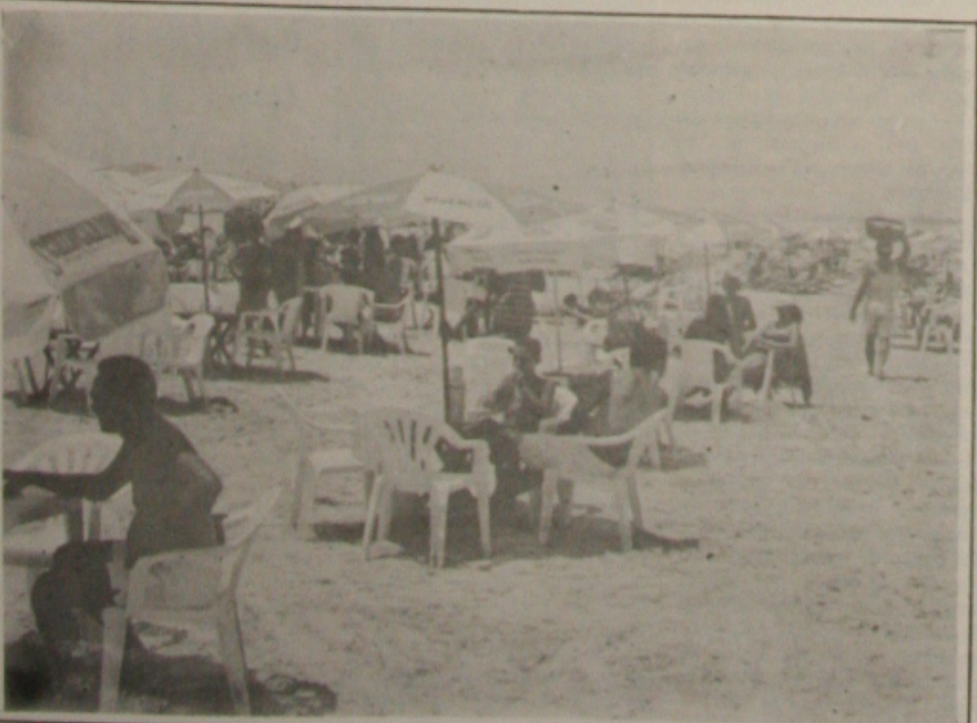
A Praia de Atalaia, o cartão-postal de Aracaju, é invadida diariamente pelos turistas.