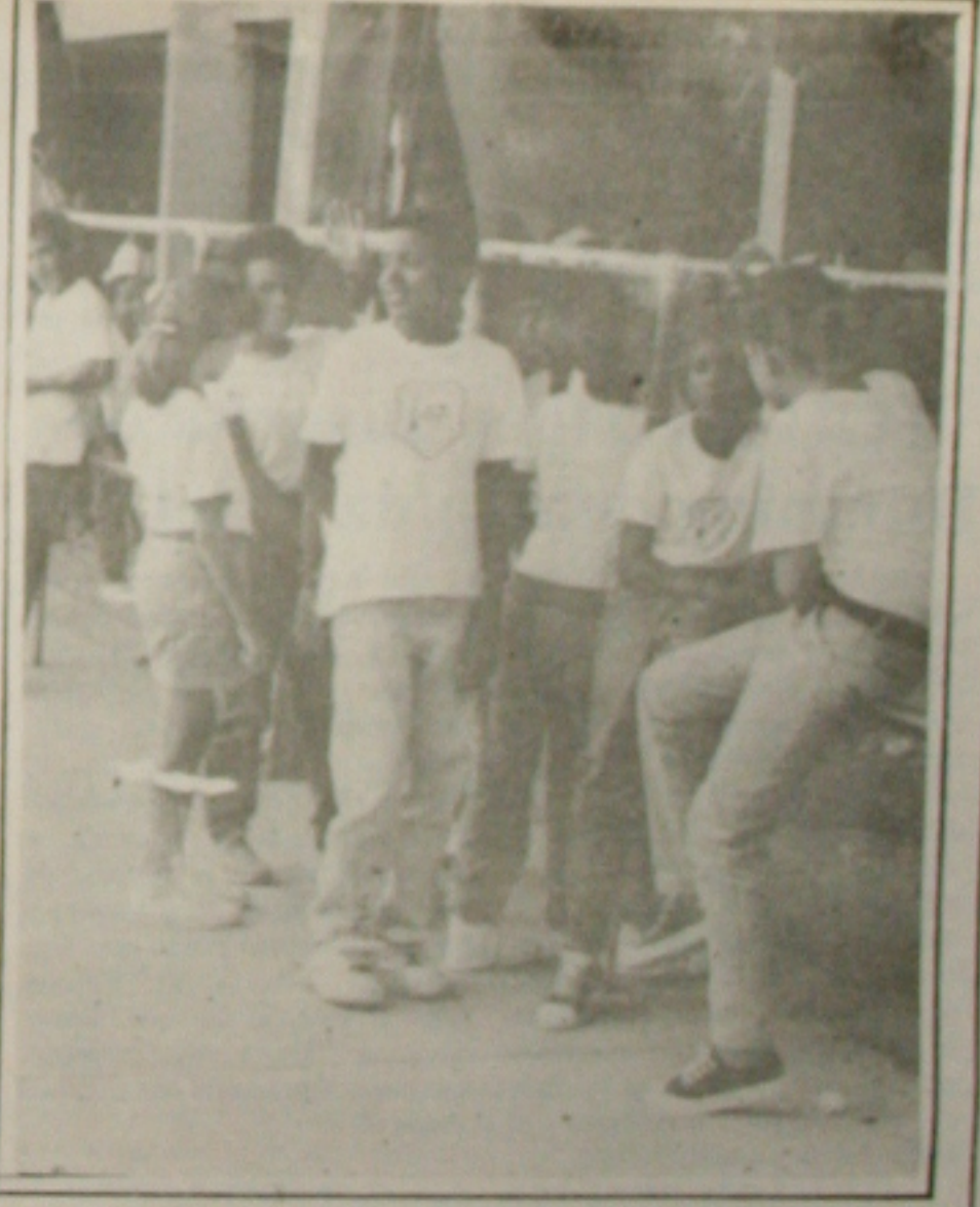
O Município sem vagas definidas para a Educação.

O diretor comercial espera que o Plano Real continue dando certo; que a moeda realmente se estabilize e que a seca não seja tão forte para que os negócios sejam bons.