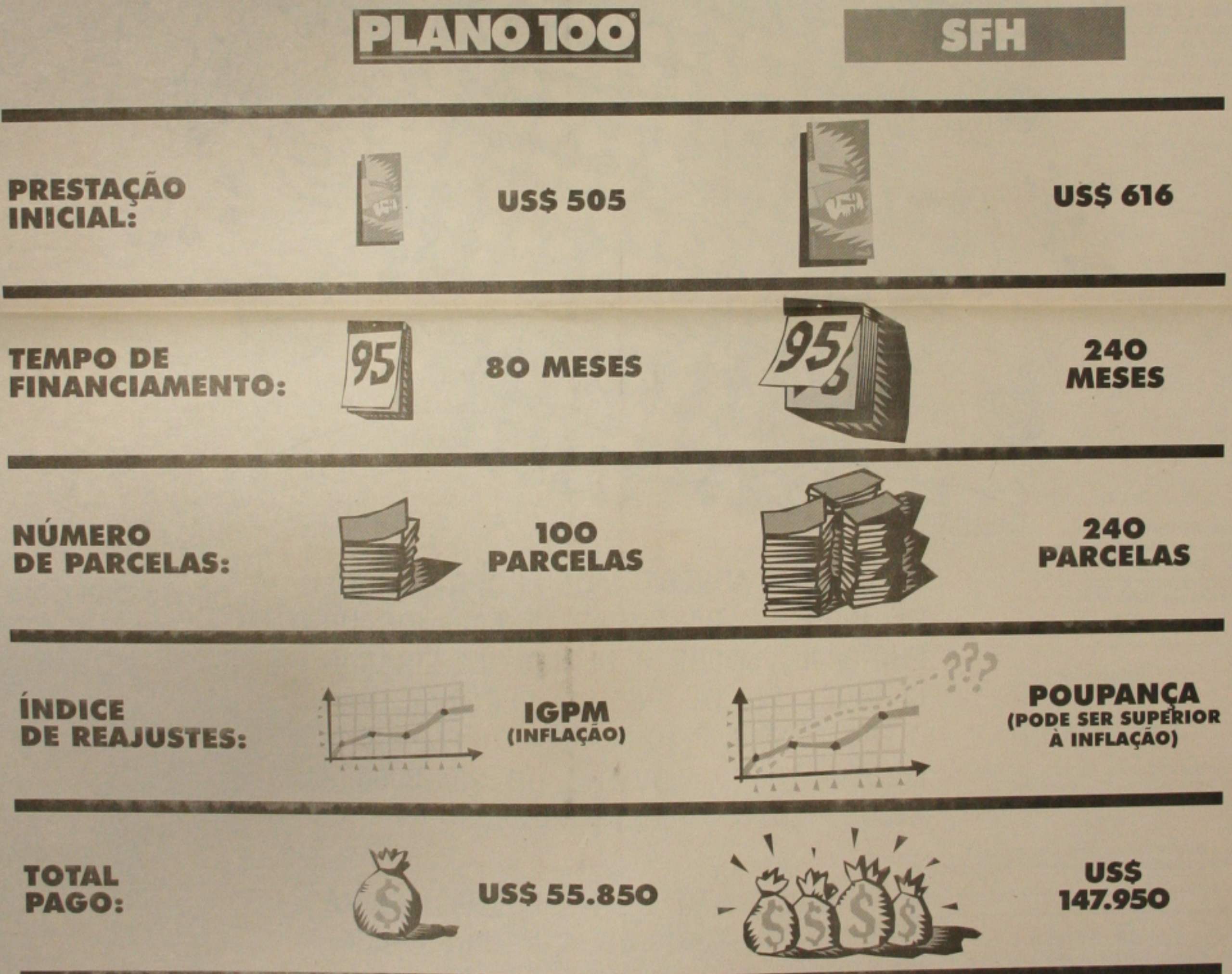
TABELA COMPARATIVA PLANO 100® X SFH. EXEMPLIFICANDO: SE VOCÊ FINANCIAR US$ 50.000 ATRAVÉS DO

O Plano 100® é muito bom para o comprador: garante as melhores condições, tanto de preço quanto de prazo. No SFH, você leva 240 meses para pagar o seu apartamento, sem falar na possibilidade de ter refinanciamento de 120 meses. Com o Plano 100®, são apenas 100 parcelas em 80 meses: 8 de entrada, 12 até as chaves e 80 mensais. Tudo sem complicação, sem comprovação de renda, sem parcelas intermediárias. Se você está atrás de um sistema que combine com você, esqueça o sistema. Vá de Plano 100®.