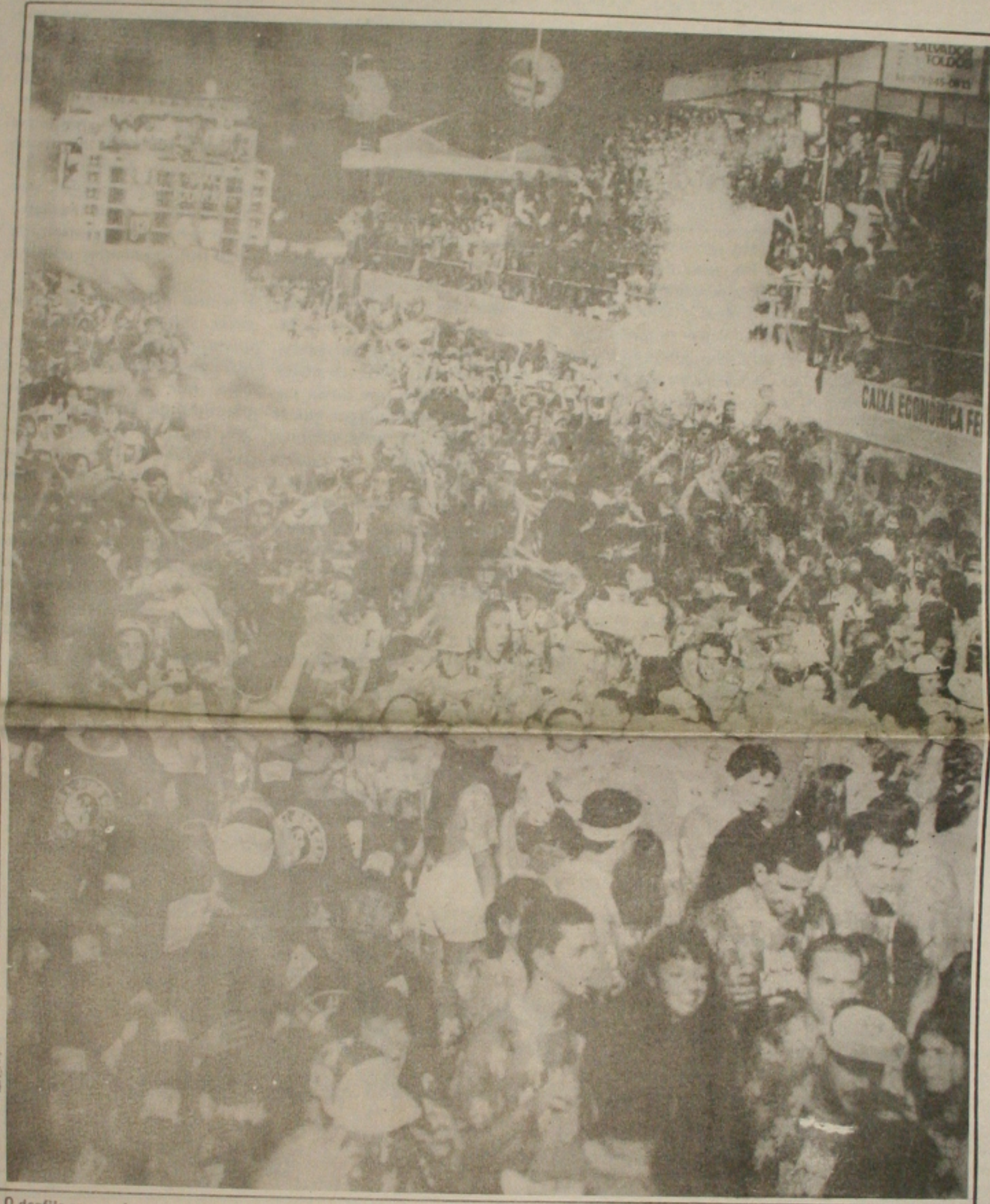
O desfile carnavalesco, que começou ontem com os blocos alternativos, terá seu ponto alto hoje com os blocos oficiais

O ministro da Fazenda, Pedro Malan, não irá adotar qualquer medida de restrição do consumo, apesar das vendas elevadas registradas em janeiro. O Governo Federal continuará com o monitoramento das vendas aos consumidores, já que as medidas de contenção de crédito, adotadas em outubro do ano passado, ainda são suficientes para impedir uma explosão no consumo. (Página 4B).