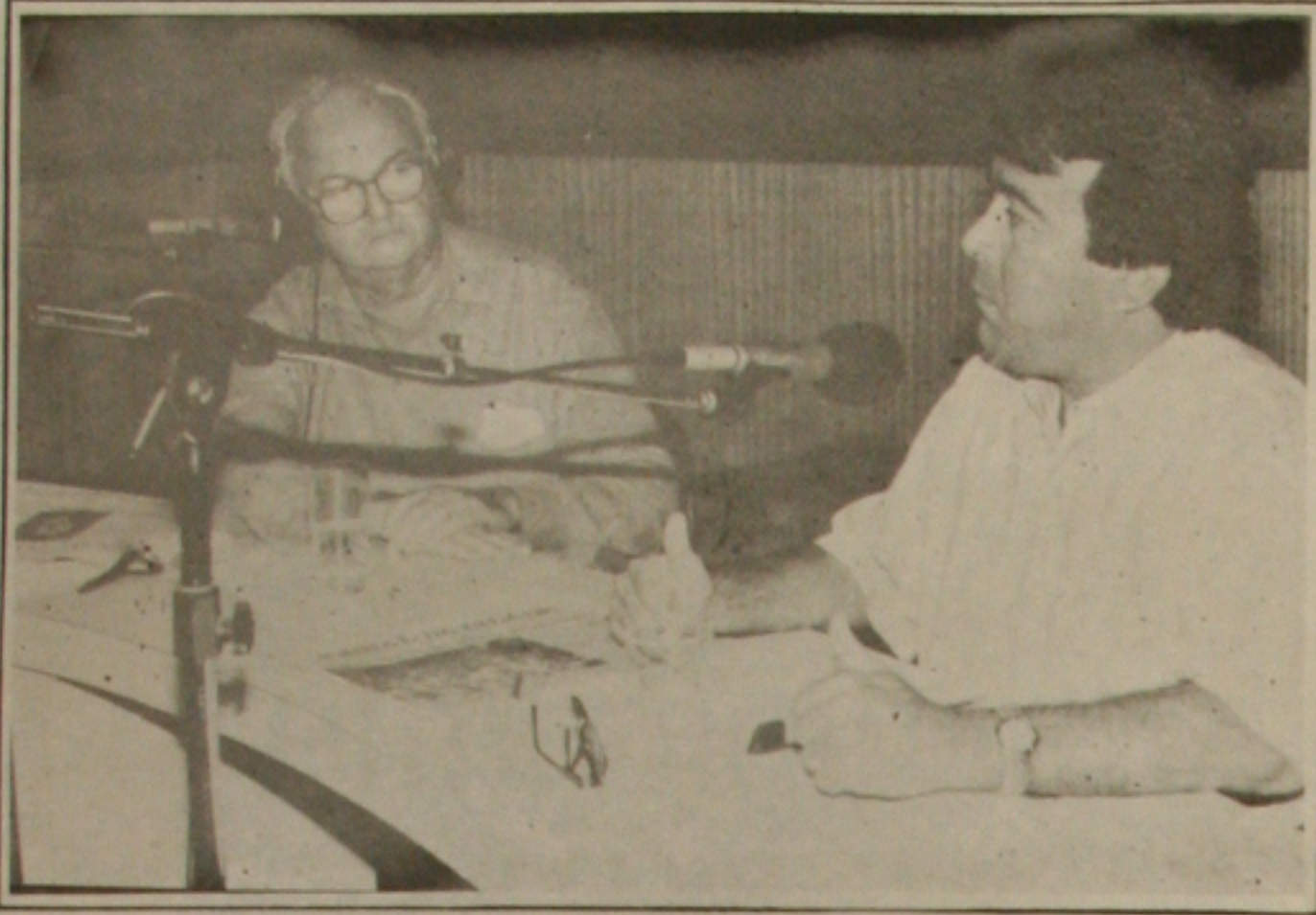
Almeida diz que quem trabalha não será demitido da Prefeitura de Aracaju