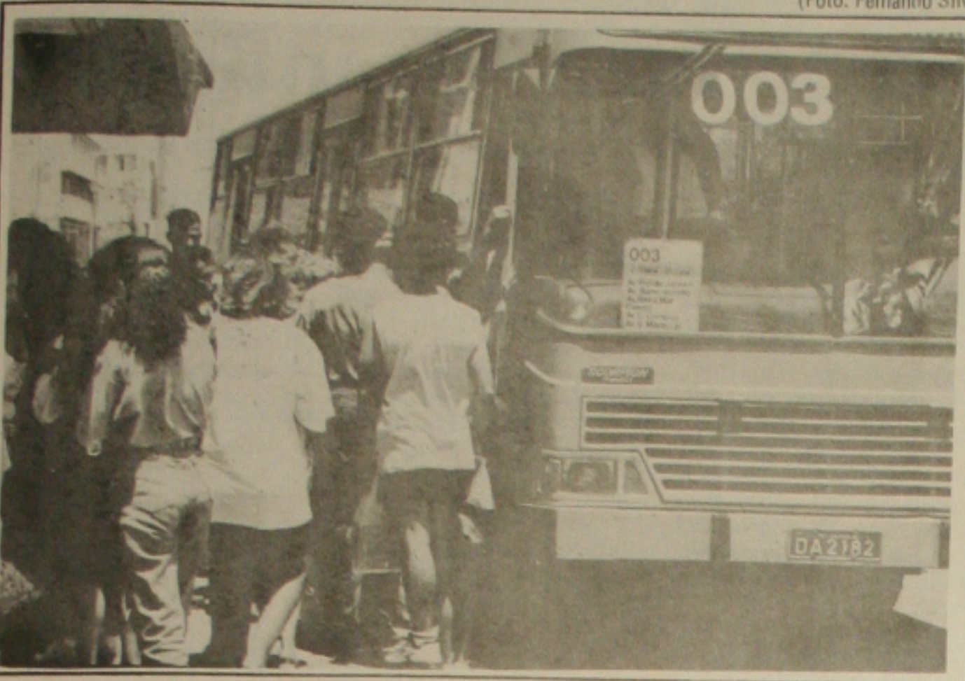
O passe-passeio contribui para o aumento exagerado no preço das tarifas de ônibus.