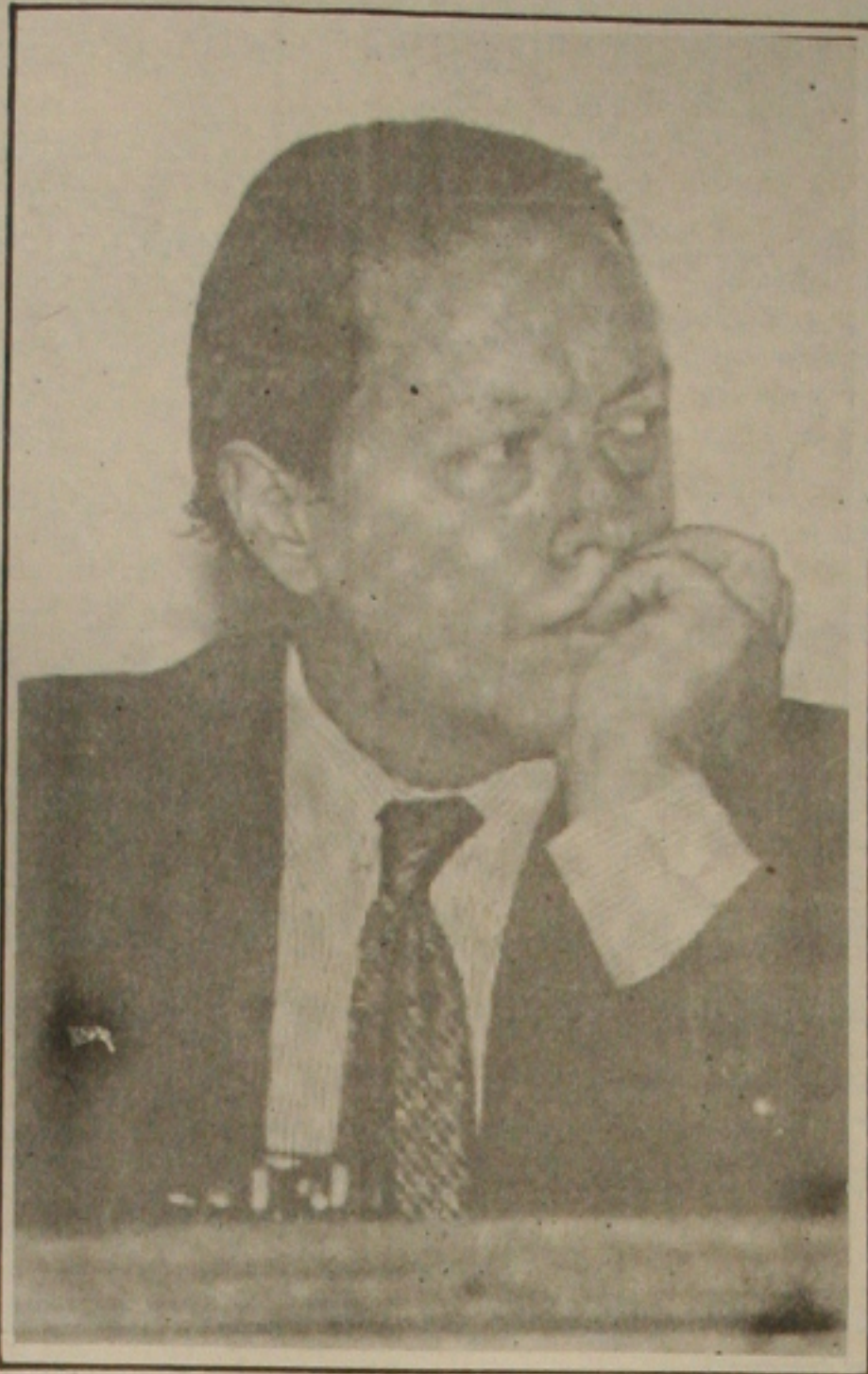
Malan: sem restrições

Fernando Henrique evitou comentar sobre qualquer mudança no programa de venda de carros populares, depois de ter agradado às montadoras nacionais com o aumento das alíquotas sobre os carros importados. "Eu ainda não estou bem informado sobre isso, primeiro vou conversar com a ministra Dorothea sobre o assunto", disse ele.