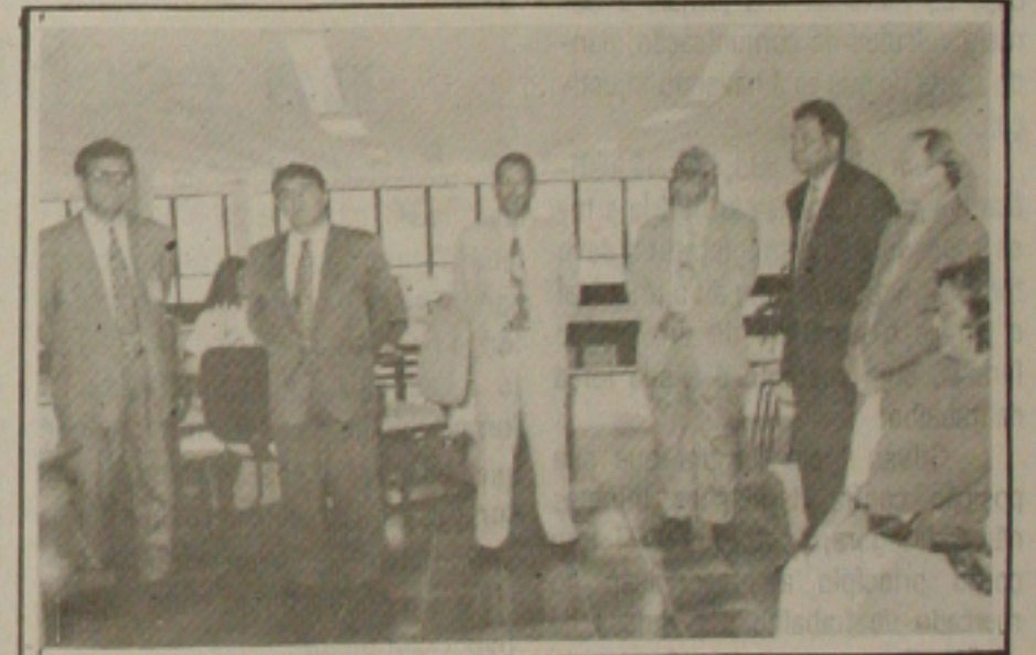
A solenidade de posse dos gerentes da CEF