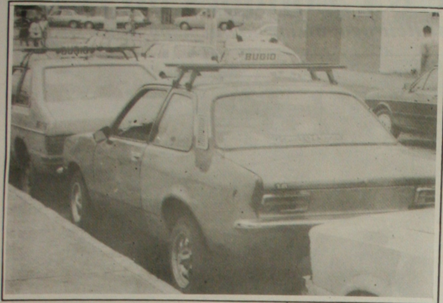
Os táxis-lotação ainda desrespeitam a legislação sobre o número de passageiros.