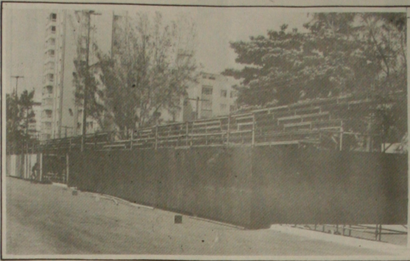
O acidente aconteceu por trás dessa arquibancada que matou os dois homens.

De acordo com as investigações realizadas pela polícia, o acidente aconteceu por volta das 5 horas. Depois de atropelar as duas pessoas, o condutor do Voyage, que é um irmão de Ednaldo evadiu-se do local sem deixar nenhuma informação para os policiais. Os agentes estiveram na sede da Celi Táxi em busca de informação, mas ninguém soube explicar o paradeiro do motorista-atropelador.