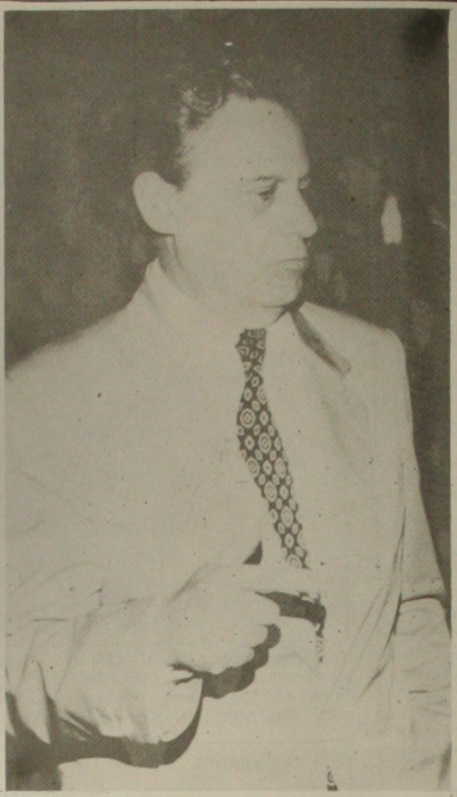
FHC: serviços bons e baratos