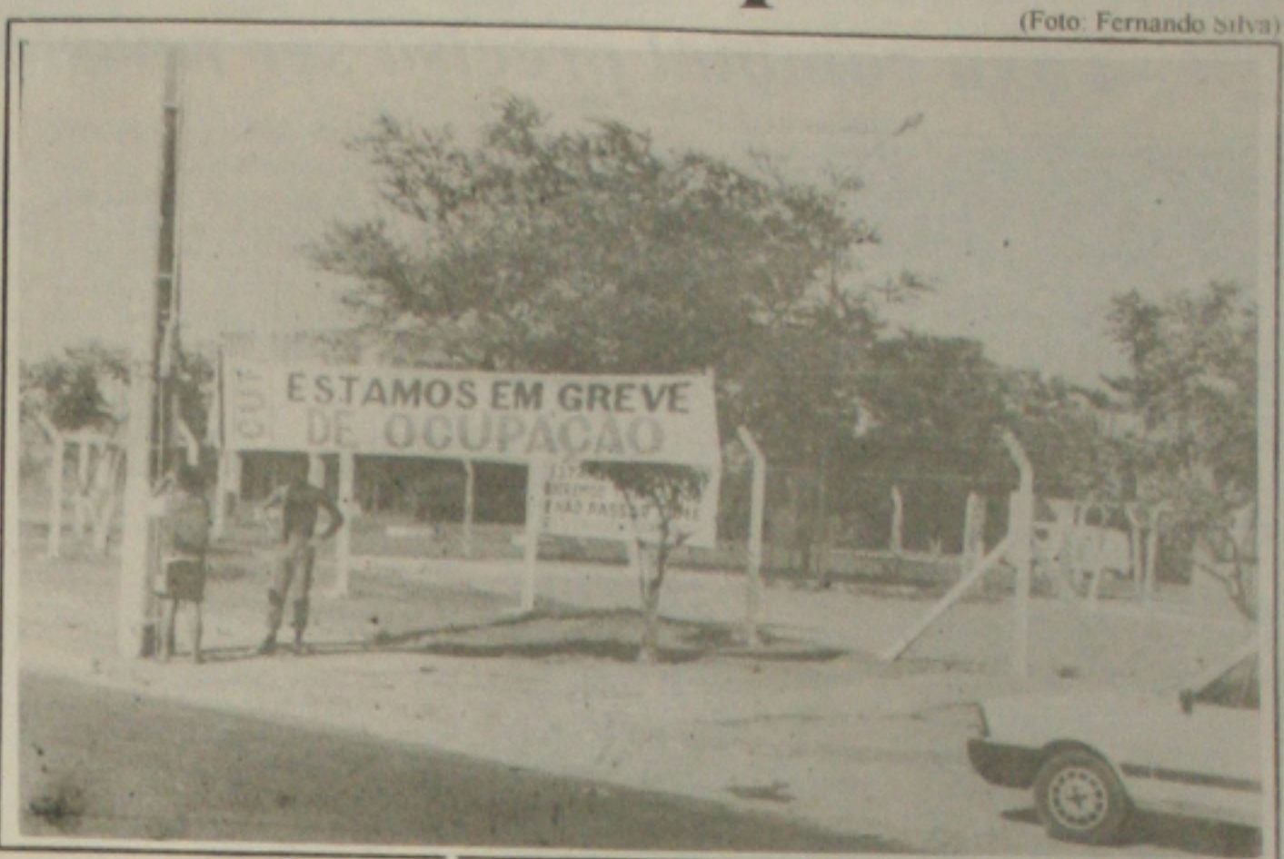
A Alpargatas iniciou o processo de demissão por causa da greve ilegal.

A greve, que durou 22 dias, teve adesão de 100% dos operários. Eles compareciam diariamente à fábrica, nos seus horários de trabalho, batiam o cartão de ponto e se aglomeravam no pátio da empresa sem que produzissem. Na quinta-feira passada o TRT julgou a greve de categoria abusiva e na sexta-feira, às 14 horas, todos retomaram ao trabalho. No sábado iniciaram as demissões, que até a segunda-feira chegavam a 39.