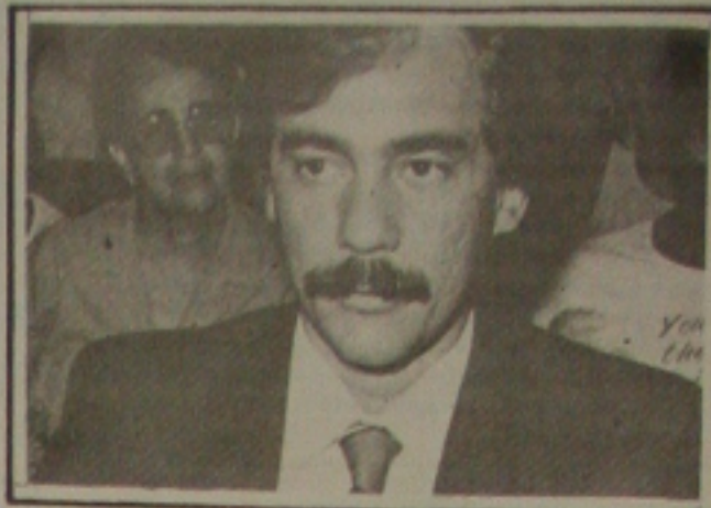
O deputado Venâncio Fonseca é o 13º no comando do parlamento sergipano.