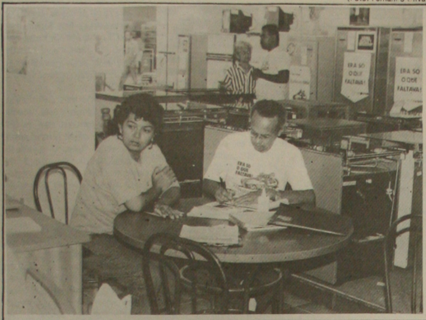
As lojas de refrigeração já não têm mais aparelhos de ar-condicionados para vender.