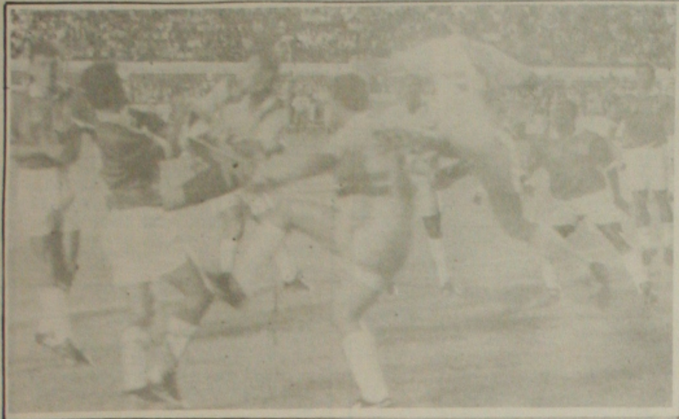
O ataque do Sergipe pressiona a defesa do São Paulo