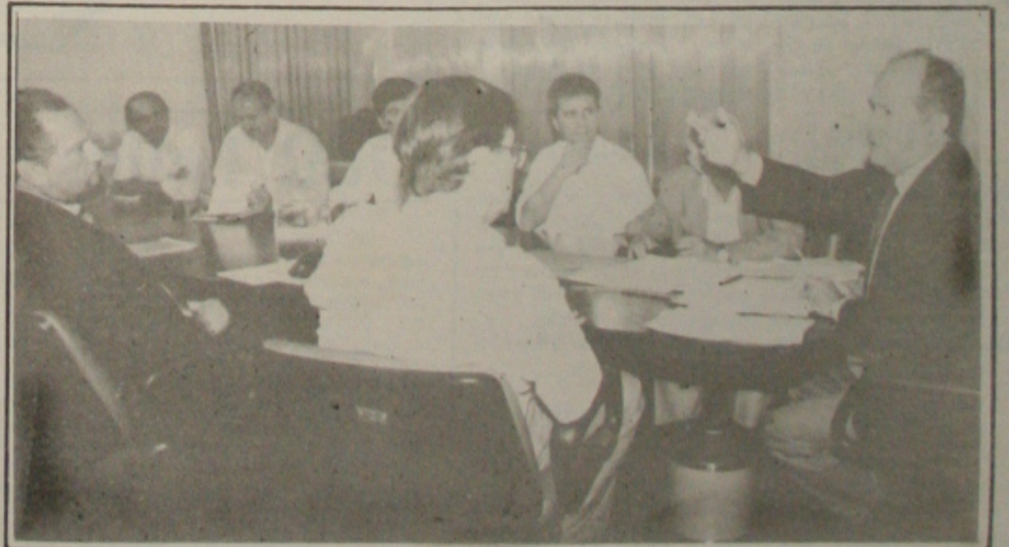
Com a fábrica de barrilha, o governador Albano Franco inicia a construção do Pólo Cloroquímico

Desde o início do Plano Real que a GAZETA tem mantendo o seu preço de capa em R$ 0,26, apesar de termos observado aumentos, alguns abusivos, nos preços de suas matérias primas. Infelizmente, nas últimas semanas, em virtude da escassez mundial, o preço do papel de imprensa mais do que dobrou, obrigando-nos a aumentar o preço do exemplar desta GAZETA, para R$ 0,50, para que perdamos a compreensão dos leitores.