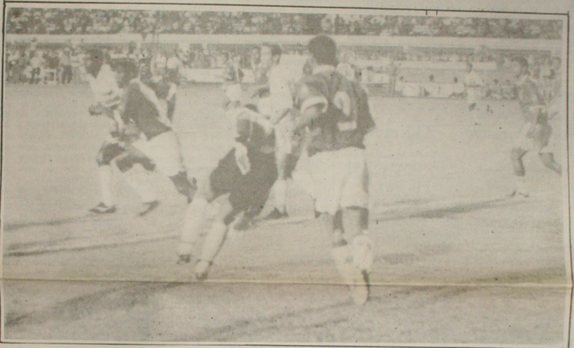
O Sergipe foi poucas vezes ao gol do São Paulo e sempre na base do contra-ataque