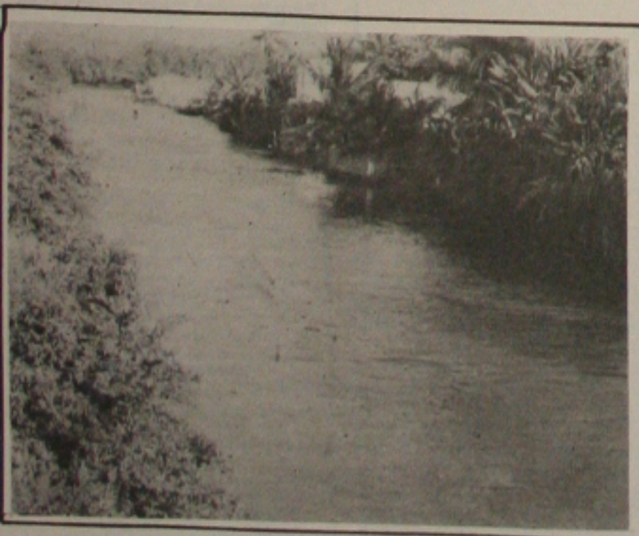
O nível do rio Poxim caiu dois metros no verão

sem água. A redução da capacidade do rio é agravada pelo aumento do consumo de água, provocado pelo forte calor. O problema pode agravar-se se as chuvas custarem a chegar. Segundo o Deso, os sistemas de Itura e Cabrita, que auxiliam o Poxim, também estão com a sua produção abaixo da cota normal. (Página 5A).