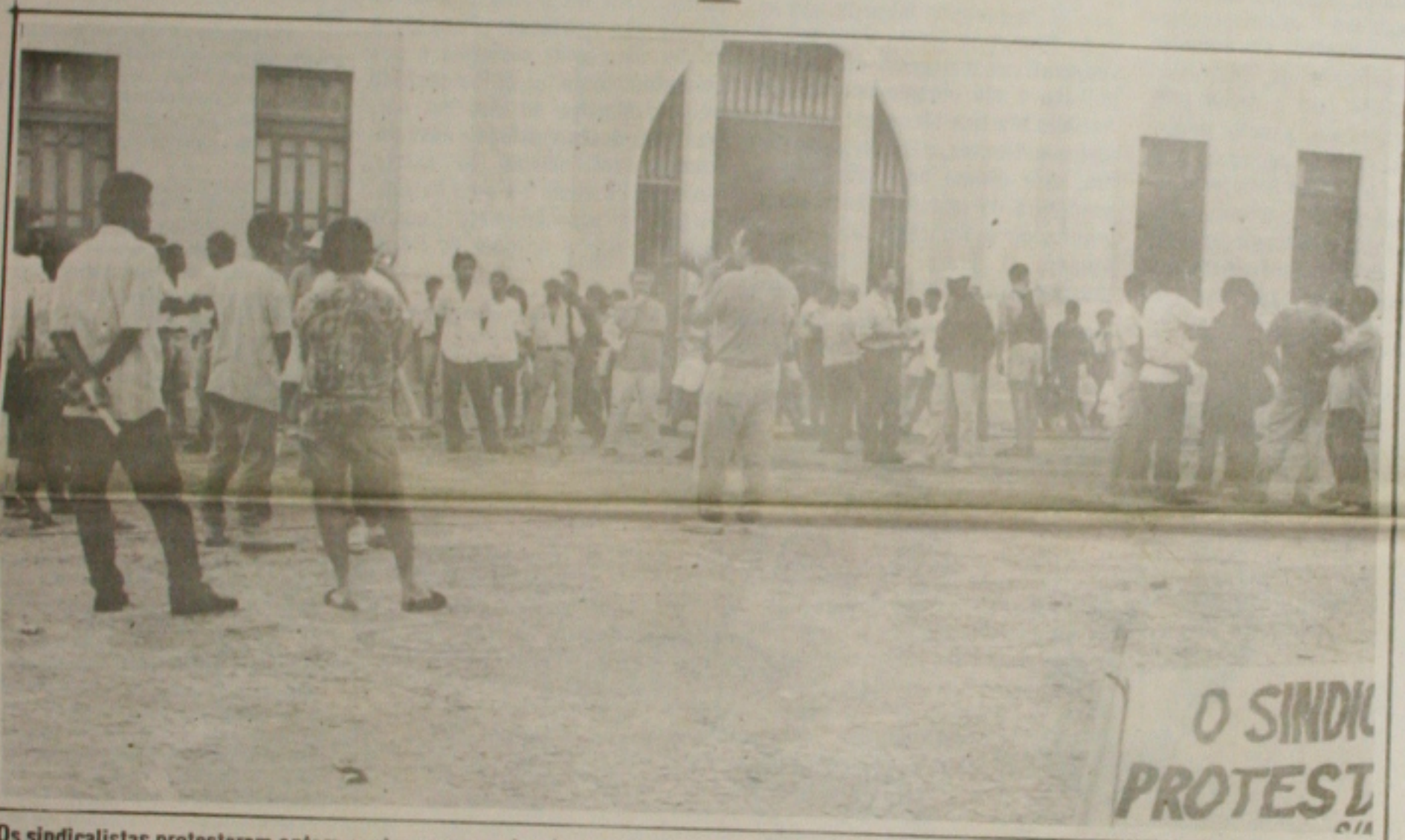
Os sindicalistas protestaram ontem contra as propostas de revisão constitucional que chegam hoje ao Congresso. (Página 5A)

O presidente Fernando Henrique Cardoso vai propor hoje ao Congresso a extinção do monopólio da Petrobrás na exploração e refino do petróleo no País. O Governo não resistiu às pressões do PFL. O argumento do partido e a guerra entre os Estados do Nordeste para sediar a nova refinaria da Petrobrás. Além de Sergipe, disputam a instalação da refinaria os Estados de Pernambuco, Ceará e Rio Grande do Norte. A governadora do Maranhão, Roseana Sarnay, que também entrou na briga, opinou em conversa com Fernando Henrique que "se acabar o monopólio do refino, a localização da nova refinaria será definida pelas regras do mercado". O presidente do partido também se somou ao coro dos petelistas pela quebra do monopólio do petróleo. Mas, um dirigente do PFL