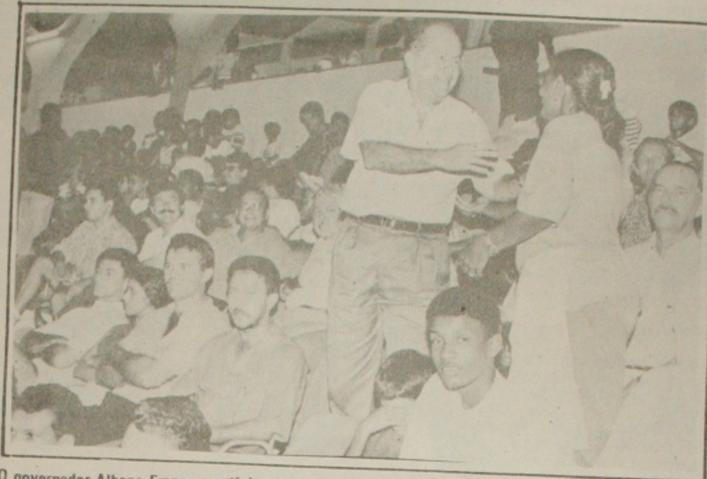
O governador Albano Franco prestigiou o representante sergipano na Copa do Brasil e entre torcedores viu o Sergipe empatar com o grande São Paulo

Para o time paulista, com certeza estão decepcionados. Mas o treinador disse, que o resultado não foi nenhuma surpresa, para quem vem acompanhando o trabalho desenvolvido desde o início da preparação da equipe, para essa partida. Como não há nenhum amistoso marcado para este final de semana e o próximo será carnaval, o treinador disse que dificilmente o Sergipe fará algum amistoso até a estreia no campeonato. "Temos que trabalhar a equipe dentro de campo. Dar um padrão de jogo e esperar a partida de estreia, para ver como o time vai se comportar". Se expressou o treinador rubro. Apesar das contratações que estão chegando, os dirigentes rubros prometem mais alguns reforços, até o início da temporada. Pelo menos mais dois jogadores, de preferência dois atacantes, devem aportar no João Hora, até a próxima semana. Ontem foram reiniciados os trabalhos no João Hora. Os atletas ainda viviam momentos de alegria, com o empate contra o São Paulo e principalmente da forma com foi conquistado. Os jogadores que participaram integralmente do jogo, tiveram trabalho leve, mas os demais participaram de um trabalho com bola, orientado pelo Ailton Rocha. O treinador espera que os atletas, que estão sem contrato definam logo a situação com os dirigentes, porque Ailton sabe que são bons valores e conta com esses atletas nos seus planos para o campeonato e para a Copa do Brasil.