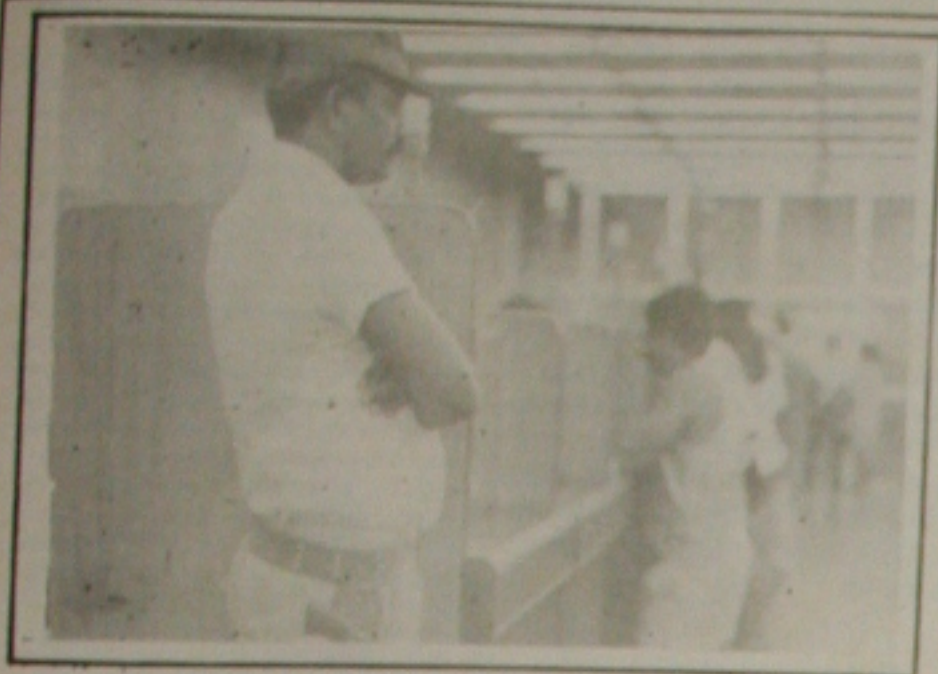
A Polícia Federal quer vigilantes diplomados