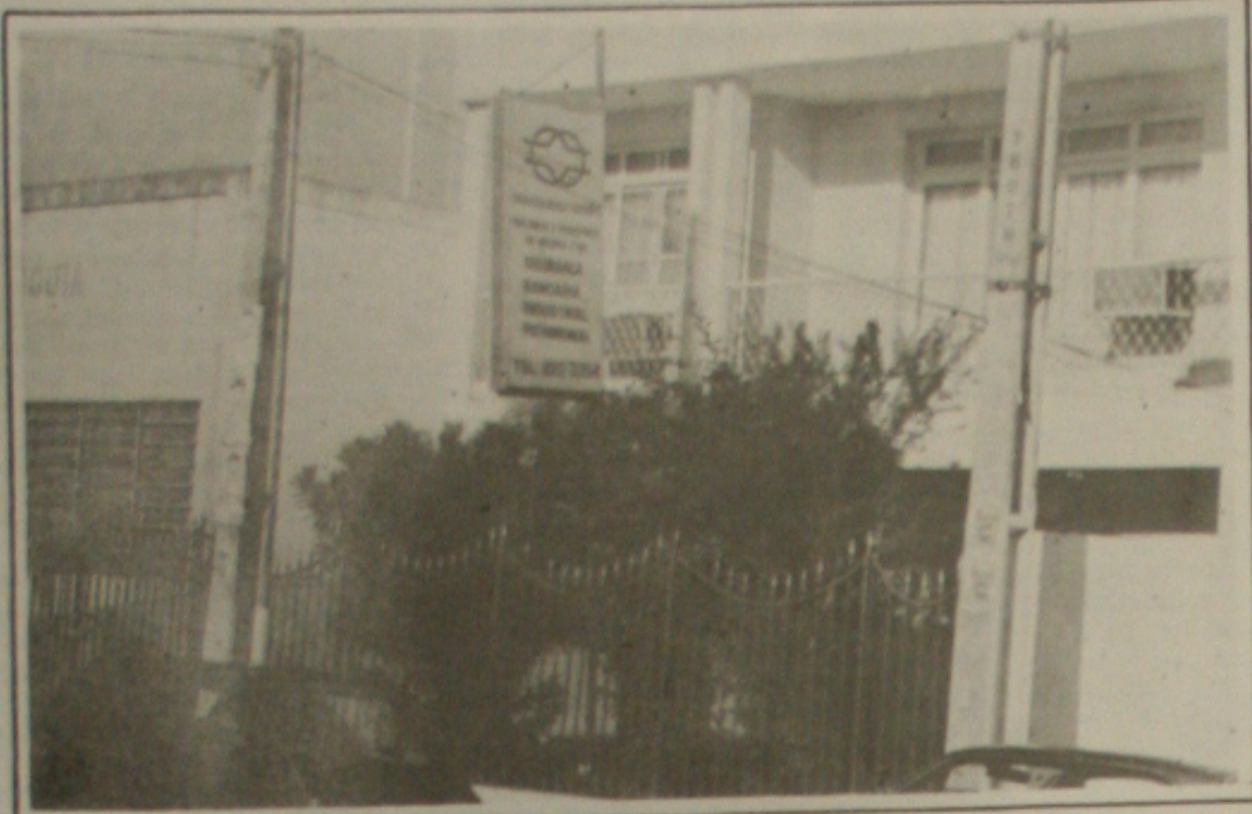
As empresas de vigilância instaladas no Estado estão sob fiscalização da Polícia Federal.

Duas empresas de vigilância no Estado poderão ser fechadas pela Polícia Federal. A informação é do superintendente do Departamento de Polícia Federal em Sergipe, Juliano Maciel que solicitou ao Departamento de Assuntos de Segurança Pública, órgão vinculado ao Ministério da Justiça, a suspensão temporária destas empresas por desrespeito à legislação.