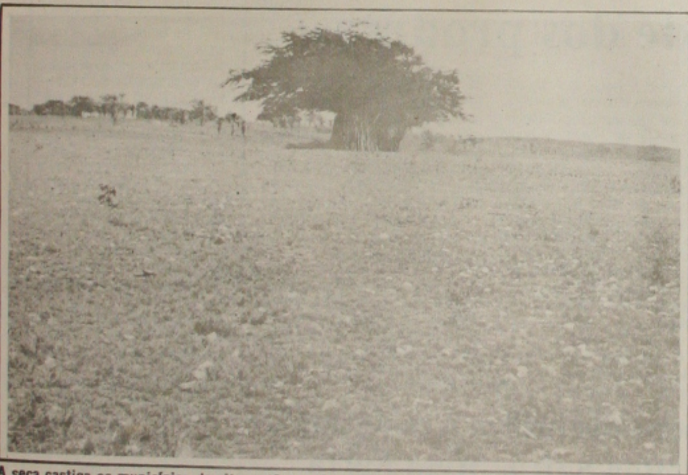
A seca castiga os municípios do alto sertão sergipano, podendo afetar a produção de milho.

Para avaliar o quadro do semi-árido, a Fetase está convocando uma reunião com representantes dos Sindicatos dos Trabalhadores Rurais do Estado. Nesta reunião a categoria pretende apontar alternativas para minimizar o problema e discutir a pauta do Congresso Nacional dos Trabalhadores Rurais a ser realizado na segunda quinzena do mês de abril. E proposta da Fetase tentar uma audiência com o Governador Albano Franco para discutir a seca no Estado.