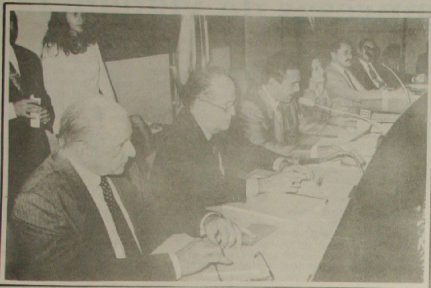
Venâncio discursando na abertura dos trabalhos da Assembleia Legislativa.