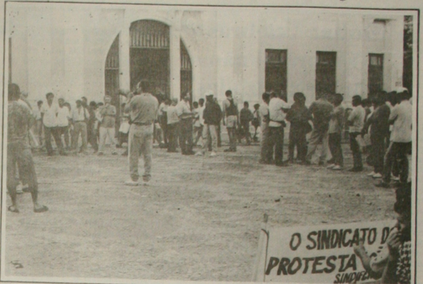
As centrais sindicais realizaram ontem à tarde uma manifestação em frente ao Olimpio Campos.

Explicou que o comitê foi criado mediante a unificação dos trabalhadores contra as propostas do governo de FHC em defesa dos seus direitos. Enfatizou que toda a classe trabalhadora deve se unir nessa luta para que consiga o seu objetivo, a exemplo do que ocorreu na revisão constitucional de 1994 quando os interesses das elites não foram concretizados.