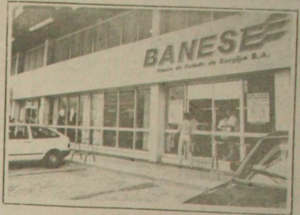
Banese: na mira dos procuradores

O Ministério Público Estadual pediu à diretoria do Banese que informe a real situação financeira do banco. A fim de proteger o patrimônio público do Estado, que tem a maioria das ações do Banese, o Ministério Público quer saber o resultado da auditoria interna no Banese, por determinação de Banco Central. A Procuradoria Estadual também deseja saber os nomes dos auditores que elaboraram o diagnóstico e as causas que levaram o banco a essa situação.