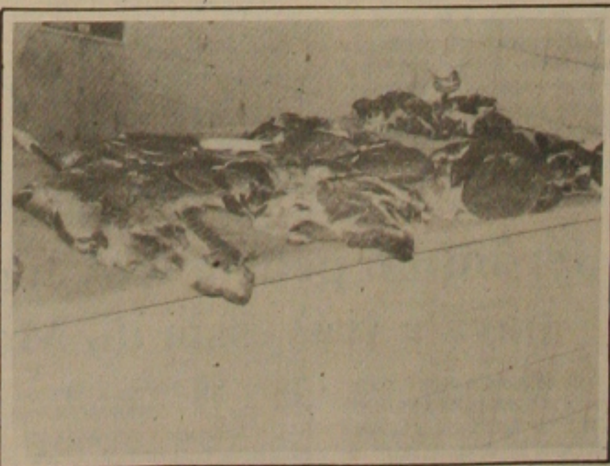
A carne pode ter o seu preço reajustado em decorrência da elevação do frete.

A cidade de Itabaiana, a 56 quilômetros de Aracaju realiza duas feiras livres por semana - quartas e sábados, com o abate de mais de 400 reses, o que significa que a carne poderá sobrar no mercado por falta de compradores diante da elevação de preços em consequência do frete.