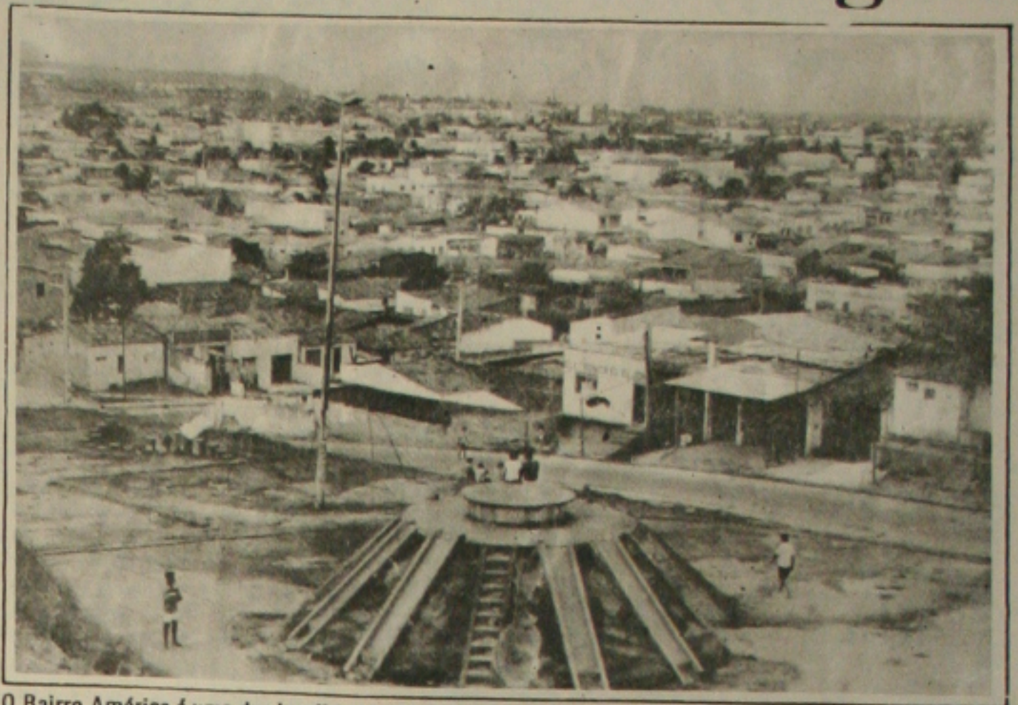
O Bairro América é uma das localidades que sofrem com a falta de água em Aracaju.

Além destes sistemas, a capital é abastecida pelos sistemas São Francisco e Ibura. O primeiro é responsável pelo abastecimento de grande parte do Grajeru até os núcleos habitacionais Marcos Freire e João Alves Filho, no município de Nossa Senhora do Socorro, enquanto o segundo abastece uma parte menor nos conjuntos Jardim e Parque dos Faróis. Estes sistemas estão operando regularmente, mas mesmo assim com sua capacidade um pouco reduzida. "Nestas localidades, a comunidade não chega a ficar sem água 24h porque não há o sistema de manobras nestes sistemas de abastecimento", garante o jornalista Fernando Fontes.