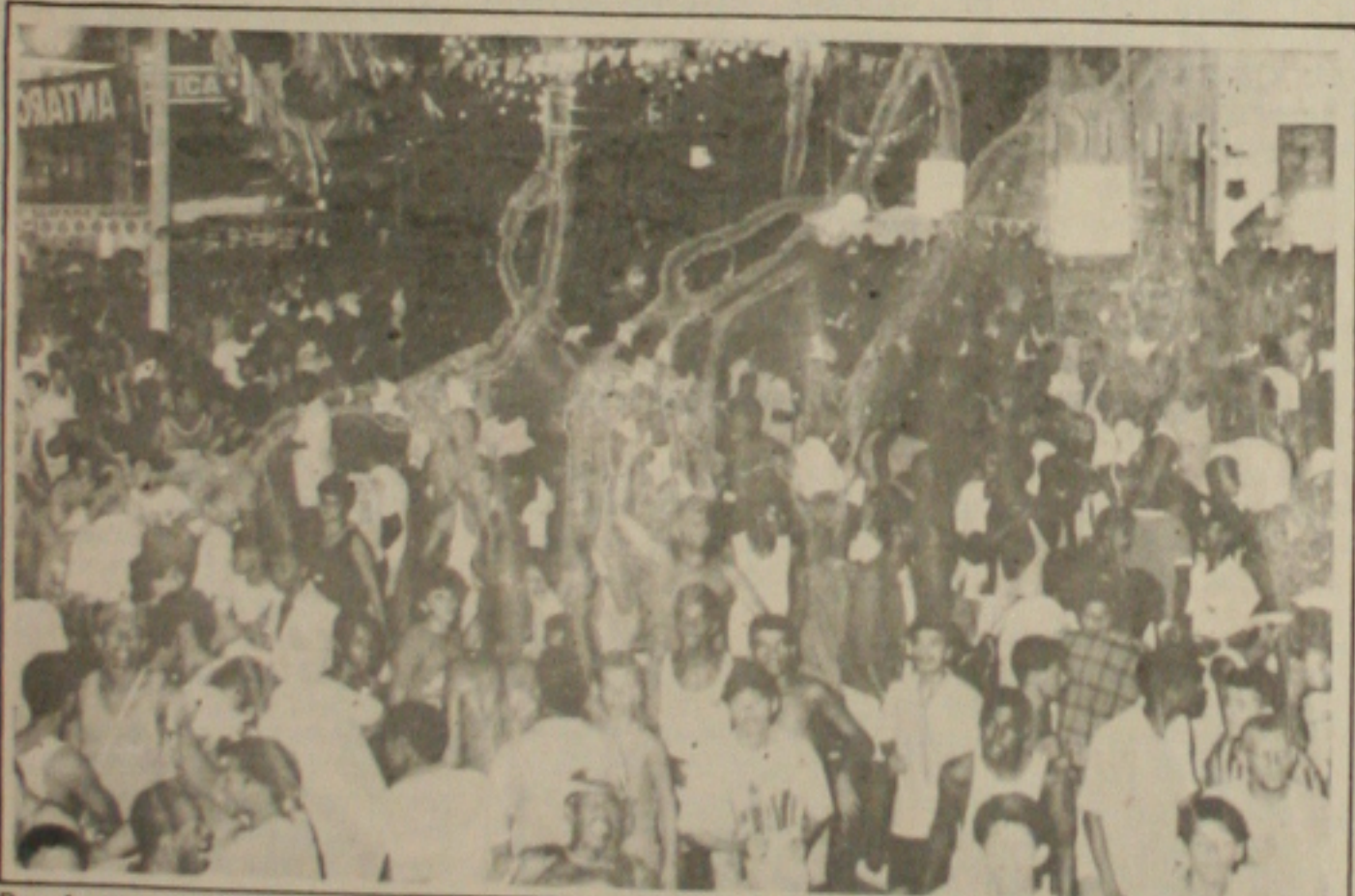
Depois de brincar o Carnaval em Aracaju, os foliões estão preocupados com os casos de Aids.

O número de doentes tem aumentado consideravelmente. Nos últimos dois anos, para se ter uma idéia, o número de pacientes doentes aumentou em 100%. Em 1992 foram registrados 30 casos da doença, no ano seguinte o número aumentou para 40 e no ano passado foram registrados 60 casos. Neste ano a Secretaria de Estado da Saúde já detectou 6 novos casos, sendo a maioria transmitido através de relações sexuais.