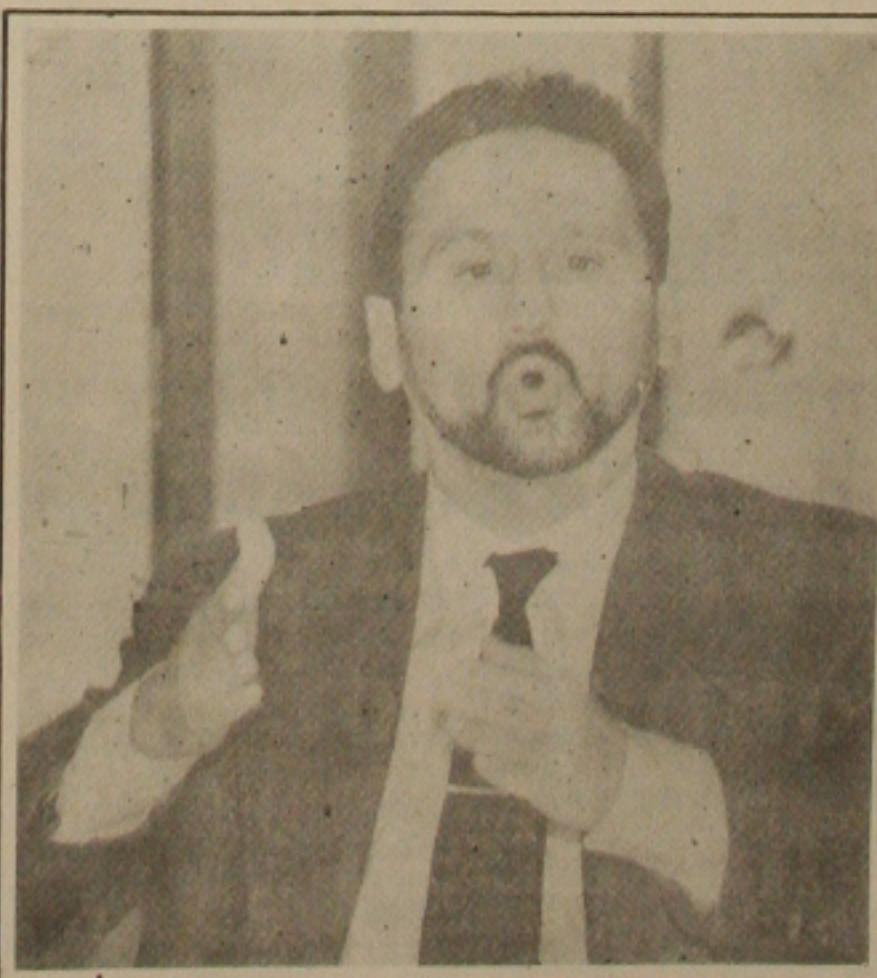
Cutolo diz que cobrará tudo dos "grandes" inadimplentes.

O FGTS estava financiando a população mais favorecida e o FGTS deve ser usado inclusive na compra de imóveis usados. (CM).