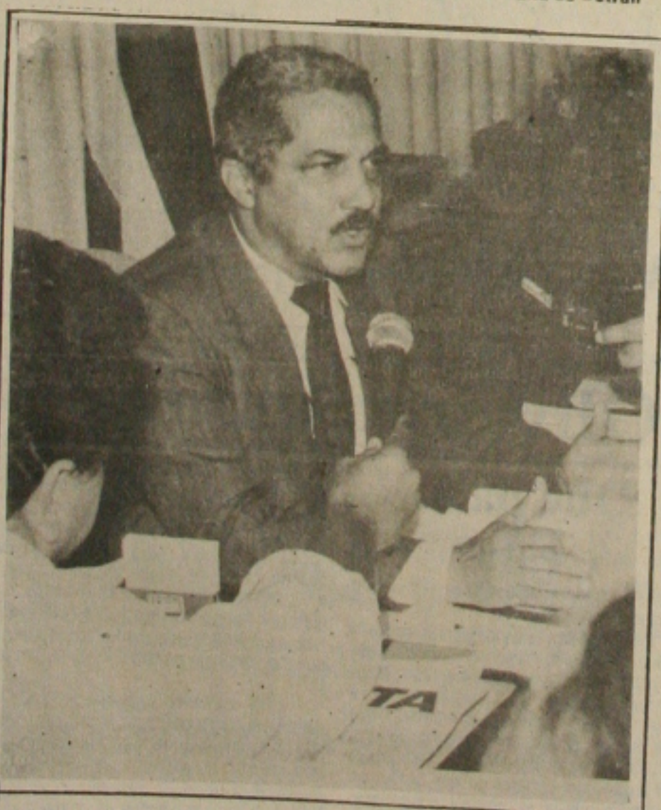
Mangueira considerou um sucesso a "Operação Serpentina", apesar dos 19 óbitos

O Deso informou ontem que o fornecimento de água em Aracaju continua "crítico", principalmente na zona sul, abastecido pelas sistemas Poxim e de Cabrita. A vazão do Rio Poxim é de apenas 30% de sua capacidade normal, sem previsão de melhoria, se não chover. O abastecimento da água está racionado em toda a cidade. Além da capital, os municípios em pior situação em Lagarto, Simão Dias e Riachão do Dantas, abastecidas pelo sistema do Piauítinga. O mesmo rio fornece toda a água consumida em Paripiranga (BA). Caminhões-pipa da Deso estão levando água a vários pontos da capital, enquanto a Deso conclui as obras que ligarão poços artesianos do sistema Ibura às estações de tratamento de água. A capital continua em estado de emergência até a chegada do inverno, exigindo a adoção de medidas especiais para o consumo através de manobras da Deso, que alterna o fornecimento de água nos bairros, dia sim, dia não. (Página 5A).