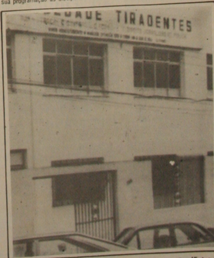
A Tiradentes promove vários cursos de Pós-Graduação.

A solenidade de entrega do título está para ser marcada, podendo ser em junho, quando a cidade de Tobias Barreto sempre festeja o nascimento do grande poeta e jurista sergipano.