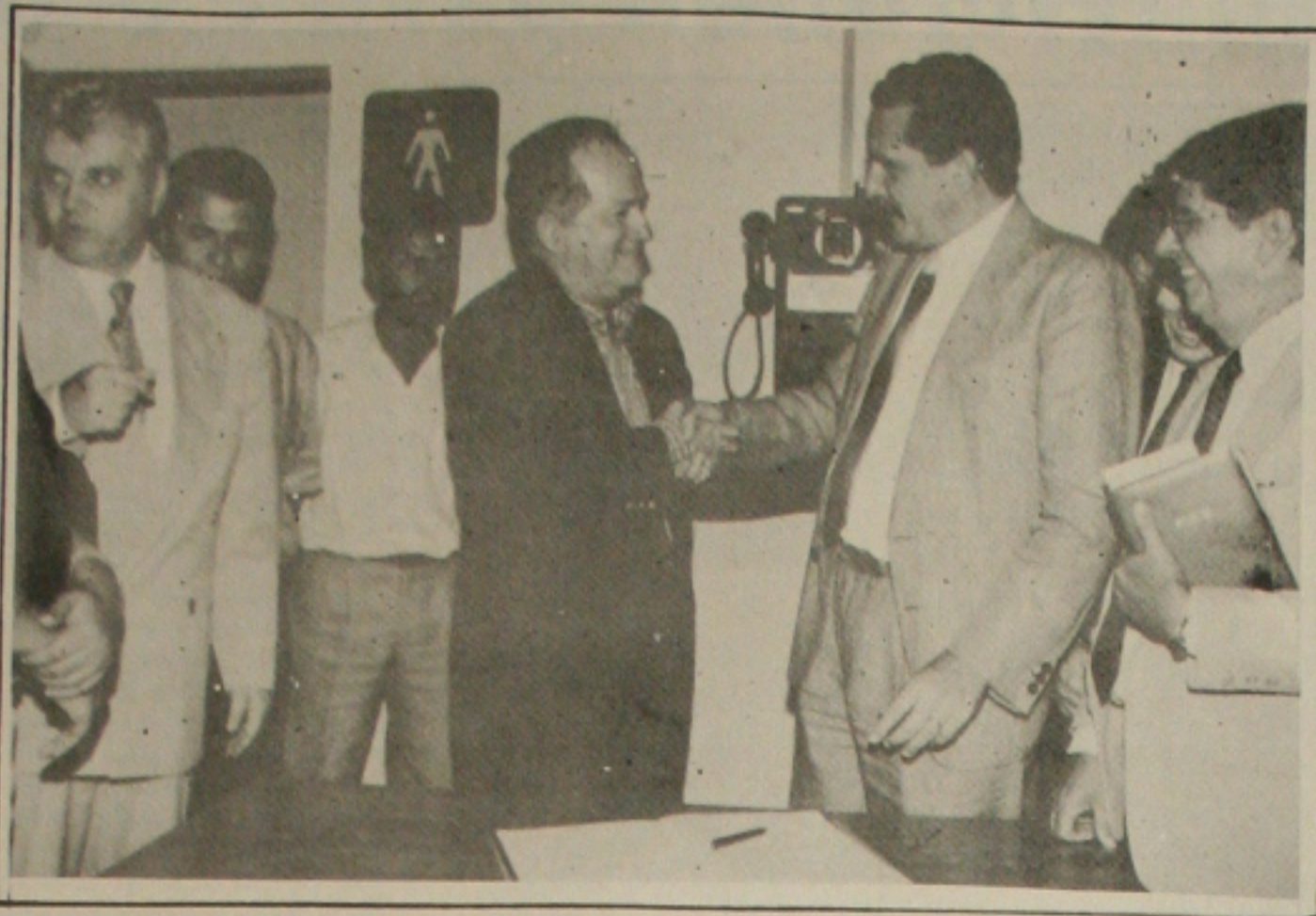
Albano reassume o governo e cumprimenta Machado

Futuramente, ele disse que esse programa vai ser extensivo a todo o Estado, pois é objetivo do governador Albano Franco combater a fome e a miséria que ainda existe em Sergipe. "Acreditamos que dentro de pouco tempo estaremos atendendo a mais de 50 mil famílias na Grande Aracaju", concluiu.