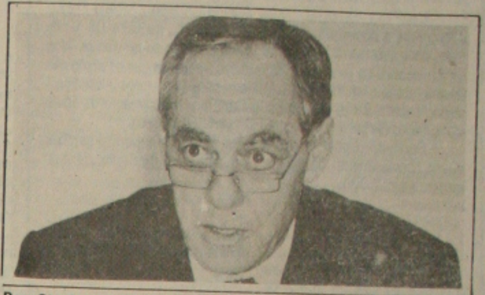
Para Stephanes, a reforma vai tornar mais igualitário o tratamento na inatividade.

As principais lideranças dos partidos que apóiam o governo pediram prazo de 48 horas ao presidente Fernando Henrique Cardoso para analisar o projeto de reforma da Previdência Social, apresentado ontem durante reunião do Conselho Político e que será encaminhado ainda esta semana ao Congresso. A maioria dos líderes manifestou apoio a proposta de se extinguir privilégios do setor público e reformar o sistema do INSS, mas ficaram muitas dúvidas por causa da ausência do Ministro da Previdência, Reinhold Stephanes, autor principal do projeto. Para o ministro, entretanto, o principal objetivo da reforma é tornar igualitário o tratamento dado ao trabalhador na inatividade. (Página 4B)