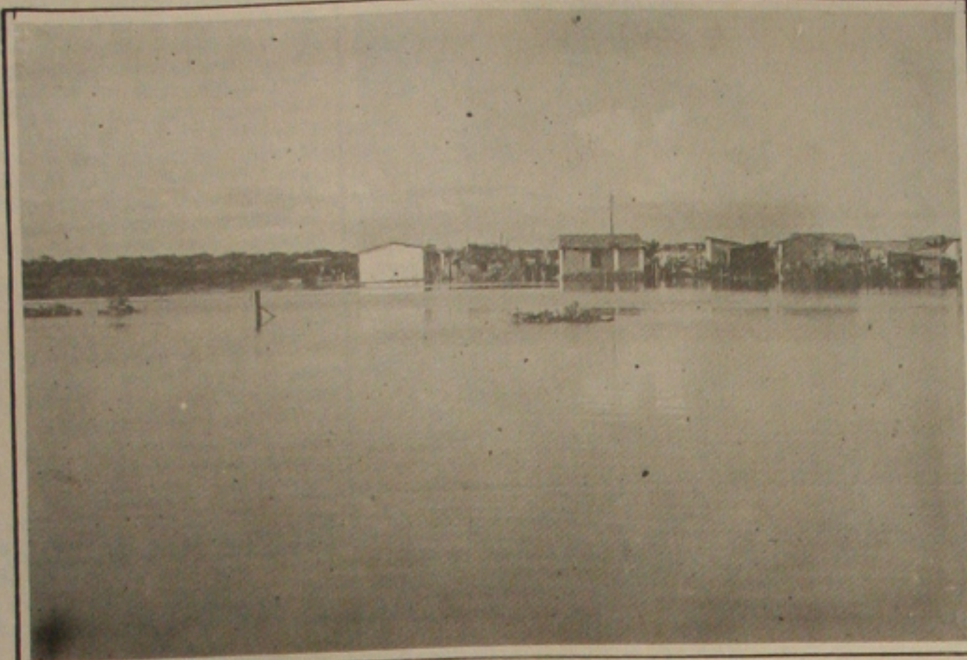
A Petrobrás assinou contrato com a UFS para fazer avaliação da qualidade da água do Rio Sergipe.

O "I Encontro de Professores de Inglês de Sergipe" conta com o apoio do Centro Editorial e Audiovisual (CEAV) da UFS e da Fundação Augusto Franco.