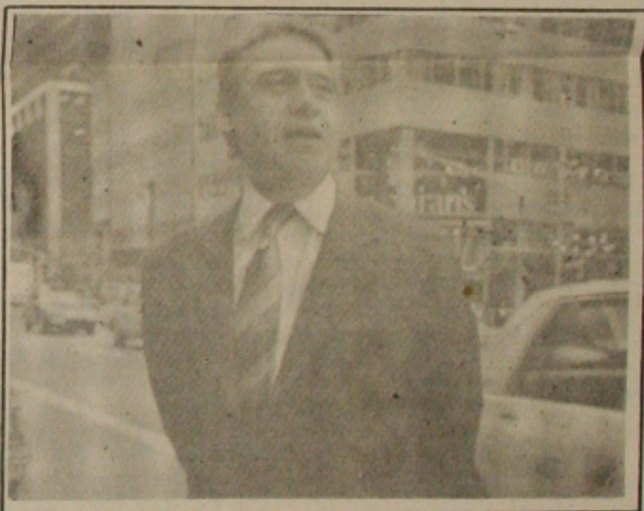
FHC: explicando emenda

- Retirar da Constituição a isenção no pagamento da contribuição para a Previdência Social para entidades beneficentes. "Isso não quer dizer que as isenções de hoje vão acabar, mas sim que o governo vai examinar caso a caso."