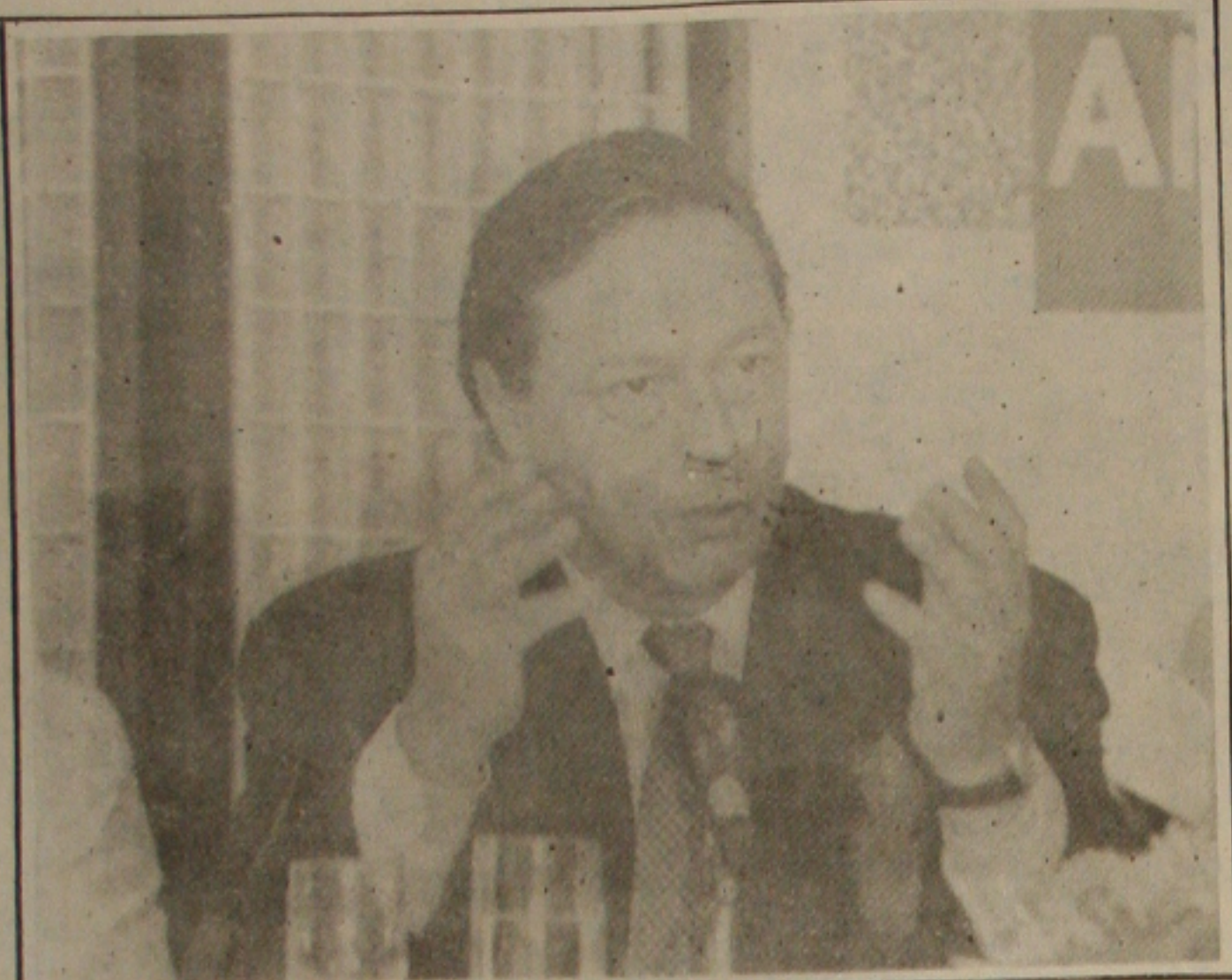
Malan explica medidas do governo e nega pacote econômico.

Estabilização de preços é a meta. Contas públicas devem ser ajustadas