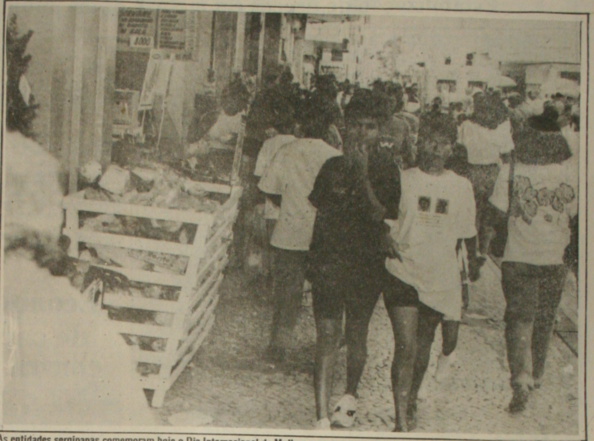
As entidades sergipanas comemoram hoje o Dia Internacional da Mulher, com programação iniciada há dois dias na capital.