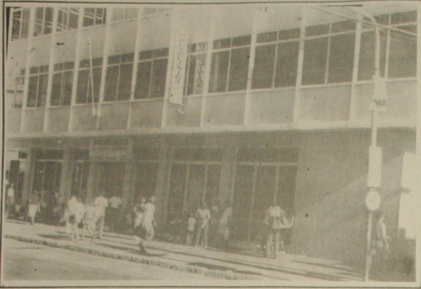
A Policlínica Otávio Penalva será fechada em três meses pela Secretaria de Estado da Saúde.