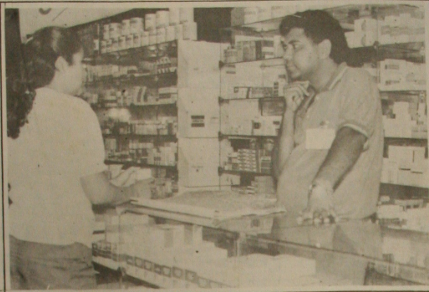
Os medicamentos inócuos já começam a ser retirados das prateleiras das farmácias.