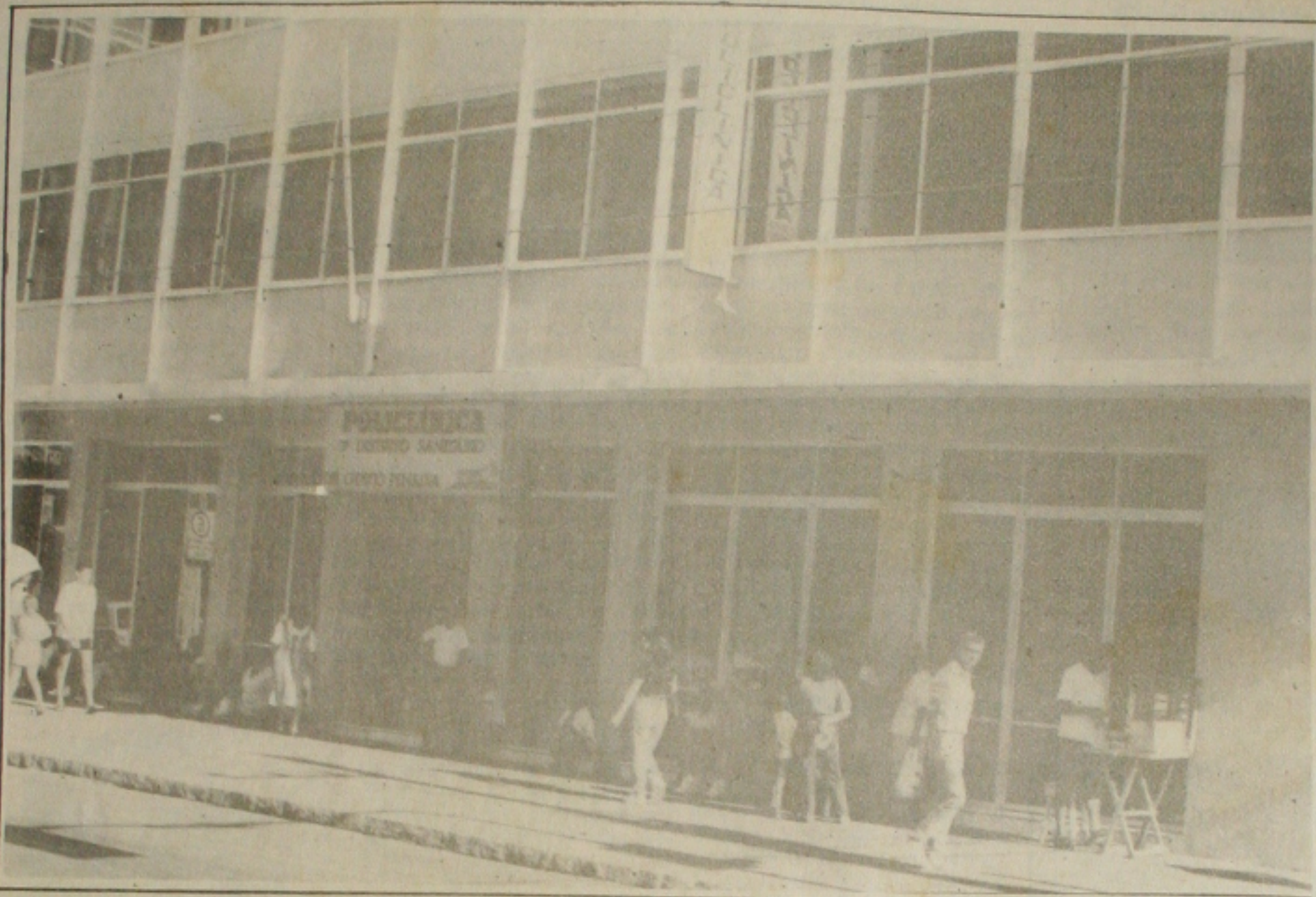
A Policlínica fornece 10 mil consultas por mês e deve ser desativada ainda este ano.