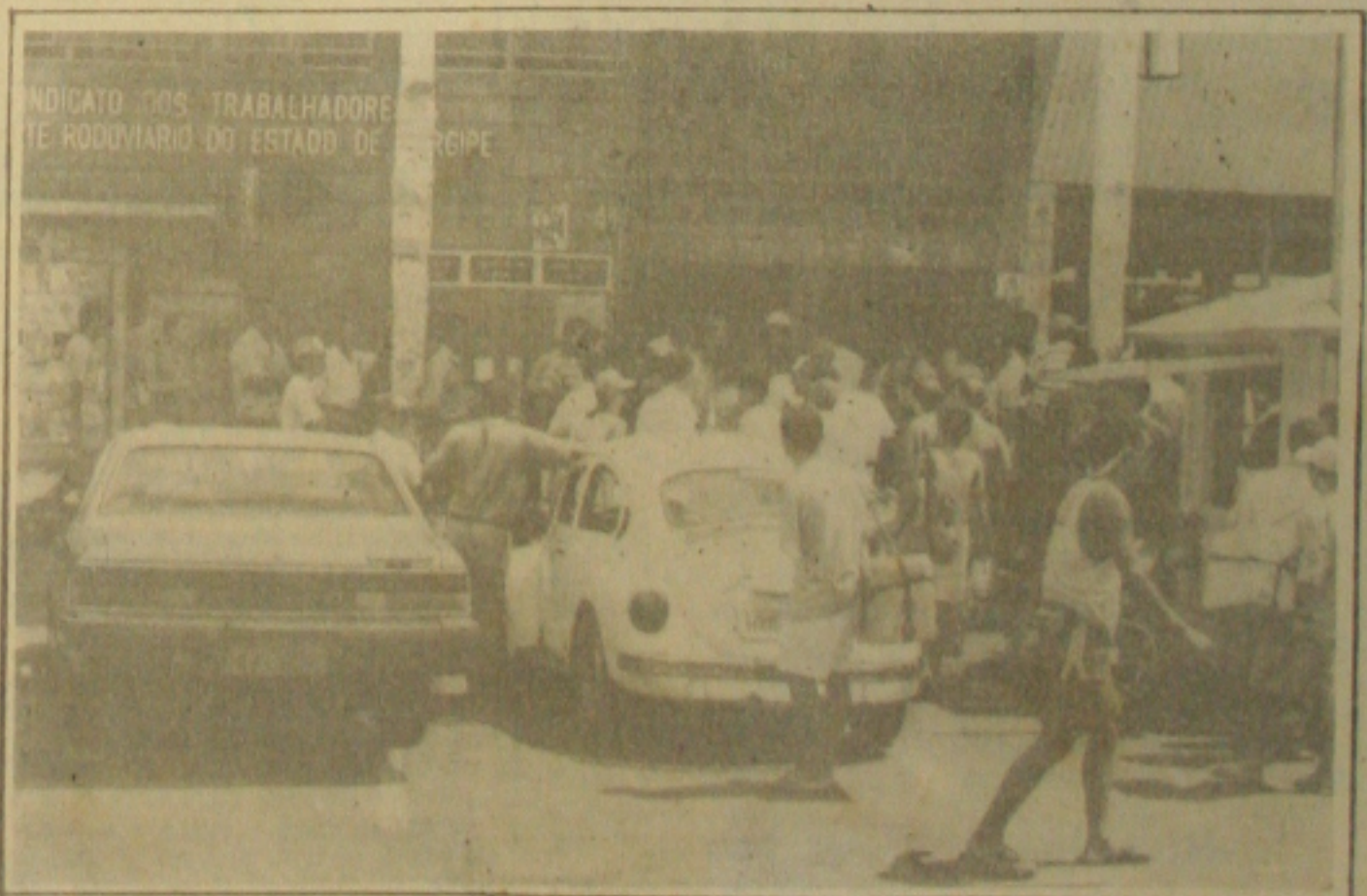
Os motoristas e cobradores saíram da assembleia dispostos a entrar em greve segunda-feira.