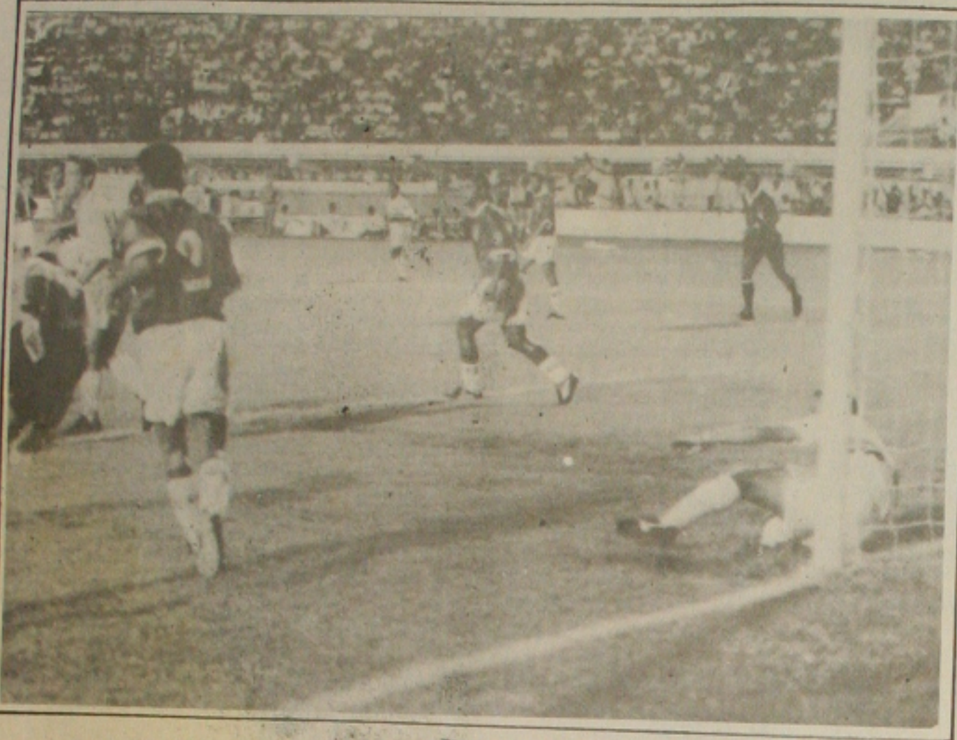
Time rubro lutou e jogou bem, mas não conseguiu a vitória