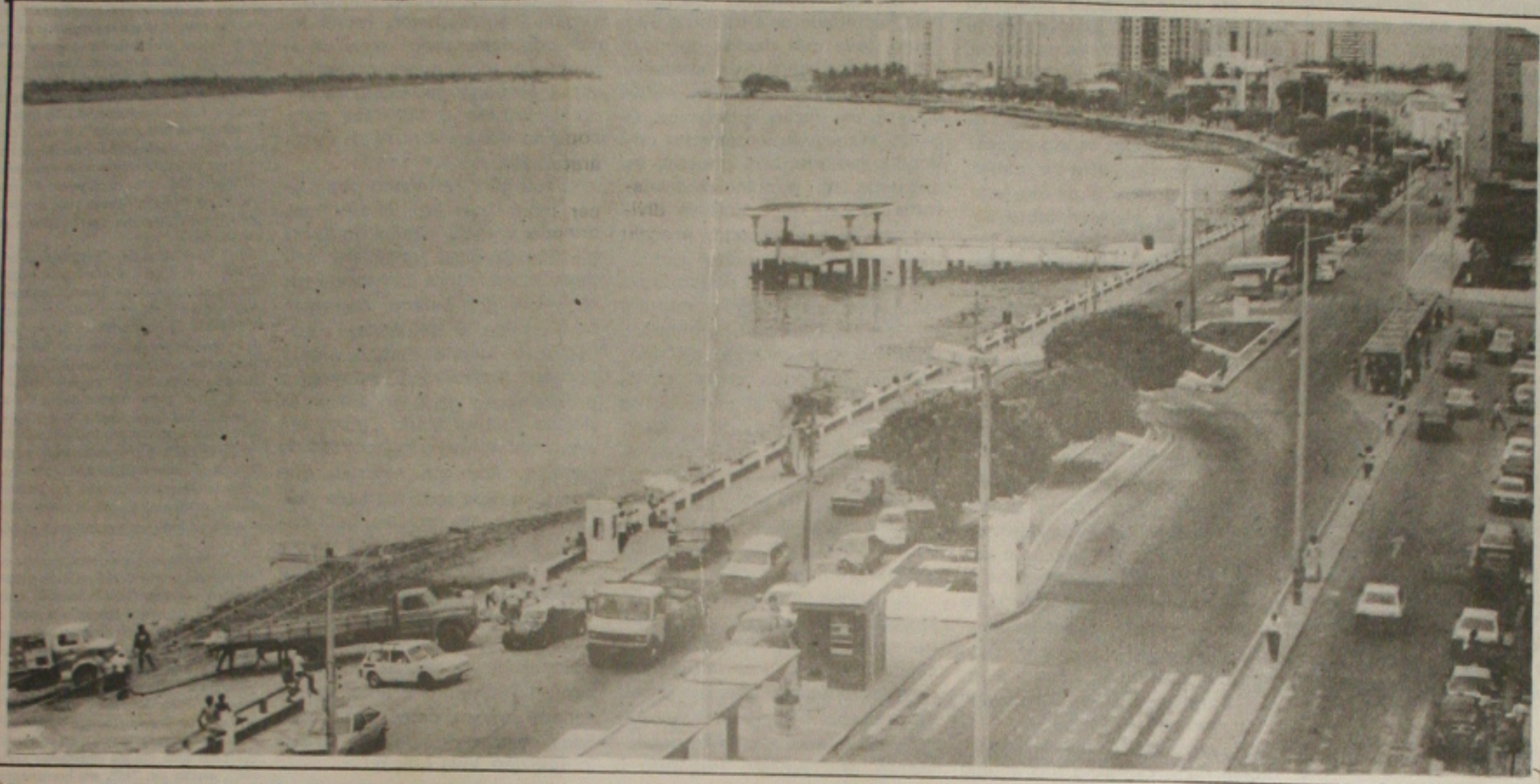
Em seus 140 anos de existência, Aracaju sofreu grandes transformações e hoje desponta como uma grande cidade

O Governo deu ontem o primeiro passo para promover uma das mais amplas reformas no sistema da Previdência Social do País, enviando a emenda constitucional que trata do assunto ao Congresso Nacional. Durante entrevista no Palácio do Planalto, o Ministro Reinhold Stephanes, destacou o princípio de justiça social da proposta. "Vamos dar o mesmo tratamento para todos os trabalhadores, independentemente da sua condição de emprego ser no setor público ou na iniciativa privada". O pacote de mudanças na Previdência Social do governo inclui um projeto de lei complementar regulamentando a cobrança do pro-labore e um projeto de lei ordinária que trata do aumento do salário mínimo para R$ 100,00, em maio, ambos já no Congresso, e a emenda constitucional enviada ontem. Apesar do Ministro Reinhold Stephanes garantir que a reforma estabelece o princípio de justiça social, a proposta de emenda constitucional concede privilégios nas aposentadorias dos militares. Eles terão, na forma de lei complementar, um regime previdenciário próprio, que deverá definir limites de idades e regras de cálculo do valor do benefício, diferentes dos demais servidores. (Página 4B)