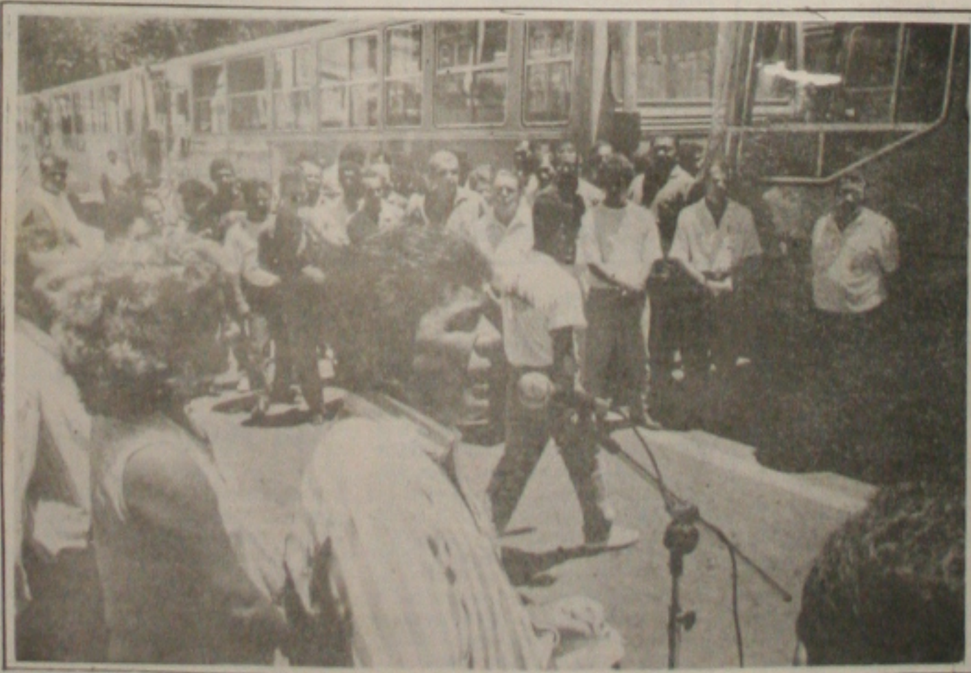
O prefeito fez ontem a entrega oficial dos novos ônibus anunciou a criação das linhas especiais

Provisória nº 932. O projeto de conversão pode ser votado pelo Congresso na próxima semana. De acordo com o seu relator, deputado Paes Landim (PFL-PI), ele tem grandes chances de ser aprovado. "Não haverá problemas no plenário", prevê Landim. "A opção deverá ser pelo menor, uma vez que o texto do governo é pior do que o meu", afirmou.