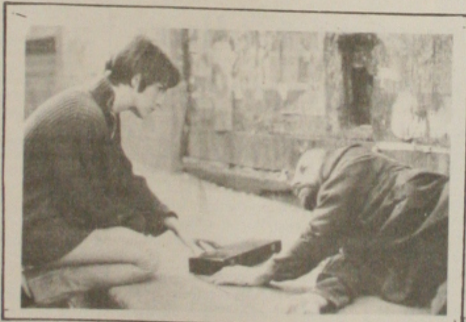
Cena do Filme "A Liberdade é Azul", em cartaz hoje e amanhã no Cine Riomar.