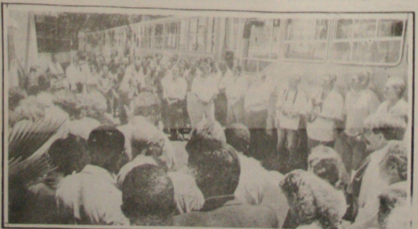
A PMA entrega novos ônibus que vão incorporar a frota urbana de Aracaju.

Diante do que já está feito, a expectativa é que o poder público municipal lhe dê suficiente respaldo para que possa ampliar esse trabalho e torná-lo mais visível. (Por Beatriz Góis Dantas - Antropóloga e pesquisadora).