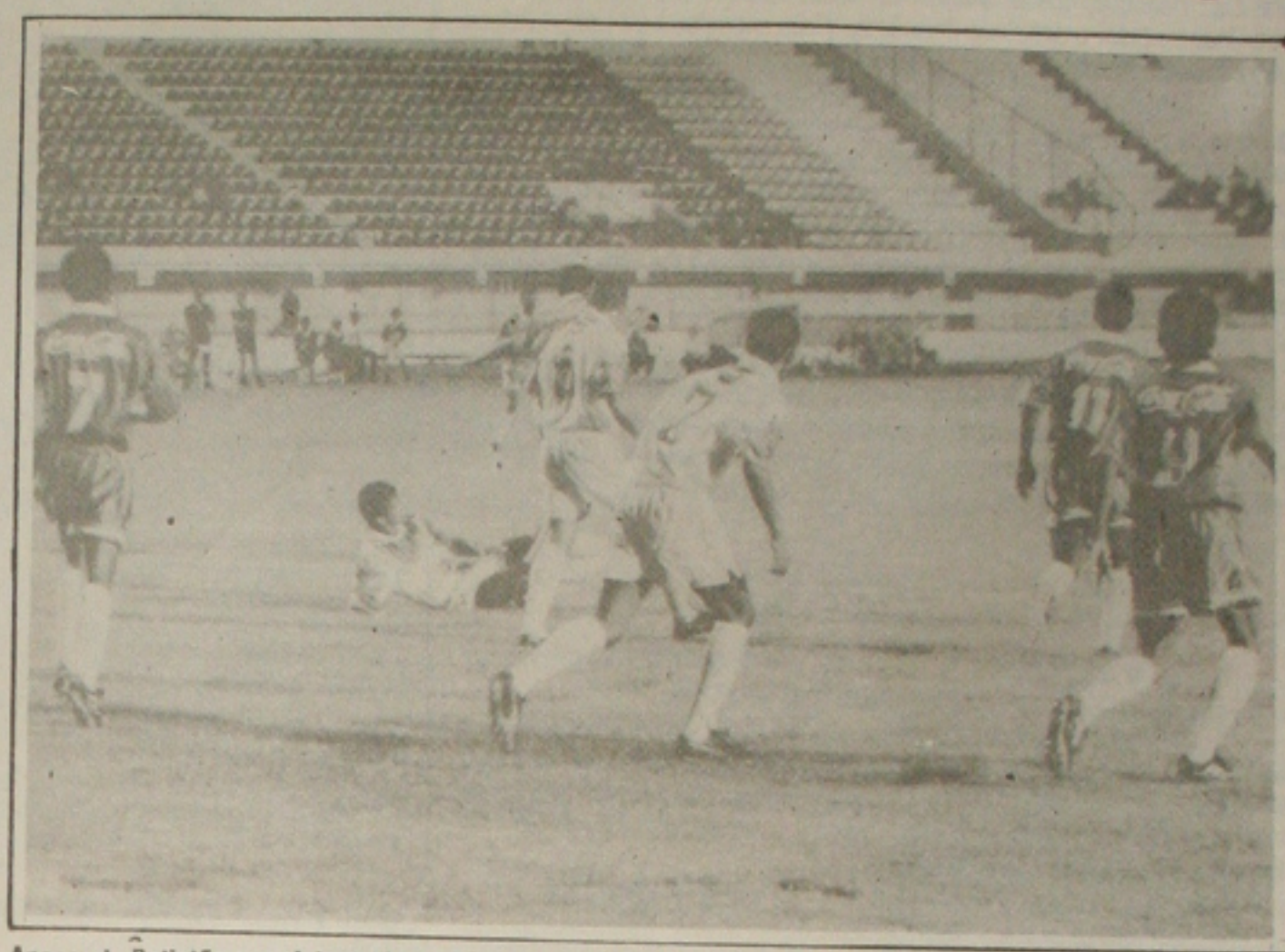
Apesar do Batistão completamente vazio, o jogo foi bastante movimentado