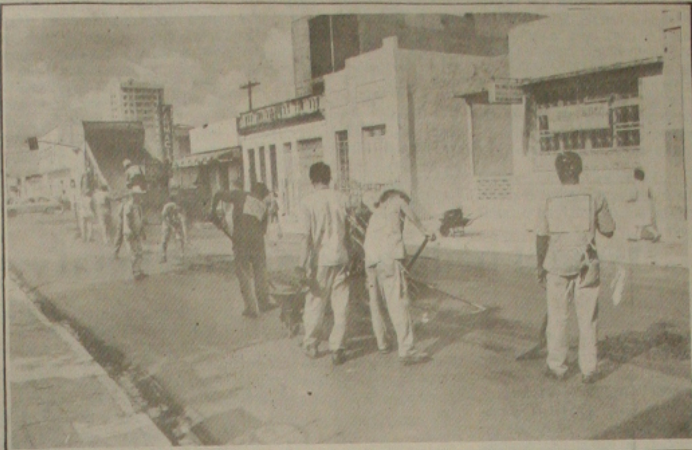
A PMA conclui o recapeamento de mais uma rua no centro comercial de Aracaju