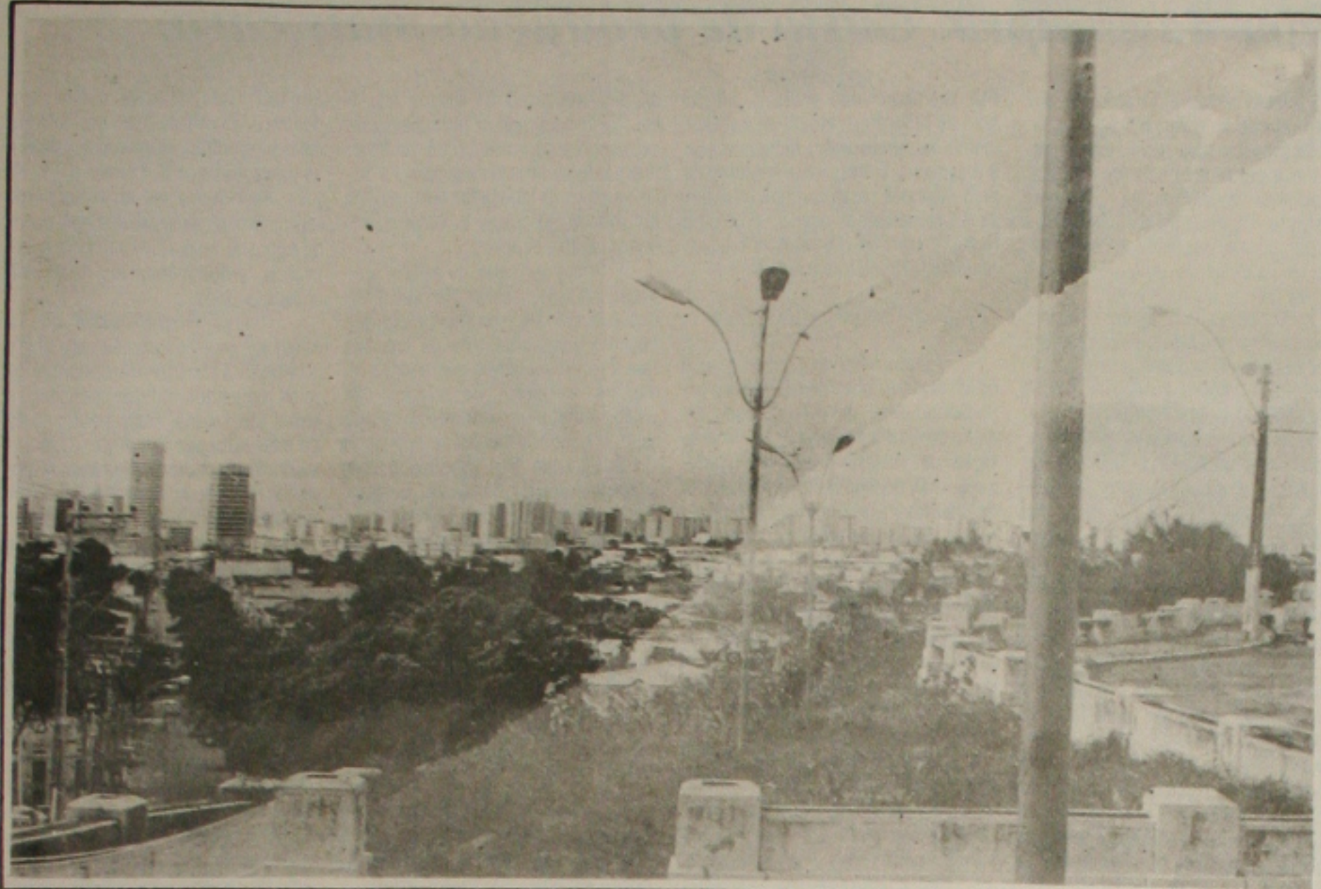
A Prefeitura de Aracaju prepara hoje uma grande festa com a participação da cantora Olivia Byington para comemorar os 140 anos de mudança da capital.