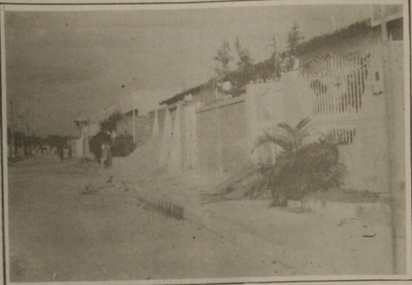
O duplo assassinato revoltou os moradores do Conjunto João Alves, em Nossa Senhora do Socorro.