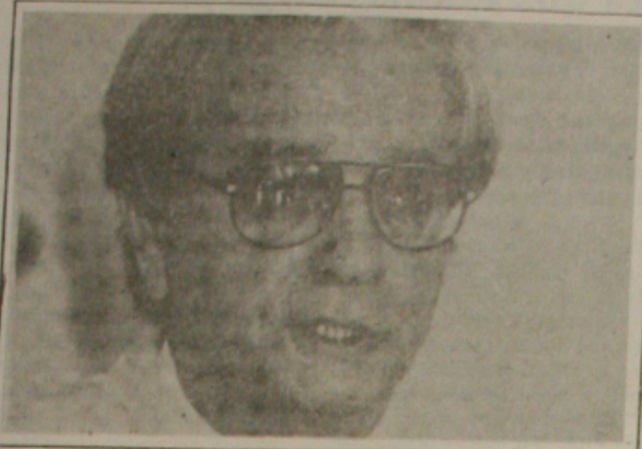
Itamar deve ter sua indicação aprovada hoje no Senado.

O ex-presidente Itamar Franco será sabatinado hoje, às 10 horas, na Comissão de Relações Exteriores do Senado. O "teste" é obrigatório para os que, como ele, foram designados para a chefia de representações diplomáticas fora do Brasil. Itamar foi indicado para a embaixada brasileira em Lisboa pelo presidente Fernando Henrique Cardoso. E vai falar na comissão sobre as relações entre Brasil e Portugal. Depois da sabatina, voltará a Juiz de Fora para finalizar os preparativos da viagem.