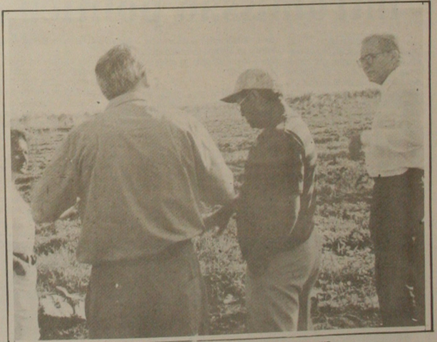
A agricultura itabaianense ganhará mais impulso com a liberação de recursos do FNE.