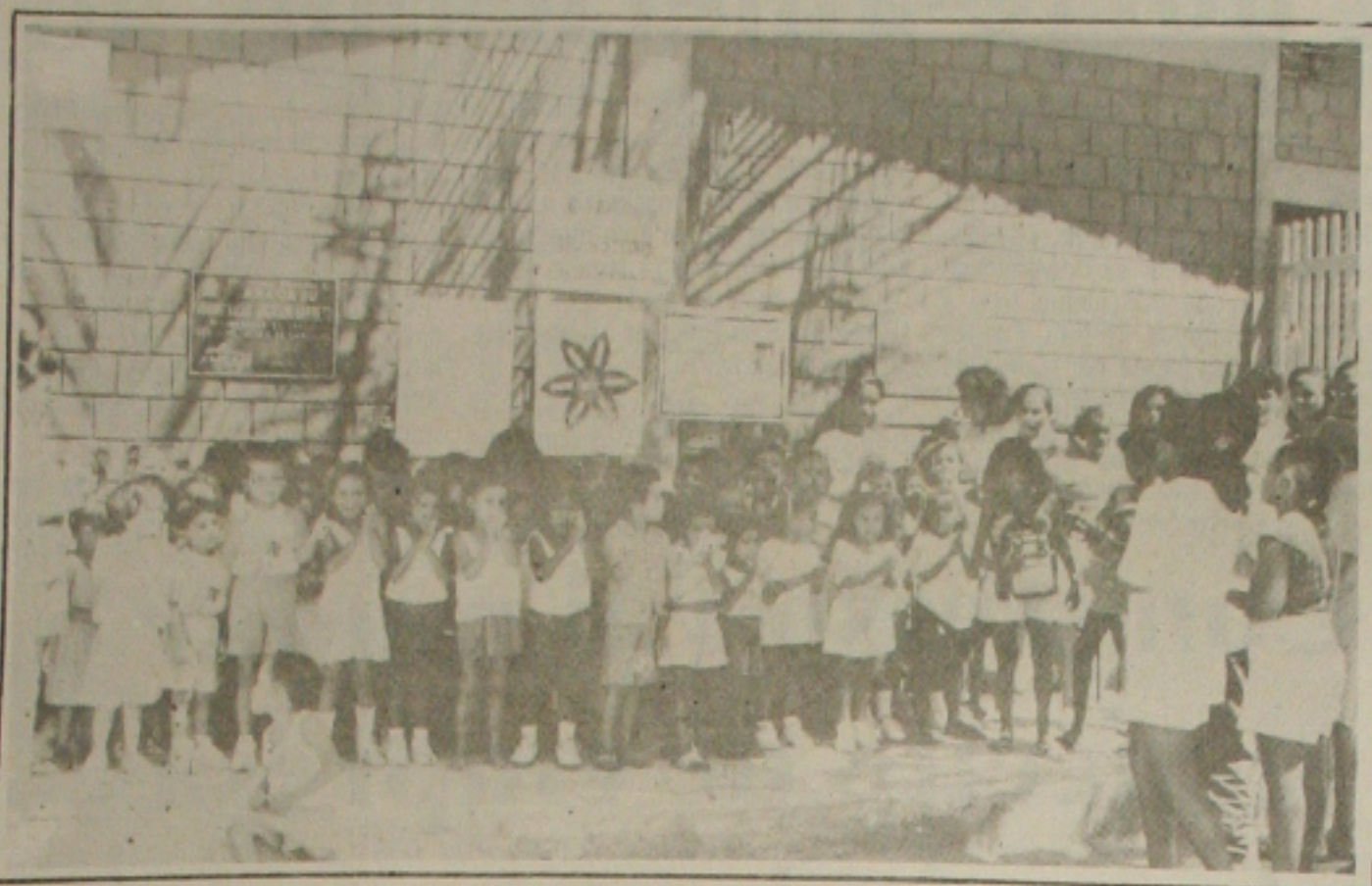
A Prefeita de Aracaju desenvolve programa social para atender as comunidades carentes.