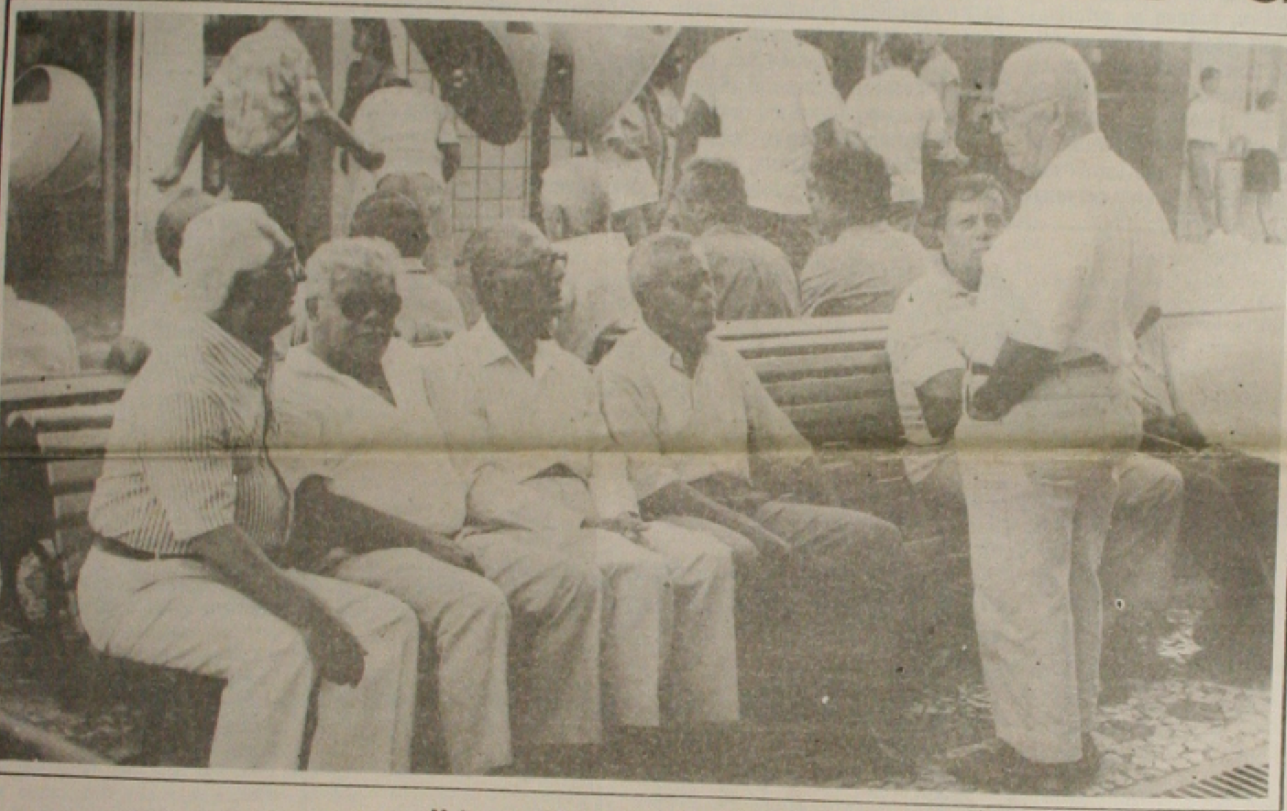
Muitos aposentados também estão apreensivos com as mudanças propostas pelo Governo.