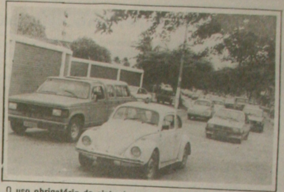
O uso obrigatório do cinto de segurança em cidade de pequeno e médio portes, como Aracaju, é visto como desnecessário.

A decisão do Governo Federal de enviar ao Congresso projeto de lei tornando obrigatório o uso do cinto de segurança dentro do perímetro urbano das cidades está dividindo a opinião dos sergipanos. Enquanto uns concordam com a medida e acreditam que ela irá contribuir para reduzir os índices de mortalidade no trânsito outros não vêem como necessária a obrigatoriedade do cinto de segurança, por considerá-lo ineficiente nas cidades de pequeno porte. (Página 5A)