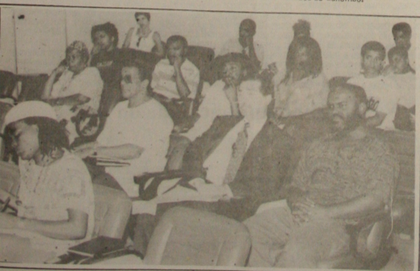
O Fórum de Entidades Negras de Sergipe discutiu os movimentos populares.