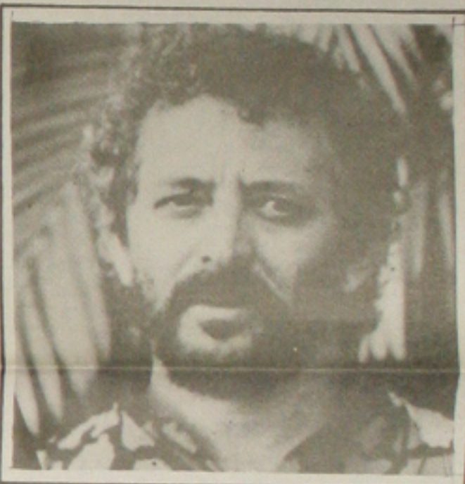
Geraldo Azevedo canta amanhã na AABB-Aracaju.

Com a exibição de A Igualdade é Branca , pelo Cinema de Arte do Shopping Riomar, neste final de semana (sessões às 21 horas e às 11 horas de amanhã), o espectador aracajuano vai afinal conhecer Julie Delpy , uma francesa muito bonita que já foi conquistada pelo cinema americano. Ela é atriz principal de "Parceiros do Crime", um filme produzido por Quentin Tarantino , onde ela atua ao lado de Eric Stoltz e agora faz o maior sucesso na América, com "Before Sunrise", onde, além da beleza, mostra talento exemplar. Em A Igualdade é Branca , Julie Delpy é Dominique , a esposa do polonês Karol , que vive em Paris e pouco sabe da língua francesa. Ela pede o divórcio, acusando-o de impotente. Karol volta à Polônia e, por circunstância do destino, enriquece. Atrai a ex-mulher para uma vingança insólita.