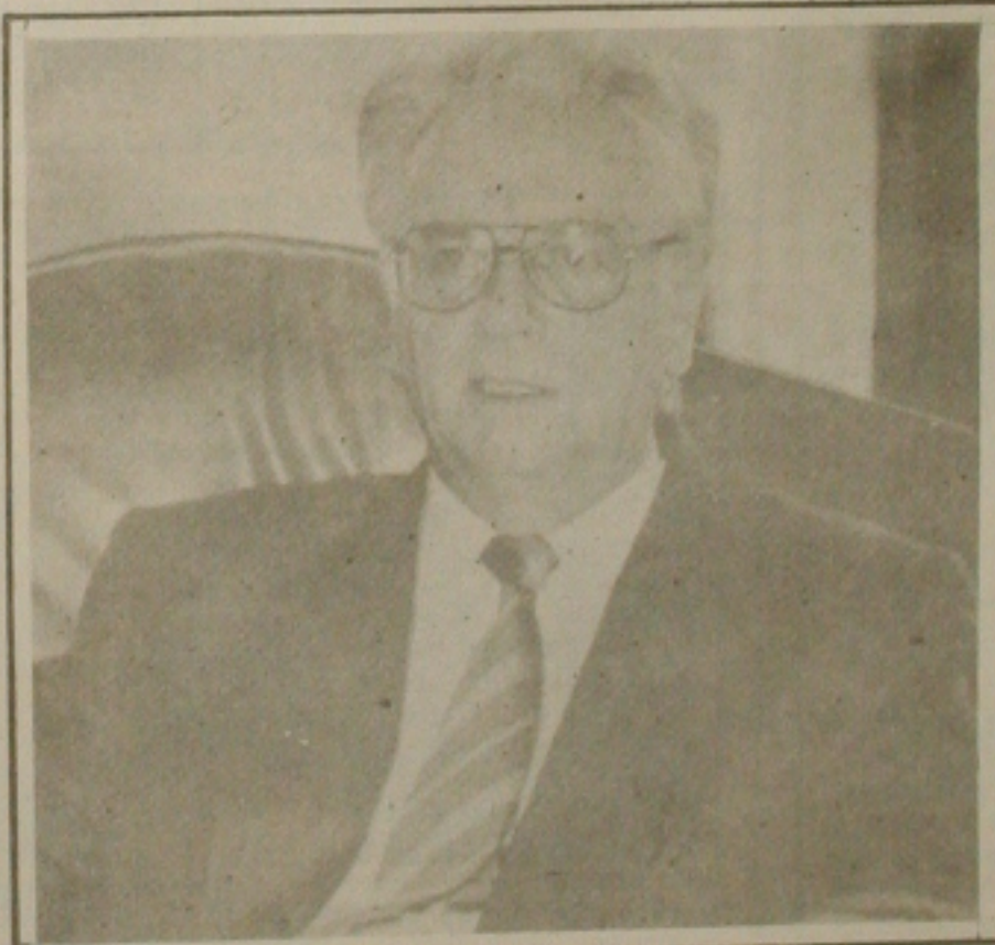
Itamar: novo embaixador

Amanhã o presidente se desloca até São João do Jaguaribe, no interior, para lançar o programa de reforma agrária. Segundo o ministro da Agricultura, José Eduardo de Azevedo, até a mala já estará cumprida a meta anual do governo de assentar 40 mil famílias no campo.