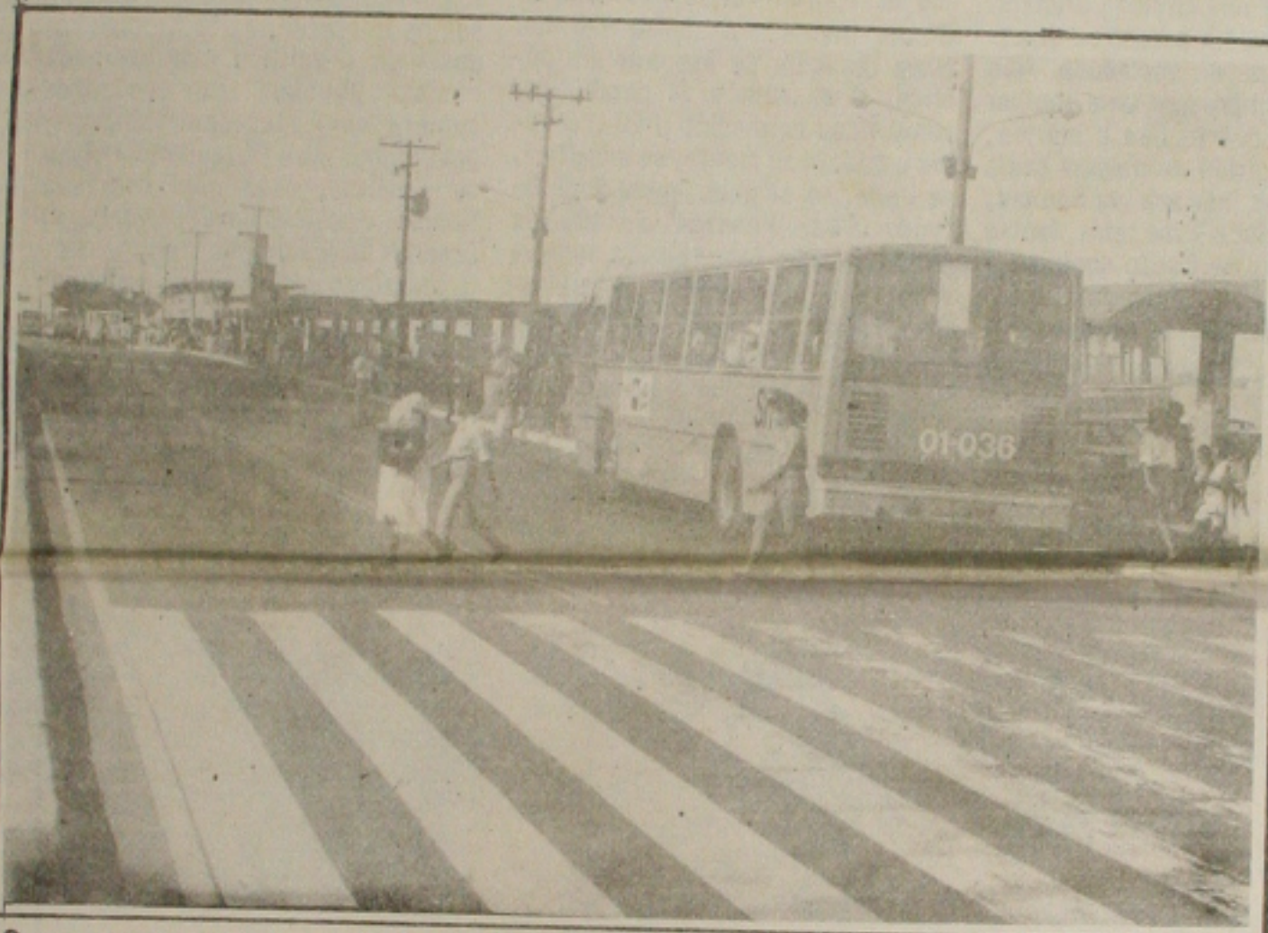
O corredor da Rio Branco ganhará três novas faixas de pedestres, sinalizadas com semáforos.

Dentro dos próximos 15 dias, Prefeitura de Aracaju deve iniciar as obras de implantação de grades de proteção e novas faixas de pedestres, sinalizadas com semáforos, no corredor da avenida Rio Branco, por onde trafegam os ônibus do sistema de transporte da cidade. A obra será financiada com os recursos provenientes da publicidade de empresas que serão veiculada nos painéis das grades de proteção. As empresas que farão uso deste espaço para publicidade serão selecionadas e qualificadas pela Comissão de Diretores Lojistas (CDL), e assina convênio de cooperação assinada hoje com a PMA, durante sessão realizada pela manhã no Palácio Ignácio Barbosa. (Página 4A)