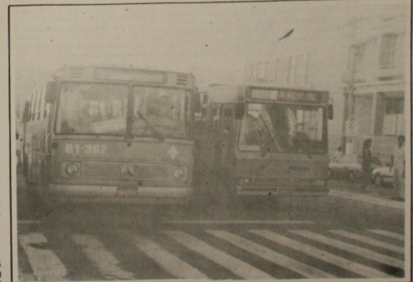
O corredor da Avenida Rio Branco (centro) terá novas faixas de pedestres e grades de proteção.

Com a implantação das grades de proteção e das faixas de pedestres, sinalizadas com semáforos, a PMA quer garantir à população maior segurança ao transitar na Avenida Rio Branco, especialmente no corredor por onde trafegam os ônibus do sistema de transportes. O diretor da Emurb explicou ainda que serão implantadas três passagens para pedestres ao longo do corredor: uma em frente ao Armário Huteba, outra nas proximidades do Edifício Oviêdo Teixeira e a terceira na esquina da Praça Fausto Cardoso com a Rua da Frente.