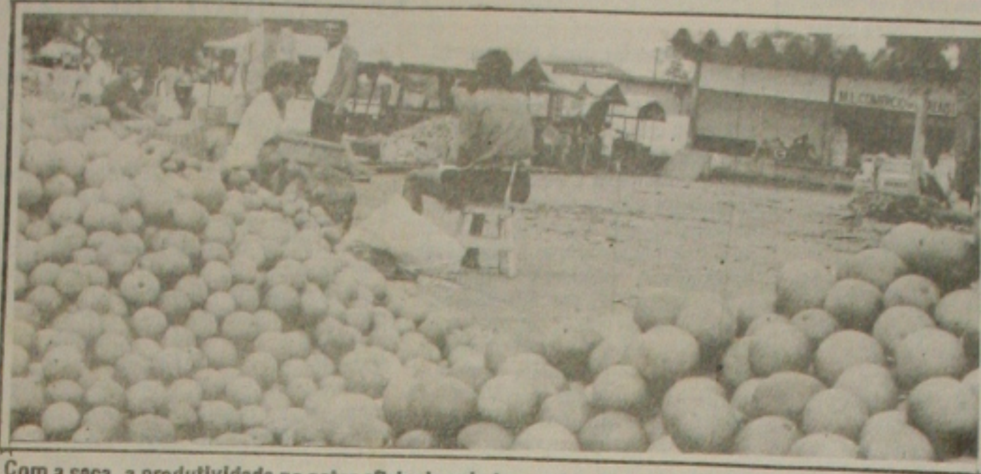
Com a seca, a produtividade no setor citricola caiu tornando a laranja um produto caro e escasso.