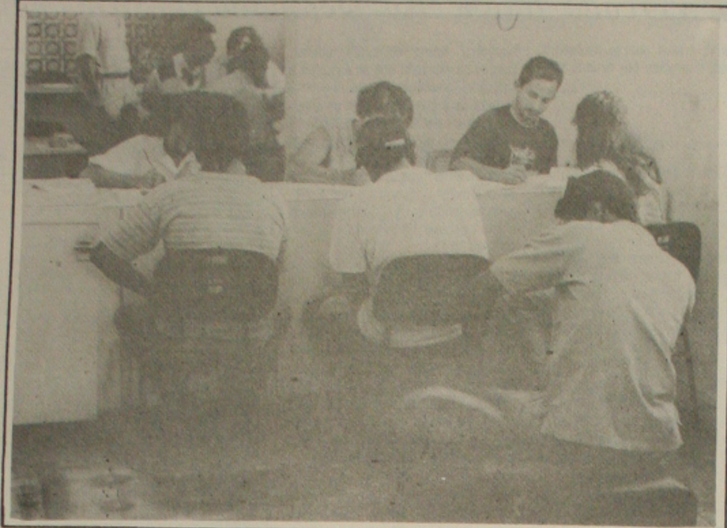
O Sine registrou nos últimos dois meses aumento na oferta de emprego em Aracaju.