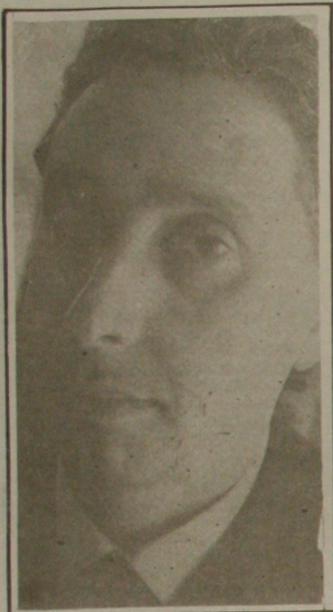
Arida: denúncia leviana

Presidente do BC no Congresso se defende atacando Eduardo Dutra pela denúncia