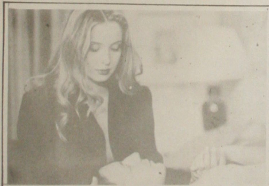
A atriz Julie Delpy em cena do filme "A Igualdade é Branca", em cartaz hoje, às 21 horas, e amanhã, às 9 horas, no Cine Riomar.