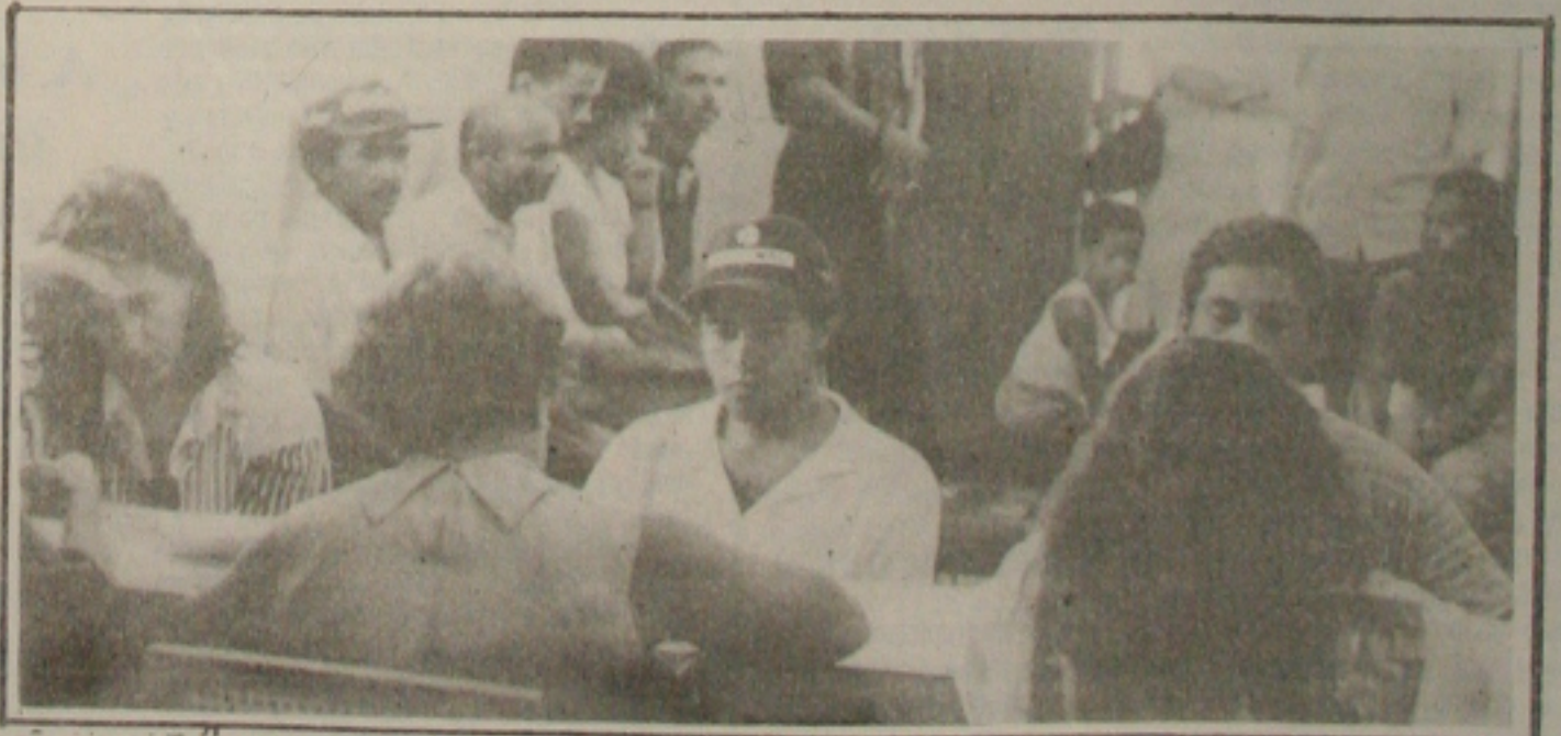
O número de pessoas que procuram o Sine mensalmente continua ainda elevado.

A oferta de emprego em Sergipe voltou a crescer nos dois primeiros meses do ano, principalmente em fevereiro, segundo pesquisa do Sistema Nacional de Emprego (Sine). De acordo com o órgão, em janeiro, as empresas abriram mais 69 vagas no mercado de trabalho, número que subiu para 72 no mês seguinte. Indústria, comércio, construção civil e serviços gerais foram os setores que mais absorveram mão-de-obra. No primeiro mês do ano, o Sine cadastrou 512 pessoas, enquanto em fevereiro o número de candidatos a uma ocupação profissional que procuraram o órgão caiu para 415. (Página 5A)