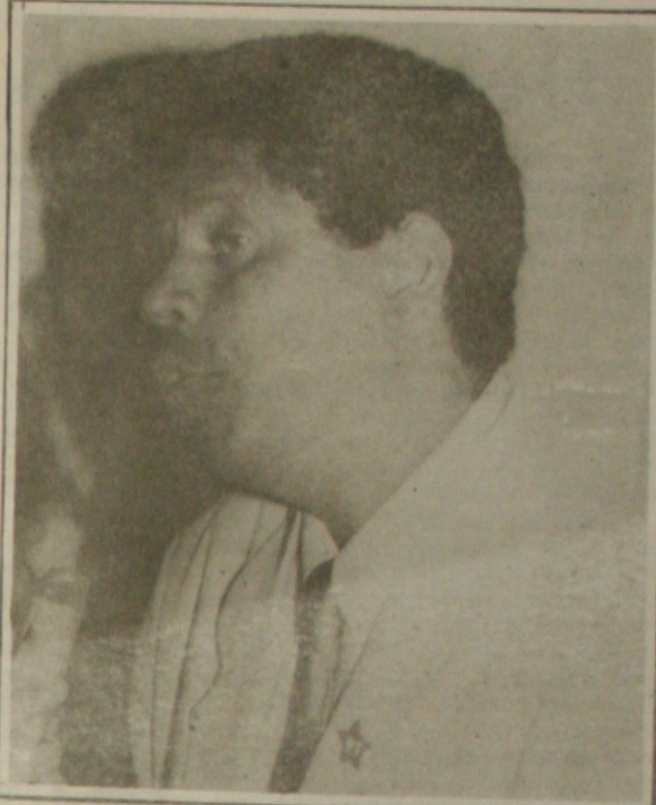
Ismael sugere mais chances para quem perder até duas disciplinas

A ausência, até o momento, de discussões por parte do Governo Estadual, na tentativa de viabilizar as frentes de serviço para atender aos trabalhadores rurais vitimados pela seca, preocupam o deputado Renato Brandão, que a cada dia vê complicar ainda mais a situação dos agricultores. Declarando-se publicamente favorável a criação imediata das frentes de serviço como única saída a curto prazo capaz de minimizar o sofrimento de milhares de famílias que dependem exclusivamente do cultivo e consequentemente das chuvas que não caem, Renato cobra um maior empenho e agilidade do Governo Estadual em intermediar junto ao Governo Federal a criação imediata das frentes de serviço para Sergipe. Para o parlamentar peísta, a situação tende a se tornar cada vez mais crítica e diz não entender o que o Governo tanto aguarda para profetar tanto a viabilização das frentes, principalmente tendo conhecimento que vários municípios se declararam em regime de calamidade pública decorrentes da grande estiagem. "Diariamente vemos chegar a capital, famílias inteiras provenientes do campo, que fugindo a seca, tentam sobreviver aqui, mendigando nas ruas, submetendo suas crianças a situações de risco, algumas chegando inclusive a cometer delitos em busca da sobrevivência", finaliza Renato.