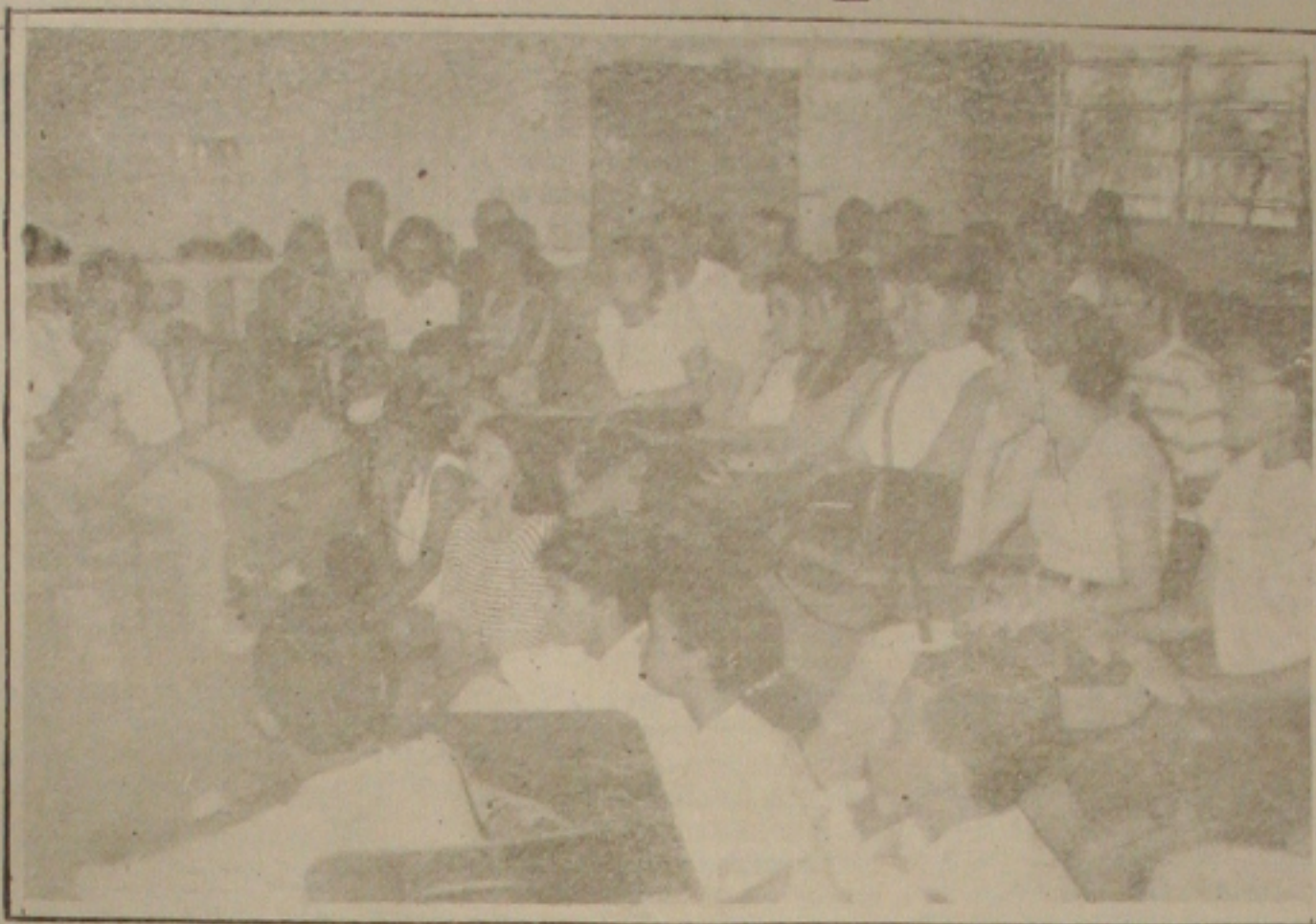
Os estudantes de medicina da UFS estão preocupados com a saúde dos sergipanos.

A Polícia está fazendo levantamento no Povoado Terra Dura para descobrir se os pistoleiros são daquela localidade ou se nos últimos dias surgiram comentários na região de que empresário estaria sendo perseguido por estranhos. Para Jorge Ribeiro, nenhuma hipótese não pode ser abandonada porque nela pode estar a chave do mistério.