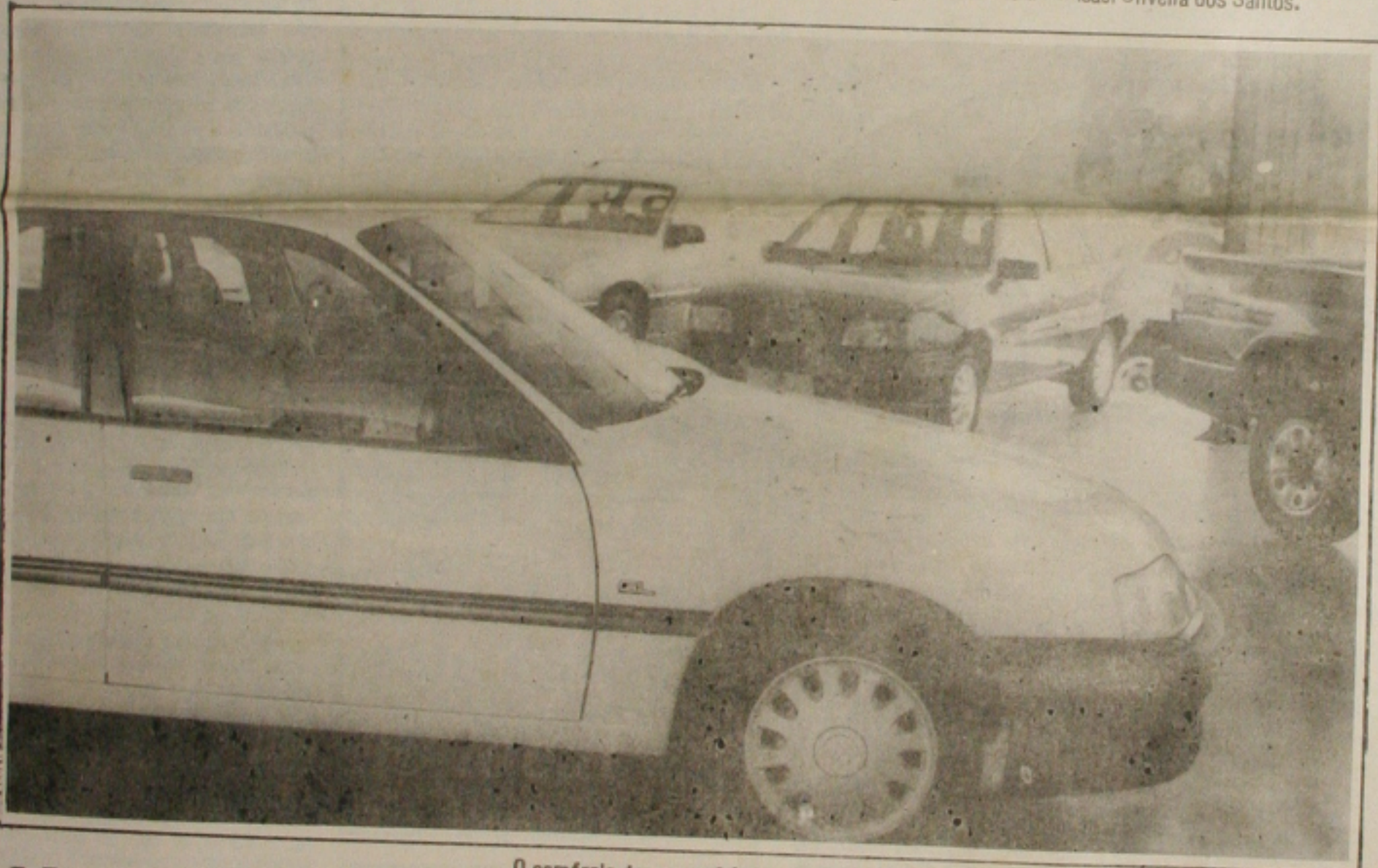
O comércio de carros foi um dos que mais sofreu com as medidas anti-consumo do Governo