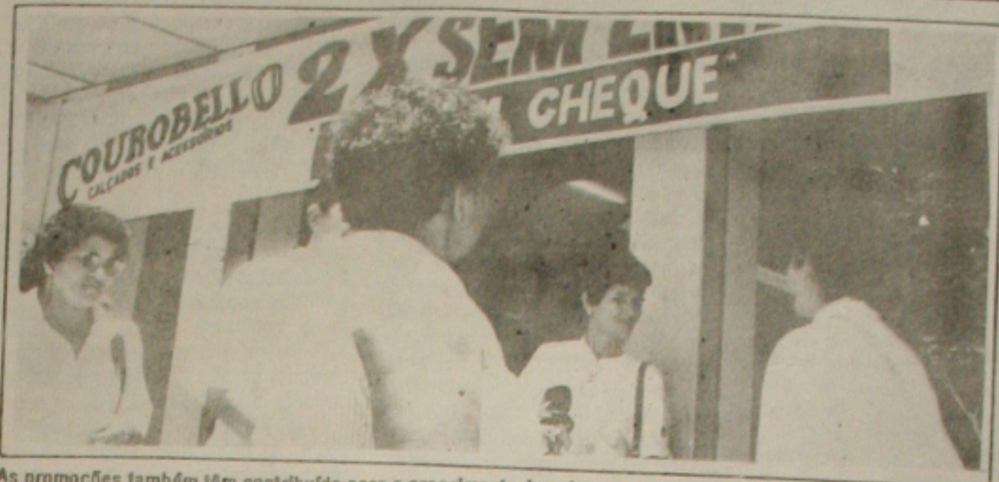
As promoções também têm contribuído para o crescimento dos cheques sem fundos