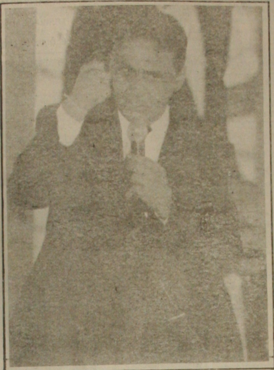
FHC: negociando apoio