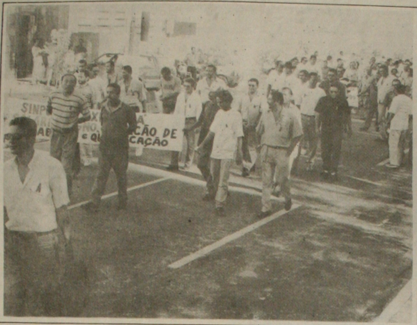
Com fitas pretas nas camisas, os policiais percorreram várias ruas protestando contra os baixos salários

Na primeira manifestação pública de servidores públicos desde a posse do novo Governo do Estado, policiais civis saíram ontem à tarde em passeata num protesto contra os baixos salários que recebem. Portando faixas e usando fitas pretas nas camisas, os manifestantes, que realizaram um ato público na Praça Fausto Cardoso, denunciaram à população que, enquanto o salário médio mensal de um policial chega a R$ 250,00, um delegado recebe até R$ 7 mil, graças a uma gratificação de 586% sobre o vencimento base concedida pelo governador Albano Franco. Os policiais alegam que a categoria vive hoje numa situação de extrema penúria, com alguns morando até em favelas, em função do salário que recebem para arriscar a vida diariamente no exercício da profissão. Por isso, reivindicam uma equiparação aos vencimentos dos delegados. (Página 6A)