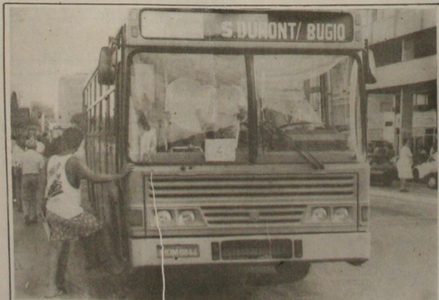
A atual tarifa de R$ 0,40 é considerada defasada pelas empresas de ônibus