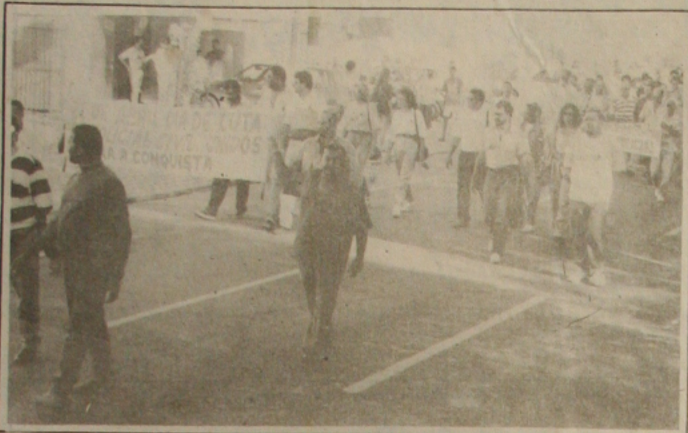
Os policiais civis fizeram passeata para denunciar o estado de miséria em que vivem.

Policiais civis foram ontem às ruas denunciar à população o estado de miséria em que vivem por conta dos baixos salários que recebem. Eles saíram em passeata da Praça Tobias Barreto, às 15h30, com destino à Praça Fausto Cardoso, onde fizeram um ato público de forma ordeira e pacífica.