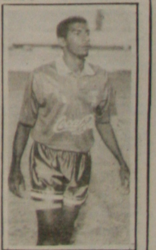
Betume cumpriu a suspensão e retornou ao time do Cotiguiuba.

Edmundo foi suspenso por 40 dias e mais cinco jogos por ter sido o pivô dos incidentes ocorridos na partida Palmeiras x São Paulo, dia 30 de outubro, no Morumbi, pelo Campeonato Brasileiro.