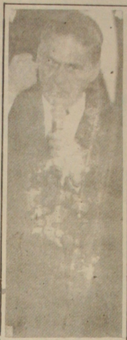
O presidente FHC

Recorrendo ao mesmo episódio, Fernando Henrique lembrou que, na época, foi professor em