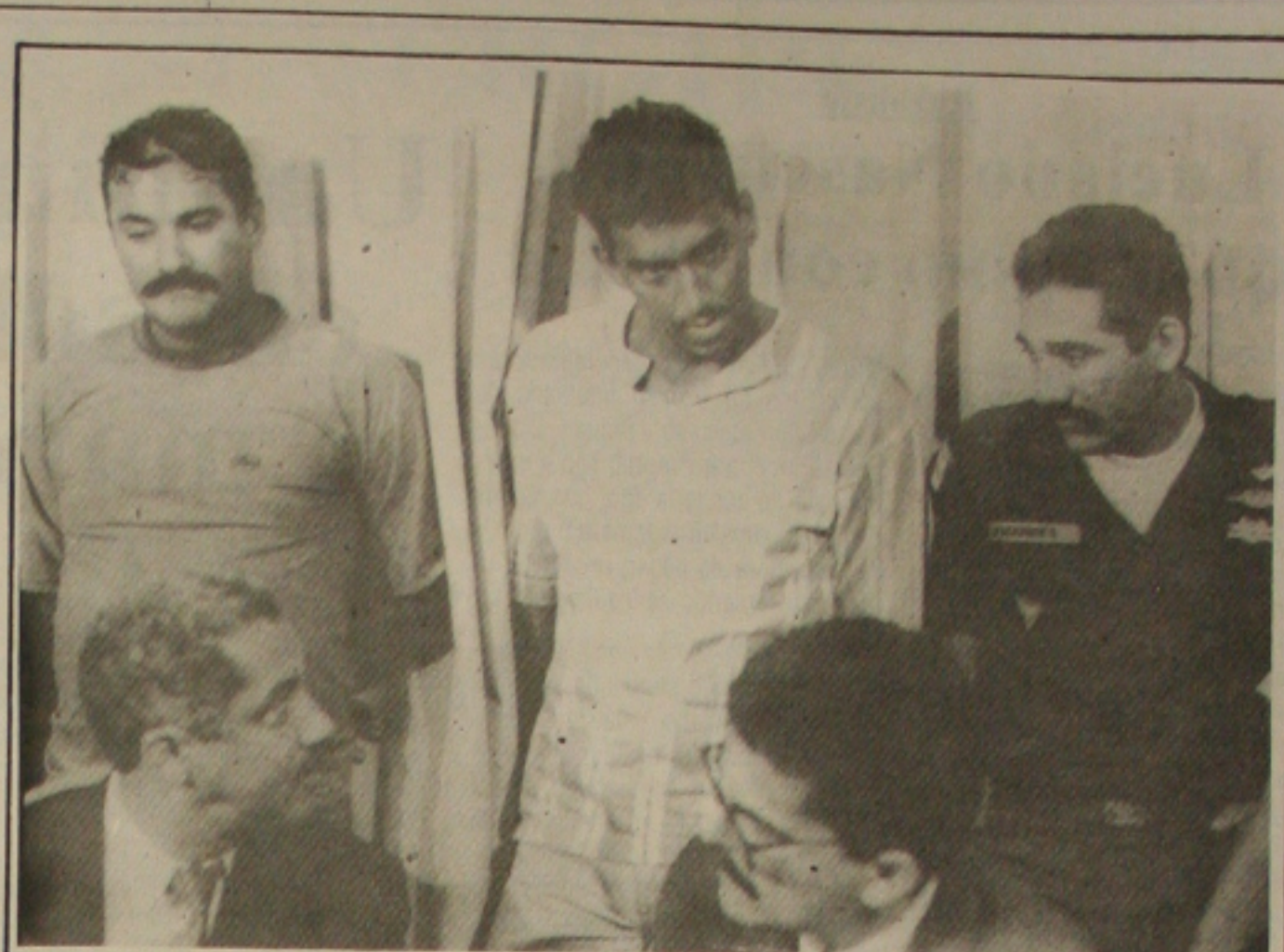
... a quadrilha formada por militares responsável por assaltos a bancos em Aracaju...