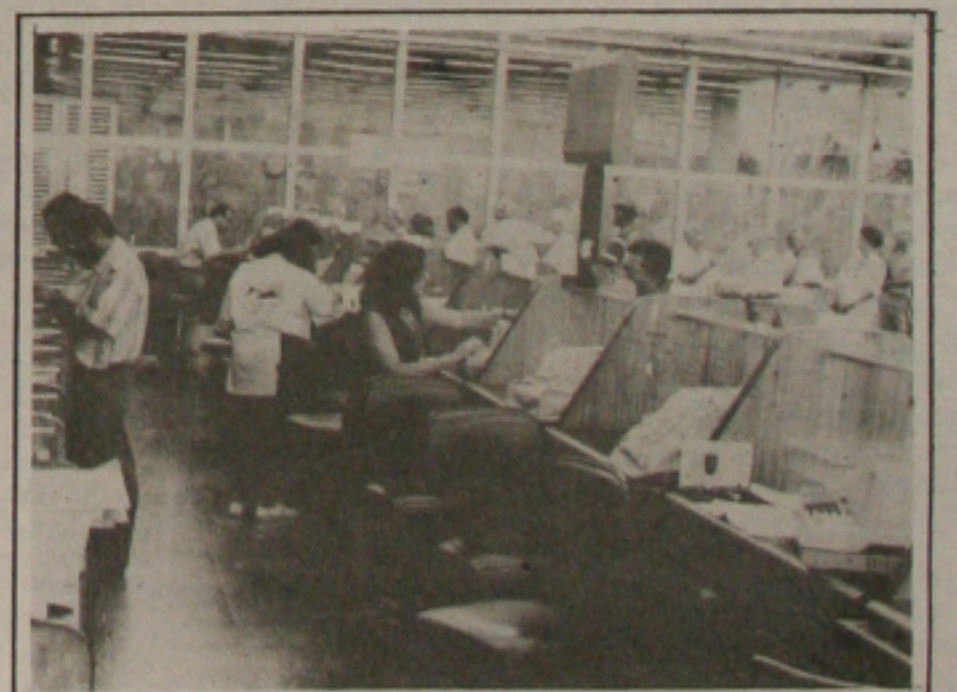
Os bancos viveram um dia agitado, mas não houve esquema especial

dinâmicos do hemisfério". Em entrevista à imprensa, o presidente norte-americano prometeu também se engajar na discussão sobre mudanças nas instituições financeiras internacionais, como Fundo Monetário Internacional (FMI), para que ajudem a evitar novas crises como a do México. Já Fernando Henrique, respondeu à saudação de Clinton propondo "uma nova parceria" entre os dois países. (Página 4B)