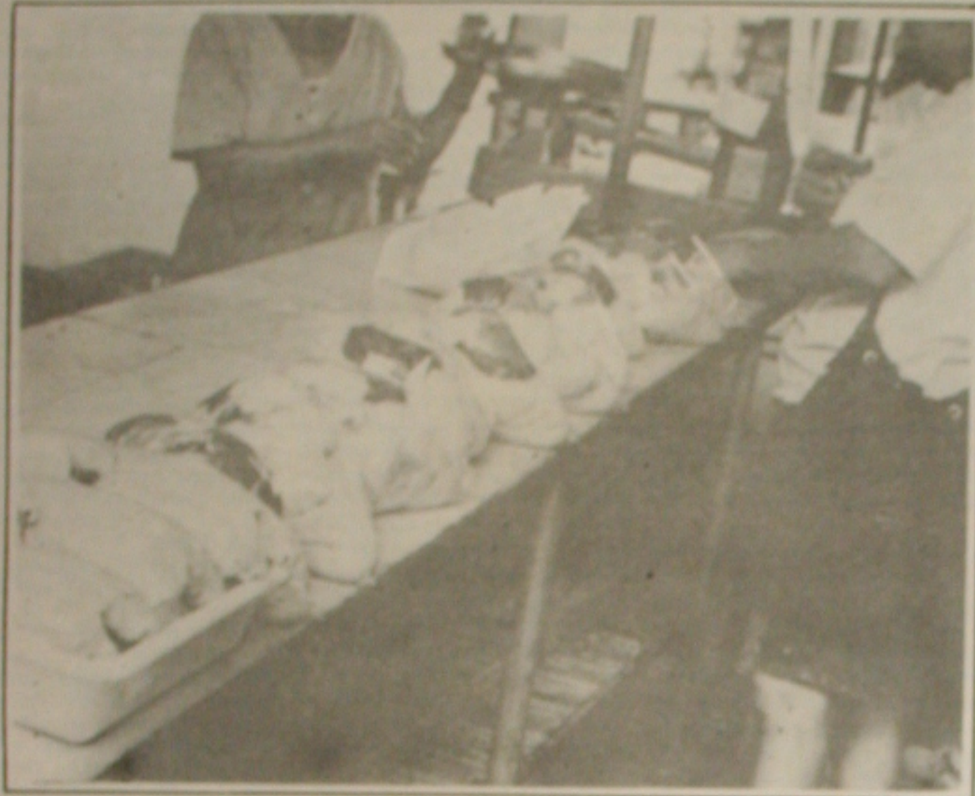
O mercado de frangos começa a se recuperar da crise que provocou a queda do preço do produto.