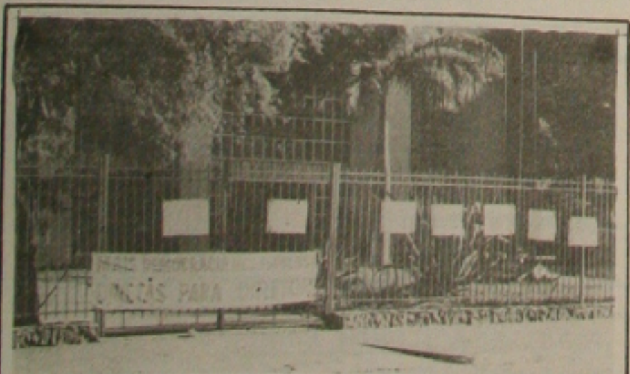
Os alunos do Atheneu reivindicam professores e infra-estrutura na escola.

Além de pronunciamentos de sindicalistas, está previsto um grito de carnaval a ser animado pelo trio elétrico Radíofon que percorrerá os principais pontos da orla até as 18 horas quando as comemorações serão encerradas. Os sindicalistas pretendem ainda com esta manifestação medir o grau de insatisfação do trabalhador quanto às medidas adotadas pelo presidente Fernando Henrique Cardoso. Estão incluídas no plebiscito indagações a respeito de uma possível greve geral.