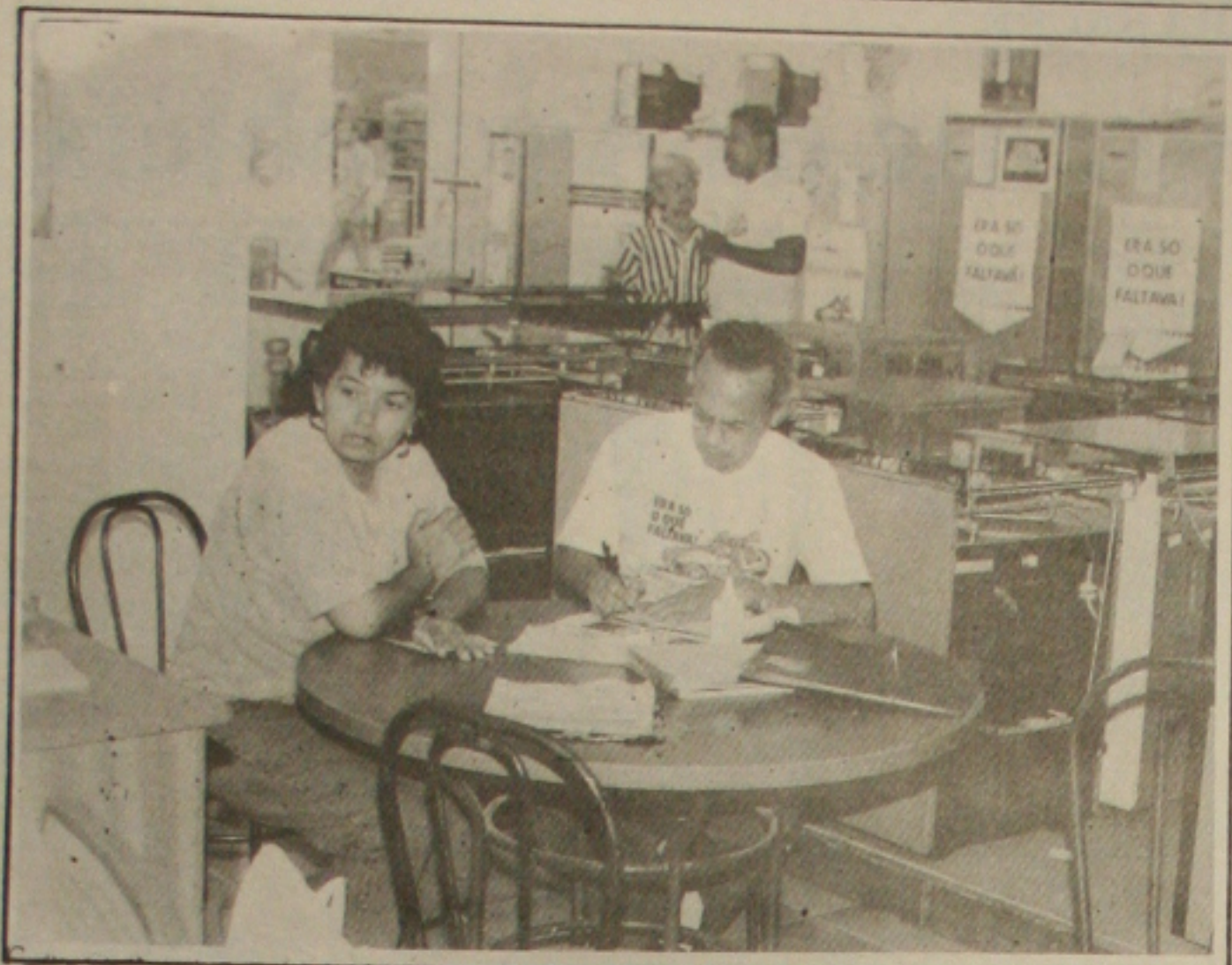
Governo deixa empresas e consumidores atordoados. Ninguém sabe mais o que acontecerá no dia seguinte.