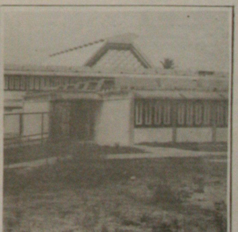
O Caic está completamente abandonado e enfrenta frequentes depredações.

Licença sanitária vencida desde julho de 1993, funcionários sem apresentar as respectivas carteiras de saúde, alimentos, principalmente carnes, deteriorados ou mal acondicionados, inclusive sobre áreas insalubres e até cabelos em meio a uma farofa que seria servida no almoço de ontem. Estas foram algumas das irregularidades que levaram ontem os fiscais da Divisão de Vigilância Sanitária da Secretaria municipal de Saúde a interditar, por tempo indeterminado, o restaurante da Assembleia Legislativa de Sergipe. Segundo o Diretor de Vigilância à Saúde, médico-veterinário e sanitarista João Farias Figueiredo, o estabelecimento só será reaberto após serem corrigidas todas as irregularidades ali detectadas. (Página 5A)