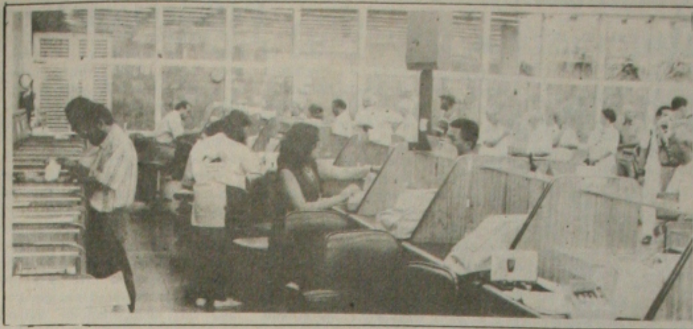
As agências do BB em todo o Estado vêm passando por um processo de enxugamento

tensão da diretoria da instituição e do Governo Federal remanejar as "sobras" de pessoal das agências que foram "enxugadas", salientando porém que no caso de Sergipe, provavelmente não haverá necessidade de reaproveitamento de funcionários. (Página 6A)