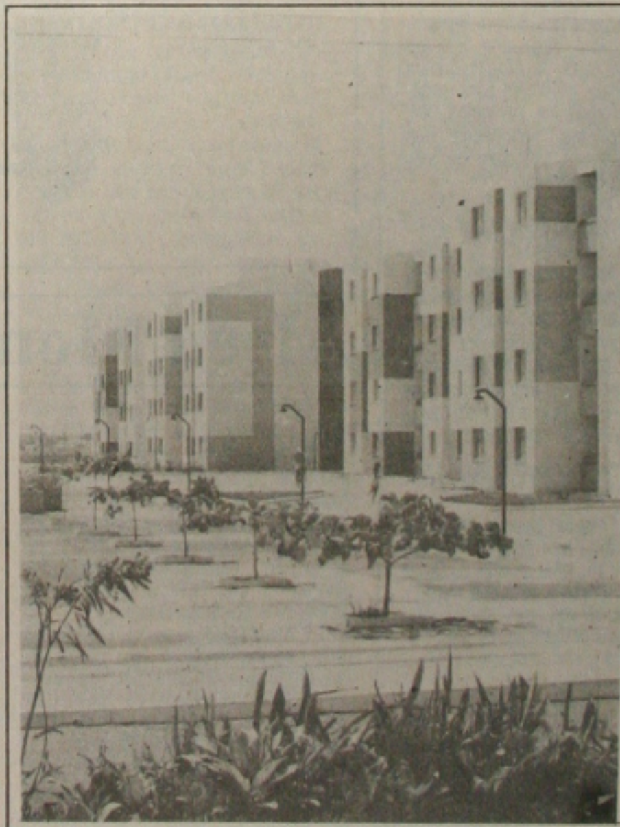
O Governo voltará a financiar a construção de imóveis em todo o País