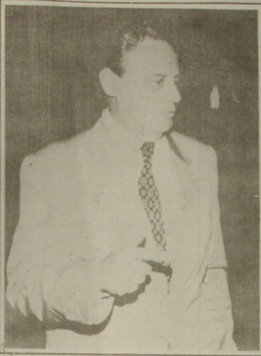
FHC: esperando Comissão de Justiça