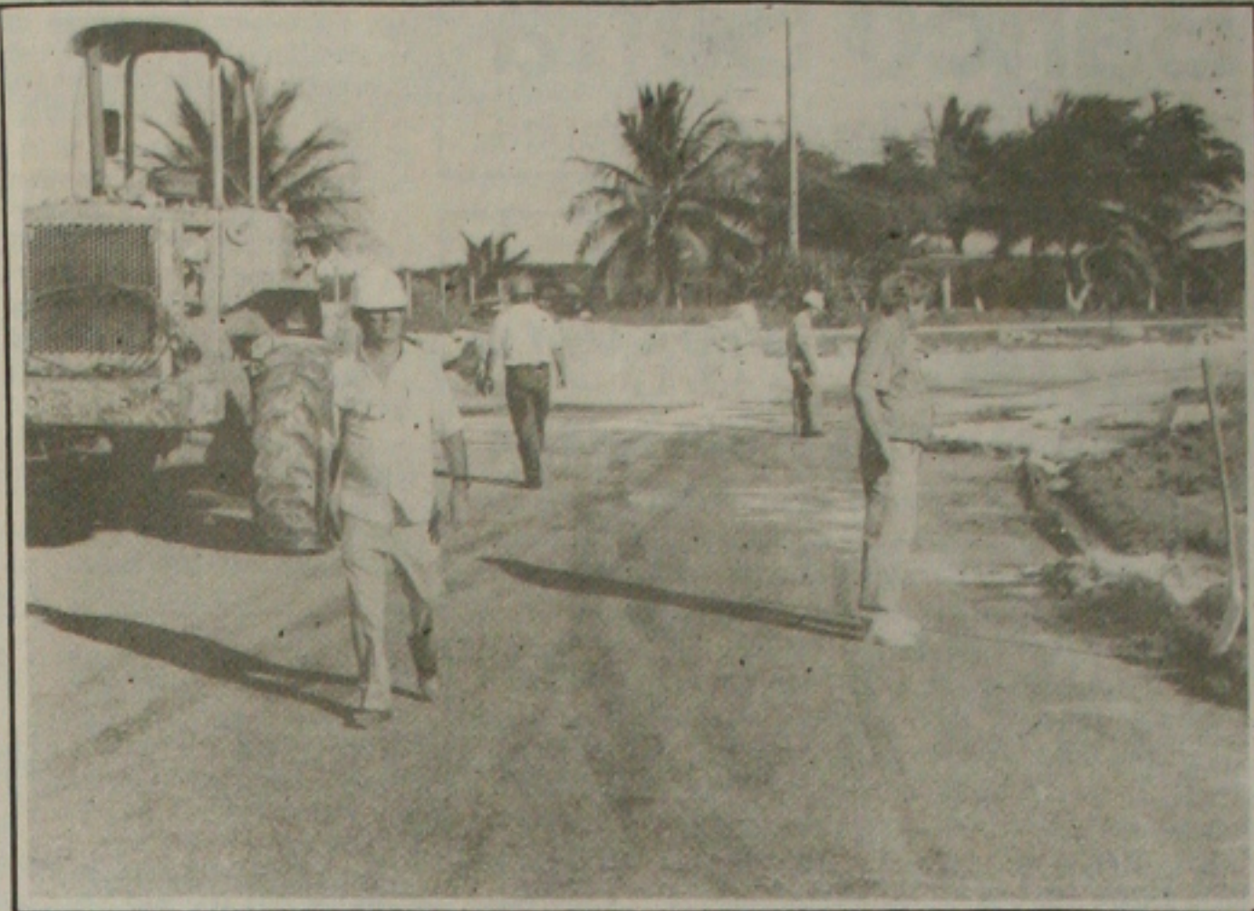
Operários de vários órgãos no Estado trabalharam por várias horas para desobstruir o trecho.

Segundo informações do Corpo de Bombeiros, o motorista da carreta, que é sergipano, disse que entrou em Aracaju pensando que estava chegando em Maceló. Revelou que ele não chegou a explicar a razão do acidente que provocou o derramamento de cerca de 15 toneladas do ácido corrosivo na pista, apenas informou que vinha no sentido da Avenida Tancredo Neves/Rodovia Paulo Barreto.