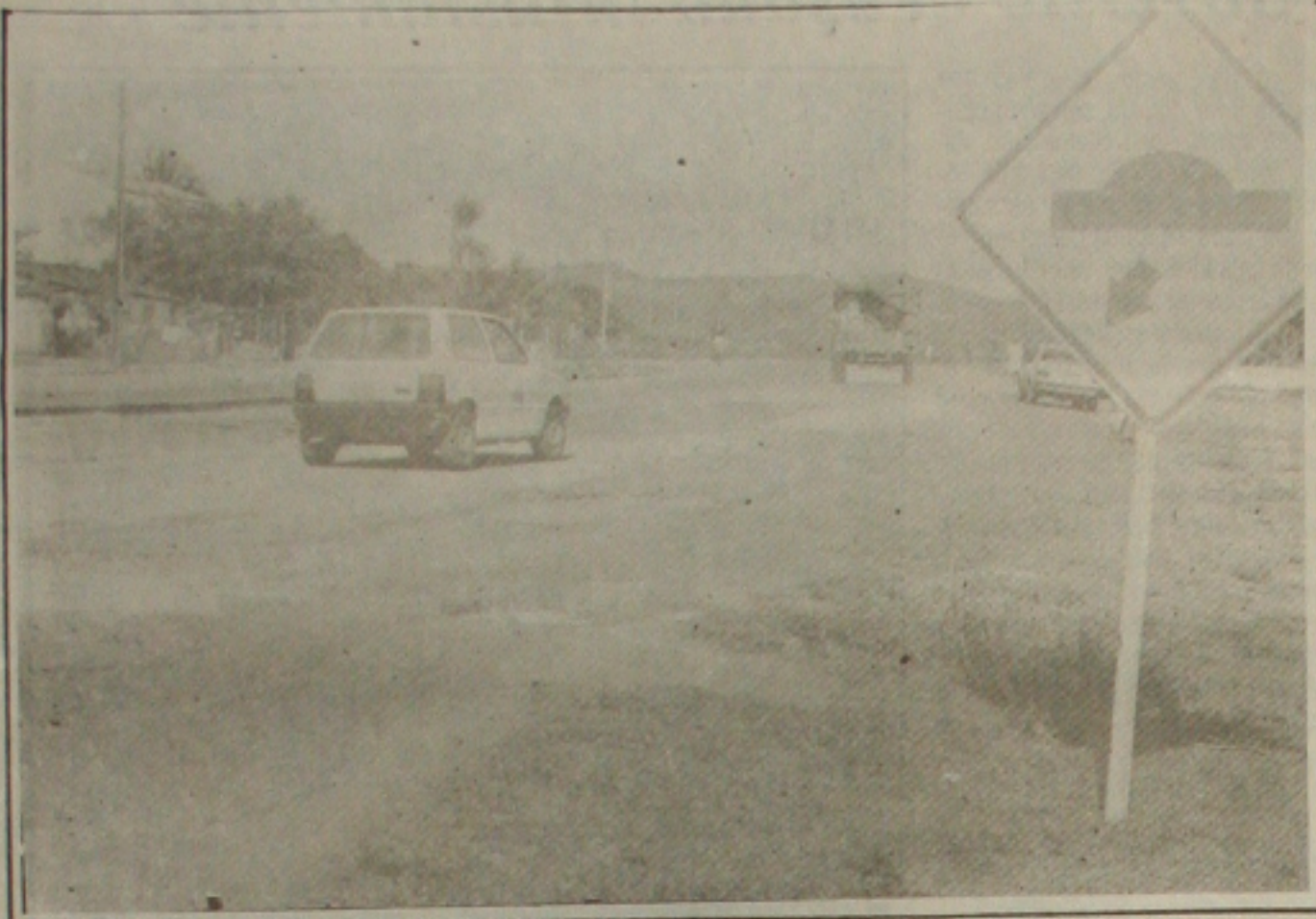
Em quinze dias, oito pessoas já morreram de acidentes ao longo da rodovia 235, de Itabaiana a Aracaju