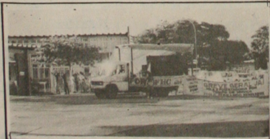
Os petroleiros estão em greve contra as reformas propostas por Fernando Henrique

Gerais os petroleiros estão em greve desde o dia 2, assim como no Estado do Rio Grande do Norte. Na Bahia a greve é uma realidade em Simões e no Sítio. No Estado do Rio de Janeiro a greve já foi deflagrada em alguns setores e em outros a decisão pela adesão ou não está sendo tomadas através de assembleias gerais. Aderiram à greve os petroleiros em Santa Catarina, Manaus, Pará, Ceará, Rio Grande do Norte, Alagoas, Minas Gerais, Caxias, Campinas, Cubatão e no Rio Grande do Sul.