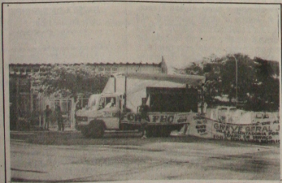
Os petroleiros fizeram manifestações em frente à sede da Petrobrás

O presidente Fernando Henrique Cardoso embarca hoje para a Inglaterra a fim de participar das comemorações do cinquentenário do fim da Segunda Guerra Mundial. O Brasil, na época, foi o único País da América do Sul a enviar tropas - a Força Expedicionária Brasileira (FEB) - para combater os nazistas que ocupavam a Itália.