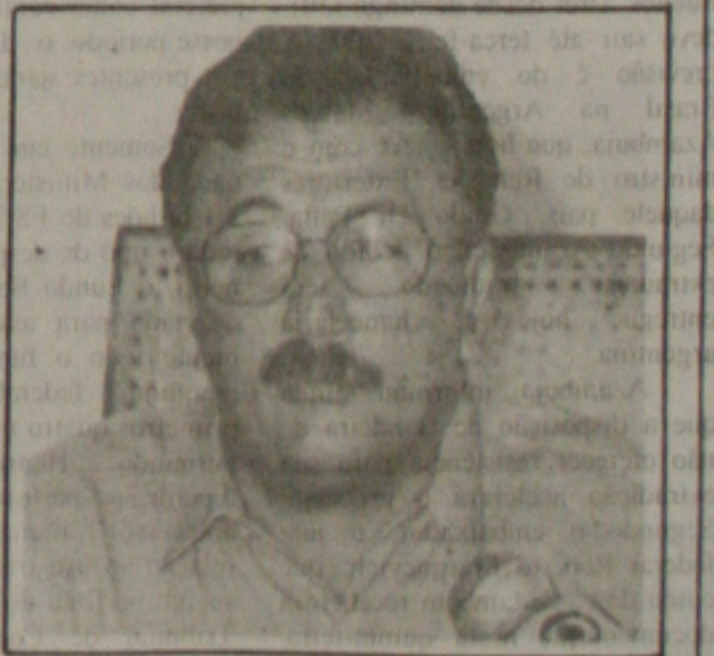
Jackson Barreto na pendência legal de se candidatar a Prefeito de Aracaju nas próximas eleições.

Recebi a bonita revista comemorativa dos 75 anos do Corpo de Bombeiros . Bastante interessante e proveitoso o Manual de Prevenção .