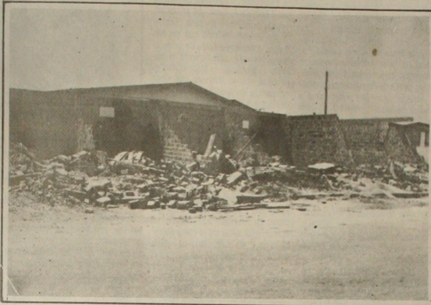
Quem ganha até três mínimos vai ter casa financiada pelo FGTS

Sergipe tem o maior índice de inadimplentes. Na área agrícola temos 30%, quando a média nacional não chega a 20%. Daí a necessidade para se conseguir recursos para os sergipanos - lamentou Gonzaga, acrescentando que esse índice já superou 50% e a agência Siqueira Campos é campeã nisso, o que prejudica os que honram seus compromissos. (Por Cláudio Messias).