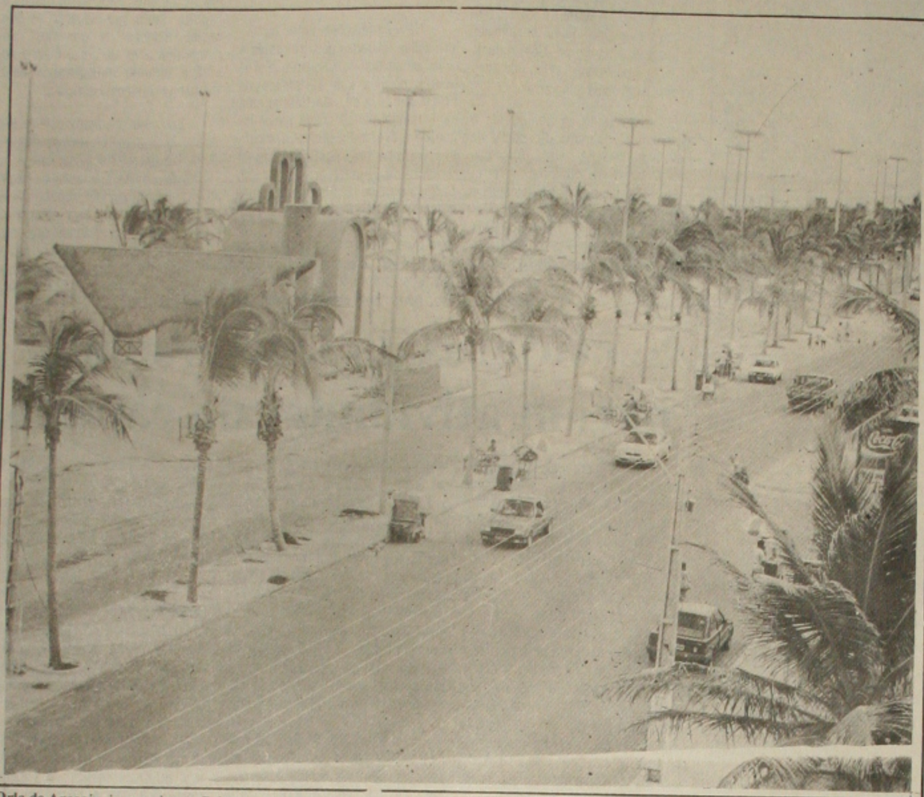
Orla de Aracaju impressionou Caio, que aposta no turismo para gerar postos de trabalho no Nordeste.