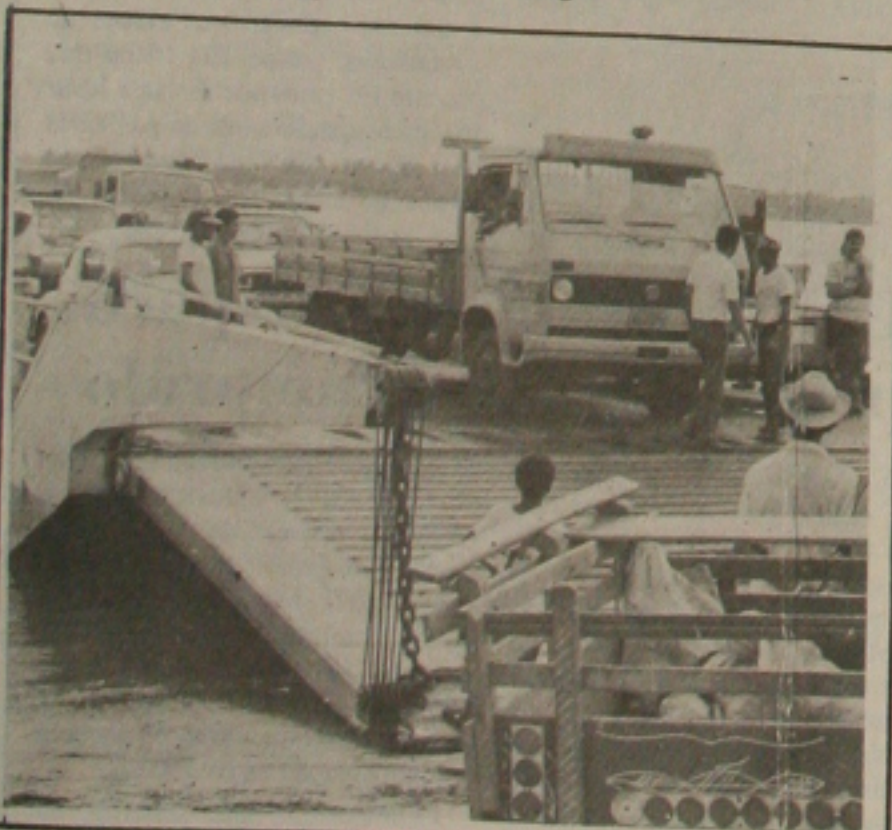
Com apenas uma balsa em operação, a travessia do Mosqueiro prejudica o turismo.