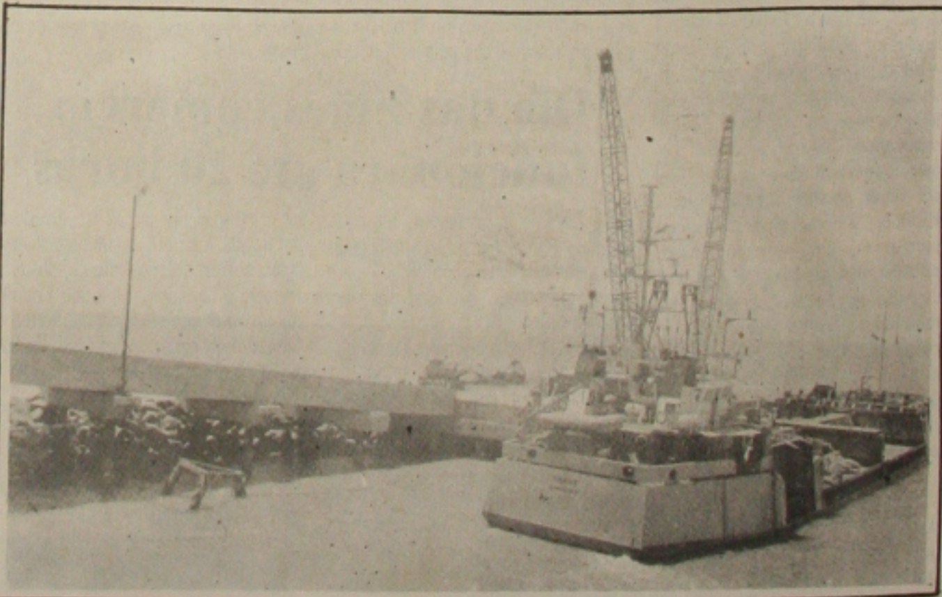
Porto de Sergipe é barato e moderno, atraindo exportadores

Atualmente, o Terminal Portuário Ignácio Barbosa (porto de Sergipe, em Barra dos Coqueiros) é um dos mais baratos no País, ganhando na competitividade dos demais. (CM).