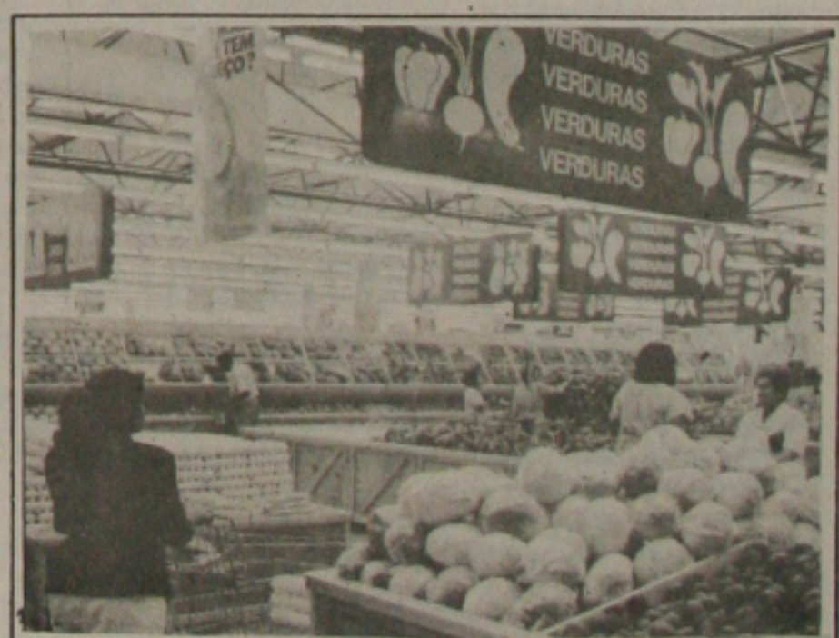
Os produtos da cesta básica vem tendo altas significativas desde o início do ano