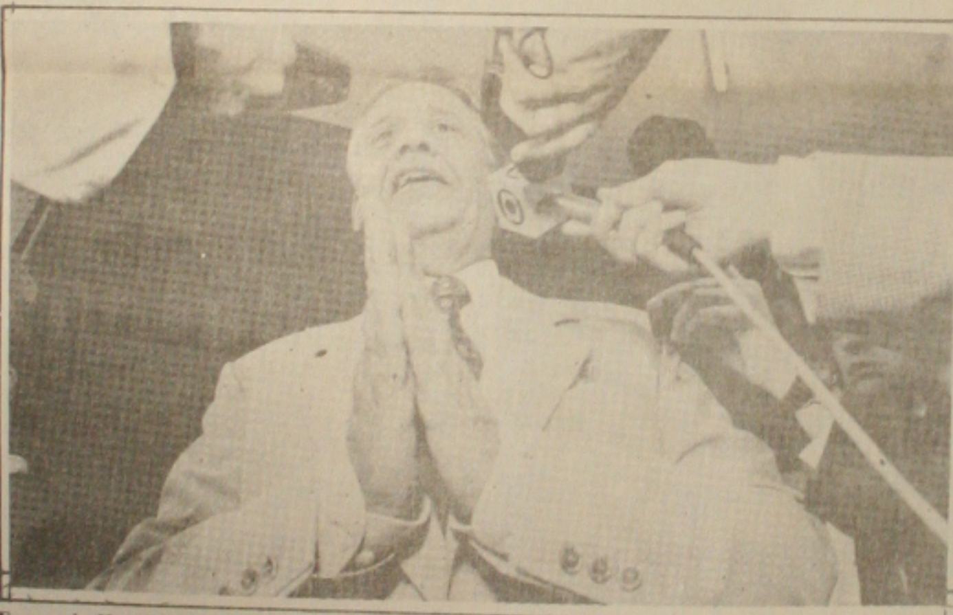
Fernando Henrique: recursos para moradia e saneamento

Cardoso assistiu ao desfile das tropas e à evolução da banda marcial do Corpo de Fuzileiros Navais, que se perfilou formando letras como a vitória e os símbolos das três armas. Cardoso chegou a cantar, demonstrando saber o hino dos pracinhas e presenteou as Forças Armadas com dois galhardetes ressaltando a participação do Brasil na Guerra, que lhe foram entregues em abril último.