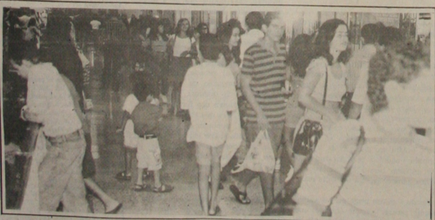
No Shopping Riomar, o movimento também resceu nos últimos dias

construção de moradias populares para quem ganha até três salários-mínimos e obras de saneamento básico em municípios cujas dívidas estejam em dia para com a União. A liberação dos recursos do FGTS foi decidida durante reunião do Conselho Monetário Nacional, no dia 27. (Página 4B)