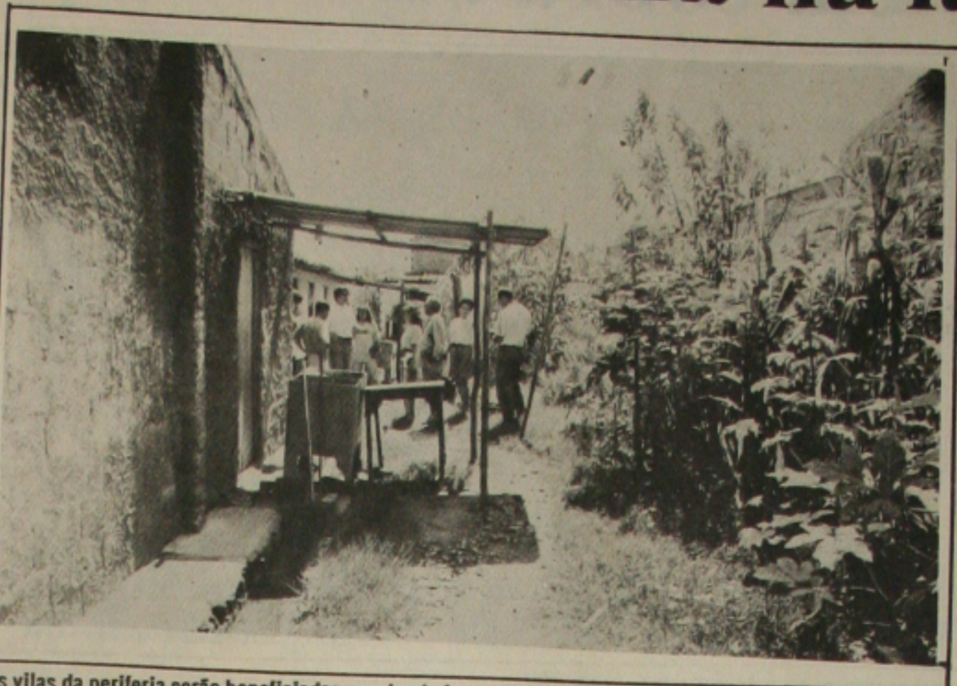
As vilas da periferia serão beneficiadas com banheiros e sistemas de fossas, para reduzir as infecções.

A SMTU acredita que os taxistas devem atender rapidamente a determinação e se ajustarem, antes do término do prazo, a esse controle. Os taxistas também deverão colocar as faixas. Ainda existe uma dúvida quanto a jurisdição da SMTU sobre os táxis emplacados em outros municípios da Região Metropolitana que servem à capital. Já os táxis do interior que fazem ocorrências eventualmente para Aracaju não serão obrigados a colocar a faixa de identificação.