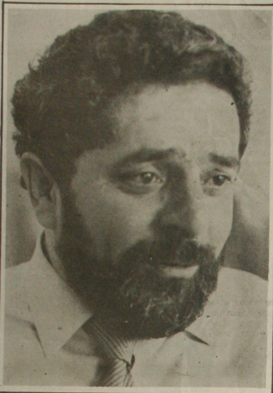
Lula: evita o pior