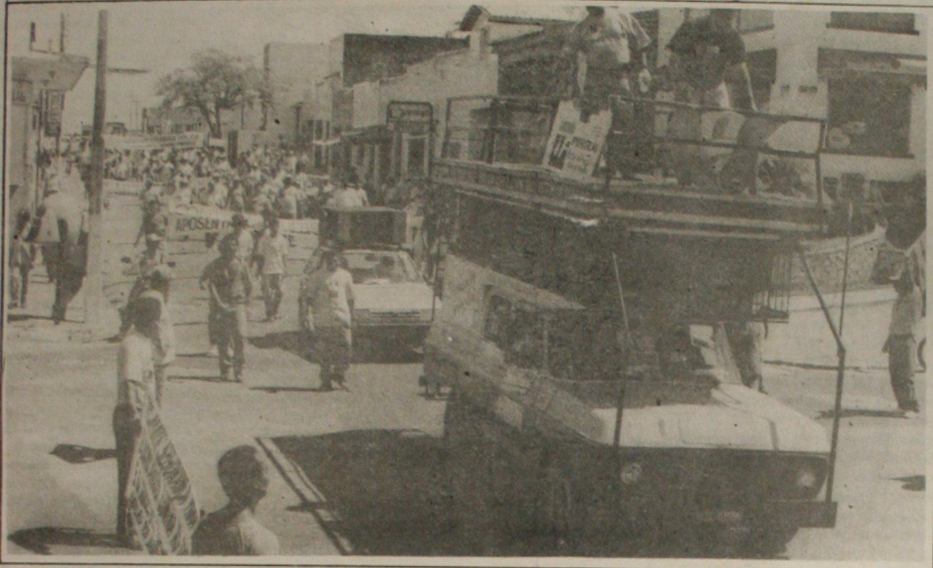
A tarde, ao lado de estudantes e outras categorias, os petroleiros promoveram uma passeata em Aracaju