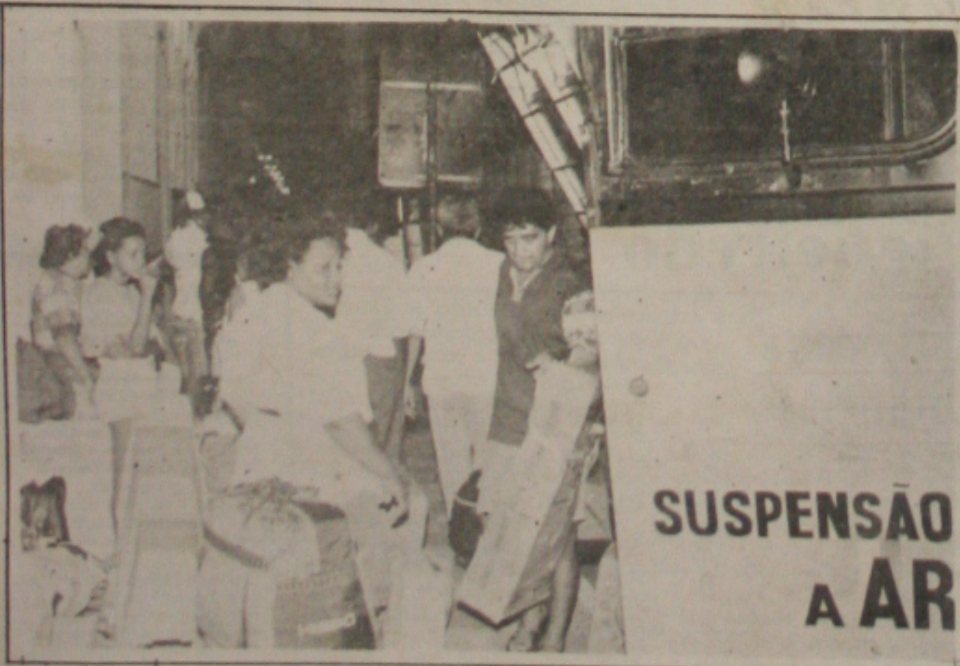
Os ônibus e os passageiros ficaram retidos na PF, que apreendeu todas as mercadorias