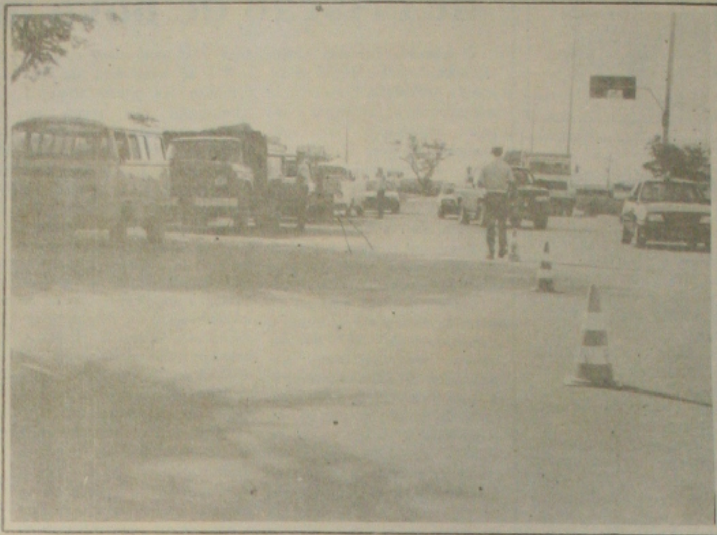
No primeiro dia de operação, os policiais apreenderam nove táxis em situação irregular.

Revelou ainda o major Santana, que os veículos apreendidos estão sendo conduzidos para o pátio da Companhia de Polícia Rodoviária (CPRV) e somente serão liberados mediante regularização.