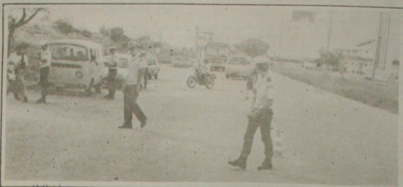
A CPRV iniciou ontem as blitzes e apreendeu muitos veículos que estavam com a documentação irregular

Tancredo Neves, em frente a Secretaria estadual da Fazenda e na Rodovia João Bebe Água, no município de São Cristóvão. Como resultado, nove táxis foram apreendidos, além de outros veículos como motos, kombis, bestas e carros de passeio. As blitzes vão continuar durante toda esta semana. (Página 4A)