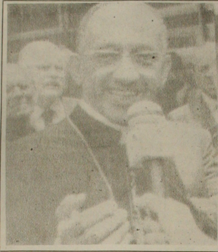
Dom Lucas Neves: presidente

A partir de 72 d. Lucas assumiu postos importantes no Vaticano, como vice-presidente do Conselho para Leigos, integrante da Comissão para a Família, Consultor da Pontifícia Comissão para a América Latina, membro do Secretariado do Sinodo e da Pontifícia Comissão da Justiça e Paz. Em 79 foi escolhido secretário da Sagrada Congregação para os Bispos do Colégio dos Cardeais do Vaticano.