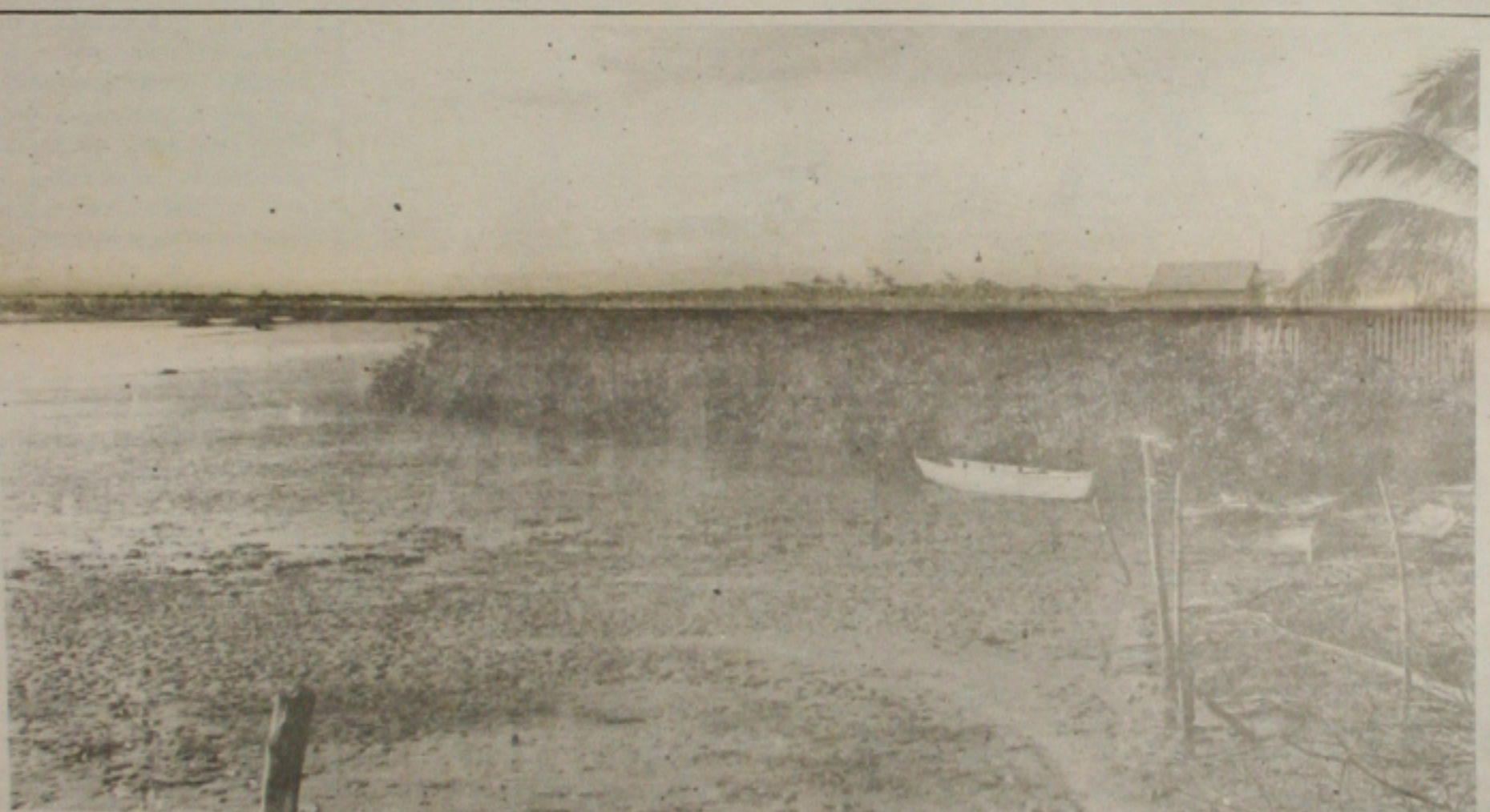
Os representantes do segmento turístico vêem como necessária a preservação dos manguezais