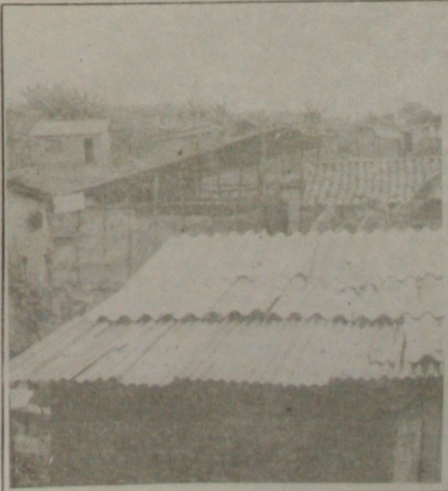
A favela será beneficiada com obras de pavimentação e saneamento

Terminal Rodoviário Governador José Rollemberg Leite, na zona oeste. Já na cidade de Pedrinhas, a Polícia encontrou um corpo, do sexo masculino, em adiantado estado de decomposição, também num matagal. Neste caso há a suspeita de que tenha ocorrido um assassinato, em função do corpo do desconhecido apresentar várias perfurações, de projéteis calibre 38.