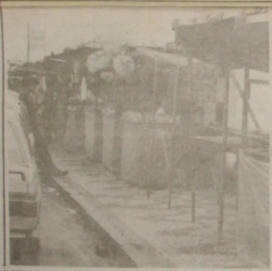
A portaria também estabelece critérios para o comércio de fogos