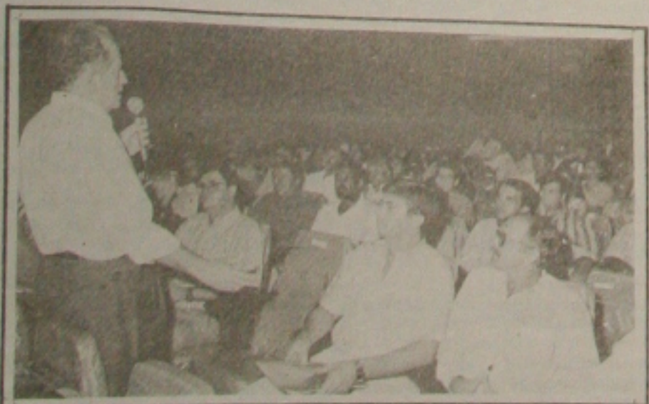
Governador participou de lançamento da campanha de divulgação da Rua 24 Horas.