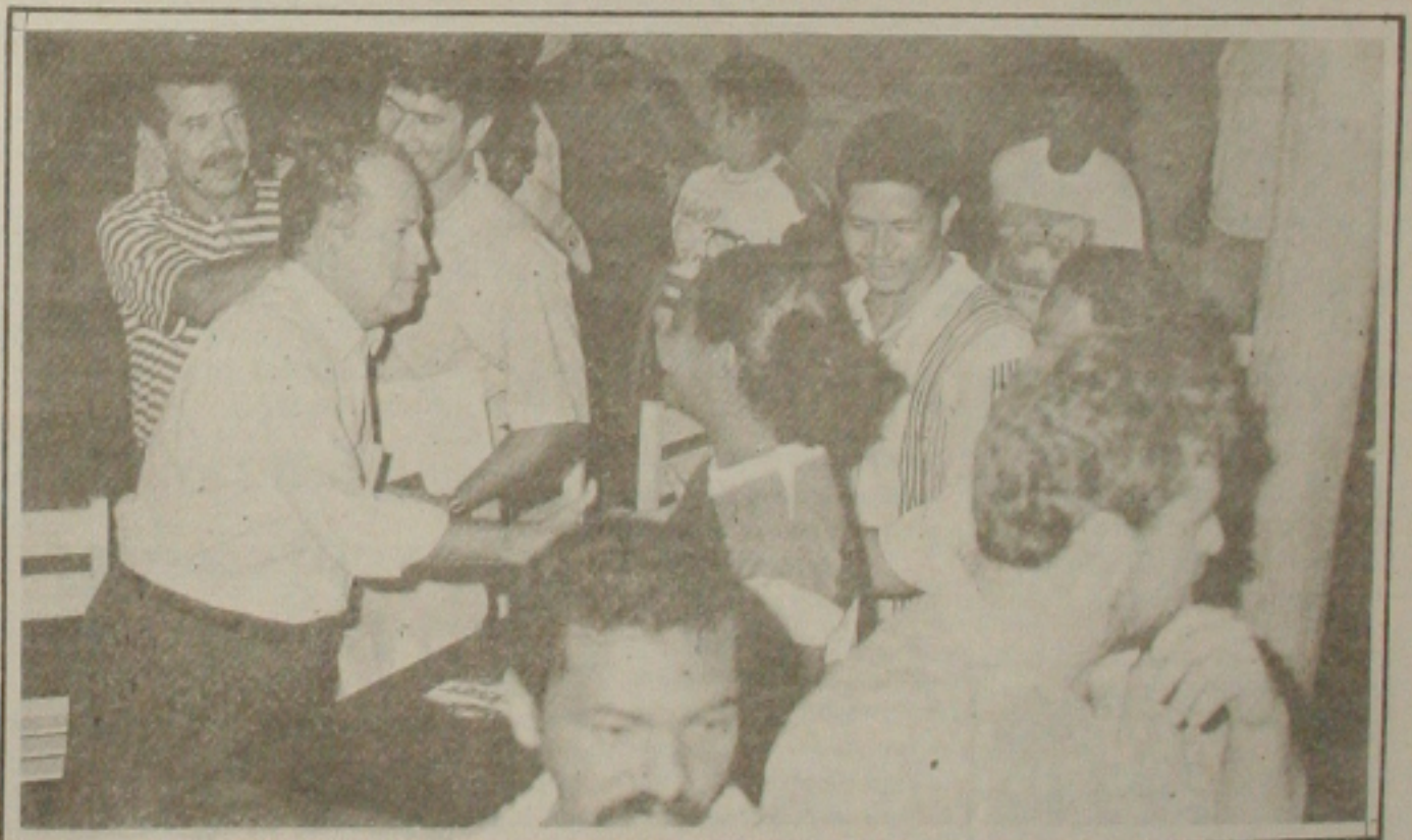
Comerciantes ouviram de Albano Franco garantia de que terão apoio do Estado.

"Ajudando o empresário estamos ajudando o Estado", sentenciou o governador, lembrando que a Rua 24 Horas é uma iniciativa pioneira no Nordeste e a segunda da espécie no País. Finalizando, foi enfático ao dizer que fura de tudo para ajudar os lojistas na solução dos problemas que enfrentam para manter em atividade aquele centro comercial, dotado de 38 lojas, cinema, restaurante e ampla área para o artesanato, mantendo 400 empregos diretos. "numa perfeita somação dos poderes público e privado", conforme observou Albano Franco.