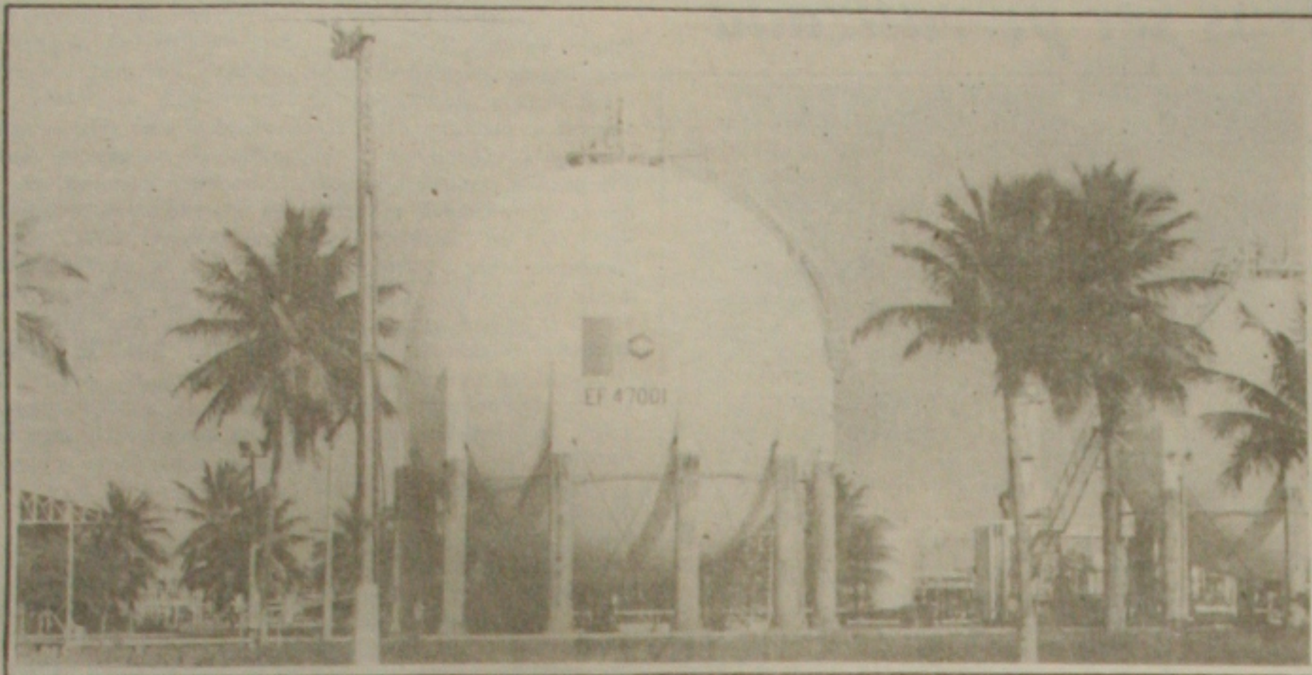
Os estoques de gás de cozinha no Tecarmo asseguram o abastecimento nos Estados de Sergipe e Alagoas.