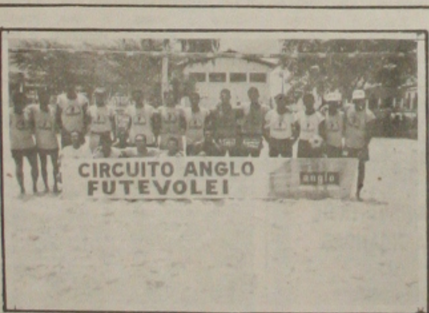
O circuito Anglo de futvolei, prossegue na Praia de Atalaia.

A empresa Ribeiro Chaves candidata a conquista do tricampeonato está nas finais e semifinais do handebol, voleibol, futebol de salão e de futebol suíço. Este ano as empresas campeãs das modalidades em disputa estarão participando da Olimpíada Nacional do Sesi programada para o período de 10 a 15 de agosto próximo, em São Paulo.