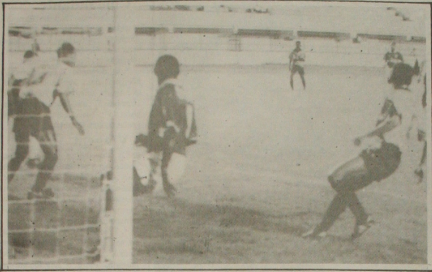
O São Cristóvão se defendeu bem e marcou no contra ataque.

O maior problema vai ser administrar as duas competições numa fase de jogos decisivos. Como a Copa do Brasil é considerada muito importante, por assegurar ao campeão uma vaga na Taça Libertadores, não há alternativa "Vamos tentar ganhar as duas", diz Vanderley Luxemburgo, apesar de admitir que Fluminense e Botafogo, dois dos principais concorrentes no campeonato estadual, não sofrerão o mesmo desgaste. O Flamengo vai enfrentar o Grêmio, e o Vasco jogará com o Corinthians, na semifinal.