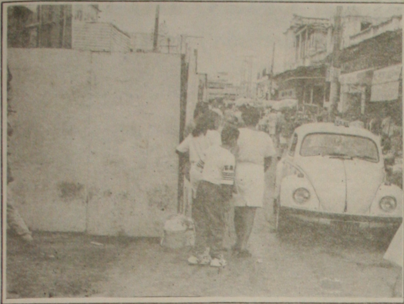
O tapume impede a passagem dos pedestres que disputam a meia pista com os veículos