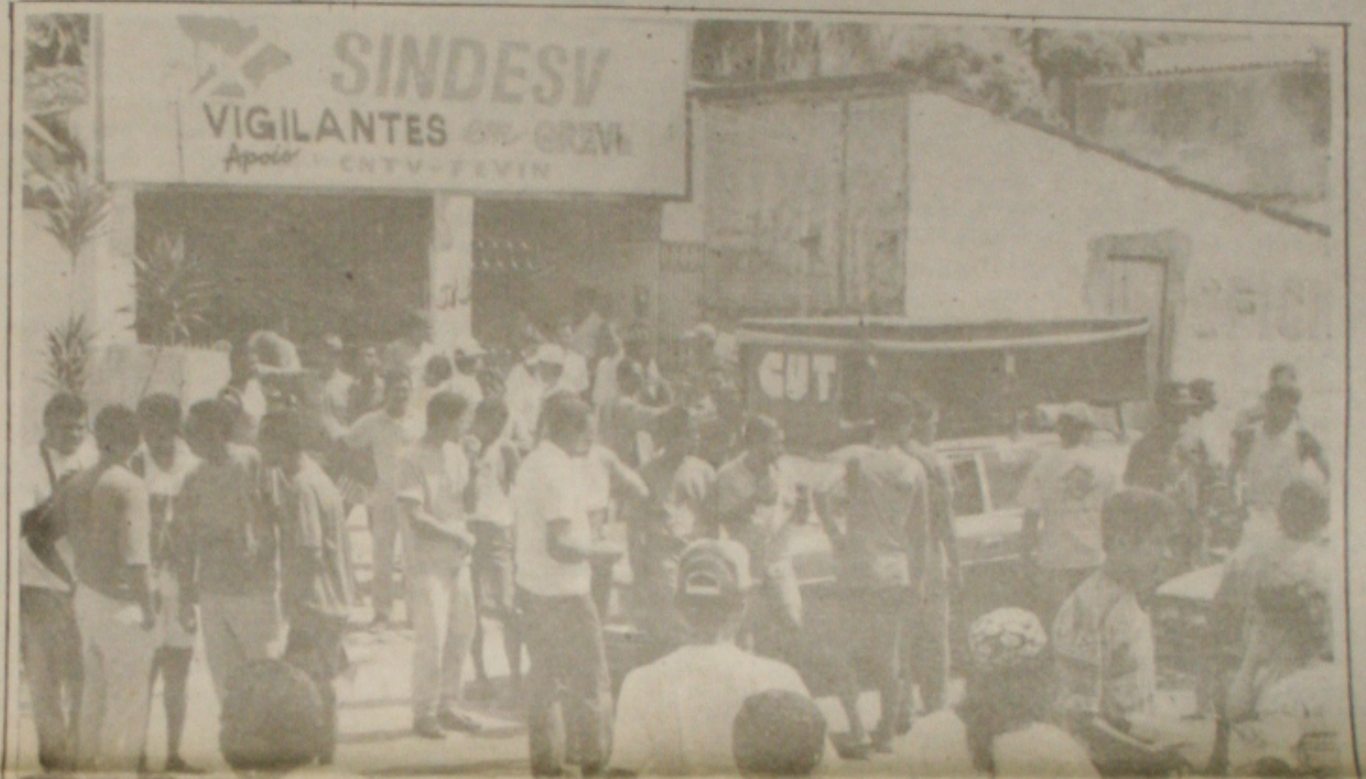
Os vigilantes estão em greve há cinco dias mas as negociações continuam em impasse com as empresas

mento. A multa de R$ 100 mil por dia de paralisação também foi referendada por unanimidade dos ministros do TST. Com isso, os 21 sindicatos que congregam a categoria em todo o País já acumulam uma dívida de R$ 35,1 milhões em penalidade, desde o meio-dia do último dia 10, quando a multa começou a vigorar. Apesar da decisão de ontem do TST,