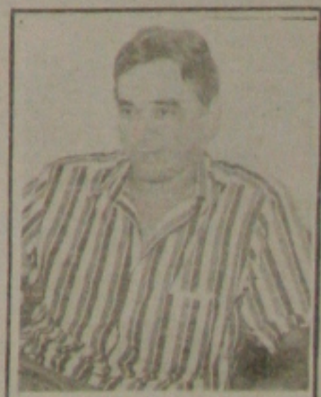
Reis espera lei mudar, para se decidir

Se o PMN acabar, claro que terei que procurar outra legenda, mas tem que ser uma que defenda os interesses do povo, como o PMN que é contra a quebra dos monopólios das telecomunicações e do petróleo. Além disso, tenho amigos em vários partidos e sei que serei bem recebido em qualquer um deles - argumentou o parlamentar do PMN.