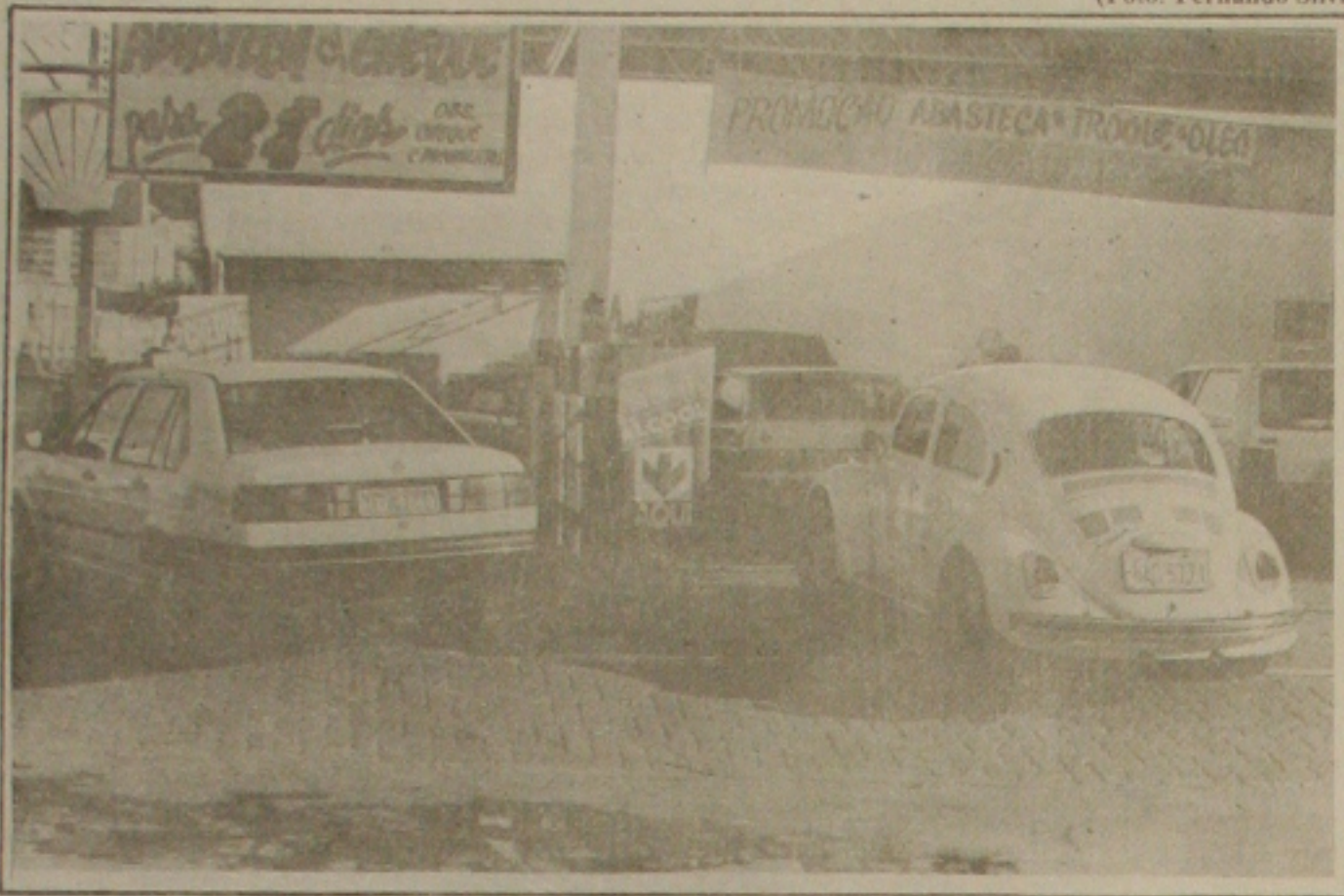
Postos podem ficar sem gasolina e óleo