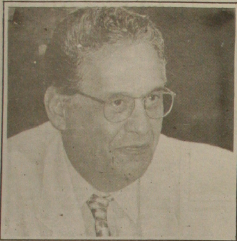
Cardoso: apelo aos grevistas

Reconhecimento do acordo é negado e de multa os sindicatos já devem R$ 35,1 milhões