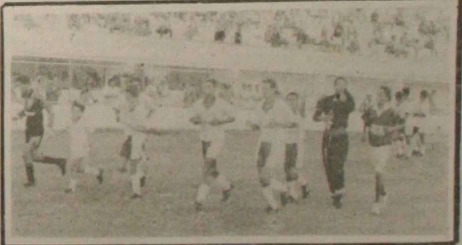
O time de juniores do Sergipe, deu a volta olímpica após a vitória contra o Confiança e a conquista do segundo turno.

Ontem, apesar dos problemas internos, os dirigentes do Cotiguiba comemoravam a classificação, para o cruzamento olímpico, oportunidade em que o Cotiguiba pode conquistar uma vaga para a fase final da competição. Existe a promessa de contratações e principalmente de uma maior participação dos torcedores, nos dois jogos contra o Sergipe. A classificação do Cotiguiba, foi assegurada depois da derrota do Olímpico, para o São Cristóvão por 1x0, no último domingo. Cada atleta do São Cristóvão foi premiado com uma gratificação de R$ 100,00, paga no vestiário pelos dirigentes do Cotiguiba.