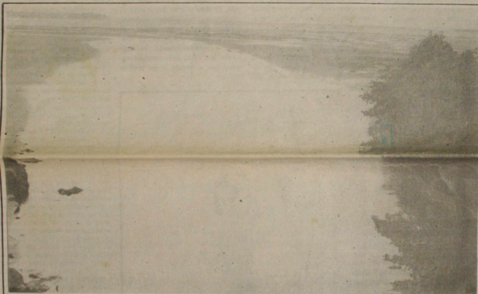
O rio Sergipe é hoje um dos mais poluídos e se transformou num depósito dos esgotos da cidade

O presidente Fernando Henrique Cardoso voltou ontem a defender a quebra do monopólio estatal do petróleo que, segundo afirmou deverá se constituir num marco importante para o desenvolvimento do País. "Em poucos dias nós teremos talvez um marco muito significativo de uma virada de página da História", disse o presidente, na Serra da Canastra (MG), onde comemorou o Dia Mundial do Meio Ambiente bebendo água da nascente do rio São Francisco, a 1.400 metros de altitude. A emenda constitucional que acaba com o monopólio da Petrobrás deve ser votada