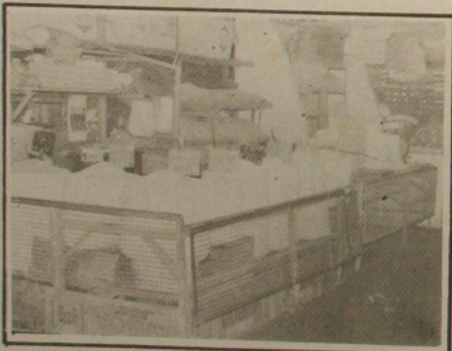
Arroz é o que não falta em Sergipe, mas os preços não estimulam os rizicultores.