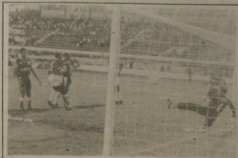
No domingo, o Sergipe vence o Confiança por três a um e conquistou o primeiro turno

A FSF definiu ontem a ordem dos jogos do chamado cruzamento olímpico que vai definir a participação de mais um clube na fase final do campeonato estadual deste ano. Segundo o sorteio realizado ontem, Sergipe e Cotiguba jogam a primeira partida da série de duas amanhã à noite no Batistão, local também do segundo jogo entre as duas equipes, no próximo domingo. Na quinta-feira, será a vez de Confiança e Itabaiana, também no Batistão. Os dois times voltam a se enfrentar no domingo, no estádio Presidente Médici. (Página 1B)