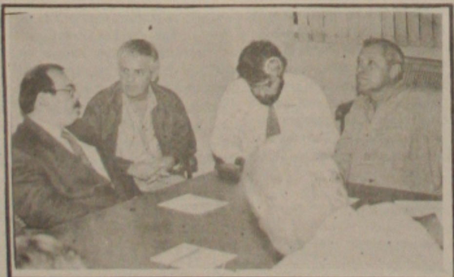
Sem acordo na reunião de ontem, restou ao DER cumprir a liminar

Maria frisou que a Serra de Itabaiana foi enquadrada pelo Governo Federal como estação ecológica, em fase de implantação. O reconhecimento e o registro da importância da estação, segundo elas se faz notar pela empolgação do programa "A serra vai as escolas e as escolas vai a serra", oferecido pelo Ibama. "Entretanto, ainda é pouco, diante da gama de recursos oferecidos pela serra.