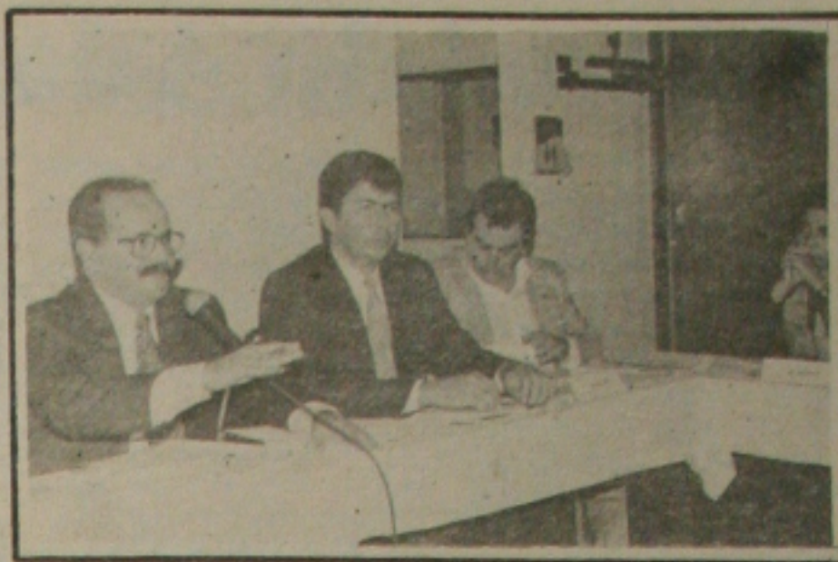
Os secretários continuam reunidos hoje no Celi

Na avaliação do parlamentar é preciso ter uma Secretaria municipal, a fim de que as agressões contra o meio ambiente sejam denunciadas no Ministério Público. Também ele advoga campanhas municipais nas escolas e comunidades que orientam as pessoas sobre o verdadeiro significado da natureza para a qualidade de vida.