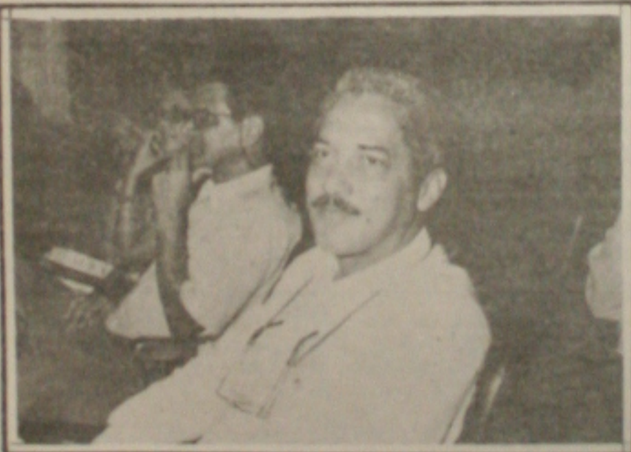
O competente Secretário de Estado da Segurança Pública, Wellington Mangueira, especialmente para esta coluna fotografado por Flávio Monteiro.

Hoje o turismo é um produto de grande consumo por parte dos sergipanos. Viajemos ao exterior, estão acessíveis para a classe média. Querendo, quase todo mundo pode passear em Miami.