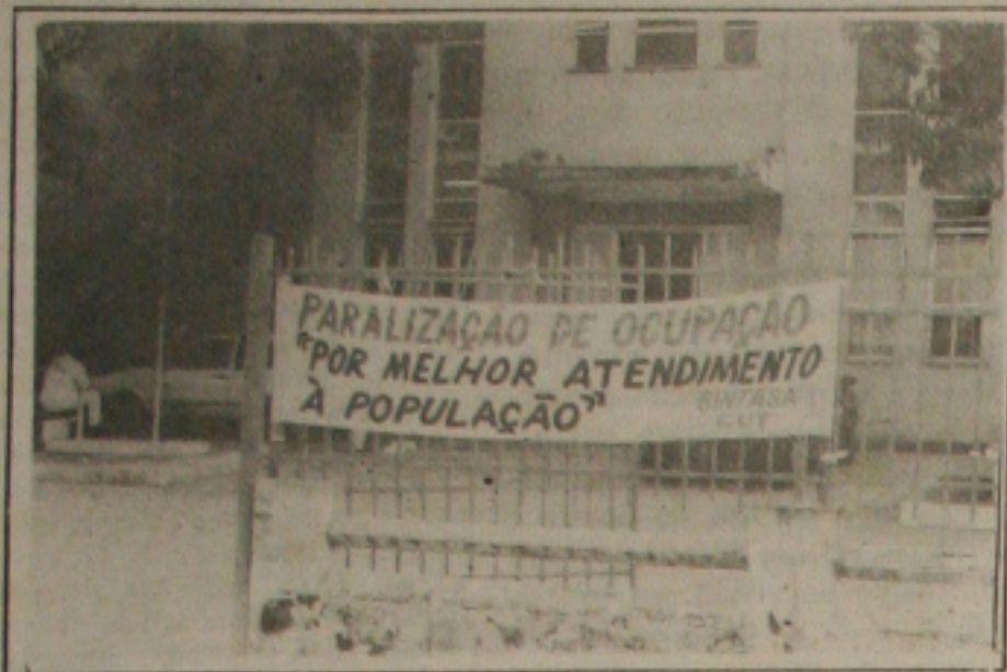
Uma faixa à entrada do hospital anunciava a greve dos servidores do Adauto Botelho