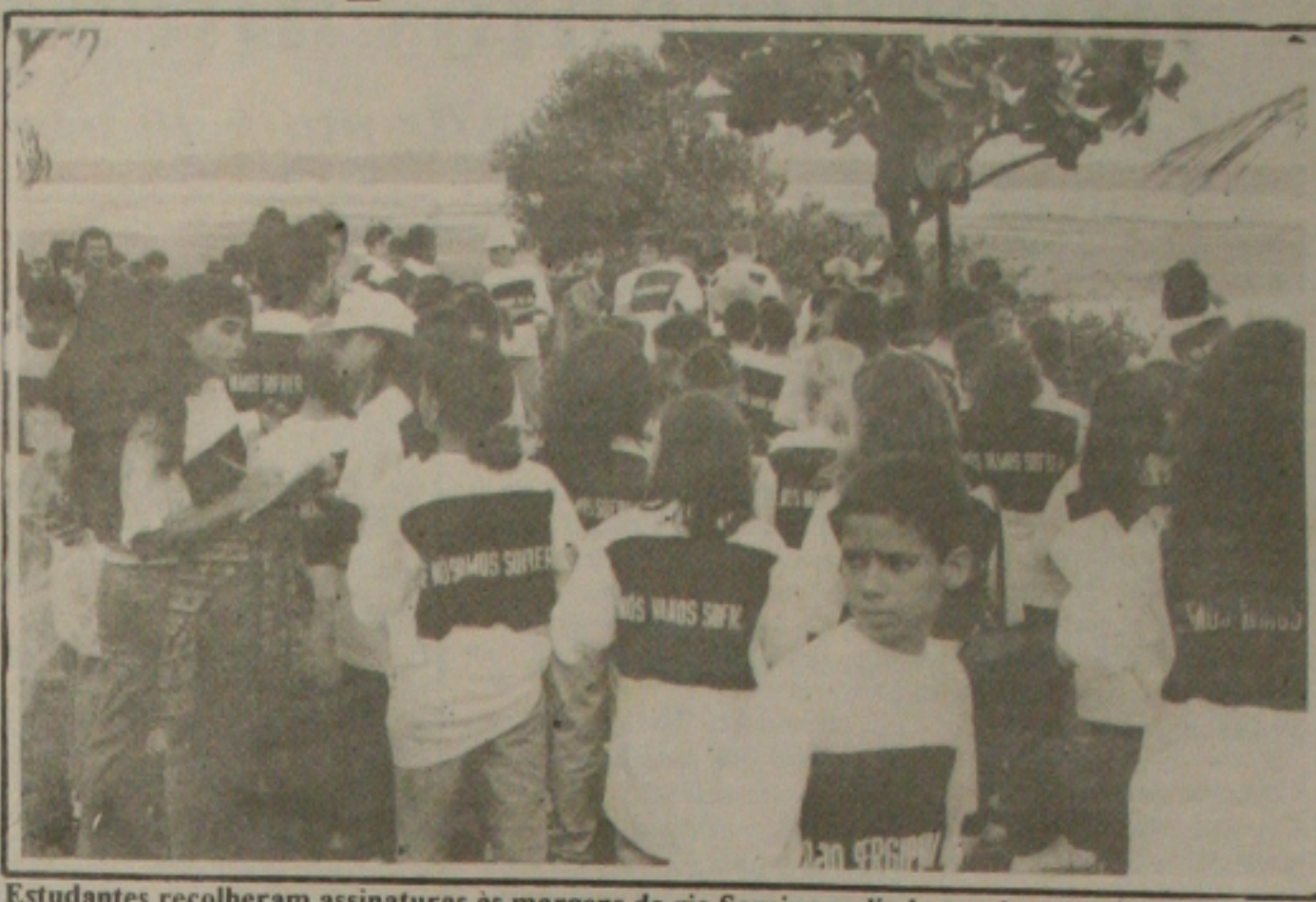
Estudantes recolheram assinaturas às margens do rio Sergipe pedindo sua despoluição ao Governo

Nesta petição, esperam os alunos que os governantes iniciem o Projeto de Despoluição do Rio Sergipe, por entenderem que a água é, sem dúvida, um elemento vital para os ecossistemas e para as sociedades humanas, e que a cada dia torna-se comprometida com a poluição e a contaminação, ameaçando a vida dos homens, animais e vegetais.