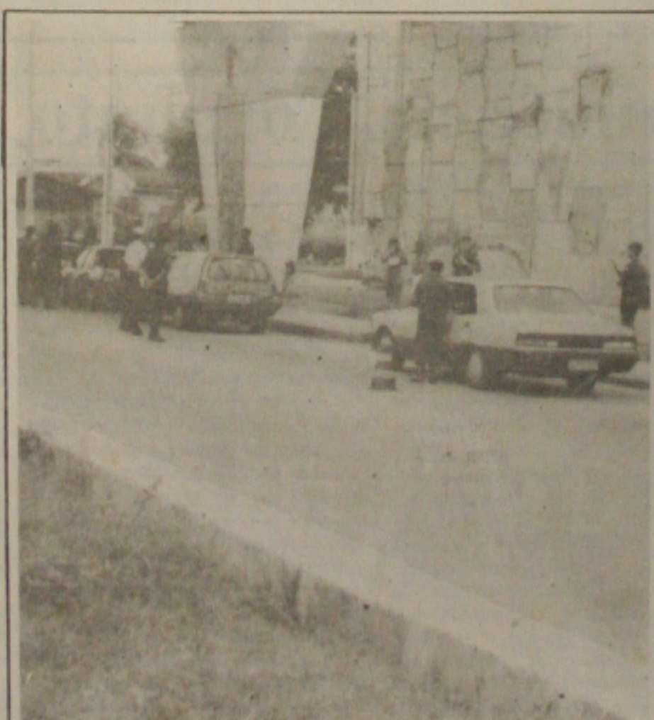
O Detran vai realizar blitzes constantes para apreender os veículos não emplacados até agora