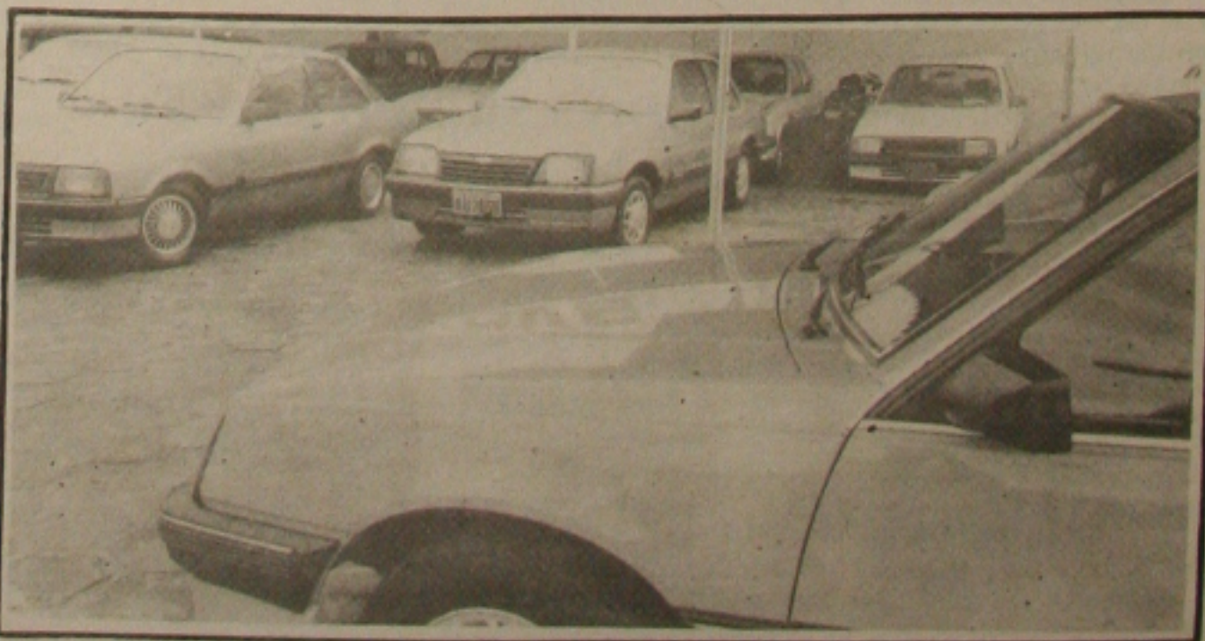
Sobram carros nas vendas e dificuldades assustam alguns revendedores.

Em Sergipe, os revendedores também reclamam das medidas de governo, que inviabilizaram o negócio de carros usados. Aqueles que trabalham por conta própria estão procurando fazer outra coisa, pois está difícil se manter, mesmo comprando mais barato de proprietários com a corria no pescoço. Tem gente vendendo Verona 90 por até R$ 6,5 mil. Este mesmo carro em dezembro poderia ser comercializado por R$ 10 mil. Os únicos que ainda mantêm preços elevados, com ágio, são os chamados oficiais cobram dentro da tabela, numa prova de que o governo federal não tem capacidade para proteger o consumidor, quando se trata de agir contra poderosos grupos econômicos. (POR CLÁUDIO NESSIAS)