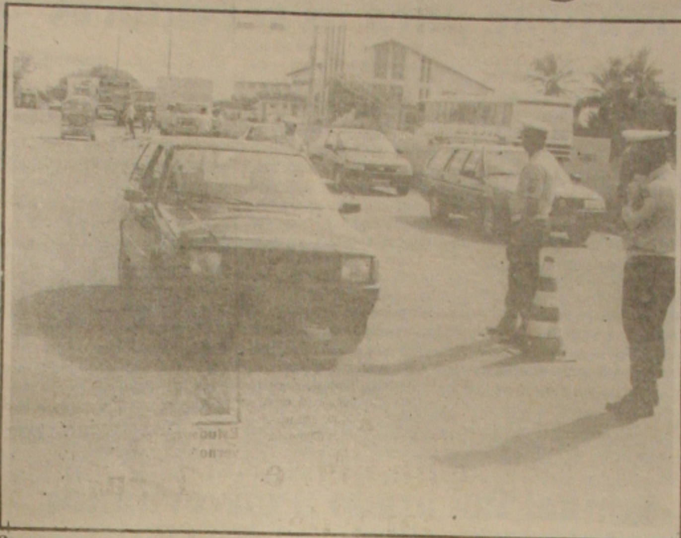
Os guardas continuam atentos e apreendendo os veículos não emplacados dentro do prazo.

A procura pelos fogos de artifício já começou. Os usuários já começam a se manifestar e muitas pessoas estão, ainda de forma tímida, procurando os fogos de artifícios nas barracas instaladas ao lado do Shopping. "As pessoas estão começando a procurar, mas a gente não tem atendido bem a estas pessoas por falta de segurança", denunciam os comerciantes.