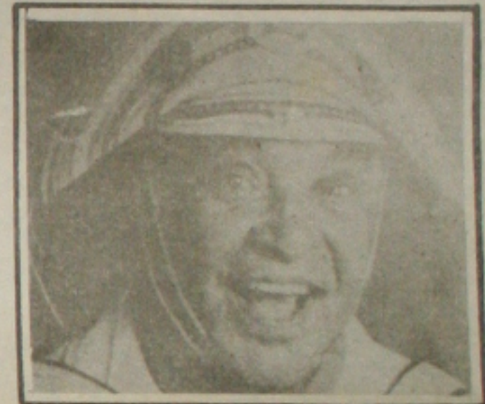
Luiz Gonzaga, o Velho Lua, em cartaz na UFS.

000 Após o show de Lucas os presentes participarão de sorteios e serão animados pela música junina.