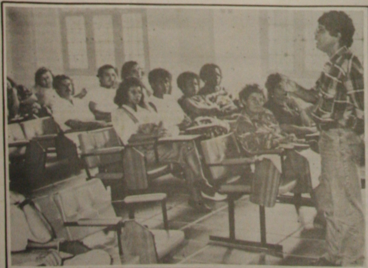
A Secretaria de Saúde do Município treina o pessoal para controlar as endemias.