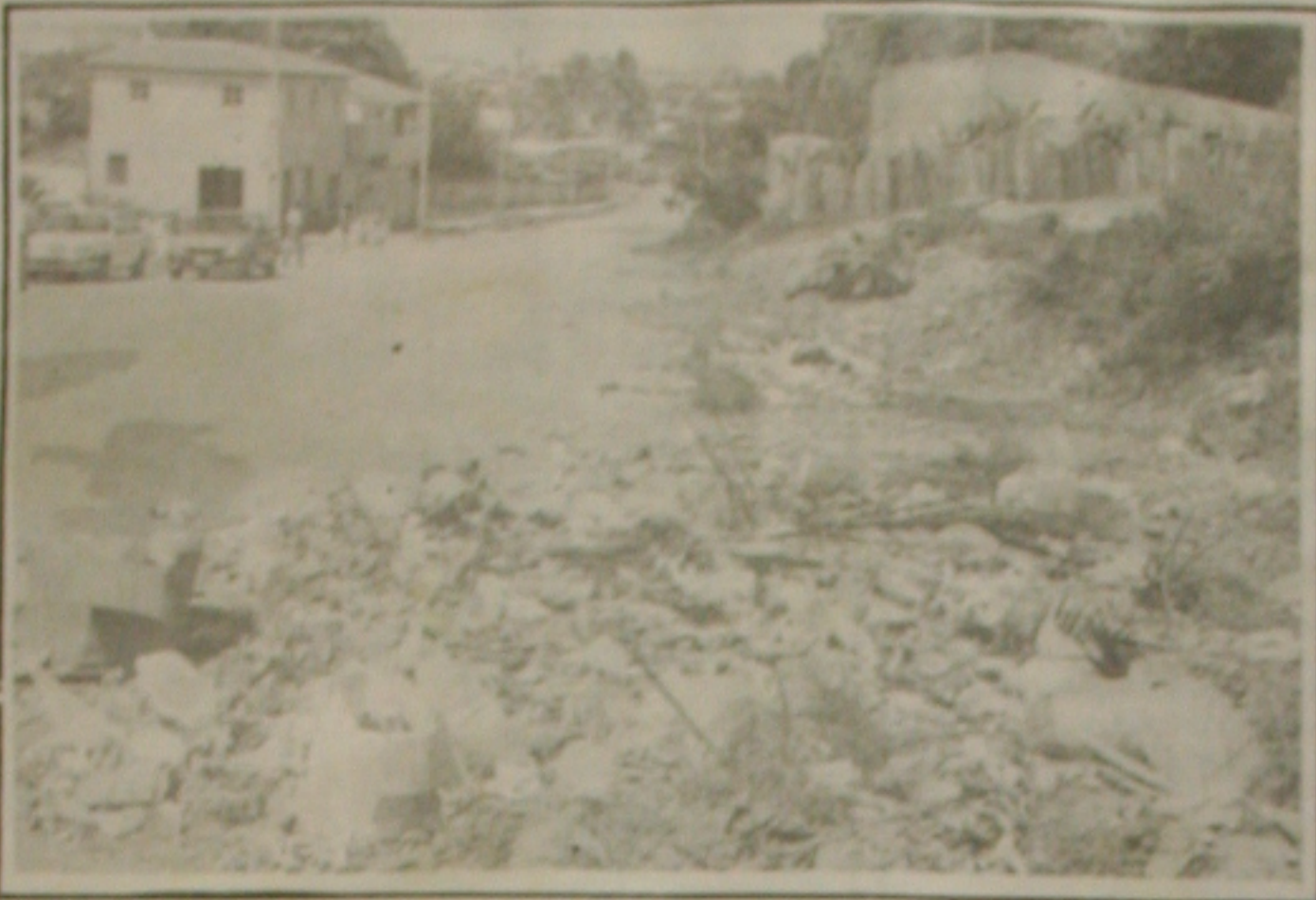
O lixo é o principal hospedeiro dos ratos que transmitem a leptospirose.