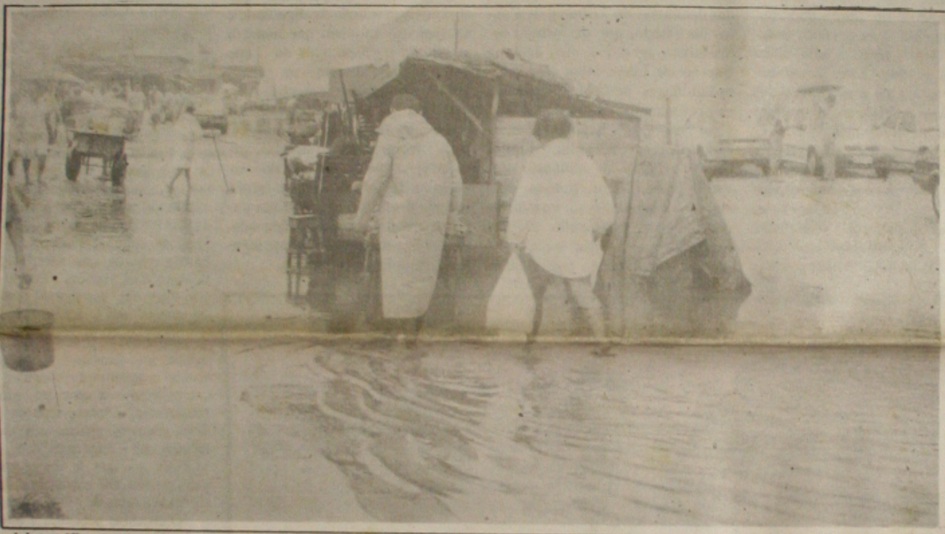
A intensificação das chuvas tem gerado o ambiente propício à proliferação da leptospirose, transmitida pelo rato.

Numa das sessões mais tumultuadas dos últimos tempos, o governo conseguiu impor ontem uma estrondosa vitória, quando a Câmara dos Deputados aprovou, em primeiro turno, a emenda constitucional que quebra o monopólio estatal do petróleo. Foi a sessão também que registrou o maior quorum desde o início das reformas constitucionais, com a presença de 513 parlamentares, dos quais 364 votaram a favor da quebra do monopólio, 141 contra e três se abstiveram. Caso a votação do primeiro turno seja confirmada no segundo, na Câmara, e posteriormente