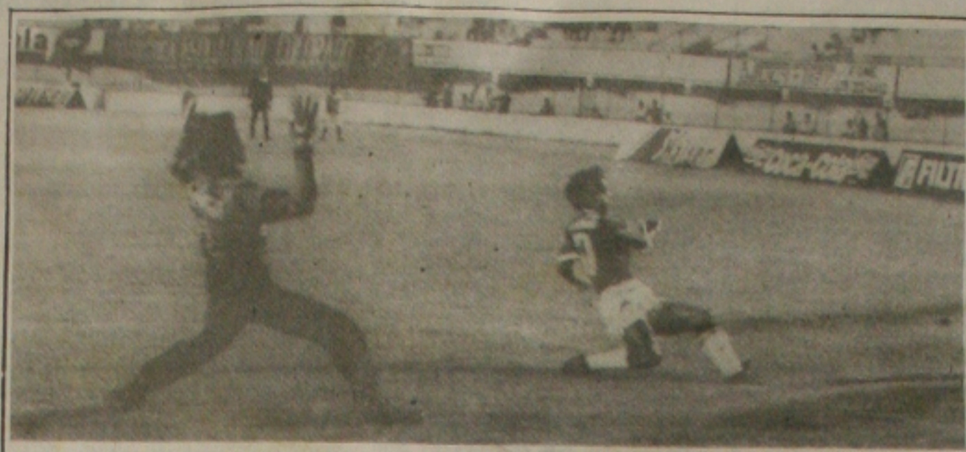
O Sergipe chegou a estar perdendo, mas depois dominou a partida e goleou o Continguba.

agilizem o processo de reforma agrária. A passeata sairá da BR-101 e terá como destino final a Praça Fausto Cardoso, no centro da capital, onde acontecerá o ato público. Os manifestantes pretendem encaminhar um documento ao governador Albano Franco, com as principais reivindicações do movimento. (Página 5A)