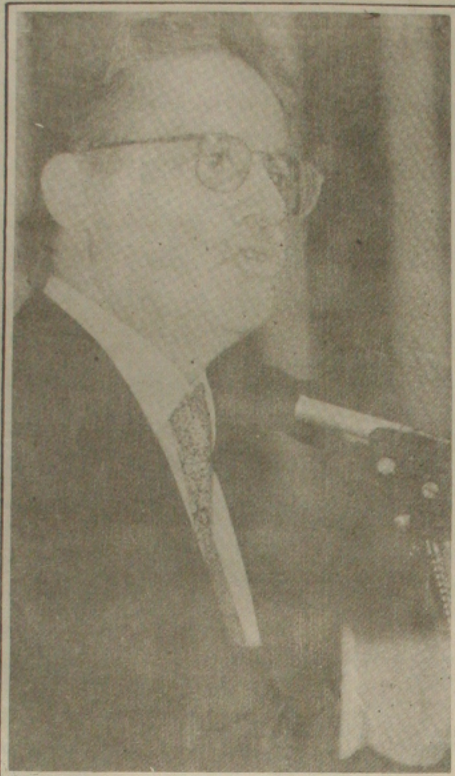
FHC: mínimo será protegido