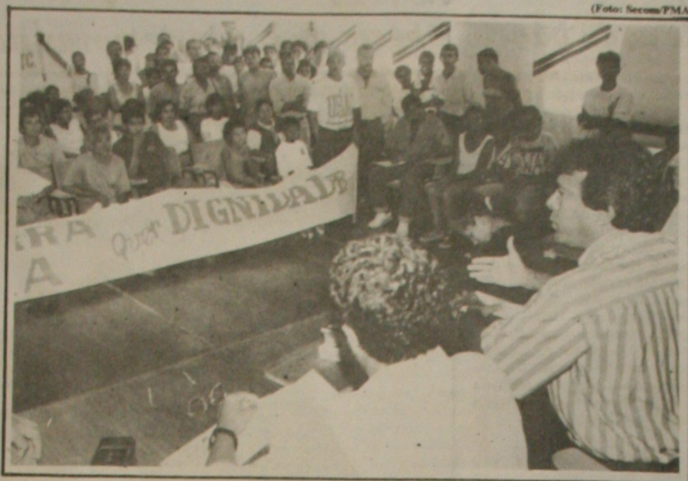
Os moradores da Terra Dura fazem reivindicações ao prefeito Almeida Lima

Ainda com relação à Terra Dura, o prefeito de Aracaju estará com o presidente da Telergipe para solicitar a instalação de "orelhões" públicos na comunidade. "Estas reivindicações surgiram durante as duas reuniões que fizemos na Terra Dura para ouvir os reclamos dos moradores, dentro da estratégia que adotamos de administração participativa onde a população é quem define as obras e serviços que necessitam para melhorar as condições dos bairros em que residem", salientou o prefeito José Almeida Lima.