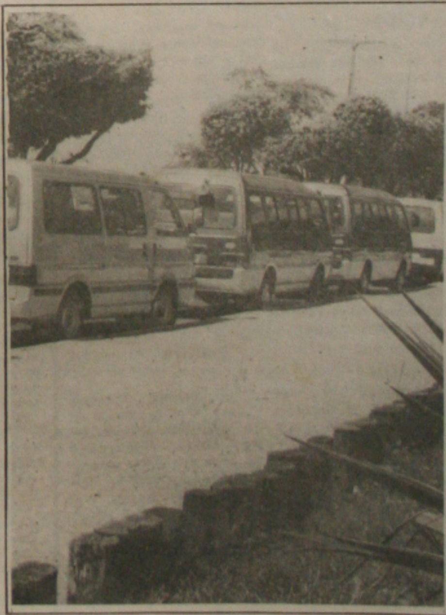
A proibição gerou uma série de protestos dos donos e motoristas das Bestas.

A novela envolvendo o Departamento de Estradas de Rodagem (DER) e os proprietários de veículos utilitários que atualmente estão proibidos de operar o sistema de transporte alternativo de passageiros de Aracaju para o interior e vice-versa está com os dias contados. Começou a tramitar ontem na Assembleia Legislativa, projeto de lei que vai regulamentar o serviço prestado pelas Bestas, Topics e Kombis. Uma emenda vai estabelecer um prazo de 15 dias, após a sanção do projeto pelo governador Albano Franco, para que o DER, que controla o sistema de transporte intermunicipal, cumpra a nova lei. (Página 3A)