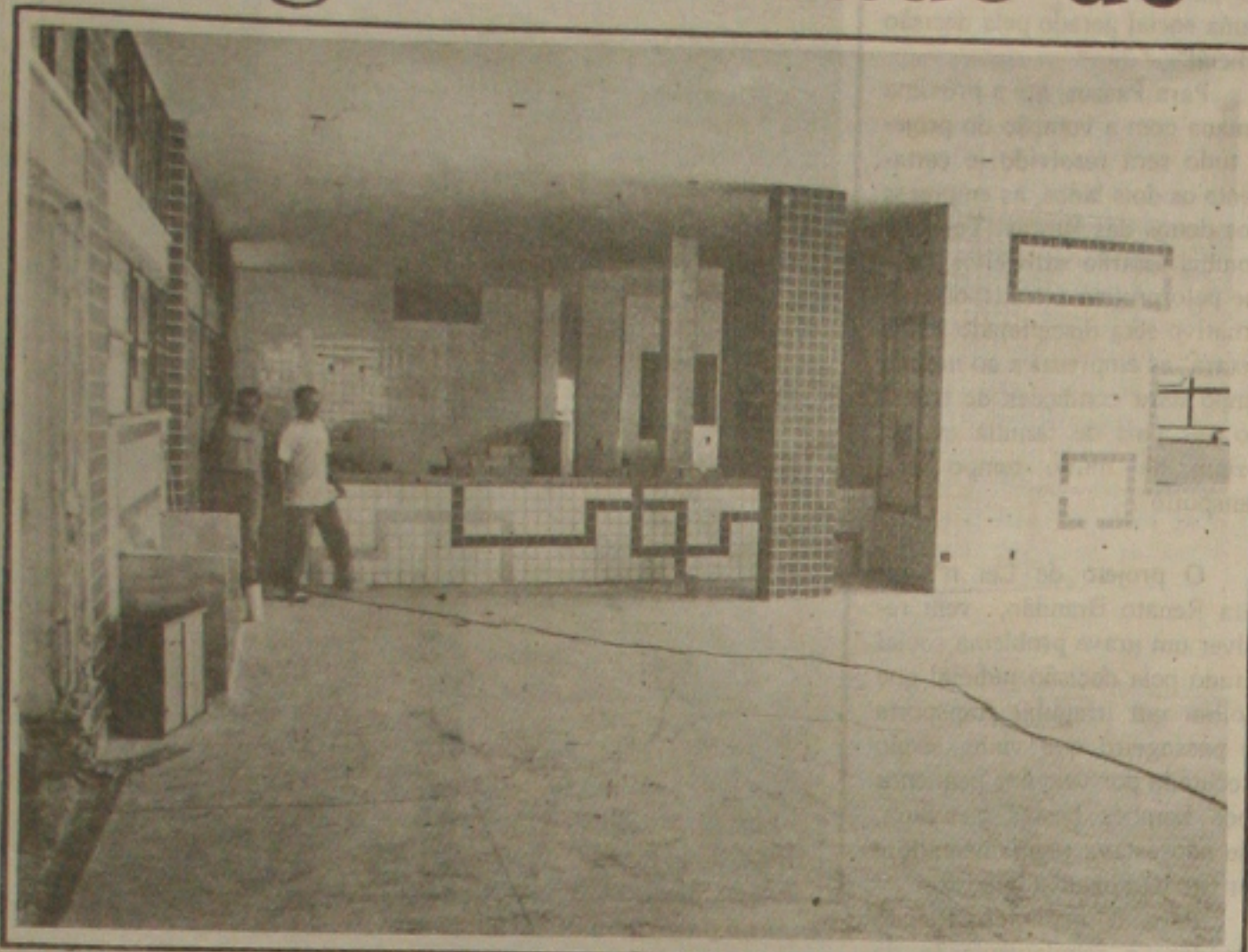
Até o final de agosto, o Serviço Social do Comércio terá um moderno restaurante.