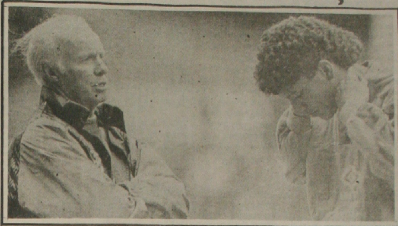
Zagalo conversa com Márcio Santos, que está fora da Copa América.