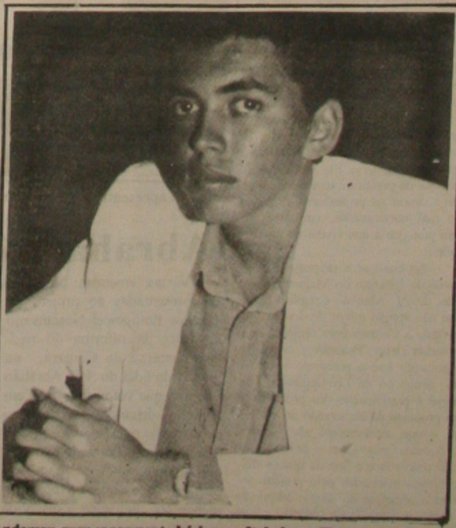
Anderson quer saneamento básico em Itabaiana.

Menezes defende que o parlamentar esteja constantemente acompanhando o problema de sua população.