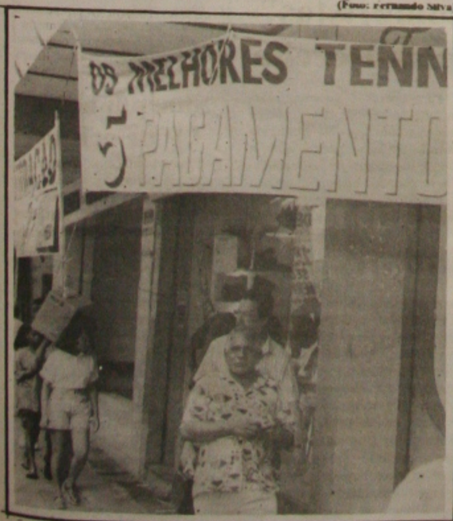
Os lojistas apelam para as promoções em junho

O tema da 47ª Reunião Anual da SBPC será "Ciência e Desenvolvimento Auto Sustentável". As atividades constarão de Conferência, Simposios, Mesas Redondas, Mini Cursos, Sessões de Comunicação Coordenada, além da Exposição para divulgação do potencial nacional na área da C&T.