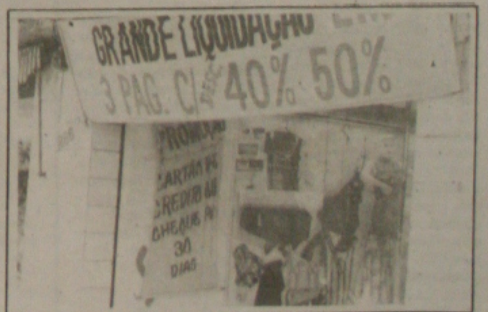
As promoções garantem descontos especiais que chegam a 50%.

Os lojistas da capital estão otimistas quanto ao reaquecimento das vendas nos próximos dias, em função do clima de festejos juninos que já toma conta de toda cidade. Para atrair um número cada vez maior de consumidores, a maioria dos comerciantes está apostando alto nas promoções, que em alguns casos garantem descontos especiais, nas compras à vista, de até 50%. (Página 5A)