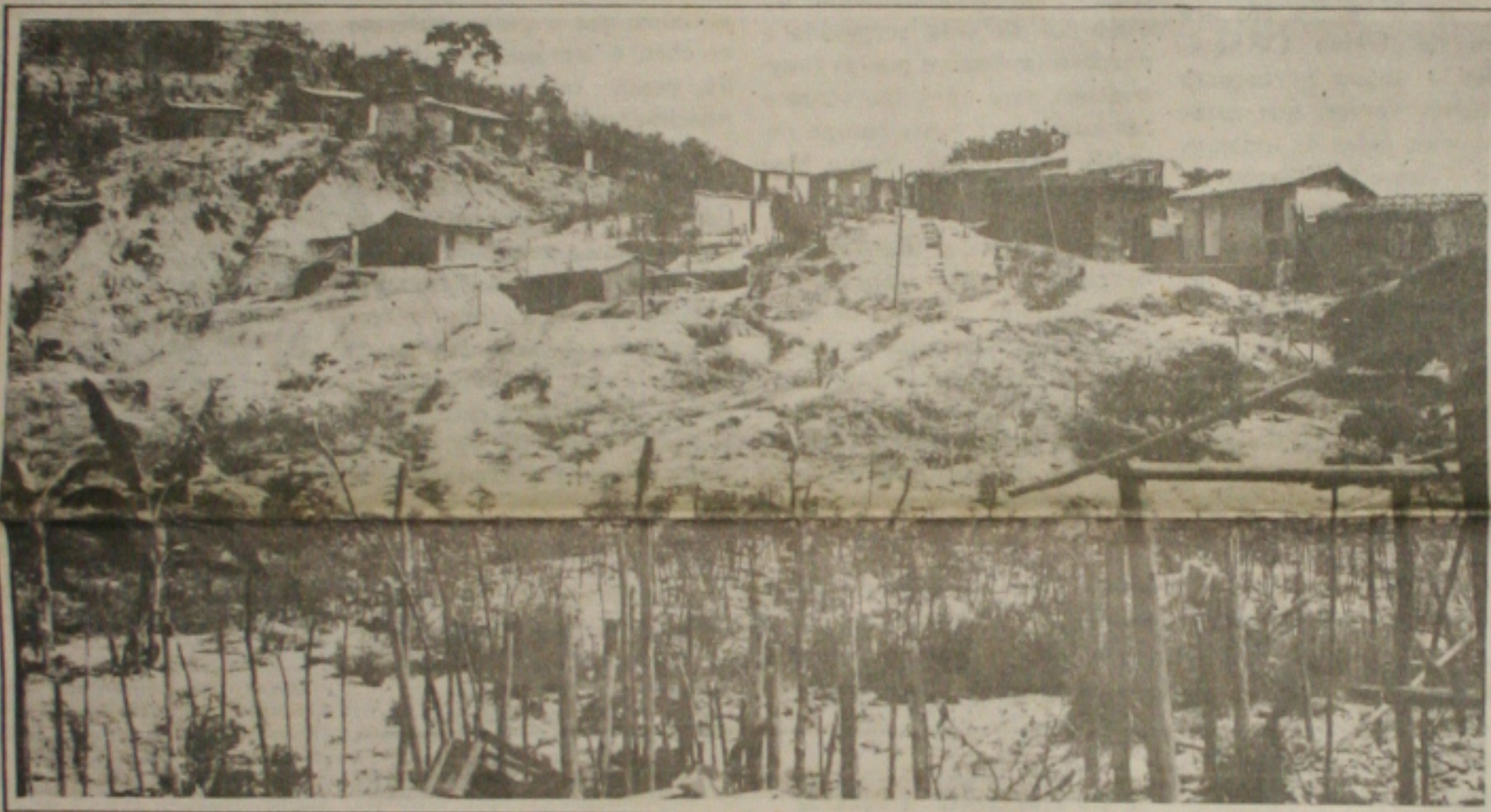
Muitos casbres de taipa e de alvenaria já foram construídos no Morro do Urubu, dando surgimento a uma nova favela em Aracaju.

o parlamentar dispõe de até 1h30 para discutir o projeto. Pelo substitutivo, esse tempo cairá para no máximo 25 minutos. (Página 3A)