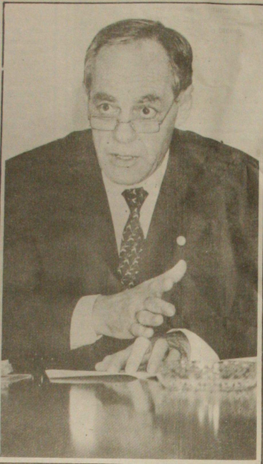
Stephanes: teto para aposentadorias

Segundo ele, entre junho e fevereiro últimos, empregados com carteira assinada, cujos vencimentos são reajustados pela legislação, tiveram crescimento médio nos salários de 10,4%, enquanto isso, no mesmo período, os que não tem carteira assinada tiveram aumento de 23% e os trabalhadores autônomos, de 39%.