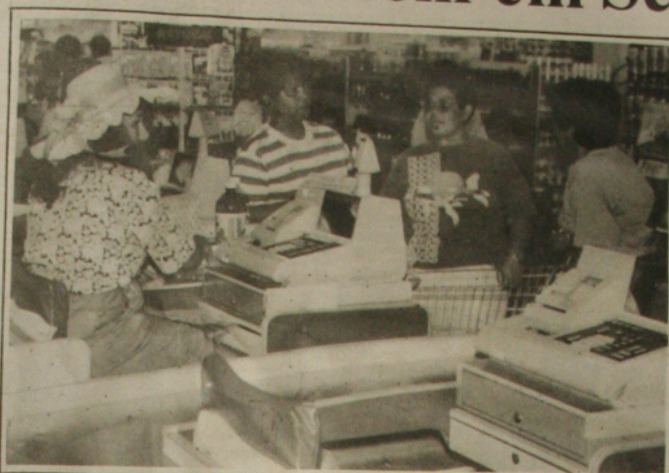
Sunab acha que sergipano gasta menos para comprar mais.

segunda maior fabricante além de fornos industriais e representado com exclusividade no Brasil pela Topema Import. Com 10 modelos elétricos e a gás, os fornos Convothem substituem os tradicionais caldeirões, os fornos, as frigideiras e as chapas quentes, pois assam, cozinhavam e grelham com economia e rapidez diversos produtos, sem a mistura de sabores. Pequenos e médios comerciantes, que ainda dispõem de capital para investir na aquisição de um produto de alta tecnologia, como os fornos Convothem, que custam entre R$ 11 mil e R$ 25 mil, também poderão adquiri-los através de um sistema de locação,