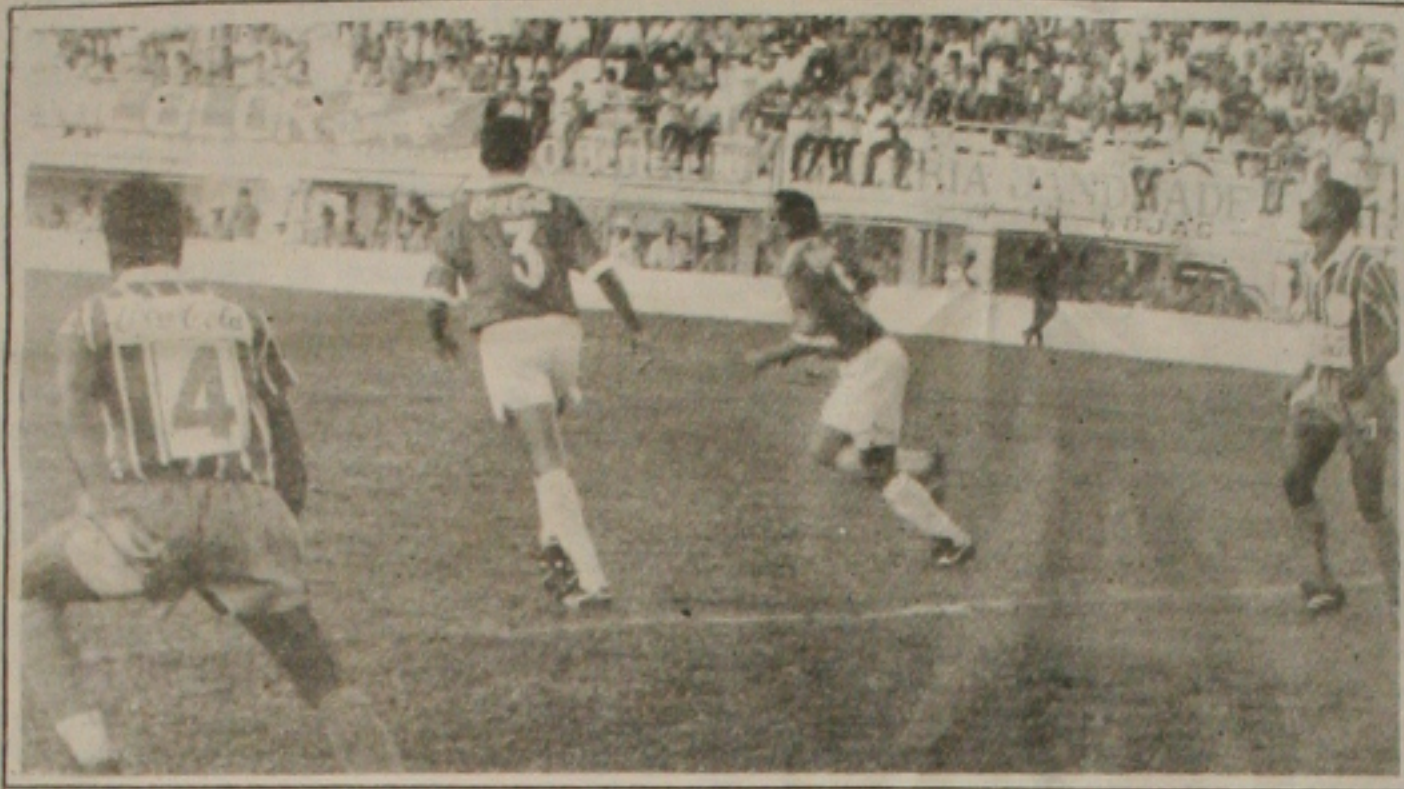
Sergipe e Itabaiana fazem domingo o jogo de decisão do cruzamento olímpico.

Sergipe e Olímpico de Itabaianinha decidem na partida preliminar de domingo no batistão o título de juniores. O juiz dessa partida será Edson de Almeida Santos, auxiliado por Antonio Regis e Afrânio Jorge. Confiança e Guarani na abertura do segundo turno hoje à noite terá como juiz central Willians Dias Souza, auxiliado por Wellington Santos e Antonio da Cruz Santos. Gararu e Olímpico de Itabaianinha jogam Olímpico e São Cristóvão, partida que será dirigida por Jorge Ferreira Santos, auxiliado por Cloves Rabelo Leal e José Carlos Couto.