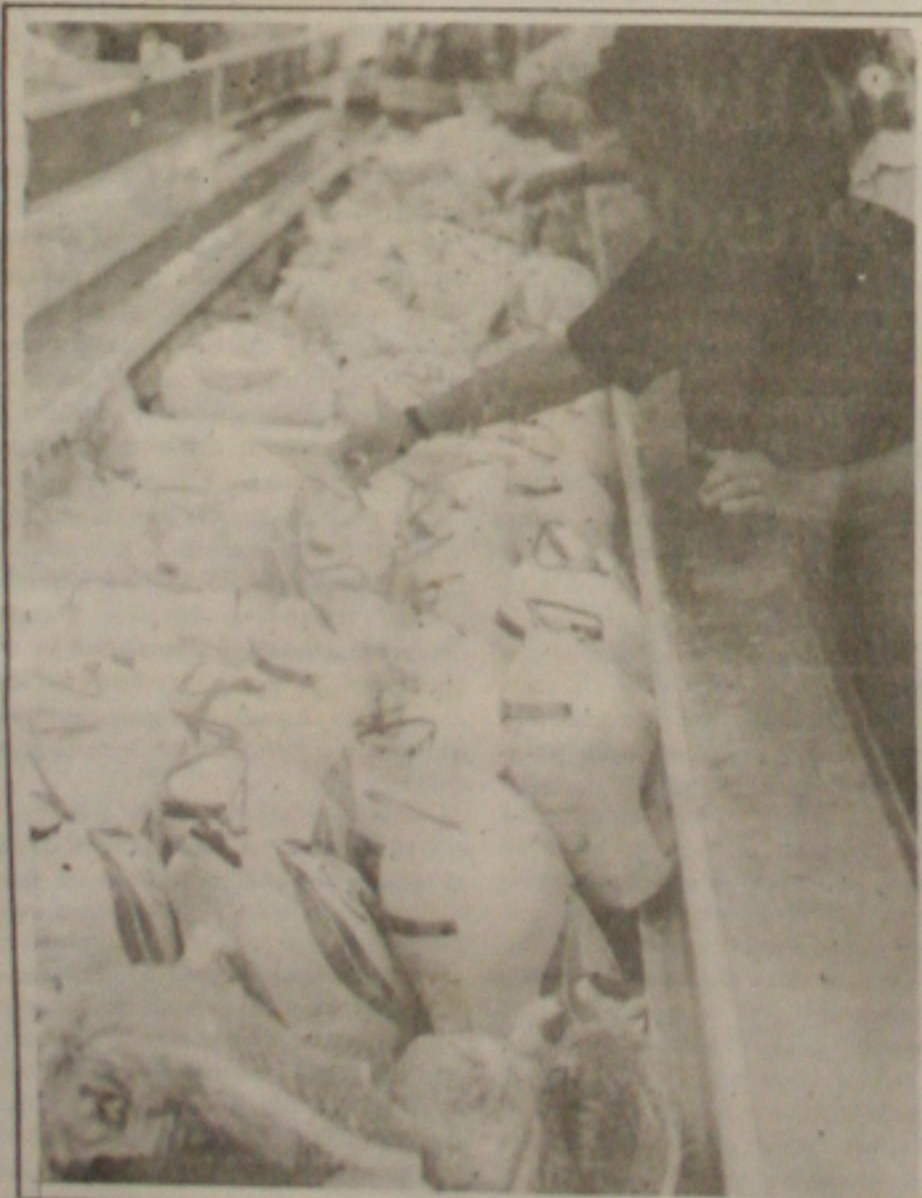
As pesquisas da Sunab têm constatado a queda dos preços