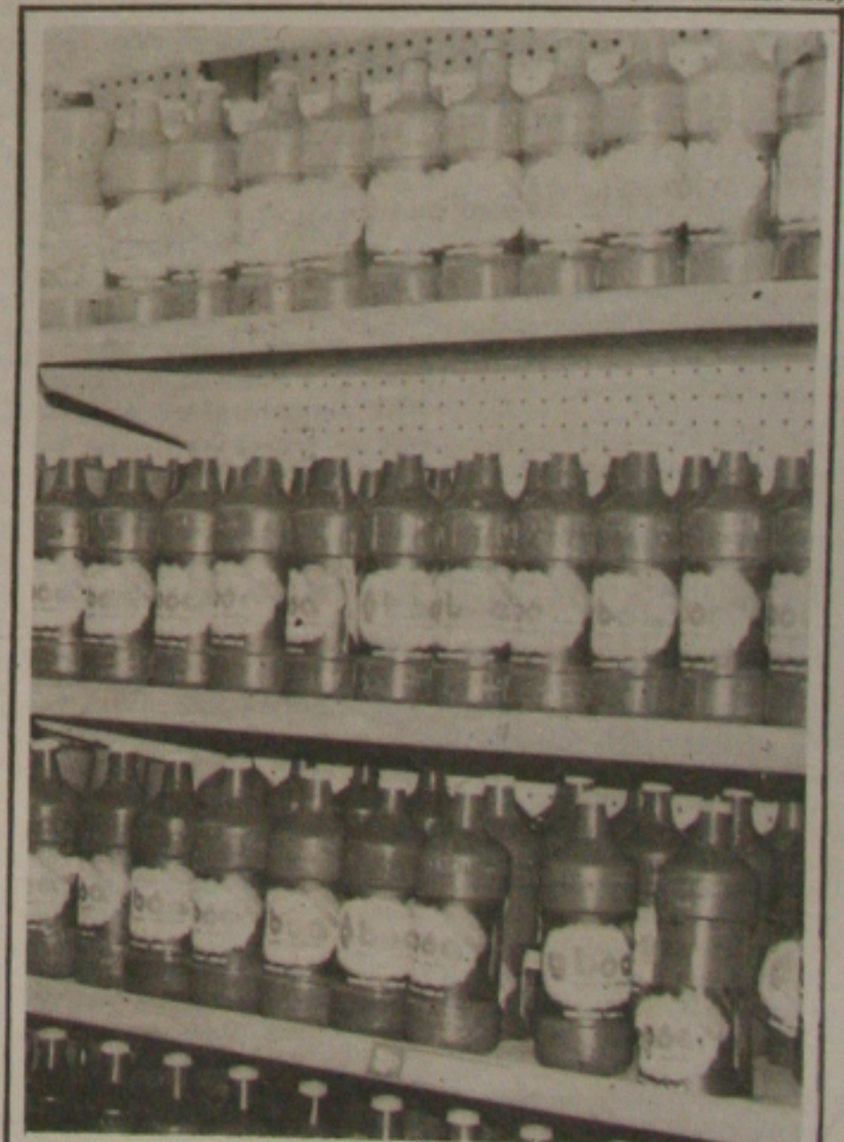
A água sanitária foi encontrada com preços diferenciados