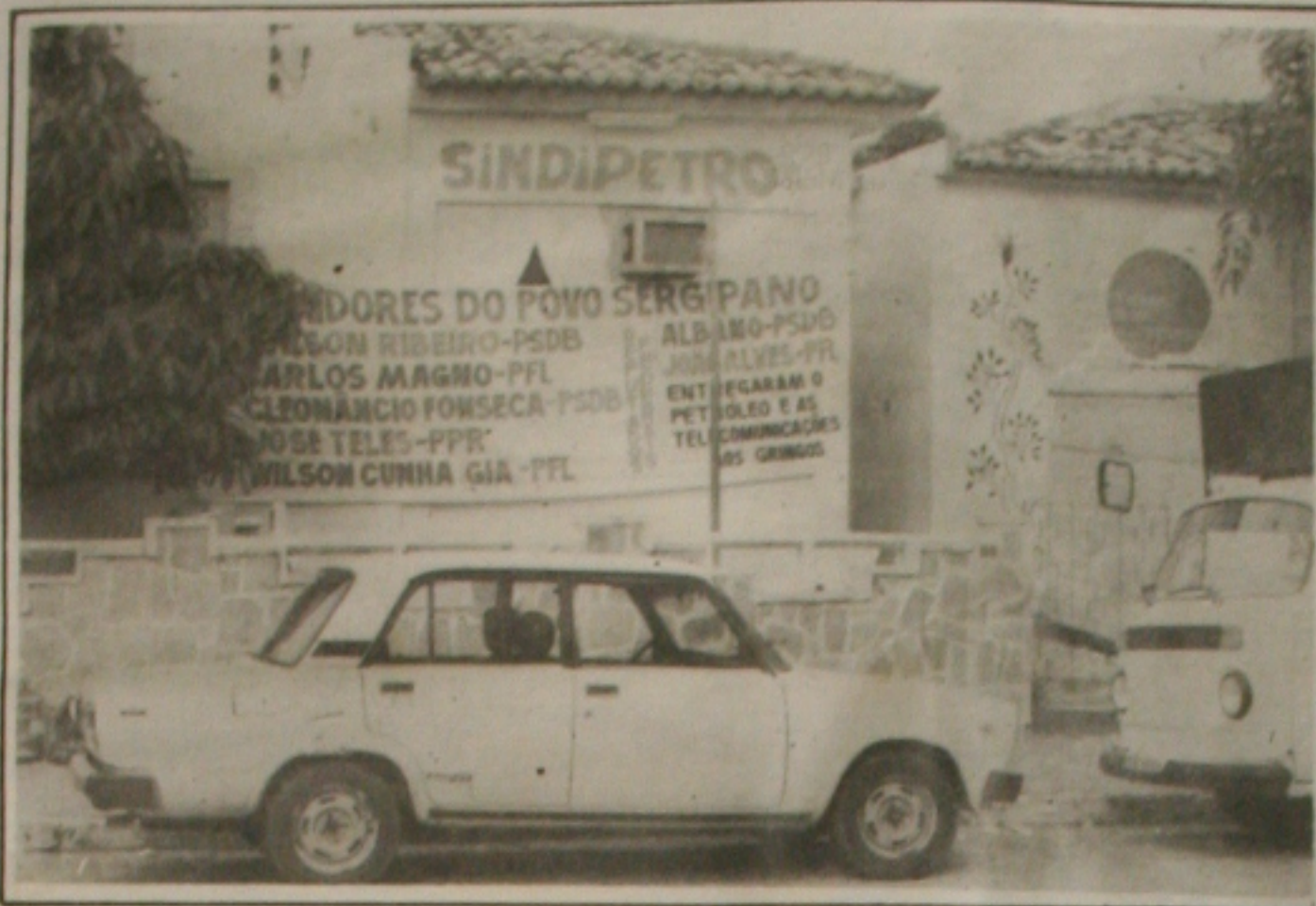
Os petroleiros fizeram vigília para protestar contra a penhora dos bens do Sindipetro