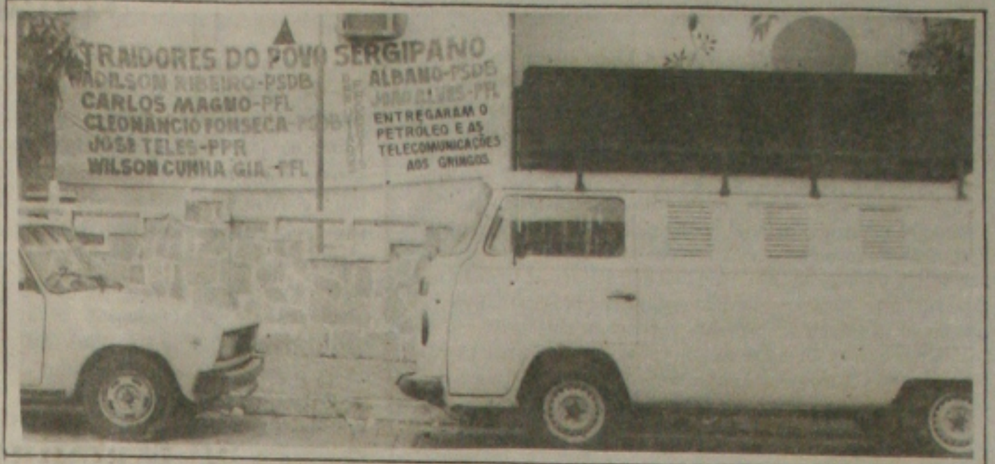
No Sindipetro, os petroleiros sergipanos continuam mobilizados para impedir a penhora dos bens

mas não formalizou o confisco dos bens. Os sindicalistas ameaçam ir as últimas consequências para evitar que a ação se concretize. (Página 5A)