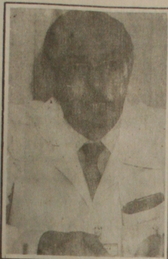
Jatene: falta de recursos