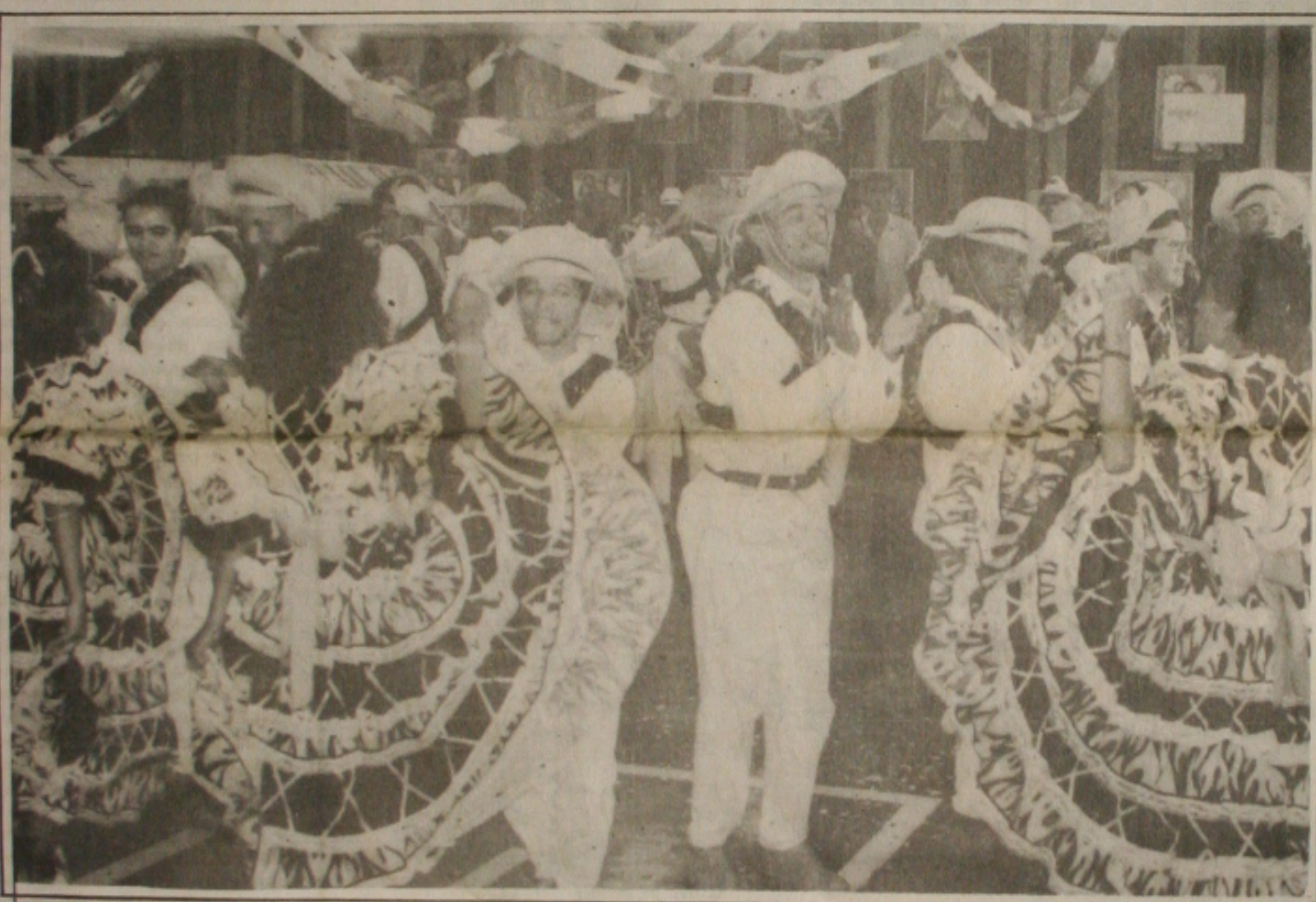
Uma das maiores tradições dos festejos juninos do Estado, os concursos de quadrilhas matutas animam o São João do sergipano.

O porta-voz da Presidência, Sérgio Amaral, disse que Fernando Henrique considera necessária uma demonstração clara da importância do aniversário do Plano Real para a população. O presidente quer uma programação de comemoração com a sociedade, porque esta não é uma festa só do governo, mas de toda a população, informou o embaixador. Fernando Henrique ficará três dias em São Paulo, de sexta-feira (30) até o dia 2 de julho, domingo.