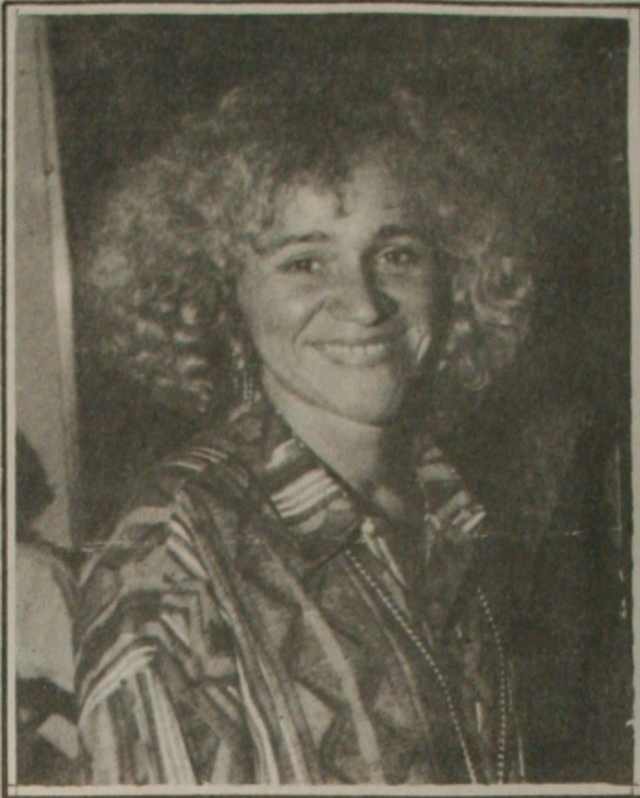
Amorosa é a estrela maior de Sergipe neste período junino.