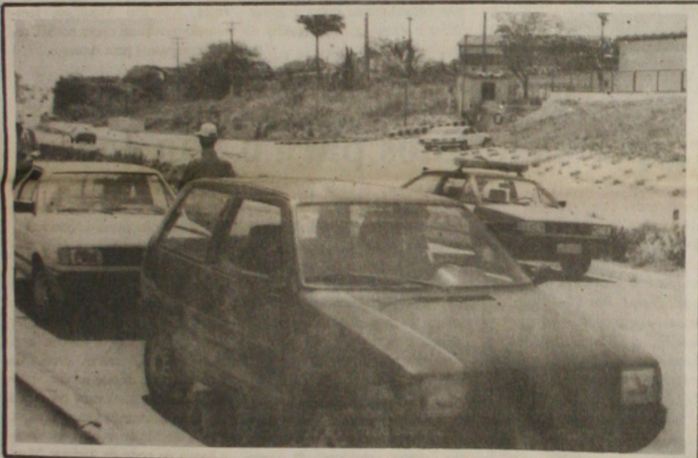
A Polícia Rodoviária Federal inicia a Operação São João para conter os acidentes.