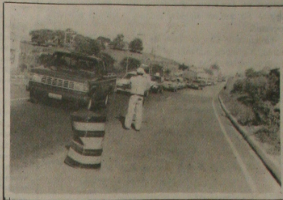
Desde ontem, os patrulheiros estão a postos nas rodovias.

A Polícia Rodoviária Federal (PRF) iniciou ontem, às 18 horas, a Operação São João, com o objetivo de aumentar a fiscalização nas rodovias federais que cortam o Estado durante os festejos juninos, período em que aumenta consideravelmente o movimento nas estradas. A operação mobiliza 110 patrulheiros, espalhados em vários pontos das rodovias. Além de checar as condições de uso e toda a documentação dos veículos, a PRF utiliza bafômetros, para evitar que motoristas dirijam embriagados e assim acabem provocando acidentes. (Página 5A)