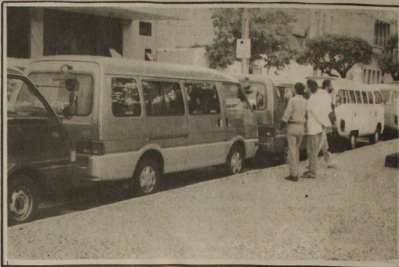
Sem as Bestas no caminho, os empresários agora vão lutar entre si. E nessa guerra todos são sabidos

Contrários a qualquer prática que use dois pesos e duas medidas para solução de problemas semelhantes, os empresários que operam no Sistema Integrado de Transporte de Aracaju (SIT), aproveitando o entendimento administrativo entre o governador Albano Franco, PSDB, e o prefeito Almeida Lima, PDT, e também a decisão da Comissão de Constituição e Justiça da Assembleia Legislativa, que julgou inconstitucional o transporte intermunicipal alternativo com uso de Bestas, Topics e Kombis, querem que o governador determine ao D.E.R. que não mais permita a invasão de ônibus clandestinos no sistema urbano de Aracaju.