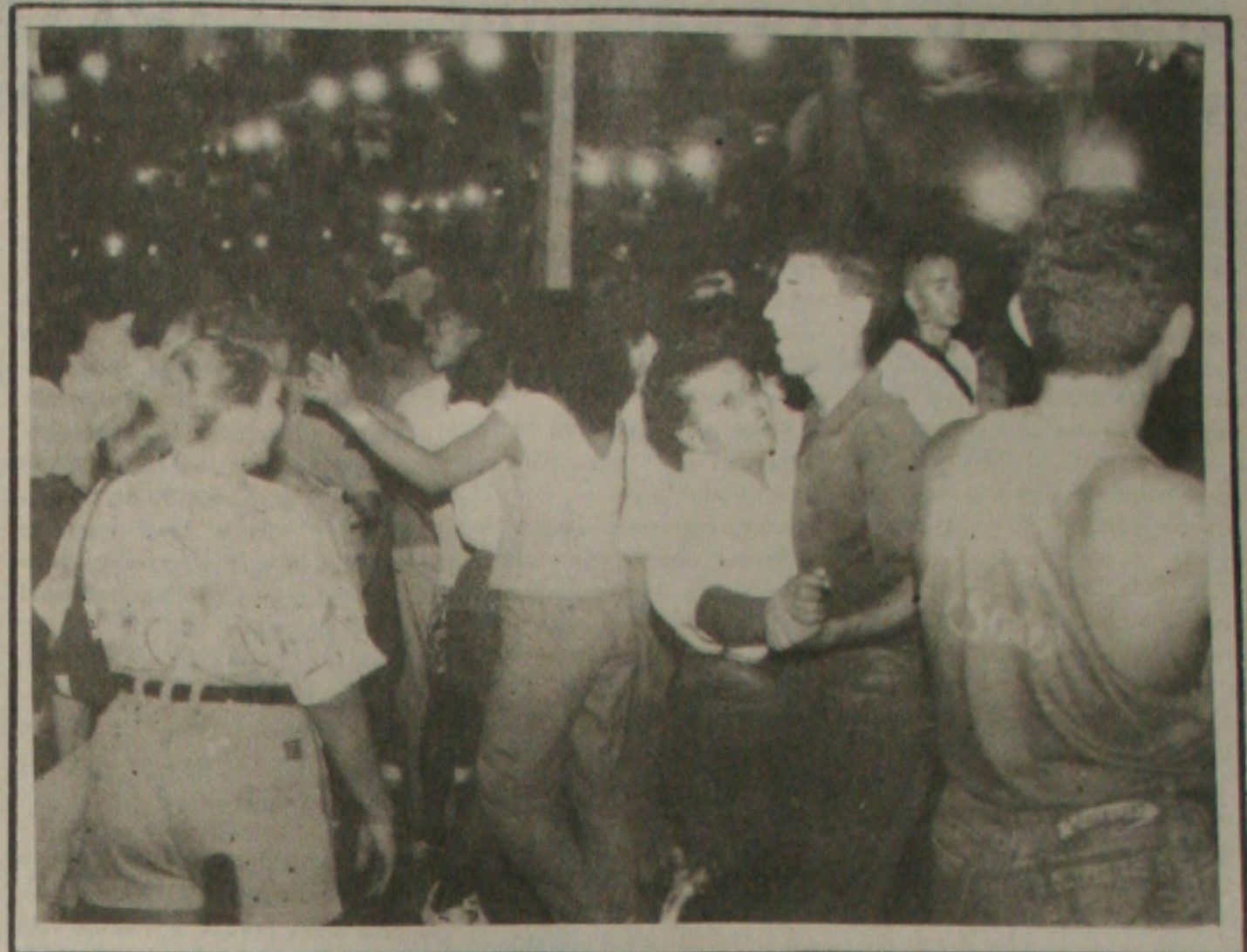
Os festejos juninos de Sergipe reunirão centenas de turistas até a próxima semana.

Como consequência, a rede hoteleira está com um índice de 100% de ocupação neste São João. Há nativos que encontraram uma alternativa de aumentar seus rendimentos nesta época do ano quando se torna difícil a hospedagem. Algumas pessoas alugaram seus apartamentos ou casas por temporada a preços variados.