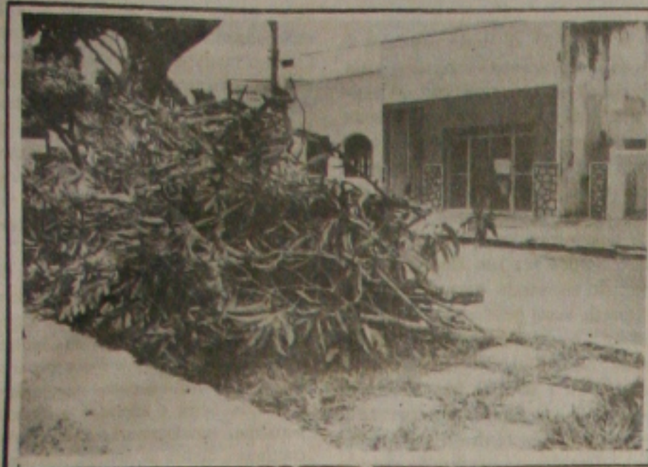
O morador depositou os galhos da árvore no canteiro da avenida.