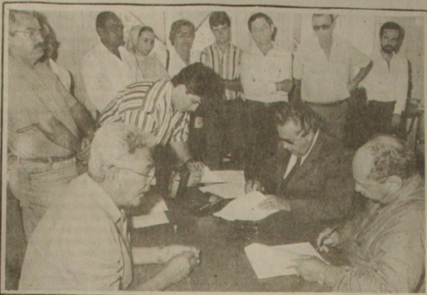
A solenidade de assinatura do contrato para a construção do Núcleo do Senac em Propriá.