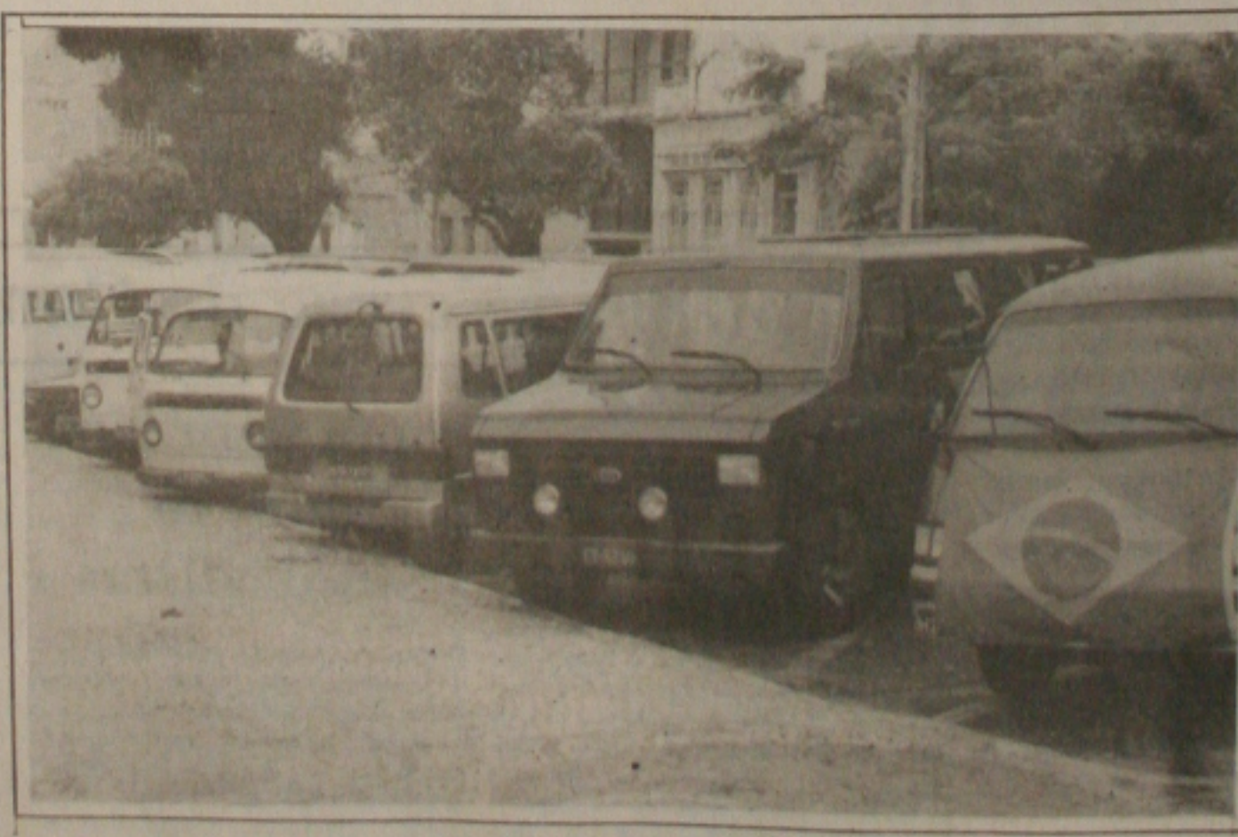
Apesar dos vários protestos, os veículos utilitários continuam proibidos de operar no sistema de transporte alternativo.

aquisição de Bestas, Topics e Kombis e agora não podem ficar na rua da amargura, sem condições inclusive de quitar os débitos que contrairam. O projeto que regulamentava o transporte alternativo foi rejeitado na Comissão de Constituição e Justiça da Assembleia Legislativa por sete votos a dois. (Página 3A)